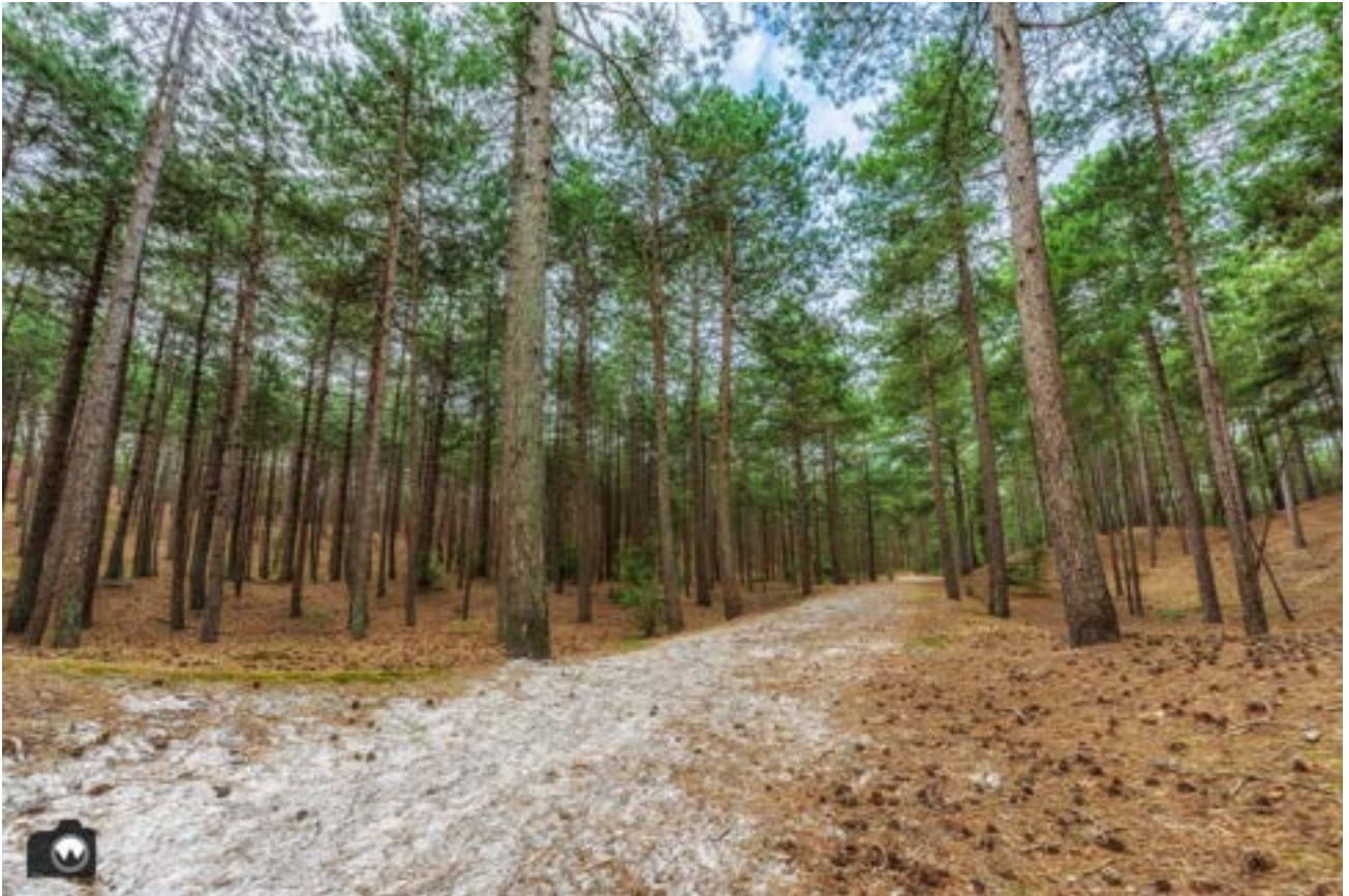
Het dennenbomen bos.

Door de mens is het zand nog meer gaan stuiven. Door overbegrazing, ontbossing en de hoge konijnenstand voor de jacht. Het stoof zo erg dat er geregeld huizen onder het zand verdwenen. Om het zand vast te leggen plantte men helmplanten en later ook bebossing.