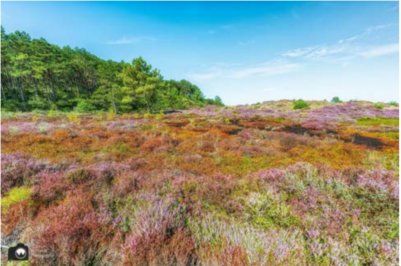
De heide is bruin gekleurd door de nattigheid.

Vooraf heb ik het boswachtersblog gelezen waarin gewaarschuwd wordt voor hoog water op verschillende plekken in de duinen waaronder tussen keuzepunten 23-26-41. Het blog is van februari dus ik dacht dat het hoog water al weggezakt was, maar op een paar plekken kwamen we toch nog blubberige paden tegen. Het is goed te doen, maar trek maar geen witte gypsen aan.