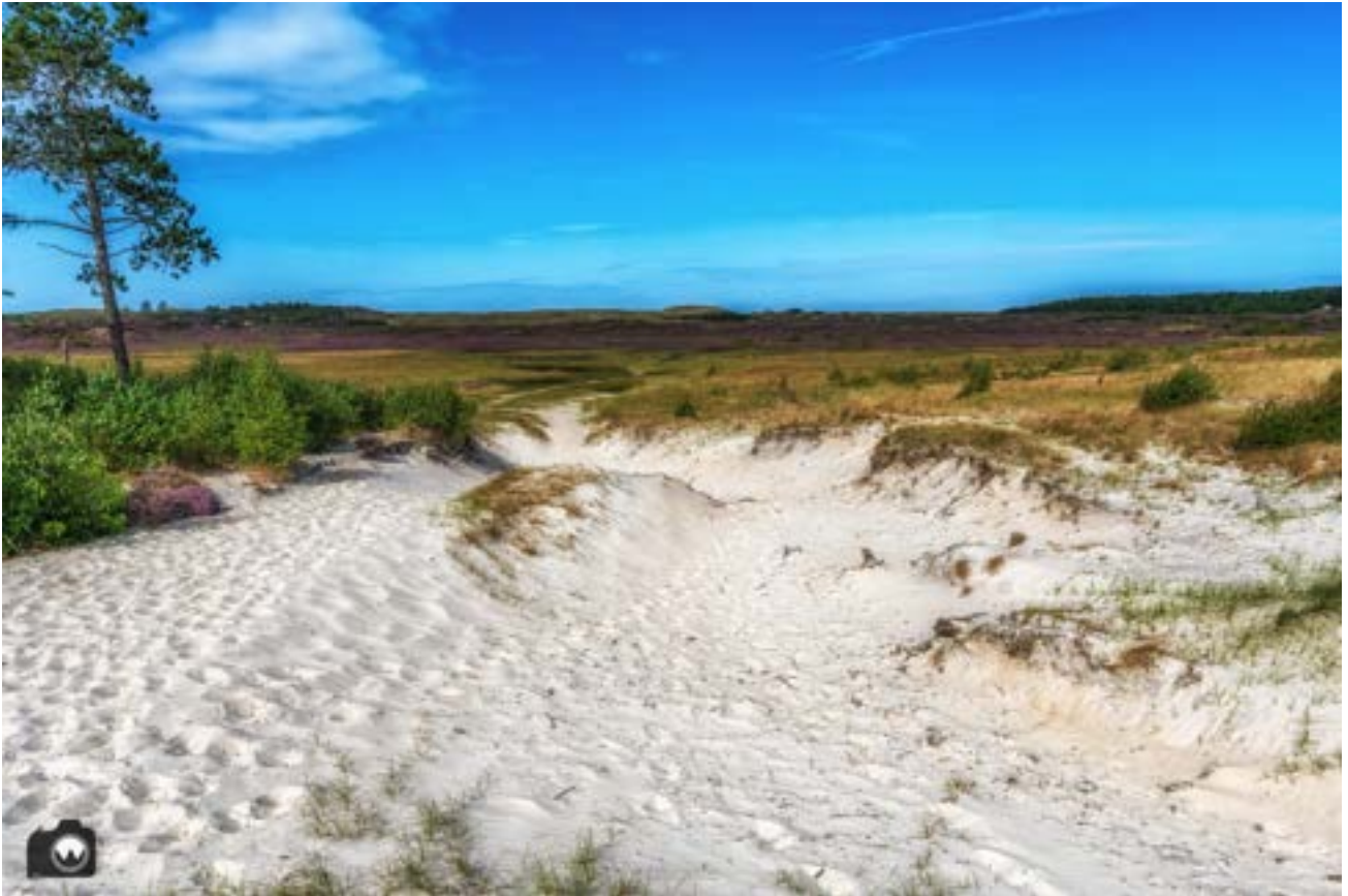
Geen foto van het speelbos. Verderop genieten we van dit uitzicht.

Naast het Speelbos ligt een blotevoetenpad dat geschikt is voor alle leeftijden. Tijdens dit rondje van ongeveer 250 meter loop je door bakken met schelpen, dennenappels, zand, boomschors en nog meer verrassingen. Onderweg wordt jouw evenwicht op de proef gesteld door het balanceren op houten balken.