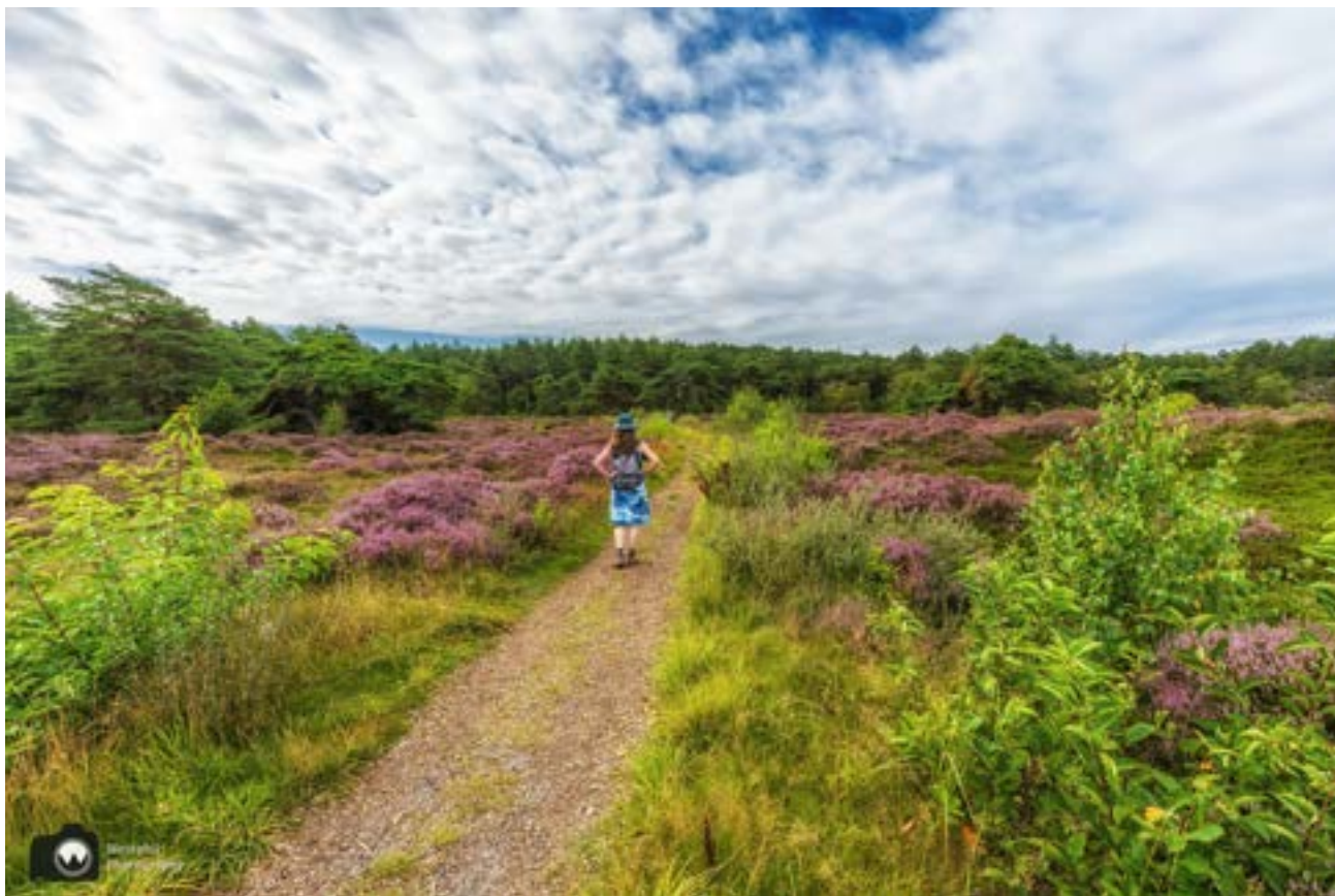
Prachtig heideveld dat we later op de dag tegenkomen.

We parkeren de auto op het ruime parkeerterrein. Het is aan te raden om vroeg te komen om drukte te vermijden. Het is een populair gebied. Vanaf 10 uur is het betaald parkeren.