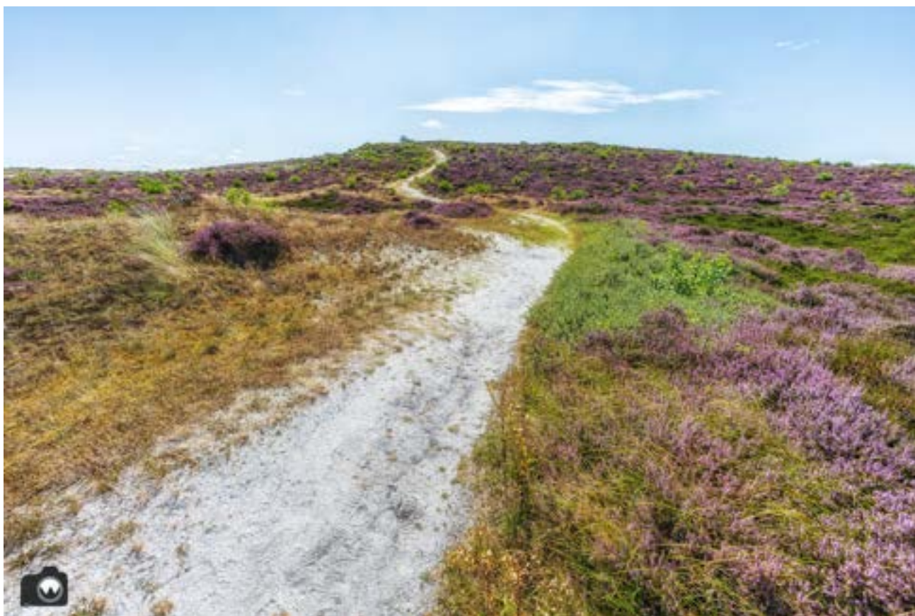
Het pad naar boven naar de uitkijktoren.

We komen uit bij de Zeeweg, waar de paarse pijlen ons het uitkijkpunt de zwarte blink opsturen. Boven op het uitkijkpunt kun je ver kijken. We ontdekken overal kleine meertjes, die we nooit eerder hebben gezien. Is al die regen toch nog ergens goed voor. Verderop grazen er zwarte koeien en overal zien we plukjes heide. Natuurlijk fotograferen en filmen we het uitzicht.