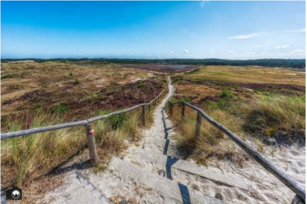
Het uitzicht vanaf de zwarte blink.

De koeien zijn uitgezet in de duinen om te voorkomen dat het duin dichtgroeit met struiken en gras. Als er geen begrazing plaatsvindt, worden de duinen meer eentonig en verdwijnen er langzaam soorten planten en dieren, zoals tapuit, zandhagedis en veel soorten vlinders.