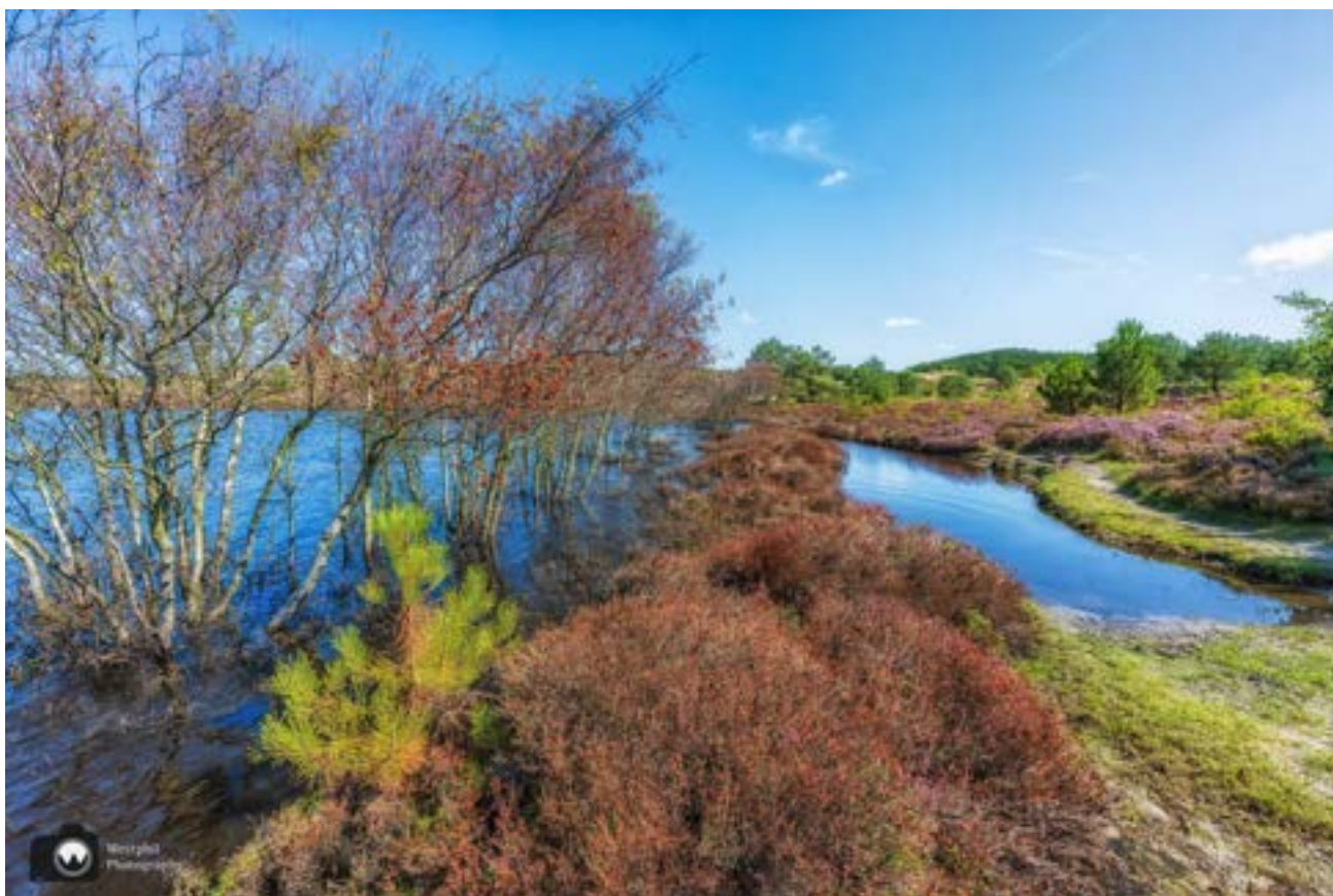
De bomen hebben natte voeten bij het Vogelmeer.

De route start bij wandelkeuzepunt 04 volg de paarse pijlen naar wandelkeuzepunt: 24, 66, 30, 77, 14, 15, 16, 17, 19, 09. Daar hebben wij de route verkort om onder de 10 km te blijven. Bij de kruising tussen de Mariaweg en de Julianalaan gaat de paarse pijl linksaf. Wij zijn daar rechtdoor gegaan en hebben daar de blauwe pijl gevolgd tot aan wandelkeuzepunt: 22. Daar pak je de paarse route weer op van 23 naar 26. De route tussen 26 en 41 bij het Vogelmeer staat onder water. Volg de omleiding die staat aangegeven in de routebeschrijving of klik op het rode driehoekje op de kaart. Vanaf 27 volg je 33, 31 32, 65, 64, 24 en weer terug bij 04.