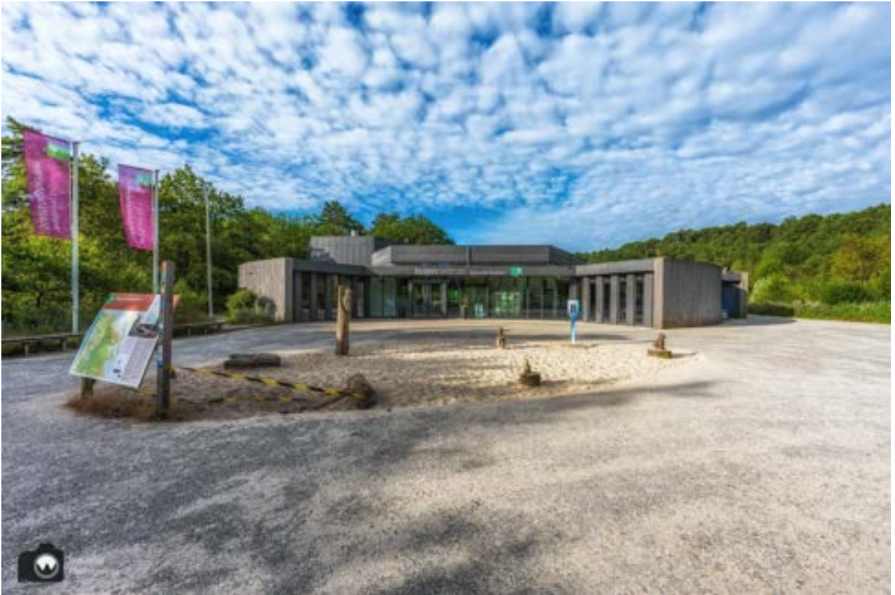
Buitencentrum Schoorlse Duinen.

We wandelen langs het Buitencentrum Schoorlse Duinen dat aan de rand van Nederlands hoogste duingebied ligt. Er starten niet alleen verschillende wandel- en fietsroutes, je kunt er ook terecht voor informatie over het natuurgebied. Verder zijn er tentoonstellingen, een winkel en een restaurant: Brasserie IJgenweis.