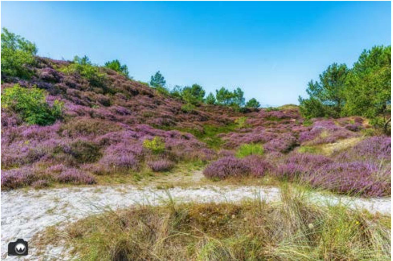
Een heideveldje dichtbij het Vogelmeer.

We steken de Zeeweg over en vervolgen onze wandeling over kleine kronkelige duinpaadjes. In de verte zien we het meertje met de koeien. Ook hier zien we weer heuvels vol heide. We volgen de paarse pijlen naar het Vogelmeer, maar kunnen daar niet verder. Het meer is door al de regen buiten zijn oevers getreden. “Ons” bankje, waarop we al vaker een broodje hebben gegeten, staat in het water.