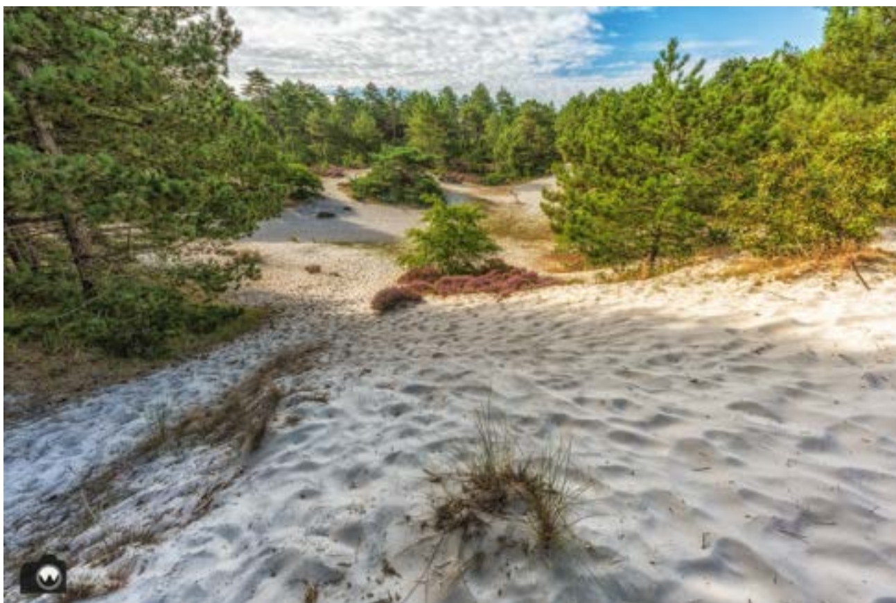
Prachtige combinatie van heide en zand.