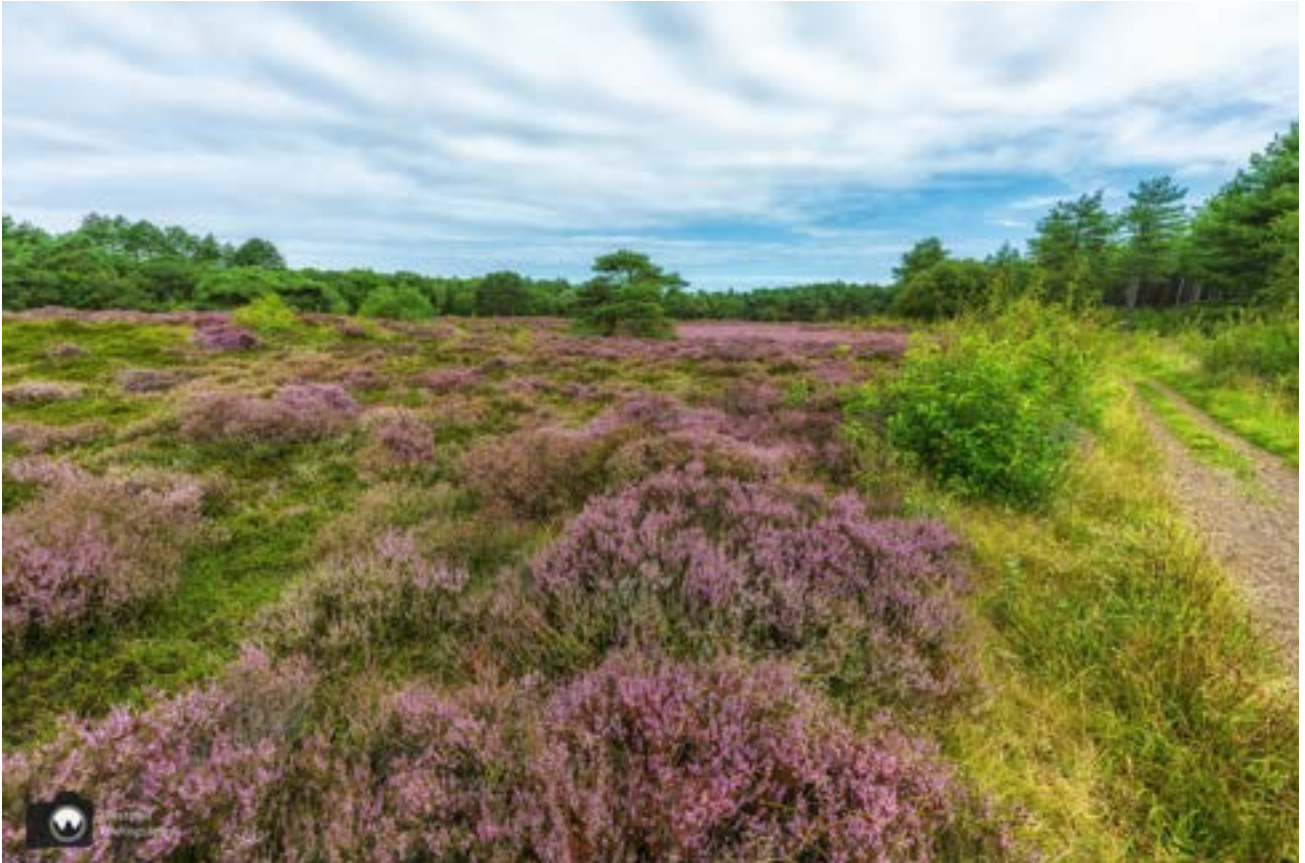
De heide is prachtig in de Schoorlse duinen.

De heide bloeit erg vroeg dit jaar en daarom hebben we het ommetje van september wat vervroegd. Deze wandeling is ook zeker de moeite waard als de heide niet bloeit, maar is nu echt op zijn mooist.