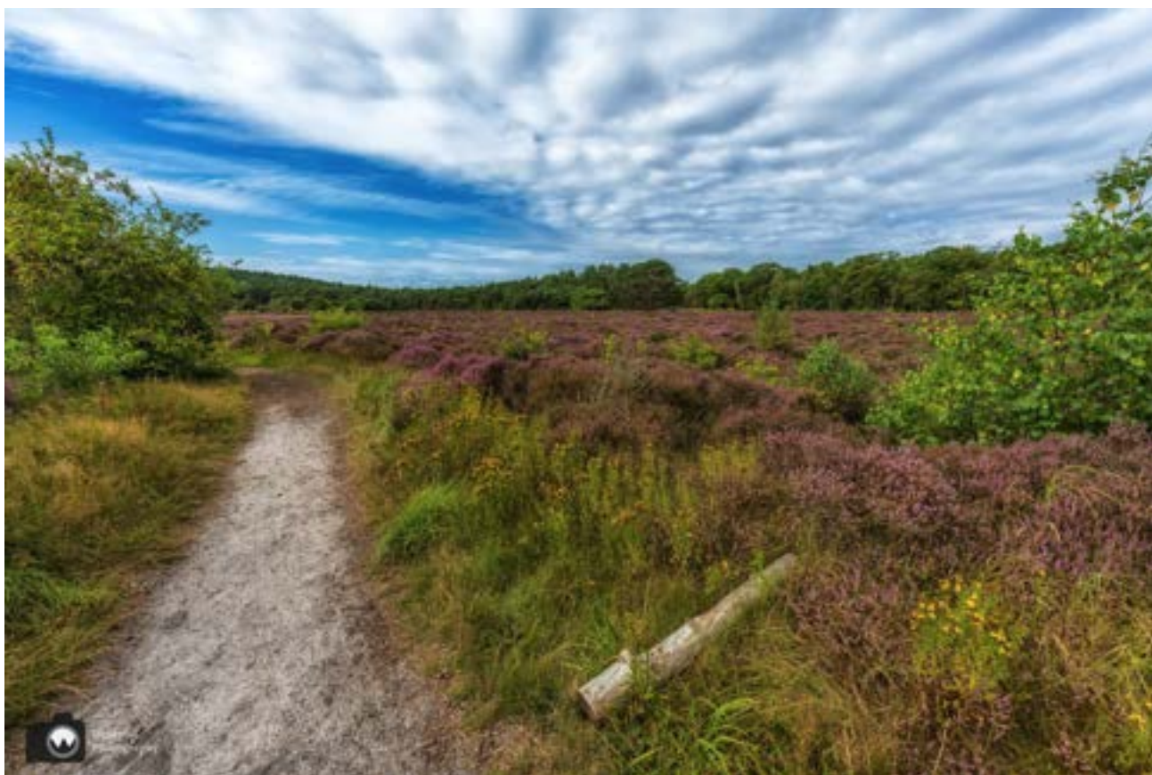
Alvast een voorproefje.