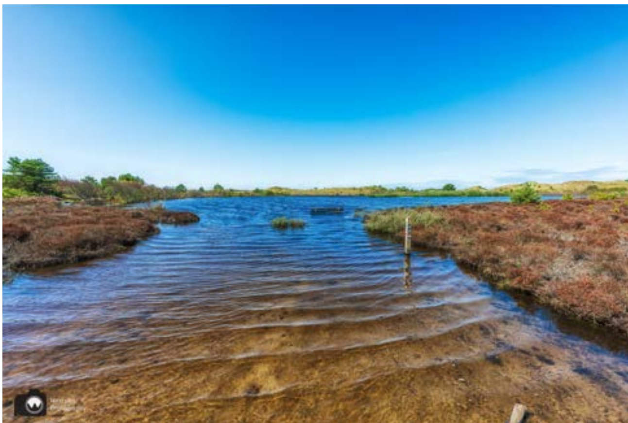
Dit is normaal het wandelpad.

Bij knooppunt 26 kun je de omleiding naar keuzepunt 27 volgen. Zie de omleiding op de foto hieronder. Let op: deze omleiding is niet met bordjes en pijlen aangegeven. Gebruik dus goed de kaart om je weg te vinden. Halverwege de omleiding volg je de groene pijlen in noordelijke richting naar 27.