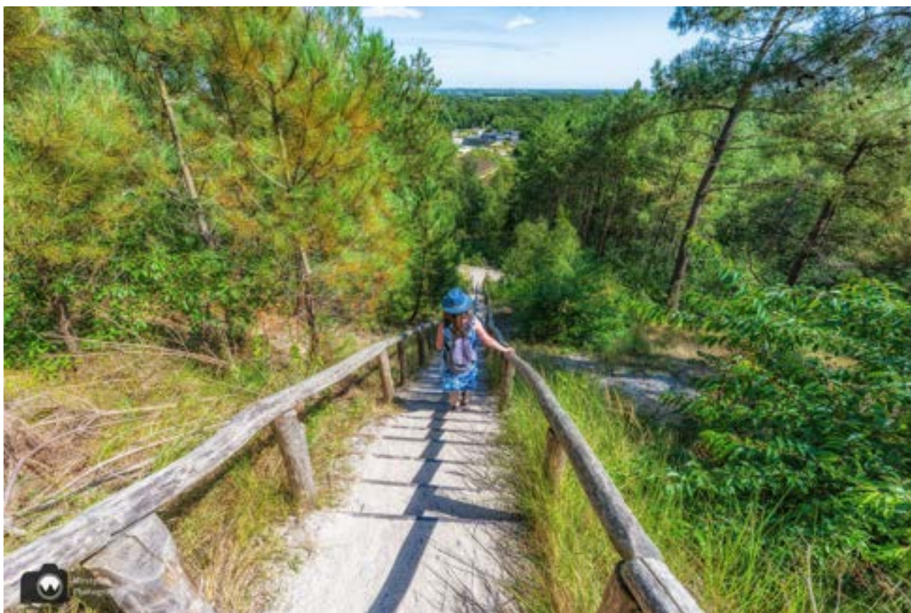
Slim dat we voor het afdalen van de lange trap.

De Rozewerf lag van oorsprong niet aan het water maar in de loop der tijd is een deel van het eiland verzwolgen door de zee. Waaronder een aantal werven.