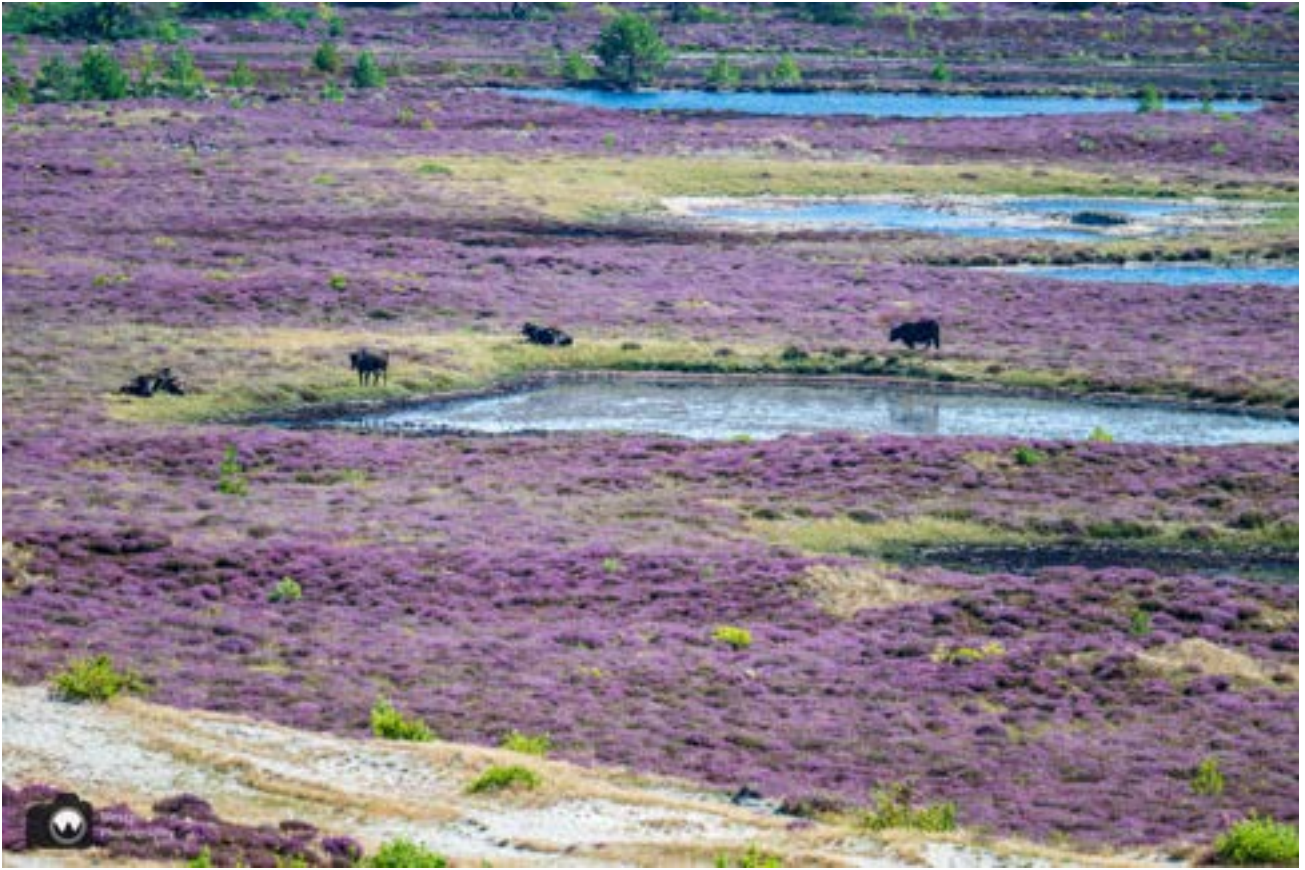
De koeien in de verte.