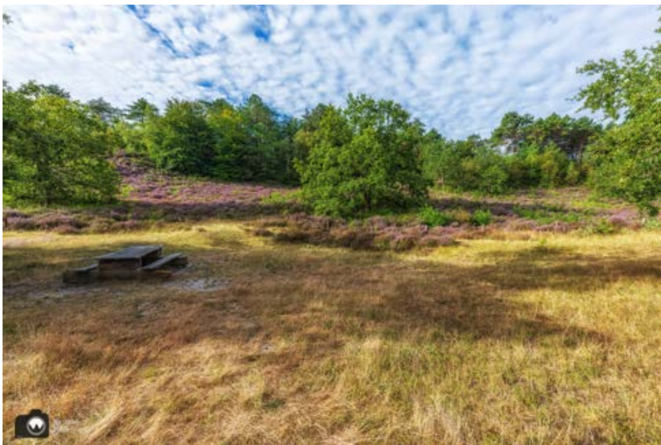
Het eerste heideveldje.