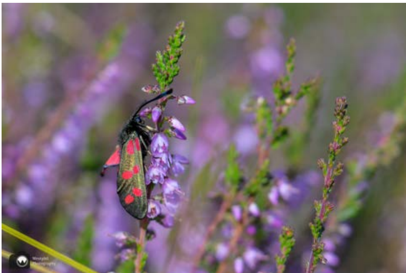
Sint-Jacobsvlinder op een struikje heide.

De rups van de sint-jacobsvlinder wordt zebrarups genoemd. Het voedsel voor de zebrarups, jakobskruiskruid, is voor de meeste dieren een giftige plant. De rups neemt deze op wanneer hij van de plant eet en wordt daardoor zelf giftig. Vogels weten dit en laten de zebrarups daarom met rust. Ze herkennen de rups aan de opvallende tekening en kleur. De vlinder die een jaar later uit de pop tevoorschijn komt draagt het gif nog altijd bij zich en is dus ook giftig.