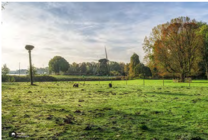
- Alvast een doorkijkje naar de Riekermolens. -

Als we verder gaan, wandelen we langs een klein weiland met koeien en paarden. Daar hebben we zicht op de prachtige Riekermolens. Vervolgens wandelen we door de heemtuin, langs het glazen huis en komen uit bij een indrukwekkend monument.