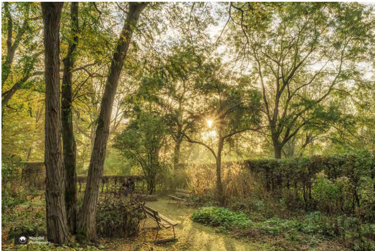
- Een prachtig plekje en allemaal dankzij de Floriade. -

Het Amstelpark maakte in 1972 deel uit van de Floriade. Het was toen de drukst bezochte tuinbouwtentoonstelling ooit ter wereld gehouden.