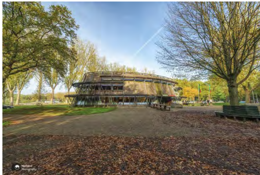
- De Boswinkel, het bezoekerscentrum van het Amsterdamse Bos. -

In het Amsterdamse Bos wandelen we langs de Boswinkel (waar je ook de route kunt