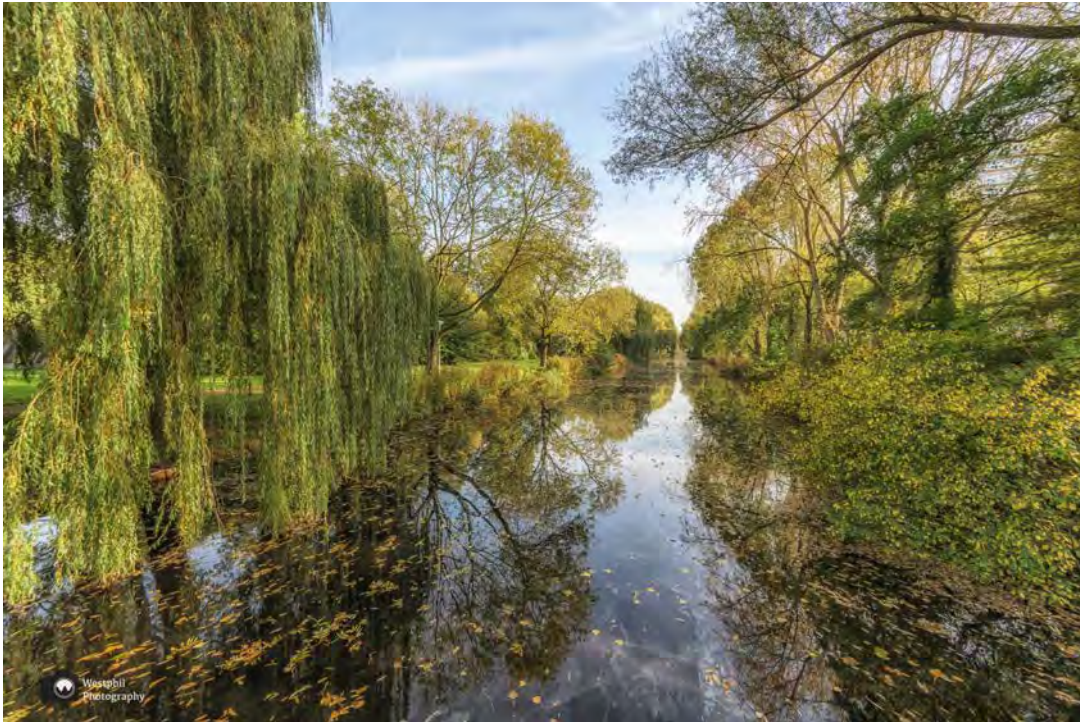
- Nog eentje van het Gijsbrecht van Aemstelpark -