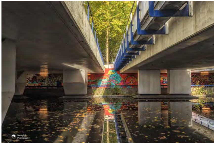
-Tunneltje met Graffiti. -

We wandelen langs kunst en een tunneltje met prachtige graffiti en een fraai aangelegde avontuurlijke speeltuin. Ook ontdekken we een gigantische blauwe regen. Nu weten we het zeker, deze route gaan we ook in het voorjaar lopen.