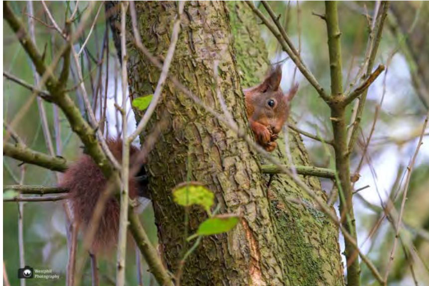
- Zo schattig en leuk om tegen te komen. -

Als we verder gaan, wandelen we langs een klein weiland met koeien en paarden. Daar hebben we zicht op de prachtige Riekermolens. Vervolgens wandelen we door de heemtuin, langs het glazen huis en komen uit bij een indrukwekkend monument.