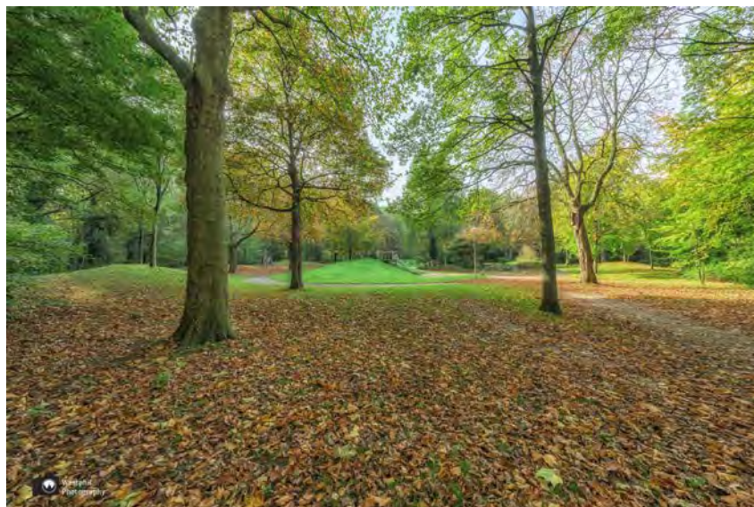
- De speeltuin is mooi aangelegd. -

We wandelen langs kunst en een tunneltje met prachtige graffiti en een fraai aangelegde avontuurlijke speeltuin. Ook ontdekken we een gigantische blauwe regen. Nu weten we het zeker, deze route gaan we ook in het voorjaar lopen.