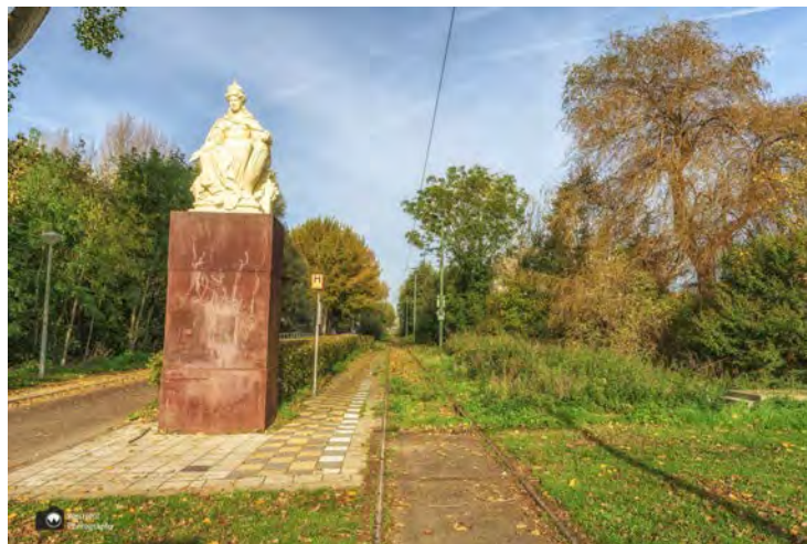
- De Stedenmaagd Amsterdamse Bos naast de museumtramlijn. -

We lopen langs de Museumtramlijn en bedenken ons dat we ook een keer een stukje met zo'n oude tram op pad moeten. We vervolgen onze route langs het water en de groenstroken van het Gijsbrecht van Aemstelpark.