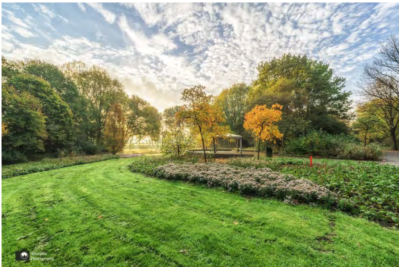
- Ook in november bloeien er nog bloemen. -

We zien op een vlonder een reiger die aan het vissen is. Hij is helemaal niet bang voor ons, want hij blijft gewoon staan en hij pikt zo een visje uit het water.