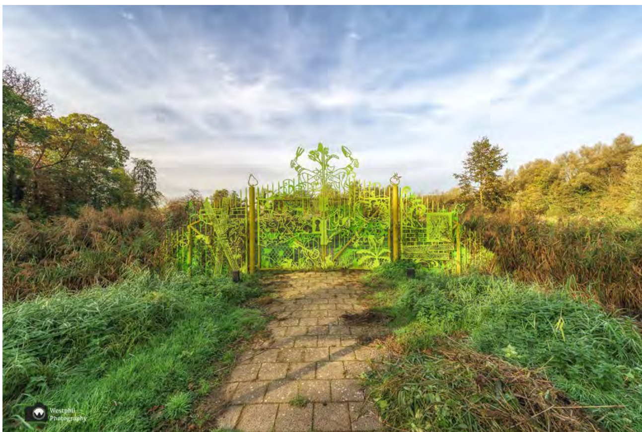
- Ik wil ook zo'n hek! -

Vanaf de tuintjes kun je een stukje afsteken van de route, maar wij wandelen braaf terug langs de weg en slaan rechtsaf langs restaurant Klein Kalfje, de kalfjeslaan in.