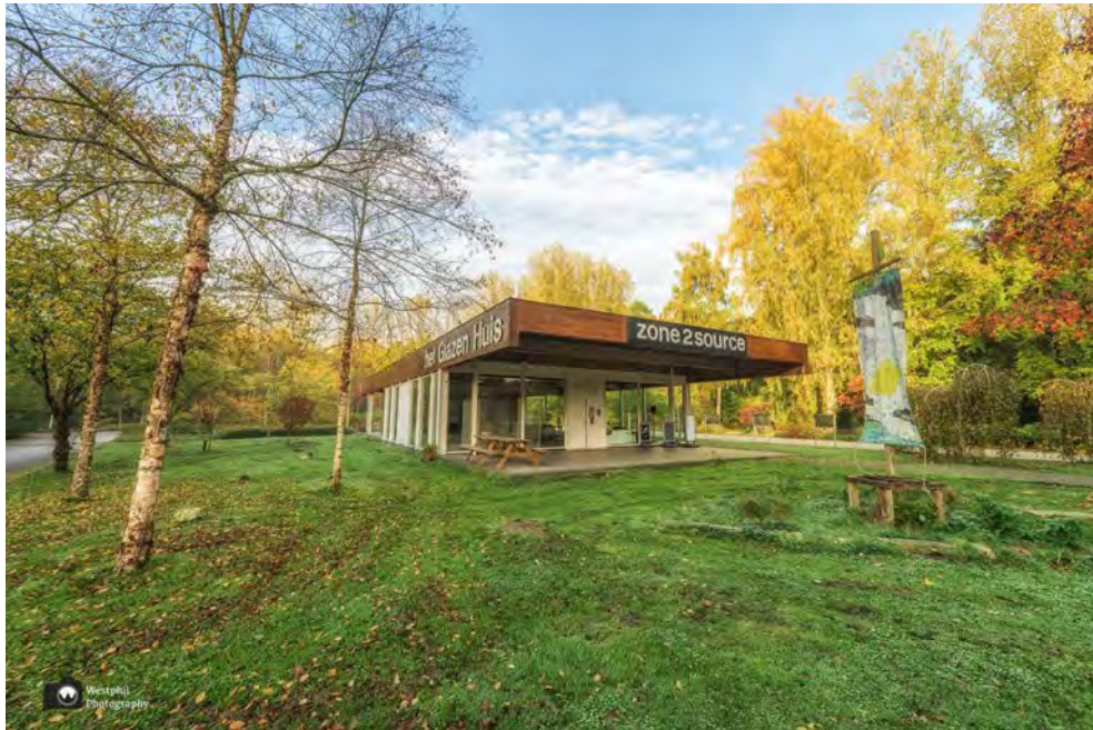
- Het Glazen Huis.-