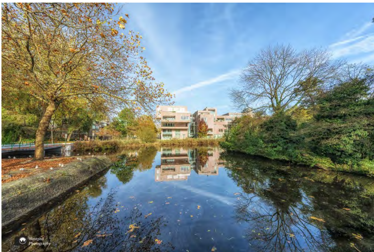
- Een mooie plek om te wonen. -