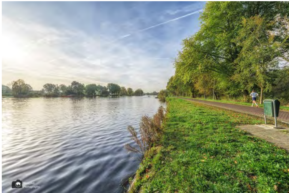
- Langs de Amstel. -

Wat een fantastisch begin van de wandeling, maar er komt nog meer. We komen uit bij de Amstel waar heel veel geroeid wordt. De roeiers worden vanaf de kant gecoacht door mannen en of vrouwen op de fiets.