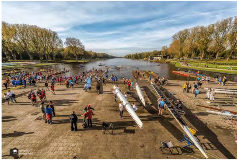
- Erg leuk om naar te kijken. -

starten) en de Bosbaan. Het lijkt wel of iedereen, die kan roeien naar de Bosbaan is gekomen. Zo'n drukte en gezelligheid op de kade en in het water.