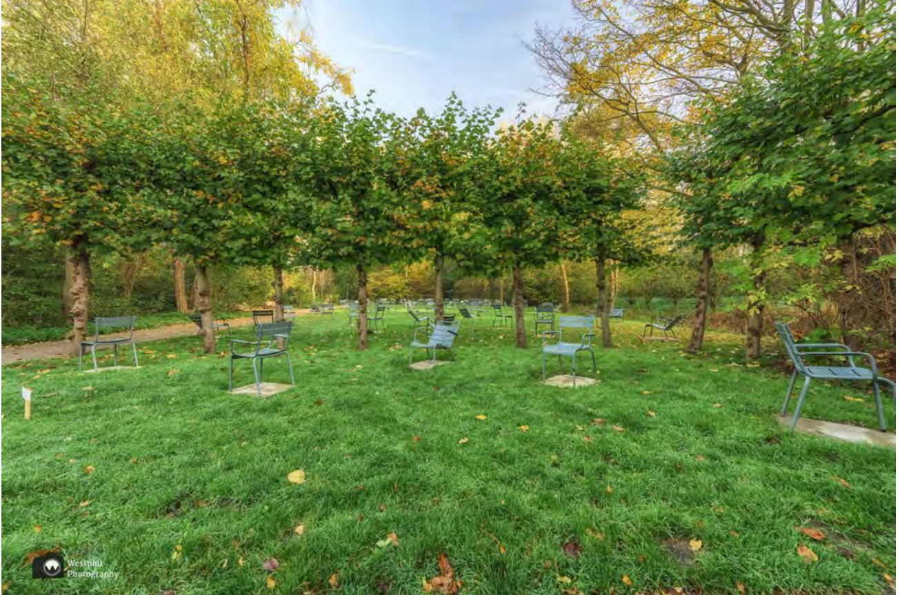
-Monument Rozenoord is erg indrukwekkend. -

slachtoffers die in de laatste maanden van de Tweede Wereldoorlog door de Duitse bezetter bij fusilladeplaats Rozenoord werden terechtgesteld. Alle honderd stoelen rusten op een betonnen steen waarop de naam, geboortedatum en datum van overlijden van één van de slachtoffers staan.