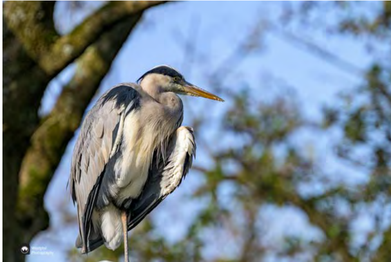
- Een reiger op een lantaampaal is altijd een leuk gezicht. -

Aan het einde van de groenstrook volgen we de groene pijlen over een bruggetje. We lopen nu langs de rand van Amstelveen richting het Amsterdamse Bos, waar we vorig jaar ook al zo'n leuk ommetje liepen.