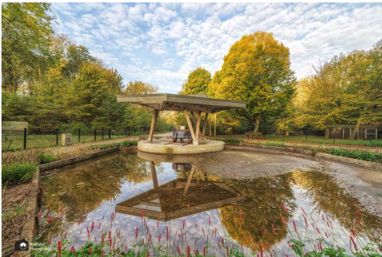
- De piano is goed ingepakt zodat hij niet nat wordt. -