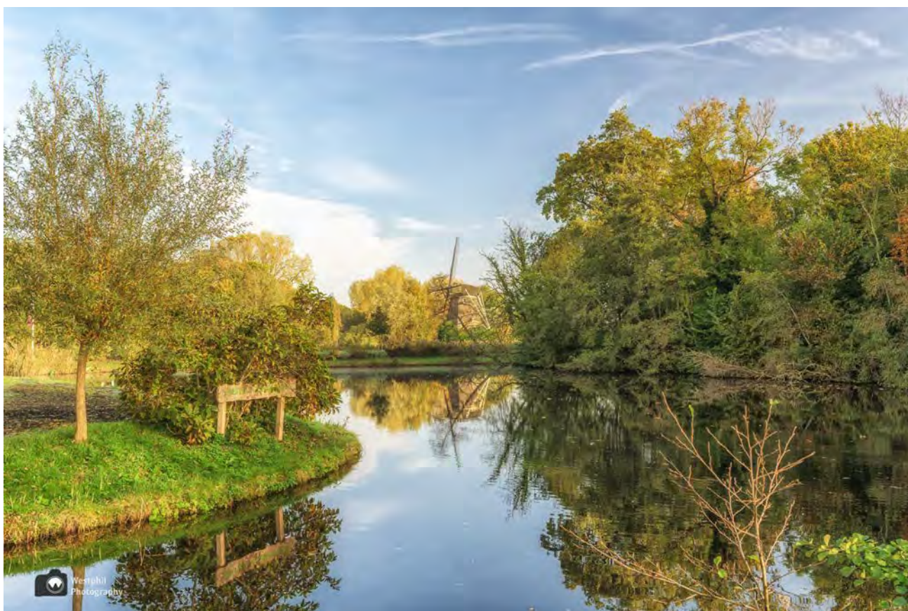
- Nogmaals de Riekmolen. -