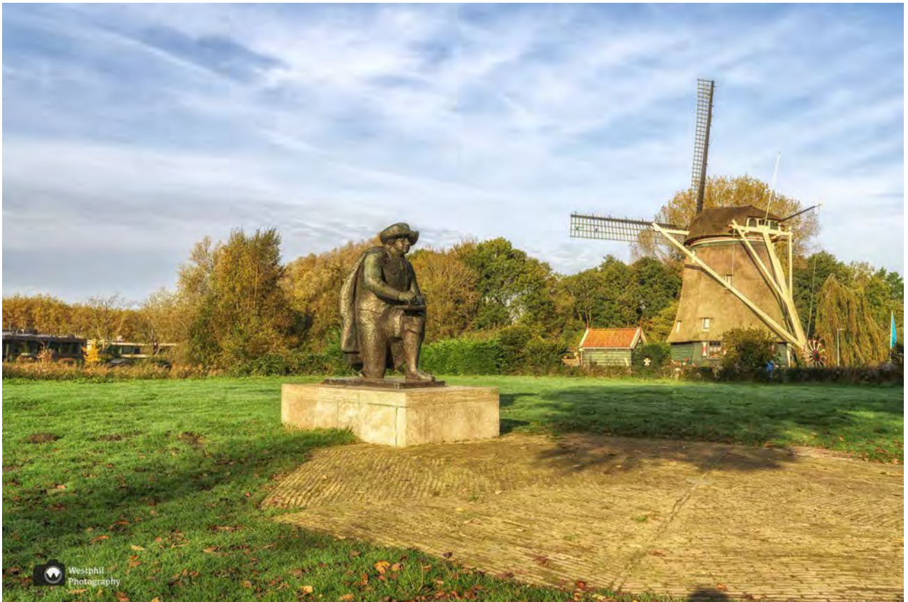
- Het standbeeld van Rembrandt, als herinnering aan het feit dat de schilder veel tekeningen heeft gemaakt langs de oevers van de Amstel. -

Na een klein stukje lopen komen we uit bij de Riekmolen, die wij zo mooi mogelijk op de foto zetten. Er staat ook een beeld van Rembrandt en we zien een bijzonder hek.