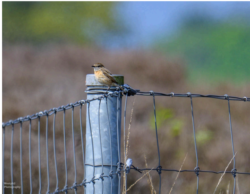
- De roodborsttapuit. -

We vervolgen onze route langs het hek en zien overal leeuweriken en tapuiten. Een roodborsttapuit vliegt voor ons uit en gaat steeds op het hek zitten. Als we dichterbij willen komen, want dat is mooier voor de foto. Vliegt hij steeds een stukje verder. Het lukt niet om het beestje fatsoenlijk te fotograferen en mijn geduld raakt op. Ik wil terug naar de auto waar mijn broodje op me wacht.