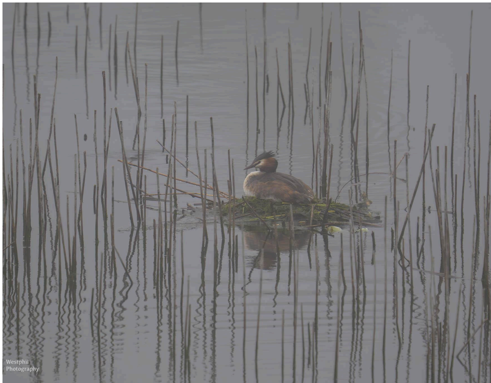
- Een fuut op zijn/haar nest. -

Als we een paar meter gelopen hebben staan we alweer stil bij een bloeiende kastanjeboom en zo gaat het de hele ochtend. We komen uit bij water en nemen alvast een kijkje en zien een fuut op een nest. We horen het lachen van een specht en even later zie ik hem vliegen over het water. Ik herken de specht aan zijn manier van vliegen, want door de mist zie ik zijn mooie groene kleur niet.