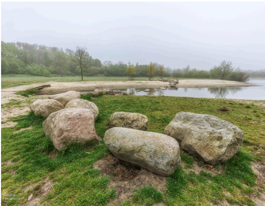
- Ook zo'n mooi plekje. -

Als we verder wandelen ontdekken we dat de stenen voor de sier in het water liggen. Er ontbreekt er eentje en daardoor zou je een hele grote stap moeten maken. Gelukkig is er ook een bruggetje over het water zodat we zonder ongelukken en/of natte voeten aan de overkant kunnen komen. Maar zover is het nog niet. Adriaan heeft de smaak te pakken en stuurt zijn drone nog één keer de lucht in.