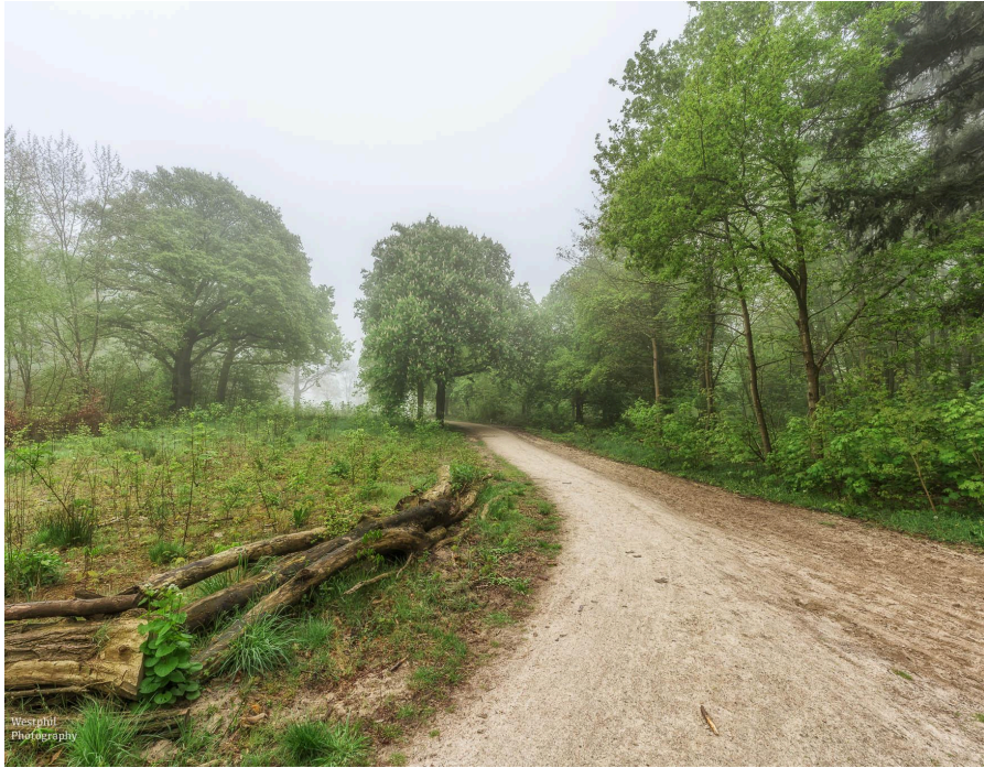
- De bloeiende kastanjeboom. -

Als we een paar meter gelopen hebben staan we alweer stil bij een bloeiende kastanjeboom en zo gaat het de hele ochtend. We komen uit bij water en nemen alvast een kijkje en zien een fuut op een nest. We horen het lachen van een specht en even later zie ik hem vliegen over het water. Ik herken de specht aan zijn manier van vliegen, want door de mist zie ik zijn mooie groene kleur niet.