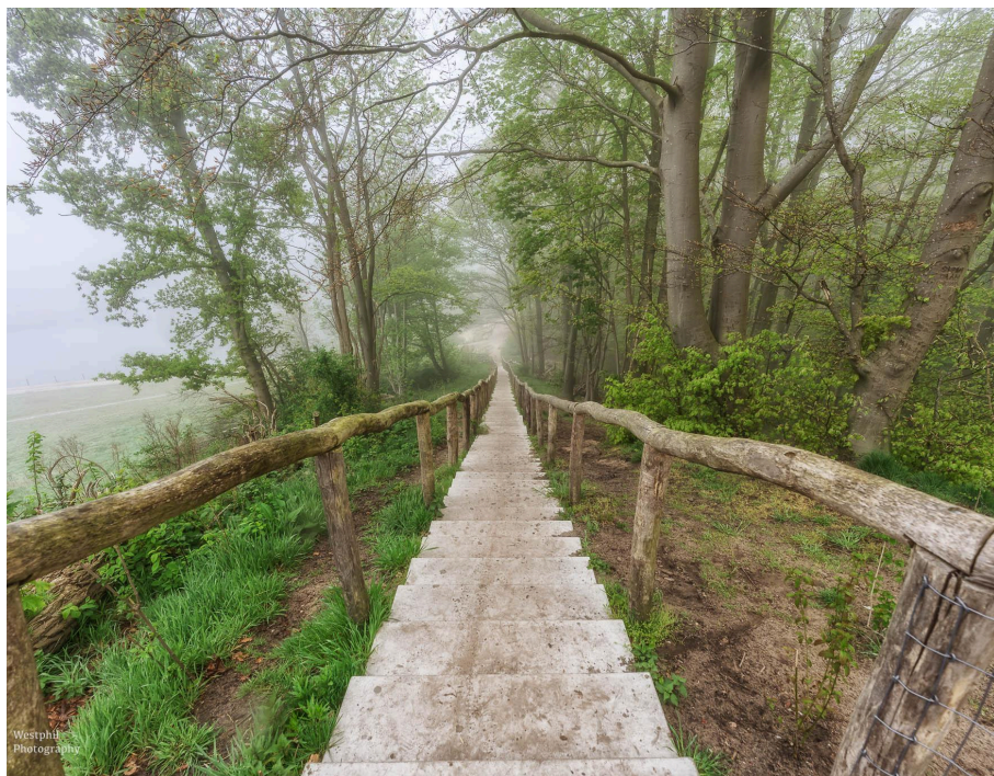
- De trap naar beneden. -

Bovenop de heuvel heb je vast een geweldig uitzicht, maar wij zien niet veel door de mist. In de verte ligt de natuurbrug. Deze brug verbindt de natuur van Anna's Hoeve met Landgoed Monnikenberg; dieren kunnen hier veilig oversteken.