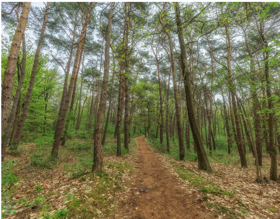
- We wandelen een stukje door het bos. -

We vervolgen onze weg en volgen de groene en paarse pijlen. Het is een makkelijk rondje, soms loop je langs het hek en soms een stukje van het hek af. Hier moet de hond aan de lijn, want je loopt een heel groot stuk door een begrazingsgebied. Op een gegeven moment geeft onze navigatie aan dat we linksaf moeten, maar de groene en paarse pijlen gaan naar rechts. We besluiten de pijlen te volgen en vragen ons af of we wel goed gaan, want we komen steeds dichterbij de snelweg.