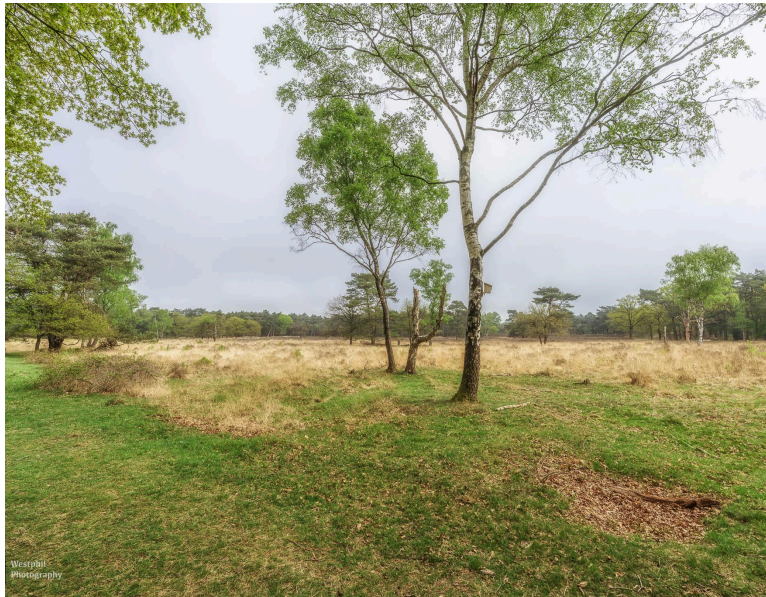
- Een berk met een vogelhuisje. -

Gelukkig gaat de route net op tijd weer de goede kant op, want over de snelweg wandelen is natuurlijk niet de bedoeling. We komen uit bij een parkeerplaats en het groepsverblijf 't Laer. Het ziet er een beetje verlaten uit, maar dat kan kloppen, want het verblijf is gesloten om nieuwbouw te realiseren.