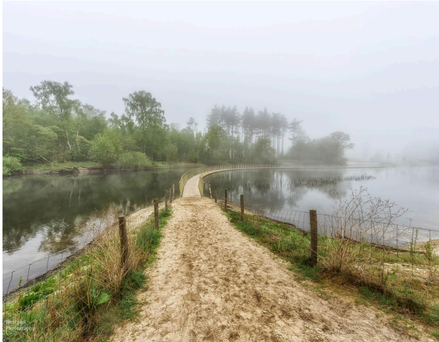
- Nogmaals het vlonderpad, maar nu vanaf de grond. -