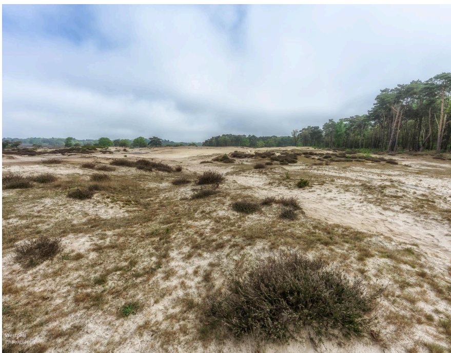
- Zoek de koeien. -

We wandelen verder een recht stuk langs de Oude Postweg. Dat ziet er op de kaart misschien een beetje saai uit, maar dat is het niet. De oude Postweg is ook al op de kaart van Gooiland uit 1843 te vinden.