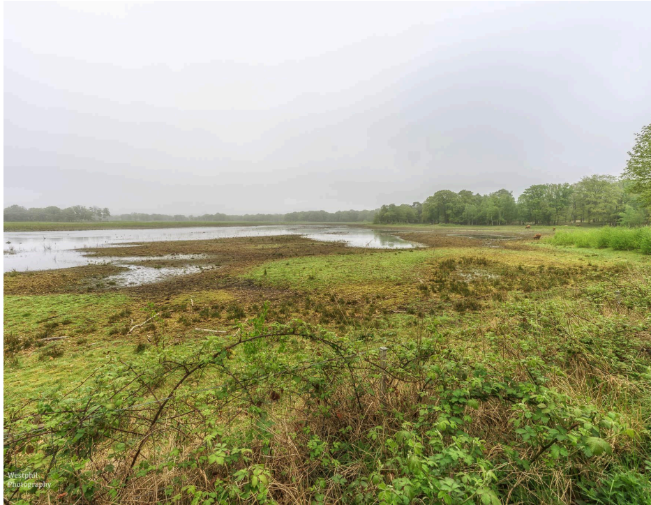
- Verderop zien we de Schotse Hooglanders al staan. -

Het gebied heeft een rijke historie en is van bijzondere natuurwetenschappelijke waarde. Het is vooral de flora in de lage gebieden, met klokjesgentiaan, kleine zonnedaauw, veenpluis en snavelbies, die het gebied zo waardevol maakt. Het Laarder Wasmeer wordt met runderen begrasd om verruiging, te veel rietgroei en Amerikaanse vogelkers tegen te gaan.