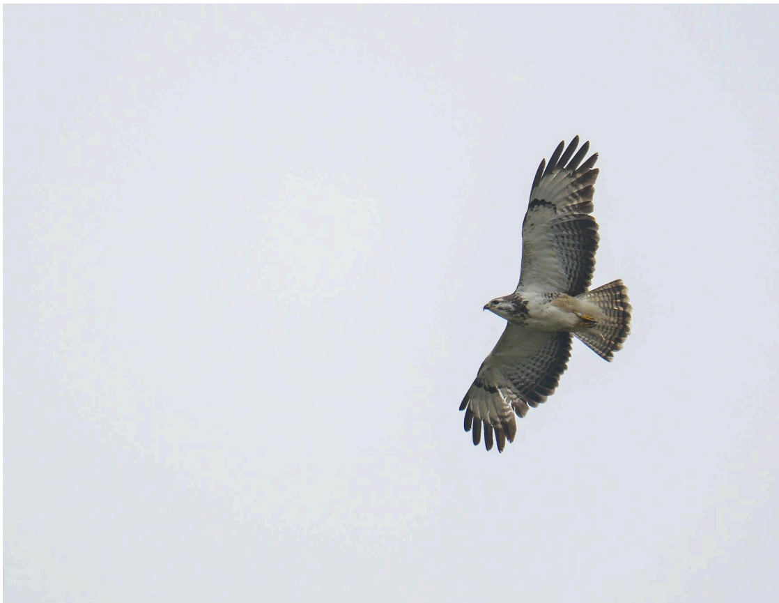
- Een buizerd. -

We staan meteen al stil om met de verrekijker te kijken wat voor vogels er te zien zijn. We wandelen over het fietspad en genieten van de omgeving. In de lucht zien we een buizerd cirkelen.