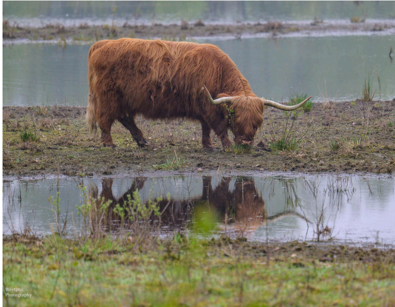
- Ons fotomodel van vandaag. -