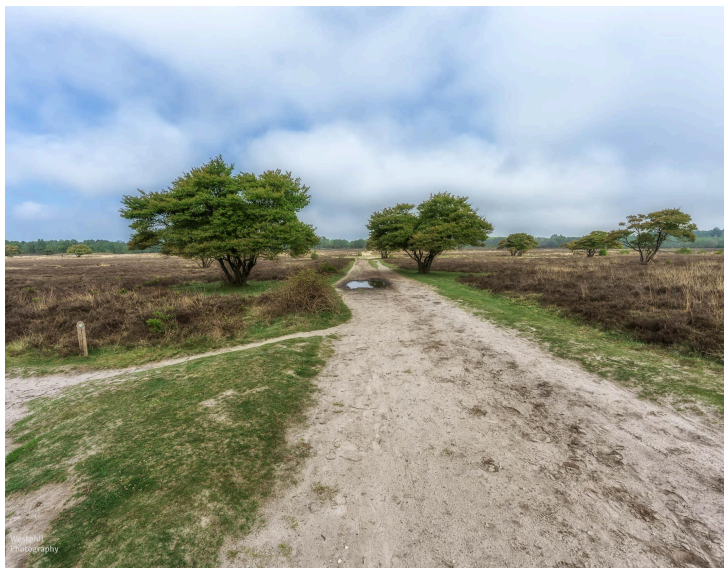
- Mooi paadje met krentenboompjes. -

We komen uit bij wandelkeuzepunt 25 waar weer een cryptische pijl staat. Een pijl rechtdoor en rechtsaf. Rechtsaf gaat via, 63 naar 69 het Wandelstartpunt Theehuis 't Bluk. Het is maar goed dat we weten dat we langs het hek moeten wandelen. Wij kiezen voor de pijl rechtdoor en gelijk daarna naar links.