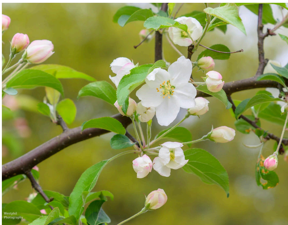
- We zien meerdere appelbomen. -

Maar eerst ontdekken we aan onze rechterhand een mooi bankje op een verhoging met een geweldig uitzicht en maakt Adriaan nog even een paar foto's van krentenboompjes, die mooi staan te spiegelen in een plas. Het is jammer dat de boompjes niet meer bloeien, maar dan hadden we de wandeling twee weken eerder moeten doen. Wel komen we bloeiende fruitbomen tegen.