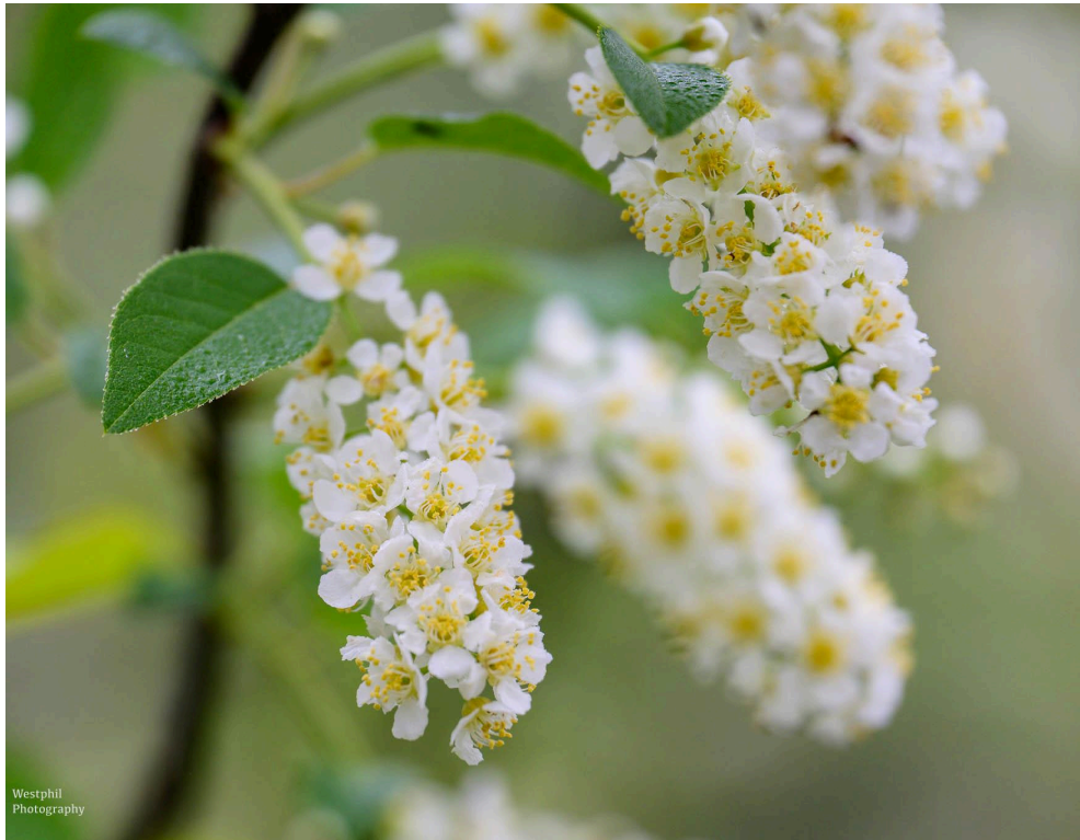
- De gewone vogelkers. -

Bovenop de heuvel heb je vast een geweldig uitzicht, maar wij zien niet veel door de mist. In de verte ligt de natuurbrug. Deze brug verbindt de natuur van Anna's Hoeve met Landgoed Monnikenberg; dieren kunnen hier veilig oversteken.