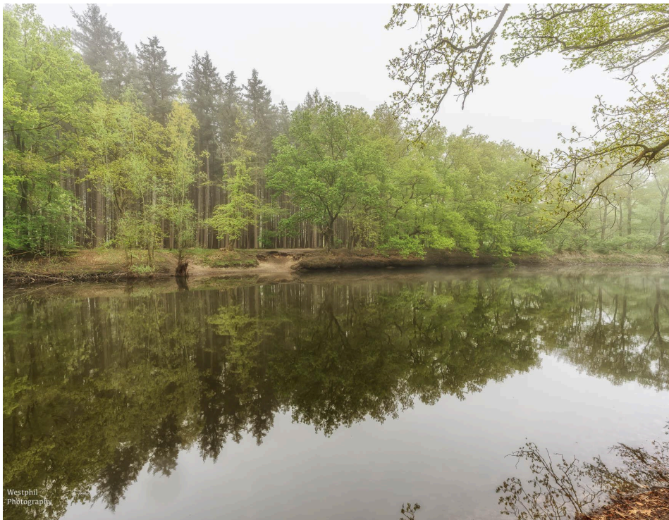
- Het wordt eindelijk een beetje lichter. -

We wandelen verder langs het water, over bruggetjes en maken foto's. Het water spiegelt prachtig en de mist wordt al ietsje minder, alleen laat de zon het nog even afweten. Dit stuk van de wandeling is nog geen 2,5 kilometer, maar zo mooi dat wij er erg lang over doen. Natuurlijk staan we veel stil om te kijken of we de ijsvogel nog zien, maar we hebben vandaag geen geluk.