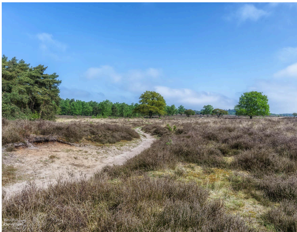
- De mooie Zuiderheide. -