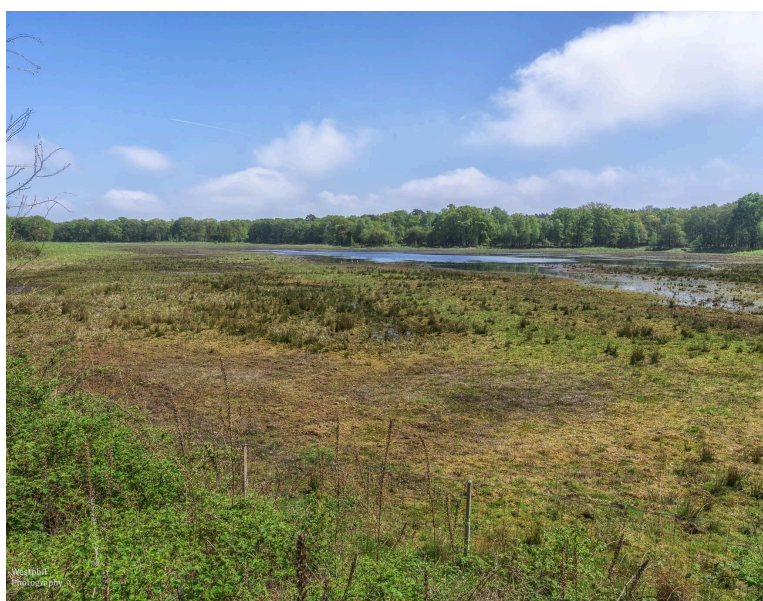
- Verderop zitten de bijzondere vogels. -

Als we bijna terug zijn bij het begin komen we uit bij het water waar we op de heenweg de Schotse Hooglanders zagen. Er zitten twee mensen met geavanceerde verrekijkers naar het ven te kijken. Als we vragen wat ze zien, antwoorden ze: "Een witgatje, een bosruiter, tureluurs en Kieviten." De laatste twee ken ik en zie ik ook door mijn eigen verrekijker, van de andere twee vogels heb ik nog nooit gehoord en ze zijn te ver weg om ze te leren kennen.