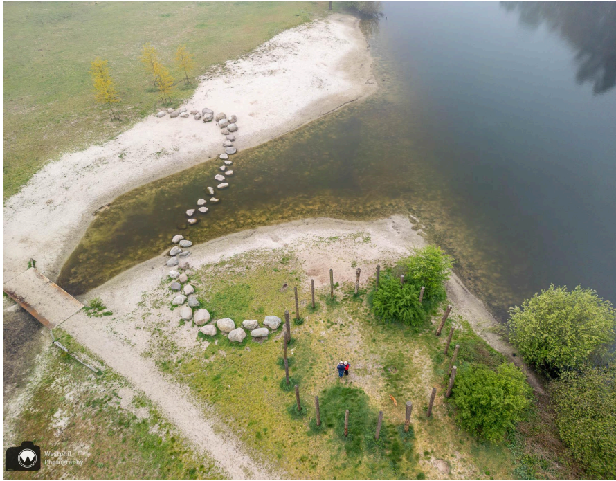
- Hier kun je duidelijk zien dat er één kei ontbreekt. -

Als we verder wandelen ontdekken we dat de stenen voor de sier in het water liggen. Er ontbreekt er eentje en daardoor zou je een hele grote stap moeten maken. Gelukkig is er ook een bruggetje over het water zodat we zonder ongelukken en/of natte voeten aan de overkant kunnen komen. Maar zover is het nog niet. Adriaan heeft de smaak te pakken en stuurt zijn drone nog één keer de lucht in.