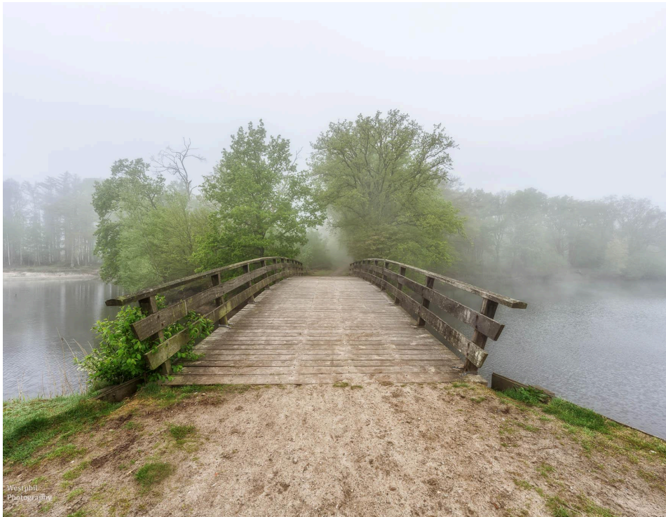
- Het bruggetje na het vlonderpad. -

Na het vlonderpad wandelen we over een bruggetje. We moeten van de rode pijlen rechtdoor, maar wij horen een ijsvogel dus volgen we het pad langs het water. We speuren over het water en zien een ijsvogelwandje aan de overkant, maar het ziet er ongebruikt uit. Ook zien we de blauwe flits niet vliegen. Dus wandelen we weer terug naar het pad waar we de rode pijlen weer volgen. Je kunt ook langs het water blijven lopen en bij het volgende bruggetje de wandeling weer oppakken.