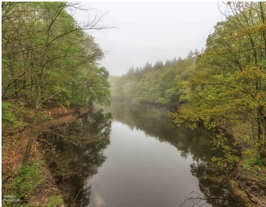
- Het water spiegelt vandaag zo mooi. -

Het gebied waar we nu doorheen lopen was ooit bedoeld voor een snelweg van Hilversum naar Aalsmeer. Die snelweg kwam er nooit en er bleef een nutteloos stuk asfalt achter. Het landschap werd de afgelopen jaren opnieuw ingericht en daarmee is het totaal veranderd. Het oude asfalt is weggehaald, er is een waterberging voor in de plaats gekomen en jonge bomen zijn aangeplant. De werkzaamheden zijn nog maar net afgerond, maar het ziet er nu al fantastisch uit.