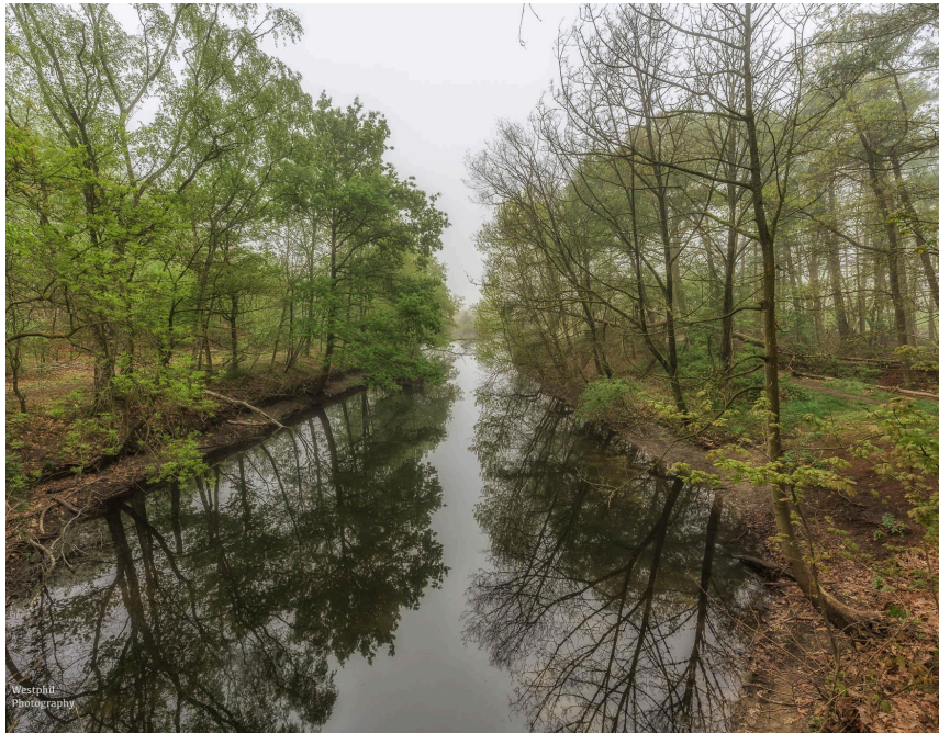
- Een prachtig uitzicht. -