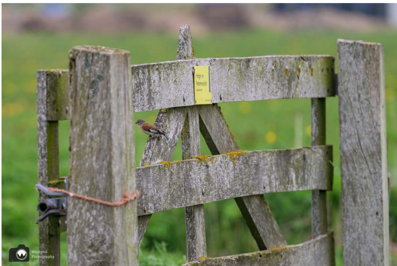
- Een kneu op een hek. -