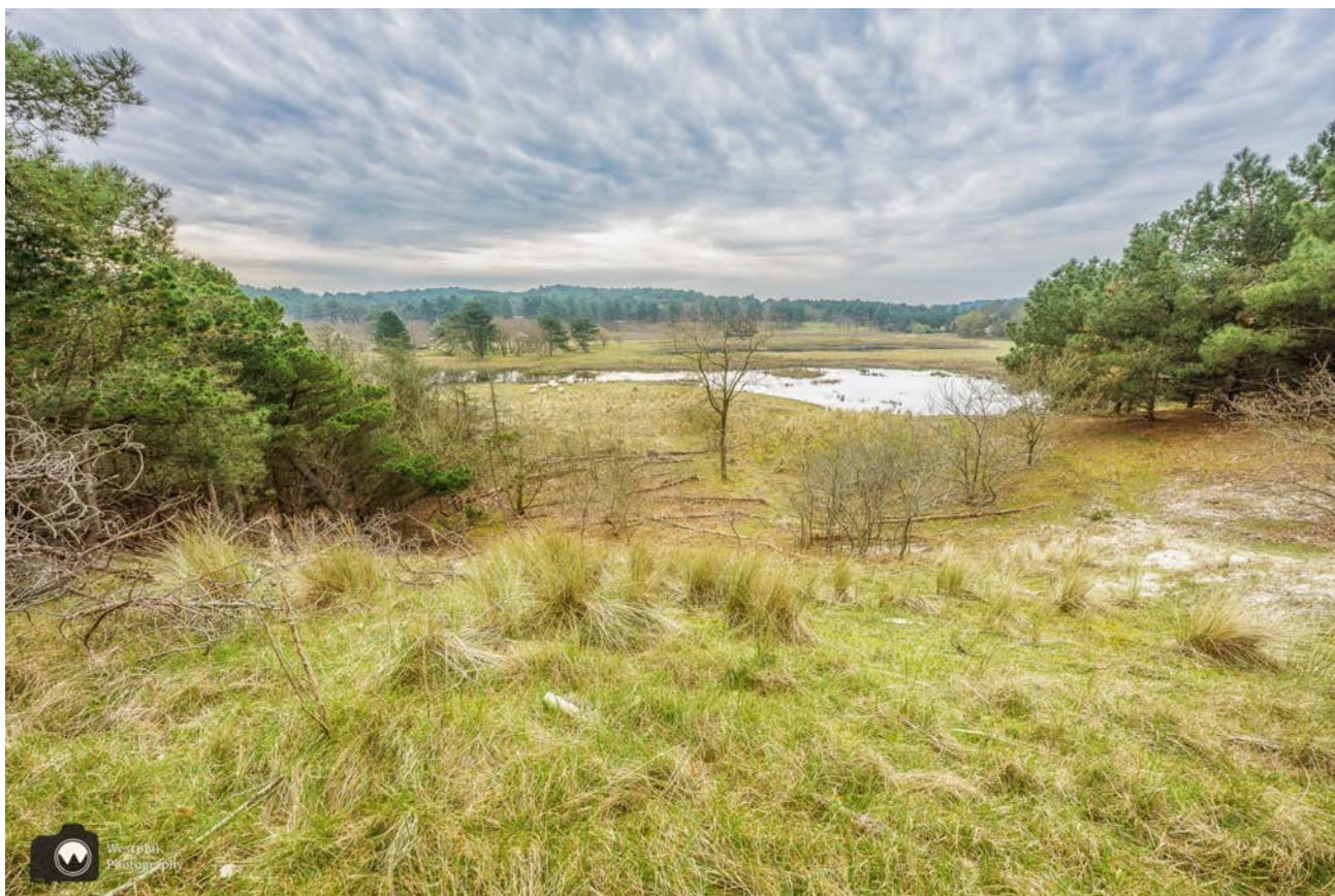
- Een prachtig uitzichtpunt langs het pad. -

Het eerste stuk hebben we eerder gelopen; toen we een gedeelte van de geweldige duintoppentocht wandelden. De duintoppentocht is met een afstand van ruim 20 kilometer geen ommetje, maar zeker een aanrader!