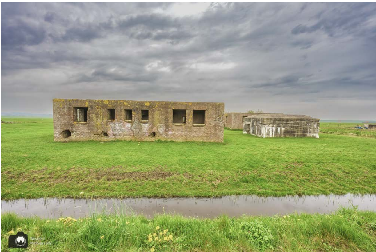
- Dit is er nog over van Electra Sonne Petten. -