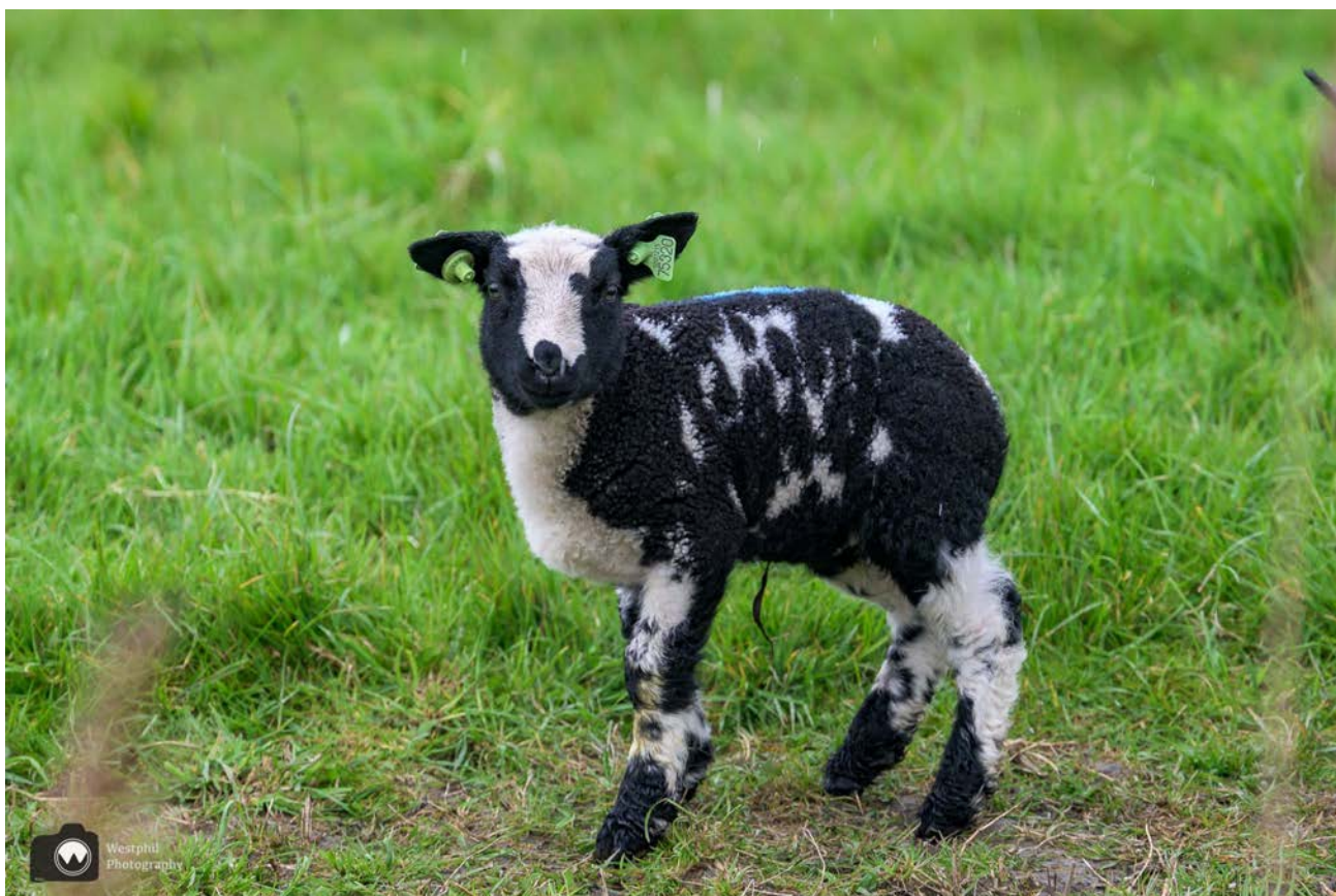
- Zo'n schattig lammetje. -