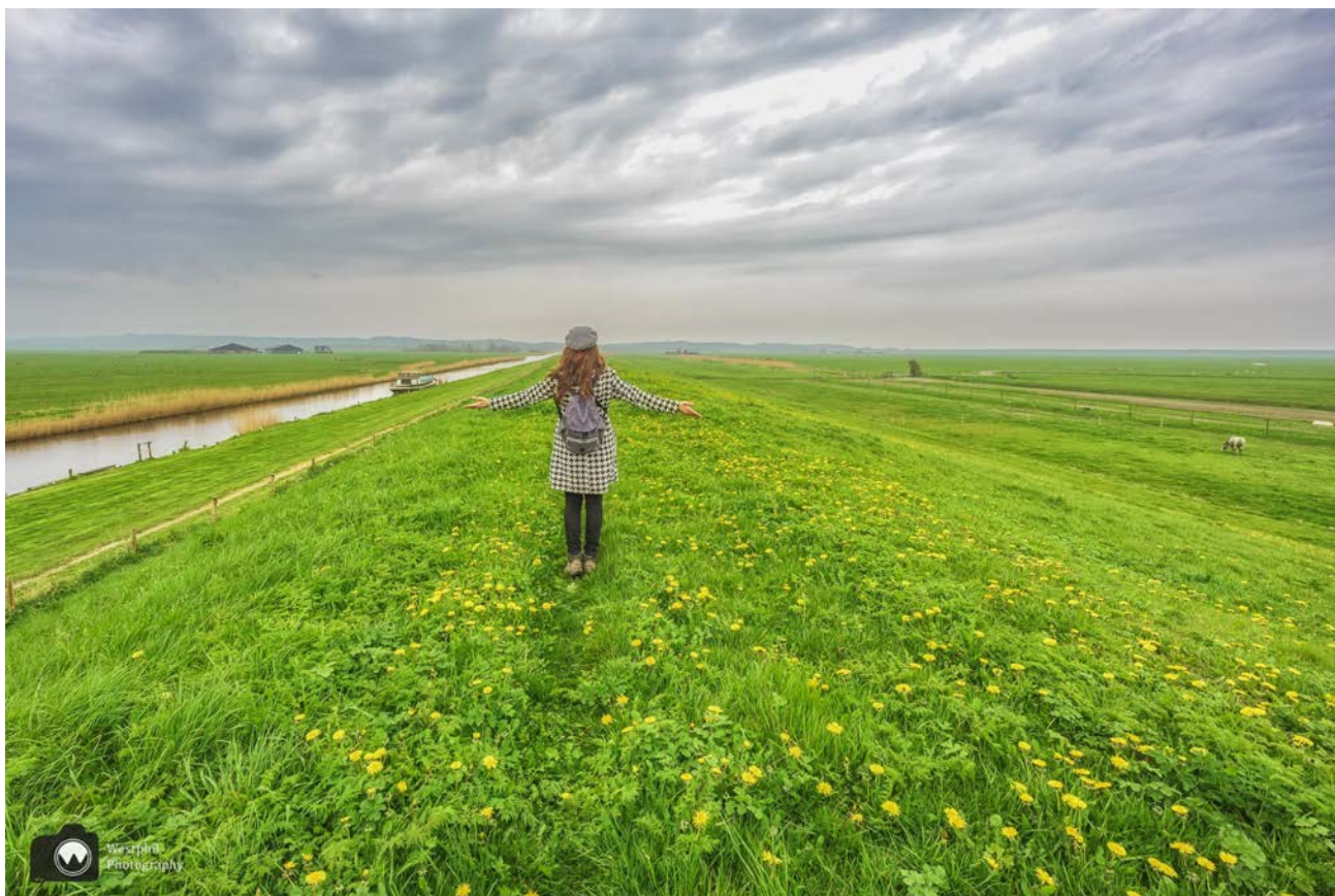
- Overal paardenbloemen. -