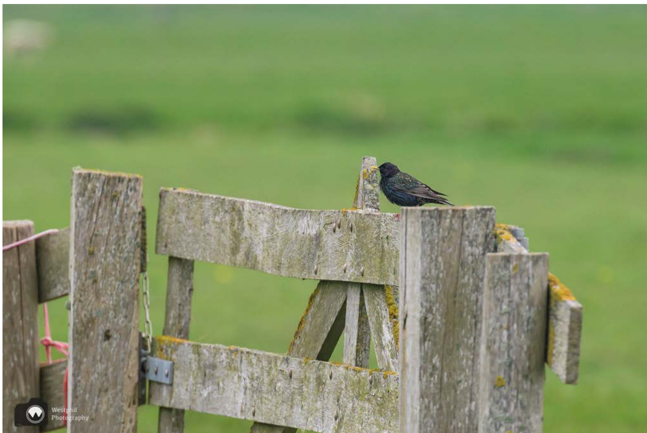
- Een spreeuw is ook een hele mooie vogel. -

Wij vinden het jammer dat de wandeling niet dicht langs het vogelparadijs gaat. Je zou bij knooppunt 22 naar links kunnen wandelen om iets dichterbij het gebied te komen en weer terug. Wij zien de omweg vandaag niet zo zitten, omdat de lucht er wat dreigend uitziet en er regen is voorspeld. Gelukkig zien we van alles langs de route en staan we vaak stil om de verrekijker te gebruiken. Zo zien we een lepelaar (die denkt zeker dat het herfst is) en twee kluten.