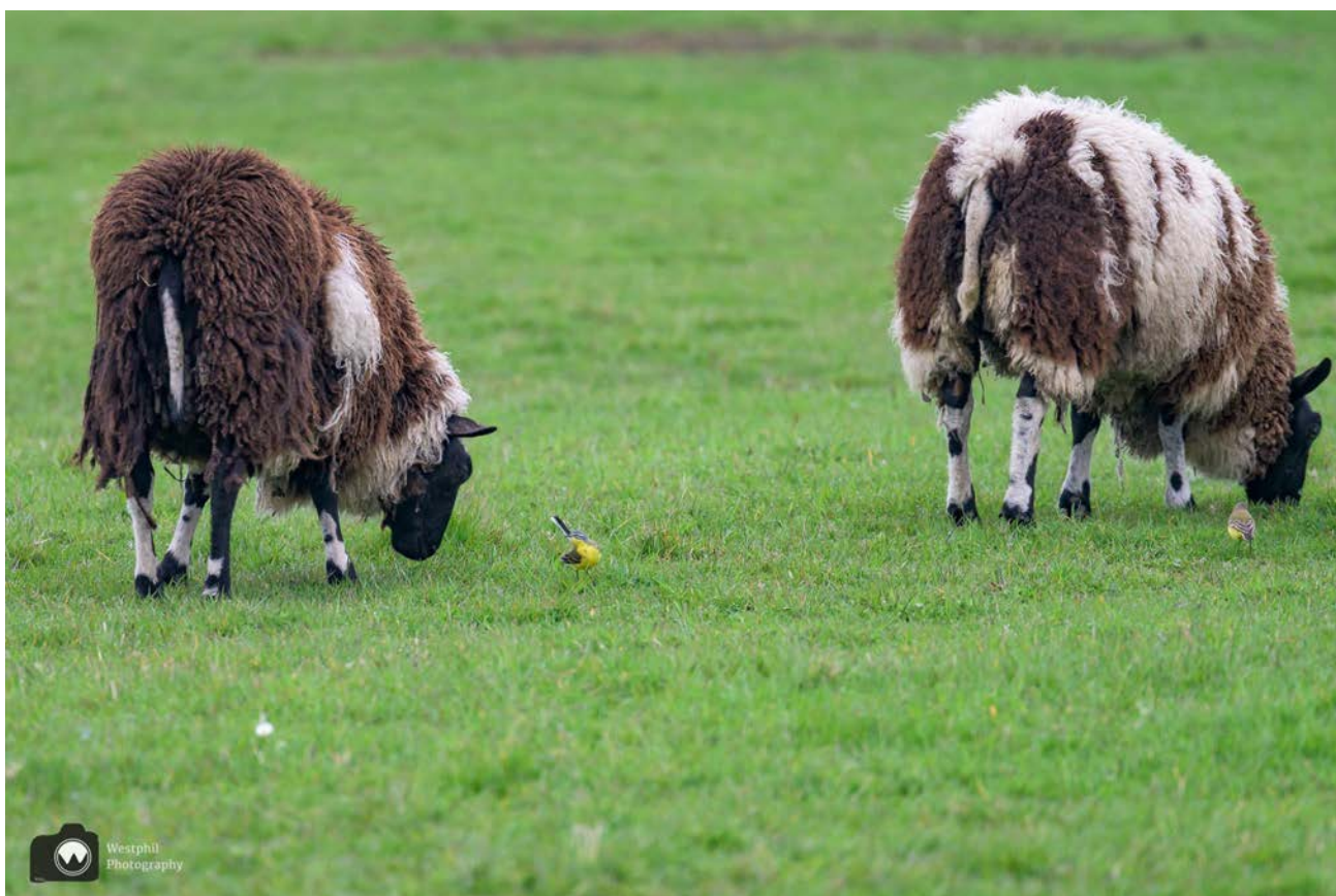
- Gele kwikstaarten tussen de schapen. -

De polder is ontstaan door invloed van wind, rivieren en zee. Het is een uitgestrekt landschap met onregelmatige en grillige verkaveling. Deze verkaveling stamt uit de Middeleeuwen en is sinds 1850 niet meer gewijzigd.