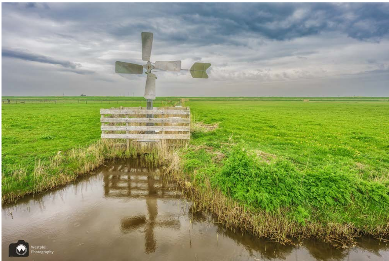
- Het hek om de molen is om te beschermen tegen het vee. -