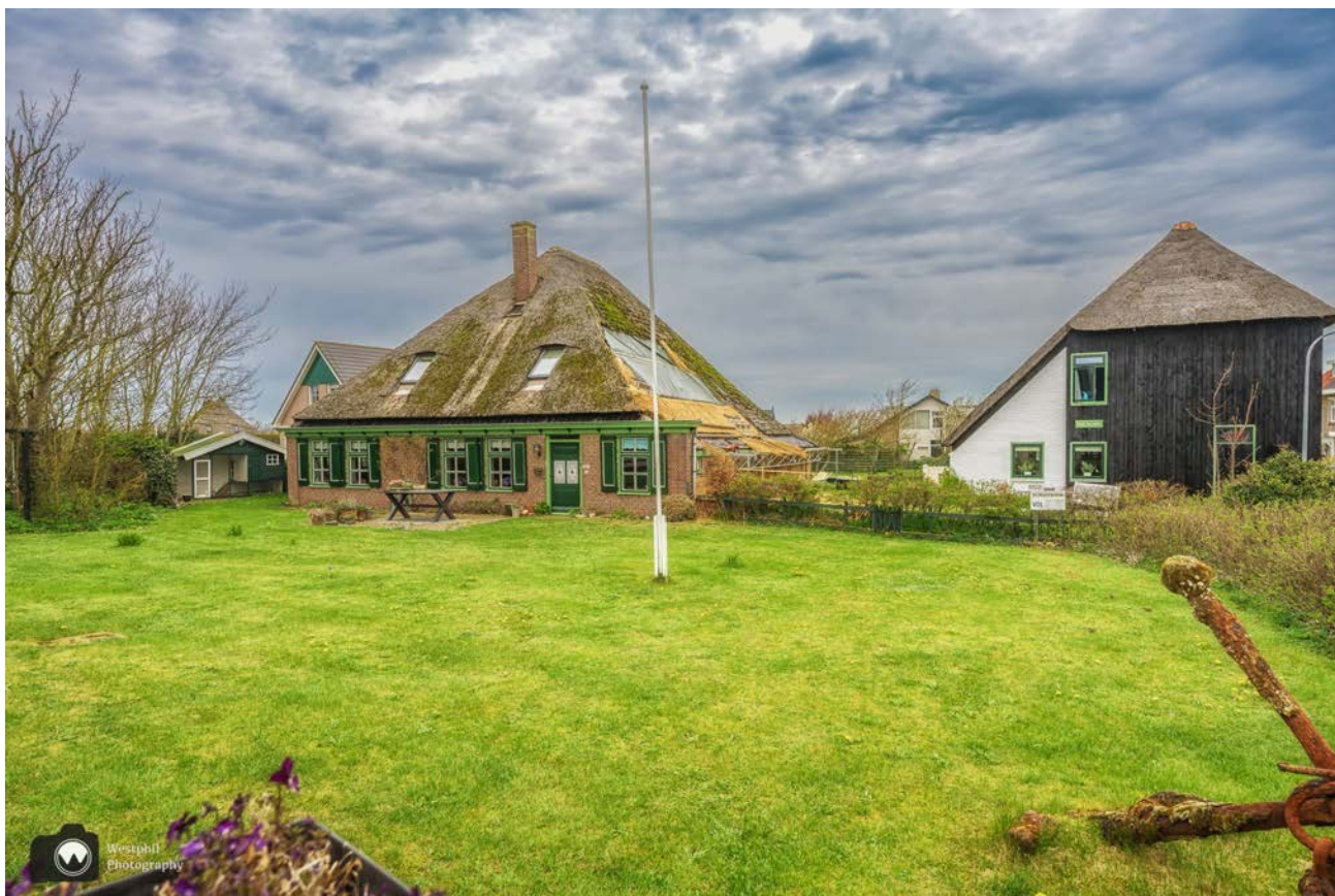
- Ook langs de weg zien we mooie plekken. -

Onze aandacht wordt getrokken door een schaap met hoorns en als we beter kijken zien we ook een heel schattig lammetje. Soms willen dieren gewoon niet poseren; het schaap gaat met haar rug naar ons toe staan en het lammetje verschuilt zich achter de moeder. Dan maar een foto van één van de vele mussen.