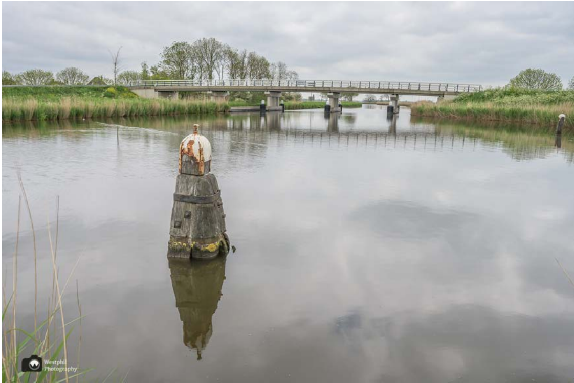
- Mooi doorkijkje over het Schagen Kogge kanaal. -

Het enige nadeel is het geluid van de weg aan de overkant van het kanaal. Verder lopen wij lekker rustig en komen nauwelijks iemand tegen.