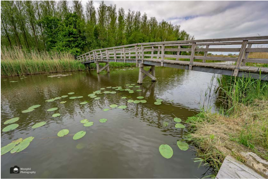
- Het bruggetje over de Benedenkolk. -

Het was een lang ommetje, maar echt een fijne wandeling met leuke dorpjes en natuur.