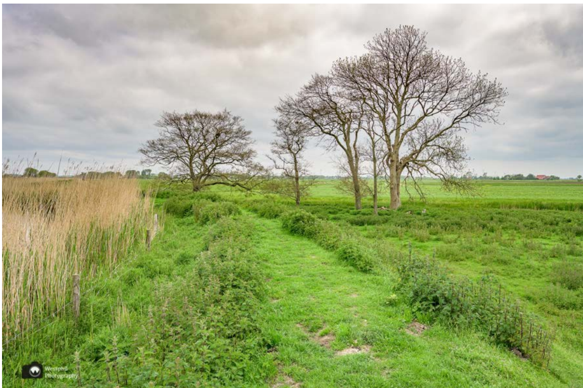
- Er zijn ook stukken die niet recht zijn. -

Het enige nadeel is het geluid van de weg aan de overkant van het kanaal. Verder lopen wij lekker rustig en komen nauwelijks iemand tegen.