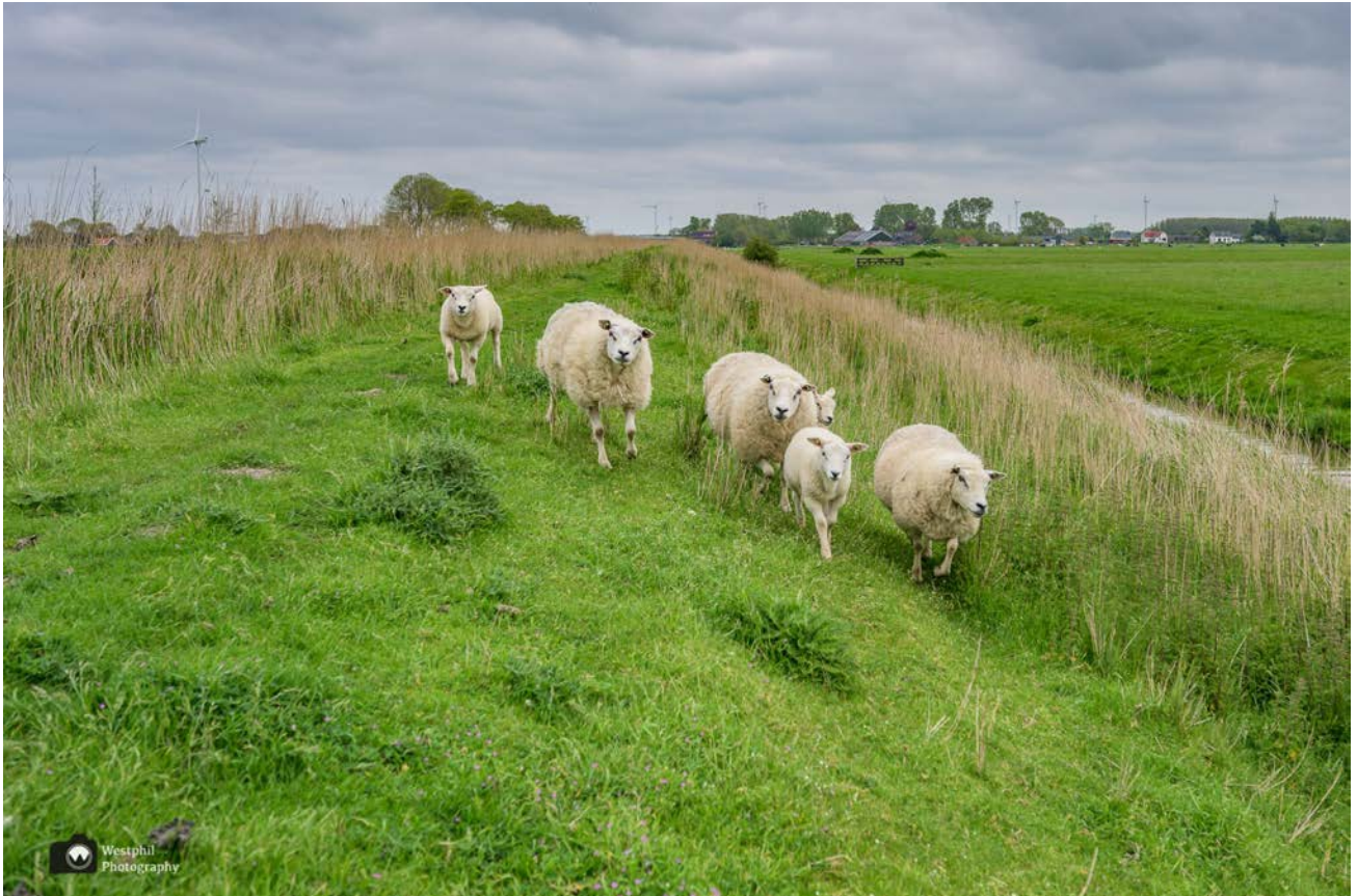
- Het lijkt net of ze op ons af komen rennen. -

Aan het einde van de grasdijk staan schapen en waar schapen zijn is schapenpoep. Even opletten waar we lopen, anders moeten we straks onze schoenen weer schoonmaken.