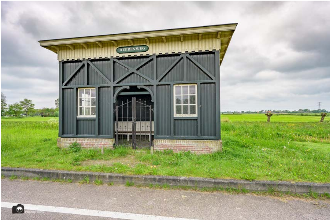
- Het is een abri; een ouderwets wachthokje. -