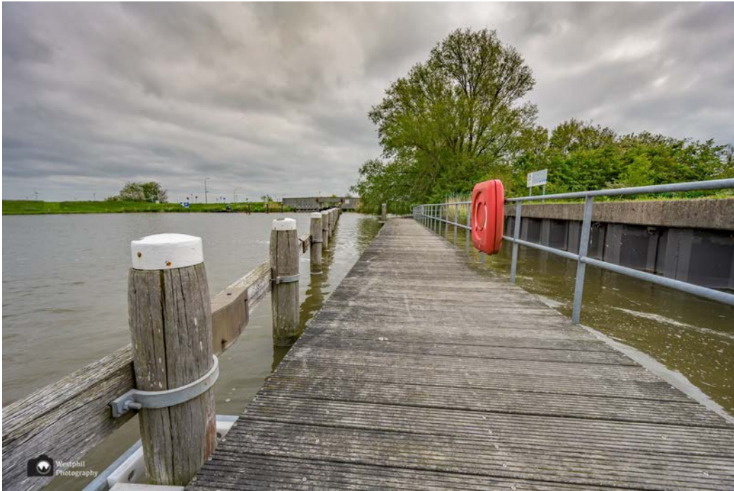
- Bij het gemaal loop je een stukje over een steiger langs het water. -

Vorbij het gemaal komen we uit bij een picknickplek met informatieborden. Er staan borden met info over het gemaal, de polder en de natuur. Rechts op een eilandje staat een monument van een neergestorte bommenwerper uit de tweede wereldoorlog. Ook hier is een informatiebord over. Het valt mij op hoe jong de mensen waren, die toen omgekomen zijn.