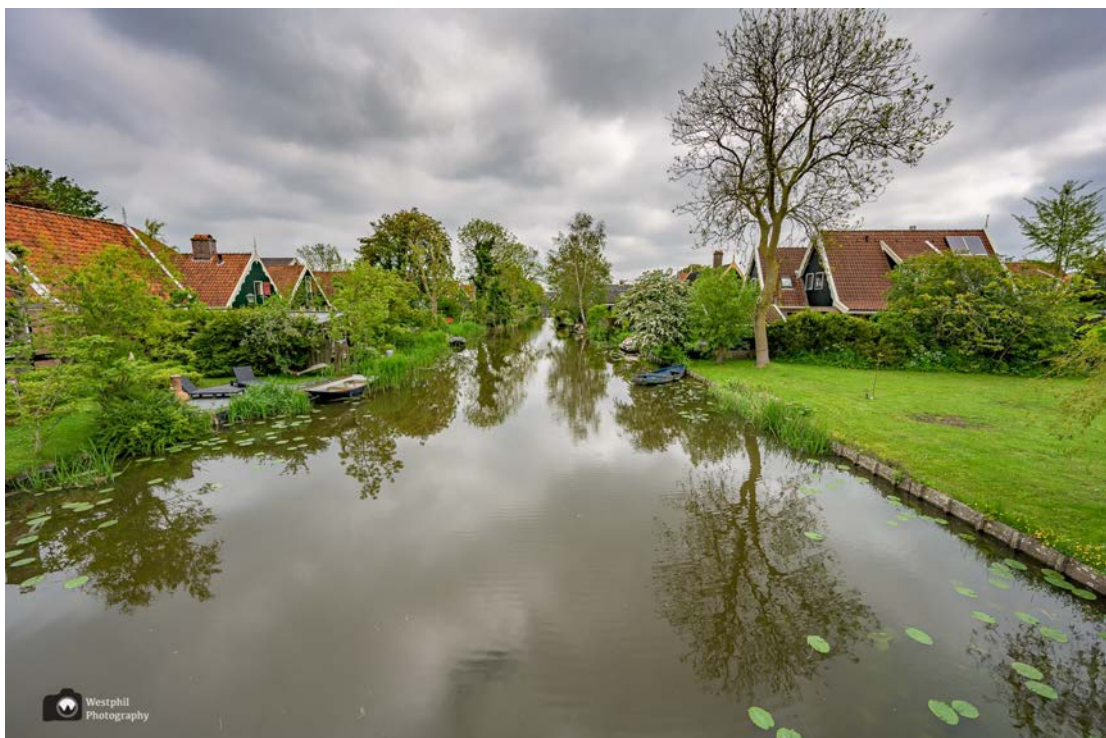
- Nog één plaatje van Kolhorn voordat we het dorp uitlopen. -

Veel te snel, naar ons zin, lopen we het dorpje uit. Wij hadden er nog wel wat langer willen blijven. We gaan zeker een keertje terug voor een rondje door het dorp.