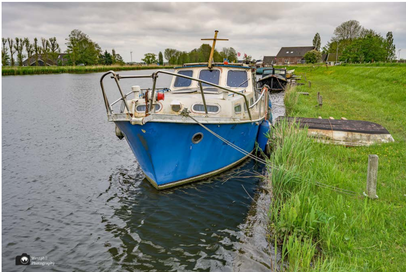
- De bootjes zijn niet zo nieuw meer. -

We lopen nog een klein stukje langs het water en daar wijzen de blauwe pijlen naar rechts. We komen langs een plek waar vroeger de Molenkolk, één van de strijkmolens van Schager Kogge, heeft gestaan. Er staat nu een cortenstalen molentje, zodat je kunt zien hoe de molen er vroeger uit heeft gezien.