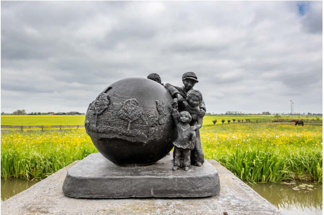
- "De kracht van het dorp" van Greetje van Roon. -

Tegenover het Raedthuysje is een terras met een bronzen beeld van kunstenares Greetje van Roon. Zij maakte dit in opdracht van de dorpsraad. Het heet “De kracht van het dorp”. Het terras is bedoeld voor alle bezoekers van het Raedthuysje, voor fietsers of wandelaars die even willen uitpuffen en of picknicken en voor bijzondere gelegenheden in het dorp.