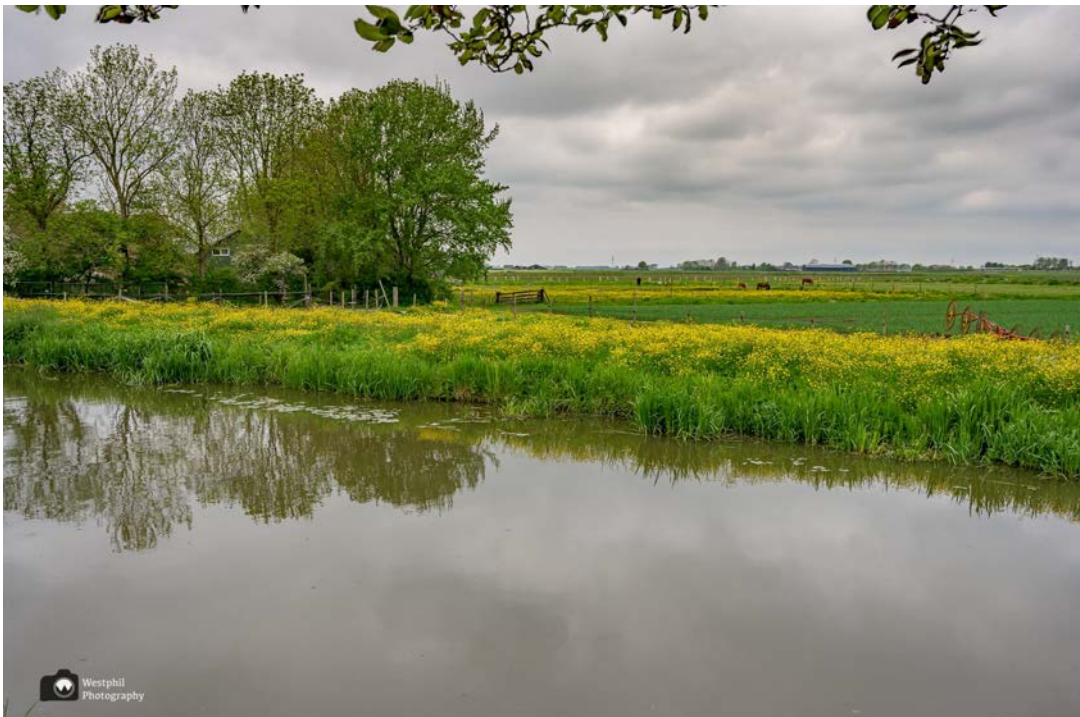
- Zo mooi al die bloeiende wilde bloemen. -

Dat het lente is merken we vooral aan alle bloeiende wilde bloemen langs de kant van de weg en een grutto, die heel luid een kieviet aan het verjagen is. De grutto heeft vast jonkies, maar wij zien ze niet.