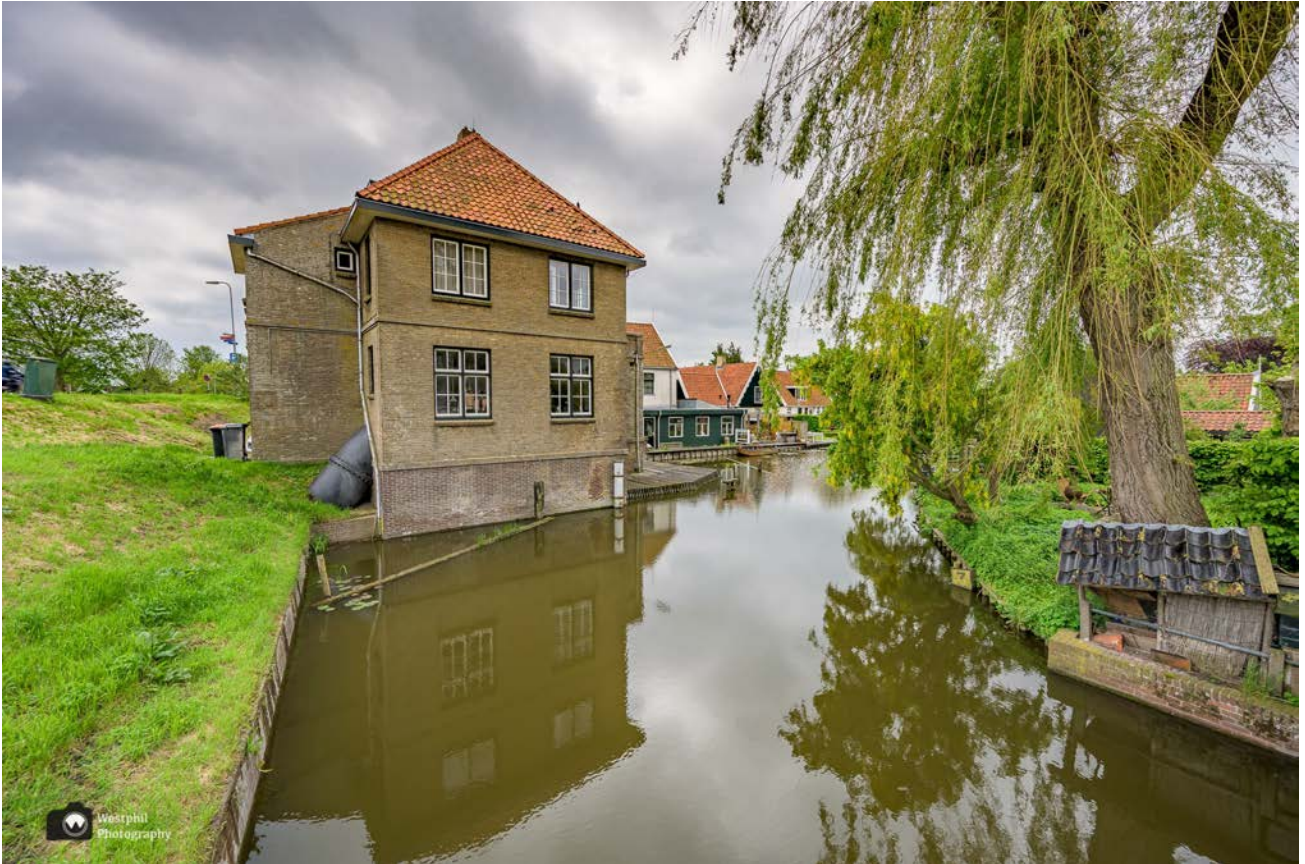
- Het gemaal Schager Kogge is niet meer in gebruik. -

Deze route heet eigenlijk Gemalenroute. Het eerste gemaal (Schager Kogge) komen we al heel snel tegen, al hebben wij niet meteen door dat het een gemaal is.