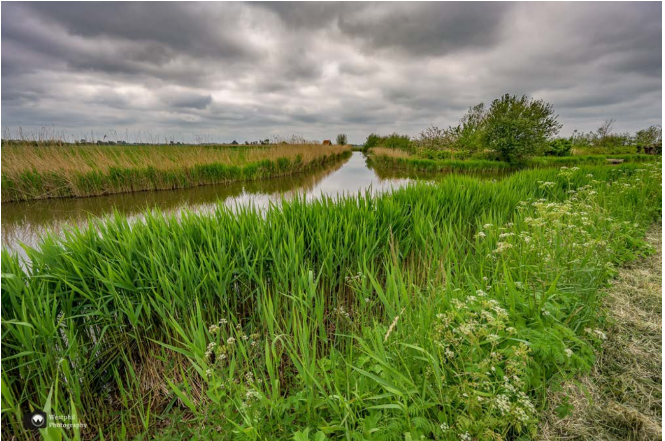
- Wat een mooi uitzicht. -

We lopen langs een asfaltweg. Het is er gelukkig niet druk en wordt er niet hard gereden. Af en toe staan we stil om te genieten van het uitzicht en foto's te maken van het waterrijke gebied. In het riet langs het water zingen rietzangers het hoogste lied. Soms zien we er ook eentje bovenin een rietstengel zitten.