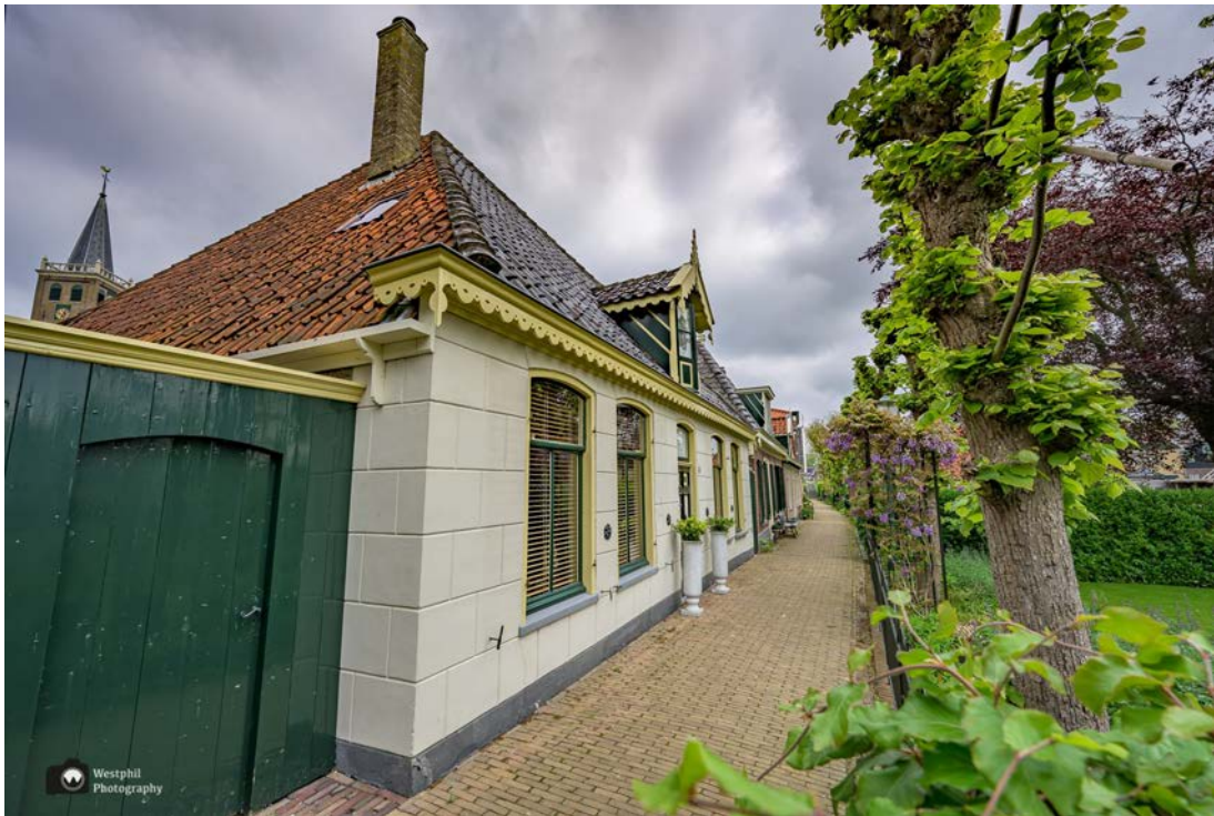
- Achter dit huis is de kerk nog net te zien. -

Veel te snel, naar ons zin, lopen we het dorpje uit. Wij hadden er nog wel wat langer willen blijven. We gaan zeker een keertje terug voor een rondje door het dorp.