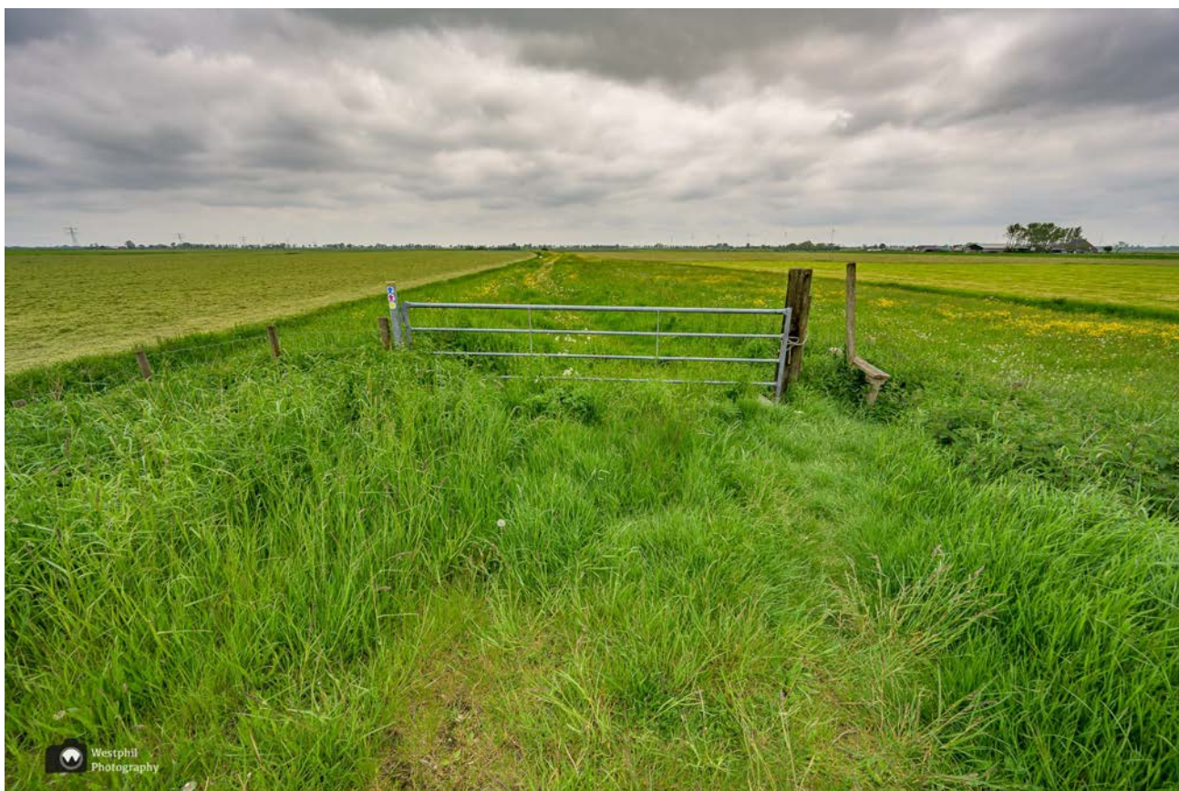
- Het eerste opstapje. -

Ondanks dat het lopen hier wat moeilijker gaat, is het hartstikke leuk om over dit pad te wandelen. Als we op de helft zijn komen we uit bij een bollenveld. De bollen zijn helaas allemaal gekopt, maar wel leuk om te weten dat je hier heel dichtbij de tulpen kan komen. We lopen langs een akker met groeven. We zien twee scholeksters, die af en toe in een groef verdwijnen om daarna weer tevoorschijn te komen. Een grappig gezicht!