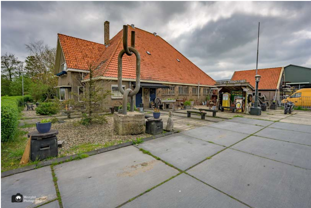
- In Barsingerhorn kun je "Terug naar toen". -

De route is nog steeds erg gemakkelijk te volgen, steeds maar rechtdoor. We komen langs een boerderij met een heel oud tankstationnetje. Leuk voor de foto toch?