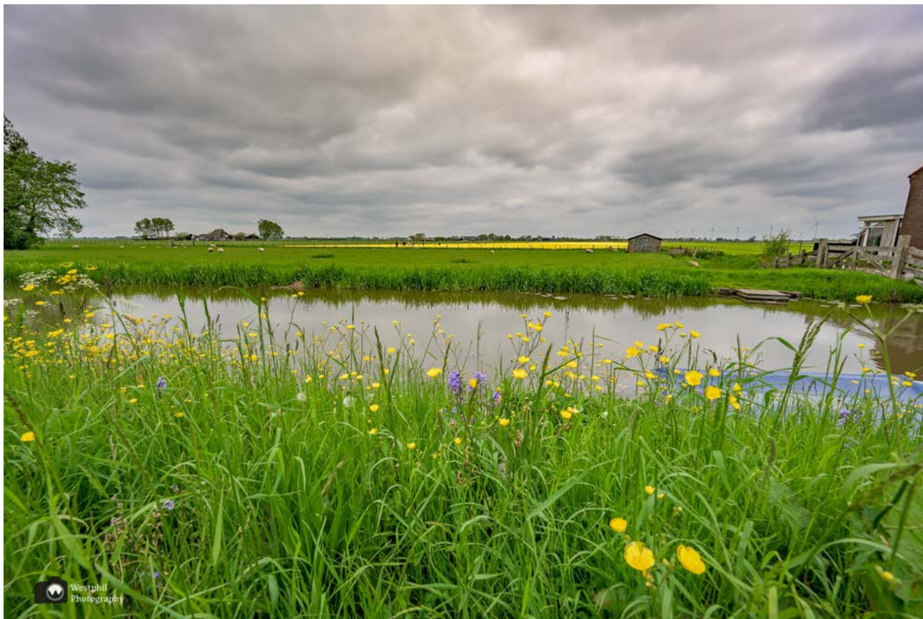
- Verderop zien we een veld vol gele tulpen. -

Er is zoveel te zien. We komen langs een bord van de Bokroute. Dit heeft niets met bier te maken, maar met Cornelis Bok; een kunstschilder die meerdere schilderijen heeft gemaakt in de omgeving van Schagen. Er zijn twee bokroutes: een fiets- en een wandelroute. Ook leuk om een keer te doen!