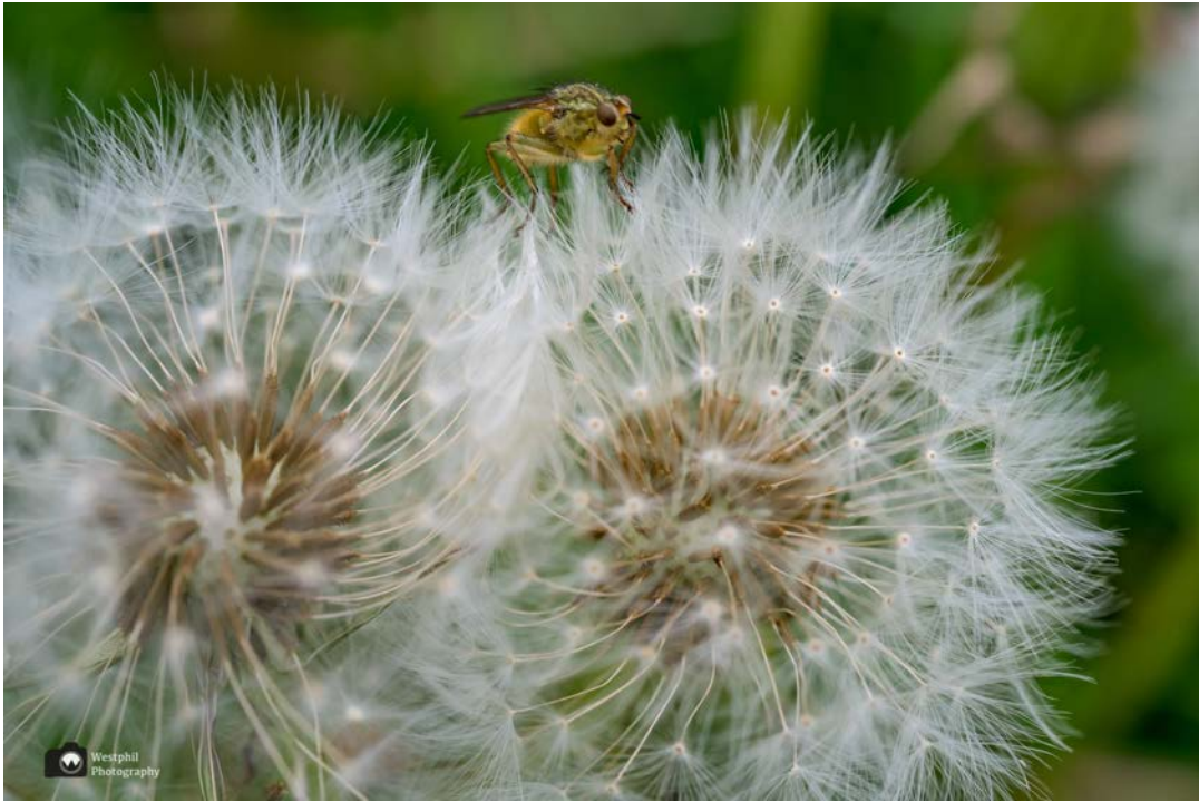
- De insecten genieten ook van de wilde bloemen. -

Als we verder lopen komen we langs een heel grappig gebouwtje. Dit is een oud wachthuisje (Abri). De halte was onderdeel van de oude tramweg Wieringen-Schagen. De witte strepen op de weg geven aan waar de rails hebben gelegen. Het huisje is gebouwd in 1910 en bood reizigers beschutting tegen weer en wind.