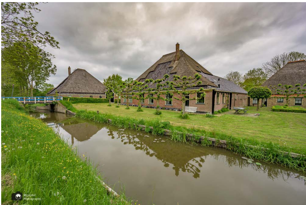
- Van deze plek heeft Cornelis Bok een schilderij gemaakt. -