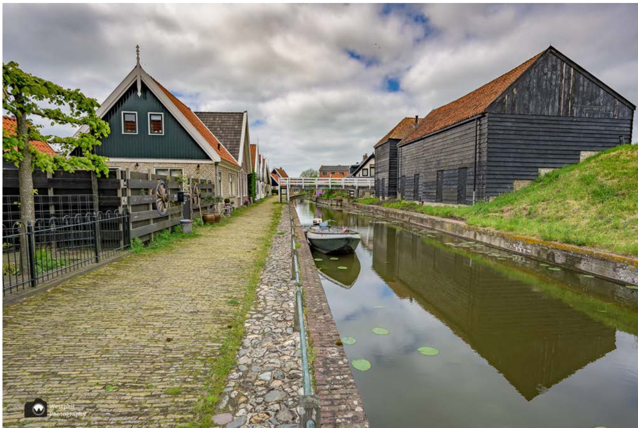
- Nog één fotootje van Kolhorn voordat we naar huis gaan. -

Meer wandelen in Noord-Holland www.wandelnetwerknordholland.nl