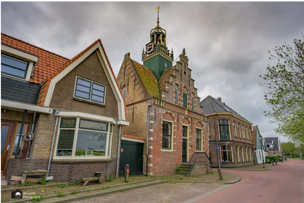
- Het Raedthuysje. -

In de kern van het dorp lopen we langs een heel mooi gebouwtje. We denken eerst dat het een kerk is, maar het blijkt een oud rechthuis uit 1622 te zijn.