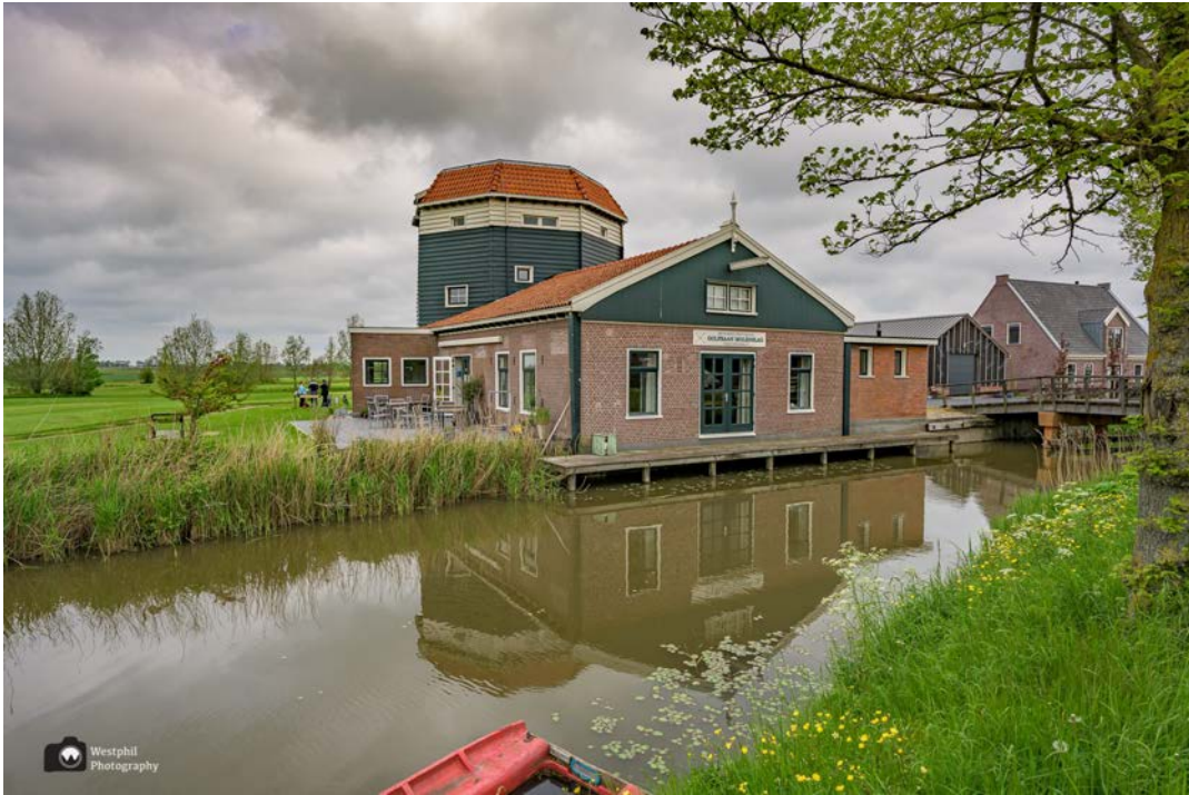
- De golfbaan van Barsingerhorn. -

Dat het lente is merken we vooral aan alle bloeiende wilde bloemen langs de kant van de weg en een grutto, die heel luid een kieviet aan het verjagen is. De grutto heeft vast jonkies, maar wij zien ze niet.