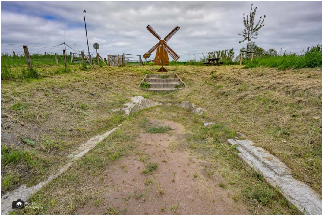
- De fundering van de molen en de cortenstalen replica. -

We lopen over een leuk bruggetje achter de blauwe pijlen aan en gaan daarna naar links langs het water “de Benedenkolk”. Op een gegeven moment twijfelen we of we wel goed gaan, maar als je gewoon rechtdoor blijft lopen langs het water kom je vanzelf uit waar je vanochtend begonnen bent.