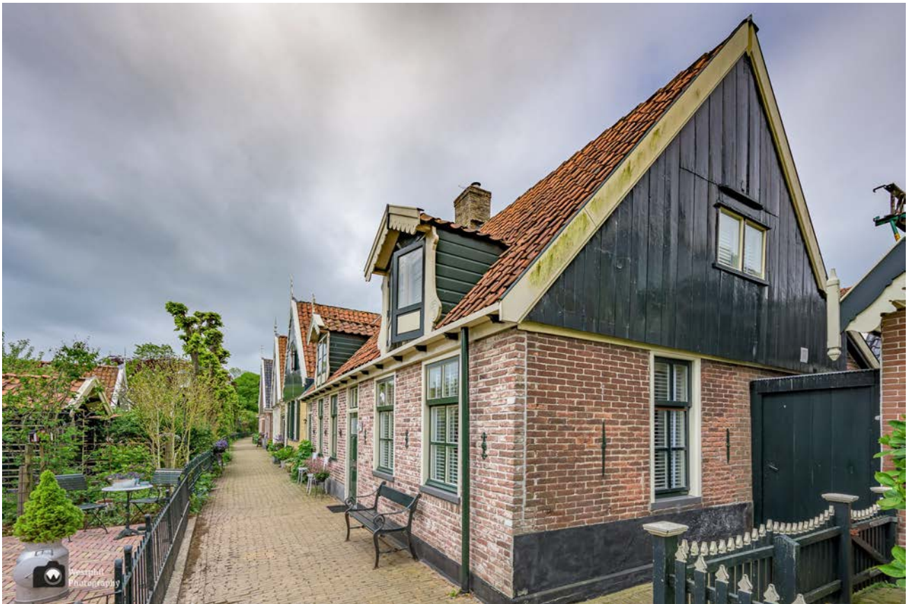
- Wat een leuke huisjes en fantastisch die tuintjes. -

We lopen over een pad, dat de huizen van de tuinen scheidt. De bewoners steken hier het voetpad over om hun tuin aan het water te gebruiken. De ene tuin is nog mooier dan de andere. Wat een leuk straatje met schattige huisjes. We weten gewoon niet waar we kijken moeten, dus maken we overal maar foto's van. Zo kunnen we het thuis nogmaals bekijken en voor dit wandelverslag gebruiken natuurlijk. De tuinen zijn allemaal privé en dat is maar goed ook. Anders liepen we daar nu nog bloemen te fotograferen.