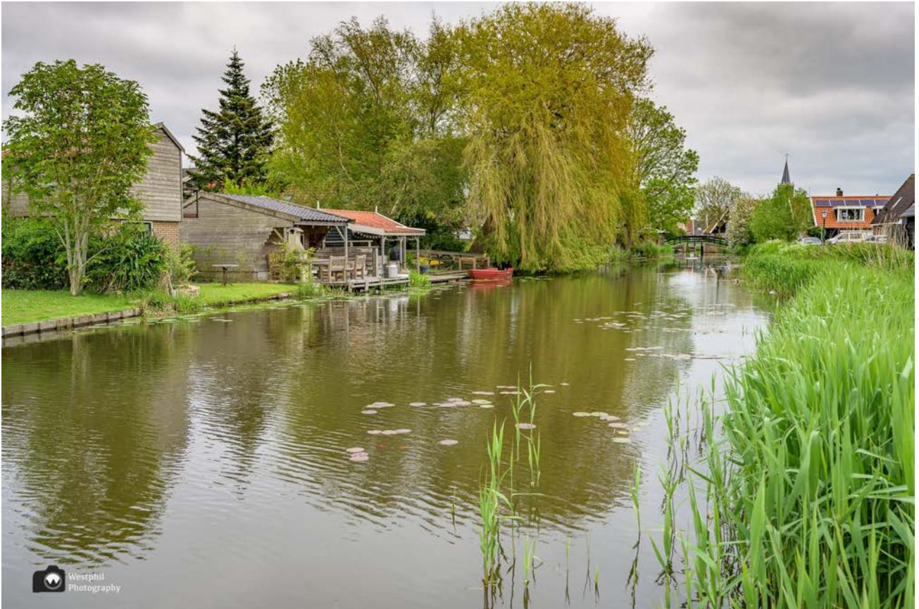
- Achtertuintjes langs de Benedenkolk. -