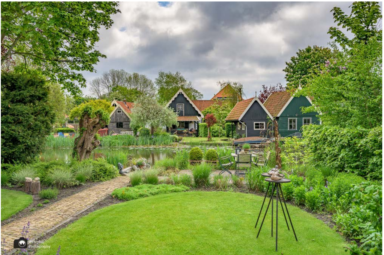
- Eén van de prachtige tuintjes in Kolhorn. -

Kijk voor meer wandelverhalen op Westphil Wandelt .