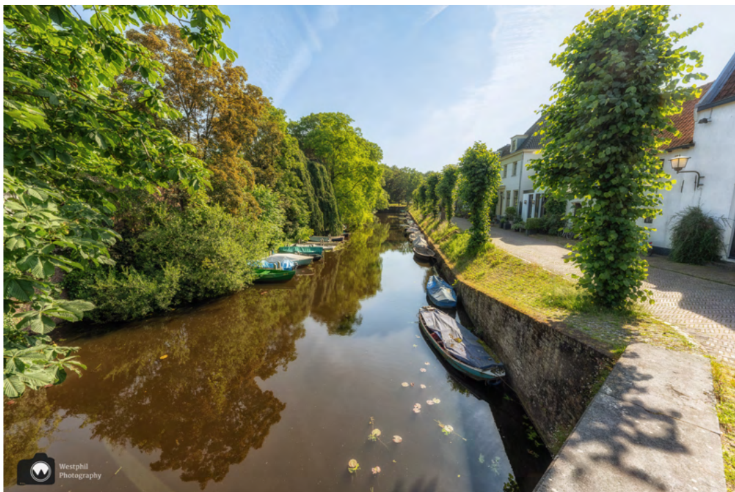
De Oude Haven.

We wandelen verder langs het water en passeren een bruggetje. Aan de overkant van de brug lopen we verder langs de Oude Haven. Een mooie straat waar geen auto's geparkeerd staan en waar kleurrijke bootjes in de gracht liggen.