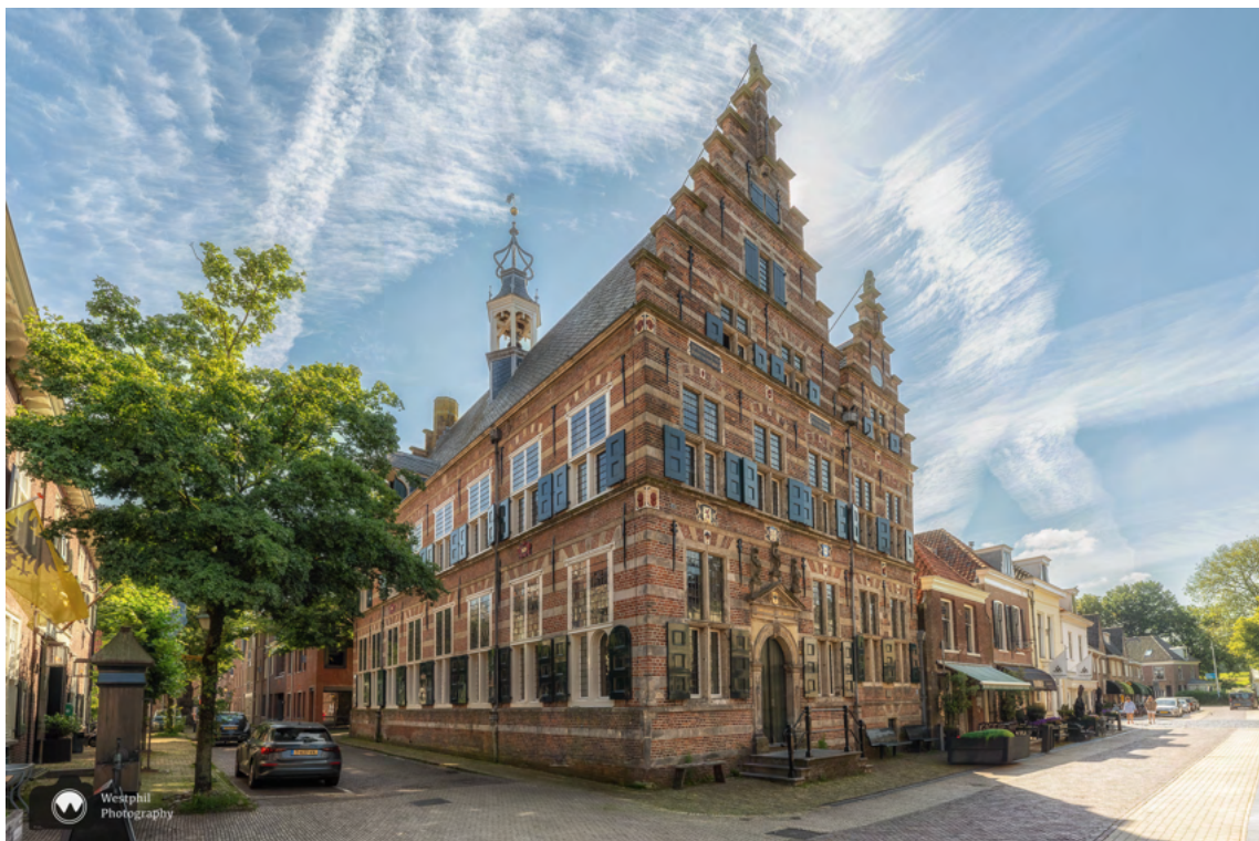
Het stadhuis van Naarden.

Van 1 april tot 1 oktober is het gebouw in het weekend vrij te bezoeken. Op zaterdag en zondag ben je van harte welkom tussen 11.00 - 17.00 uur. Mocht er een huwelijk plaatsvinden dan is het gebouw tijdelijk gesloten.