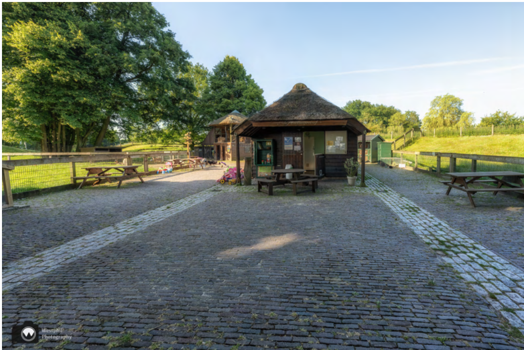
Kinderboerderij de Pluimgraaf.

We wandelen langs Kinderboerderij de Pluimgraaf. Het is een bijzondere plek voor een kinderboerderij. De schapen en geiten grazen op de vestingwallen en een bunker uit de eerste wereldoorlog doet dienst als geitenstal. Wij maken even een foto en nemen een kijkje bij de volière, waar we een goudfazant ontdekken. Daarna vervolgen we de route.