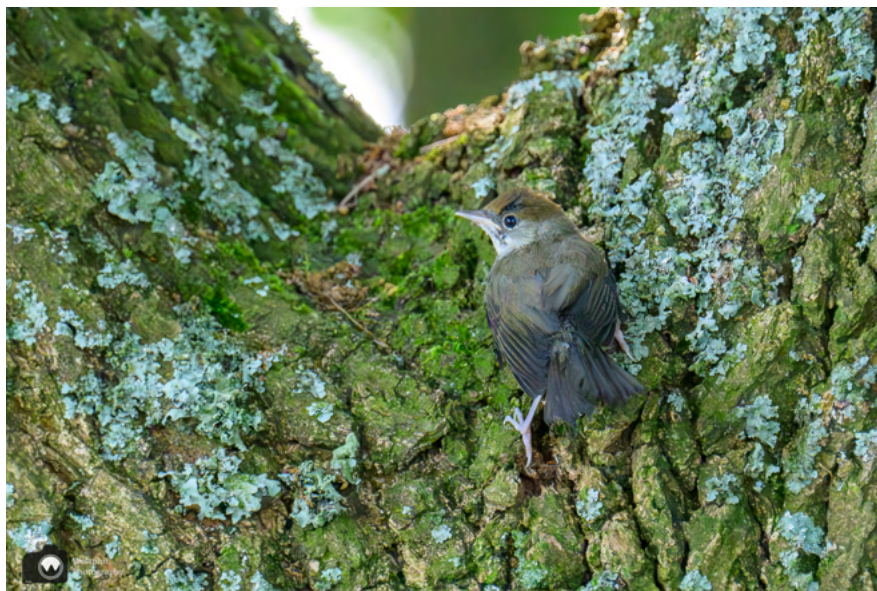
Op een boom zien we deze jonge zwartkop zitten.

Buiten de vesting van Naarden bevindt zich een groot parkeerterrein, waar deze wandeling begint. Als wij aankomen rijden is er nog genoeg ruimte om te parkeren. Het is raadzaam om in het weekend vroeg te komen want de vesting van Naarden is prachtig en dat willen natuurlijk meer mensen zien!