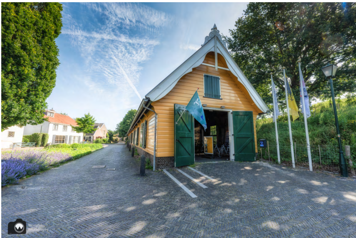
De gele loods, het bezoekerscentrum van Vesting Naarden.

We wandelen langs de gele loods waar het bezoekerscentrum van Vesting Naarden is gevestigd. Wandel gerust even naar binnen om de tentoonstelling te bekijken, of om je op te geven voor één van de vele activiteiten.