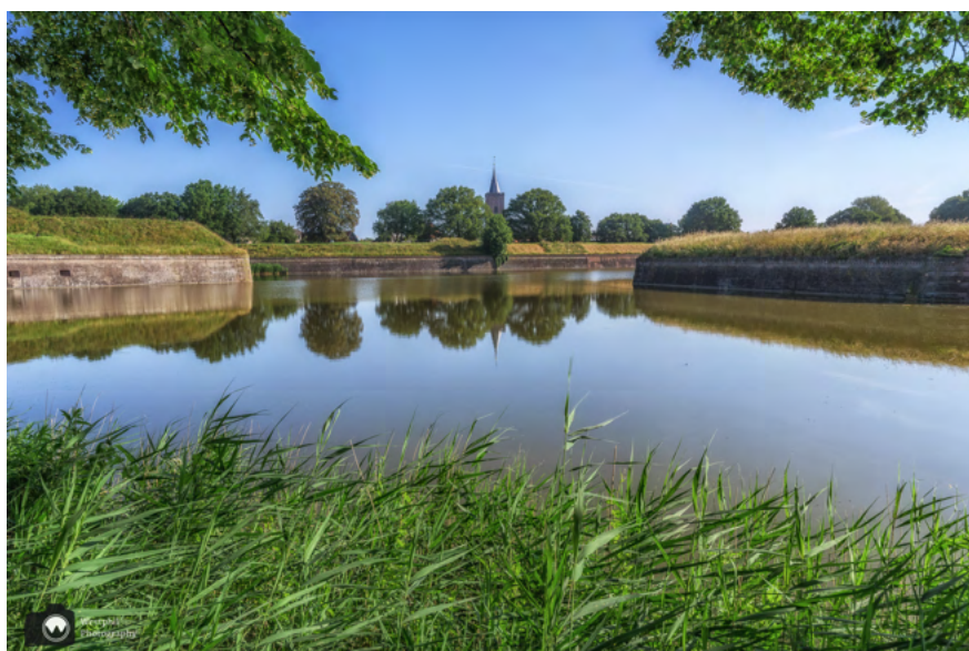
Vanaf het fietspad hebben we uitzicht op de spiegelend gracht met bastions en in de verte de Grote kerk in het centrum.

We starten de wandeling langs de buitenste stadswal. De eerste 500 meter van de route wandel je op de terugweg nog een keer, maar dat is helemaal niet erg. Je kunt ervoor kiezen om op de heenweg bovenlangs de wal over het voetpad te wandelen en op de terugweg onderlangs het fietspad, of andersom natuurlijk. Wij kiezen voor het wandelpad, maar lopen ook af en toe naar beneden om een foto te maken. Vanaf boven heb je meer uitzicht op de buitenste gracht en vanaf onder zie je alvast wat van de bastions: vooruitgeschoven posten in verdedigingswerk gebouwd in de 17 e eeuw.