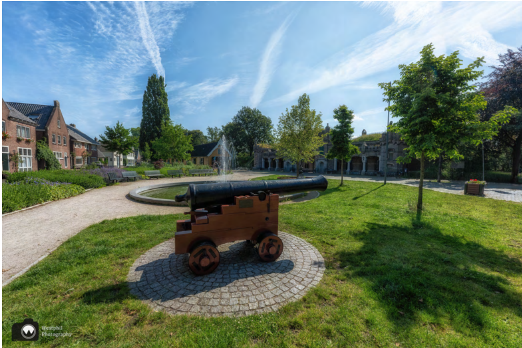
Het Ruijsdaelplein, met de gele loods, de Utrechtse poort, een fontein en een kanon.