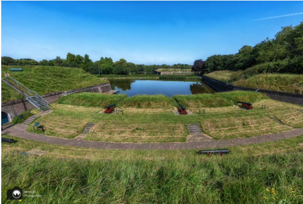
Het museum terrein.

Buiten op het bastion staan historische artillerie kanonnen uit de 17e tot 19e eeuw. Met sommige exemplaren worden nog demonstraties gegeven. Vanaf het bastion hebben bezoekers uitzicht over de vestingwerken. Onder een afdeklag van zo'n vijf meter aarde, bevinden zich zes kazematten met kanonkelders waar vroeger geschut stond opgesteld. Door de isolerende aardlaag is het er in de zomer koel en in de winter warm.