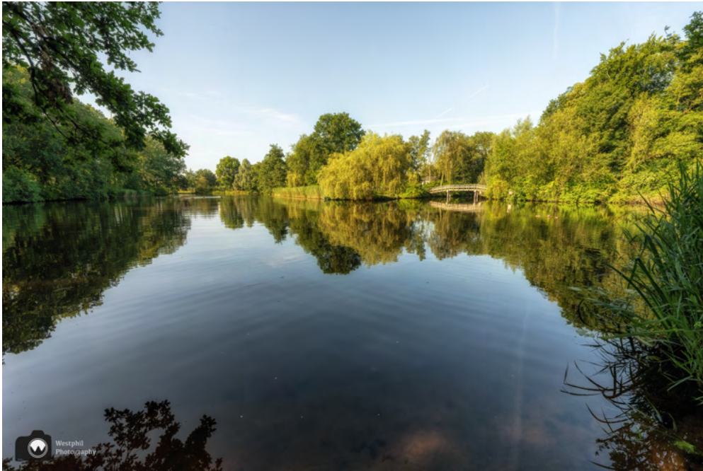
Als je heel goed kijkt zie je in de verte mensen zwemmen.

We zien vrouwen zwemmen in de gracht en verderop is een soort strandje. We kijken onze ogen uit en maken weer overal foto's van.