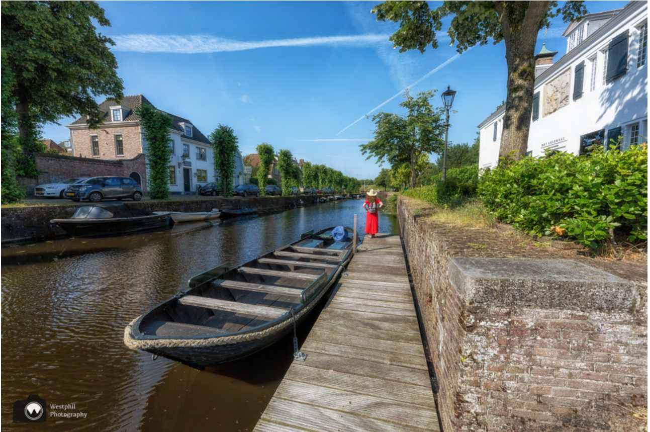
Je kunt ook een vaartocht maken om de vesting.

We wandelen verder langs het water en passeren een bruggetje. Aan de overkant van de brug lopen we verder langs de Oude Haven. Een mooie straat waar geen auto's geparkeerd staan en waar kleurrijke bootjes in de gracht liggen.