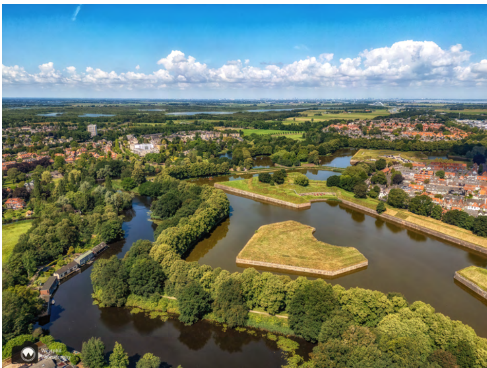
Er is een deel van de stervorm te zien.

Tot onze verbazing, mogen we met de drone de vesting fotograferen, alleen mag de drone niet te hoog vliegen. Adriaan laat de drone vliegen op een plek waar niet zoveel bomen staan zodat we ook een foto van de bastions, wallen en grachten hebben vanaf boven. Ondertussen wacht ik totdat hij klaar is.