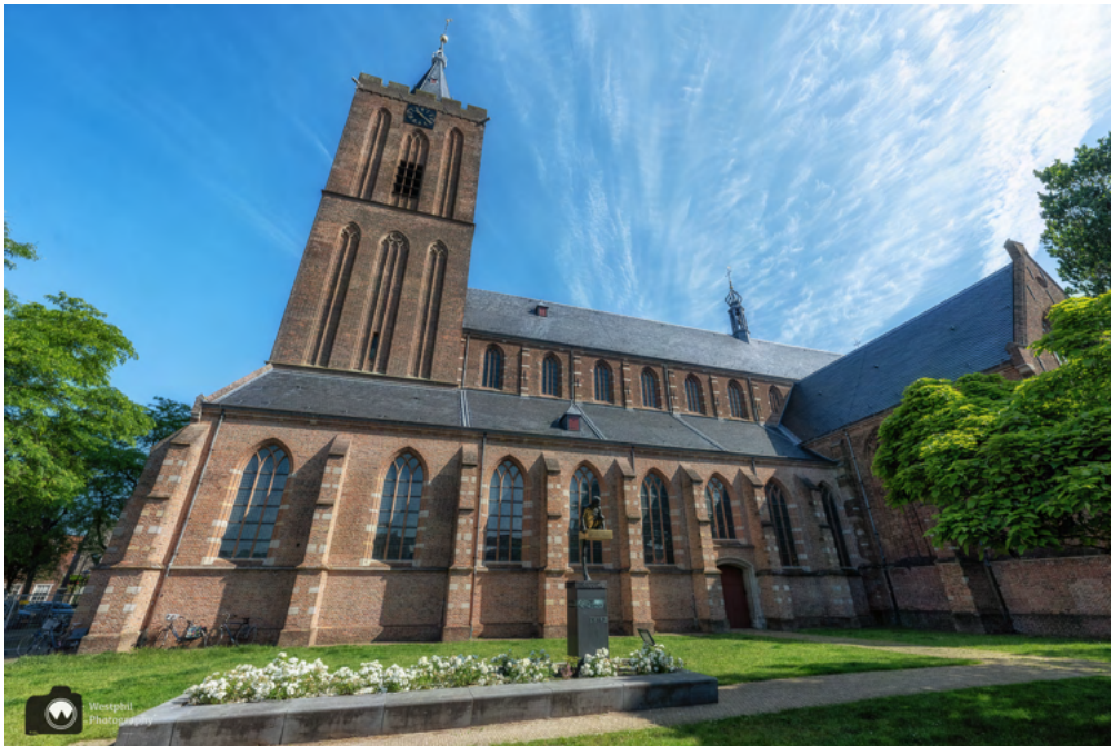
De kerk past bijna niet op de foto.

Als wij langs de kerk wandelen is er een kerkdienst aan de gang dus kunnen we de kerk niet van binnen bekijken. Normaal gesproken is het schip (de hoofdruimte van de kerk) en de zijbeuken (de ruimtes die evenwijdig aan de hoofdruimte lopen) te bezoeken.