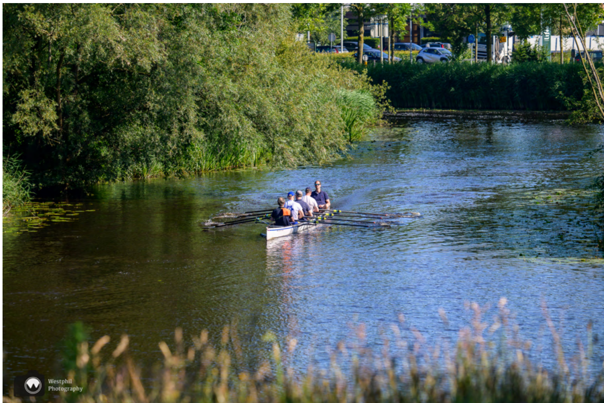
Zal je het merken dat je om een ster vaart?

Op het water is het nu drukker dan vanochtend. Zo zien we mensen fanatiek roeien.