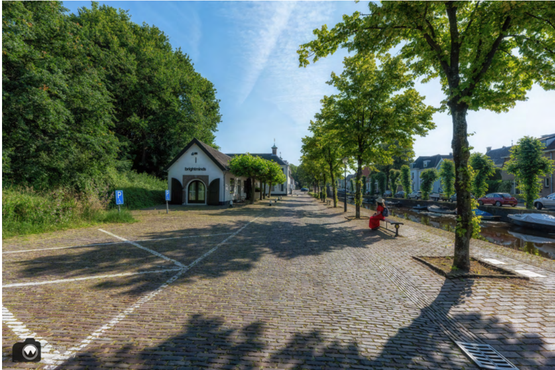
Even zitten op de bankjes langs de Nieuwe Haven.

Vervolgens wandelen we langs de Nieuwe Haven en Het Arsenaal.