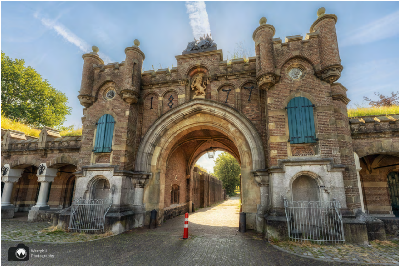
De Utrechtse poort.

De wandeling is nog lang niet afgelopen. Alhoewel als je haast hebt kun je onder de Utrechtse poort doorlopen en voordat je het weet ben je terug op het parkeerterrein. Wij blijven de blauwe pijlen volgen binnen de vesting.