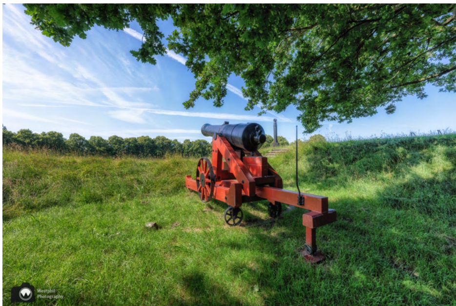
Eén van de kanonnen.

Buiten op het bastion staan historische artillerie kanonnen uit de 17e tot 19e eeuw. Met sommige exemplaren worden nog demonstraties gegeven. Vanaf het bastion hebben bezoekers uitzicht over de vestingwerken. Onder een afdeklag van zo'n vijf meter aarde, bevinden zich zes kazematten met kanonkelders waar vroeger geschut stond opgesteld. Door de isolerende aardlaag is het er in de zomer koel en in de winter warm.