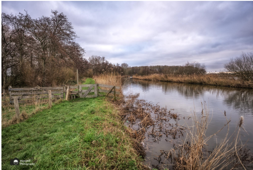
Het opstapje en het hobbelige paadje.

Verderop komen we een man tegen met een hond. Ik vraag aan hem of hij de hond over het opstapje gaat tillen, maar de man doet gewoon een rondje en gaat niet langs het schapenpaadje, waar volgens hem al drie jaar geen schapen staan.