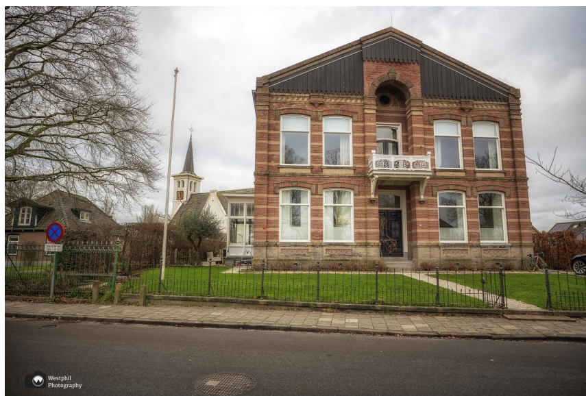
Daar is het witte kerkje weer.

Hauwert is geen groot dorp en voordat we het weten zien we het witte kerkje weer en zijn we terug bij de auto.