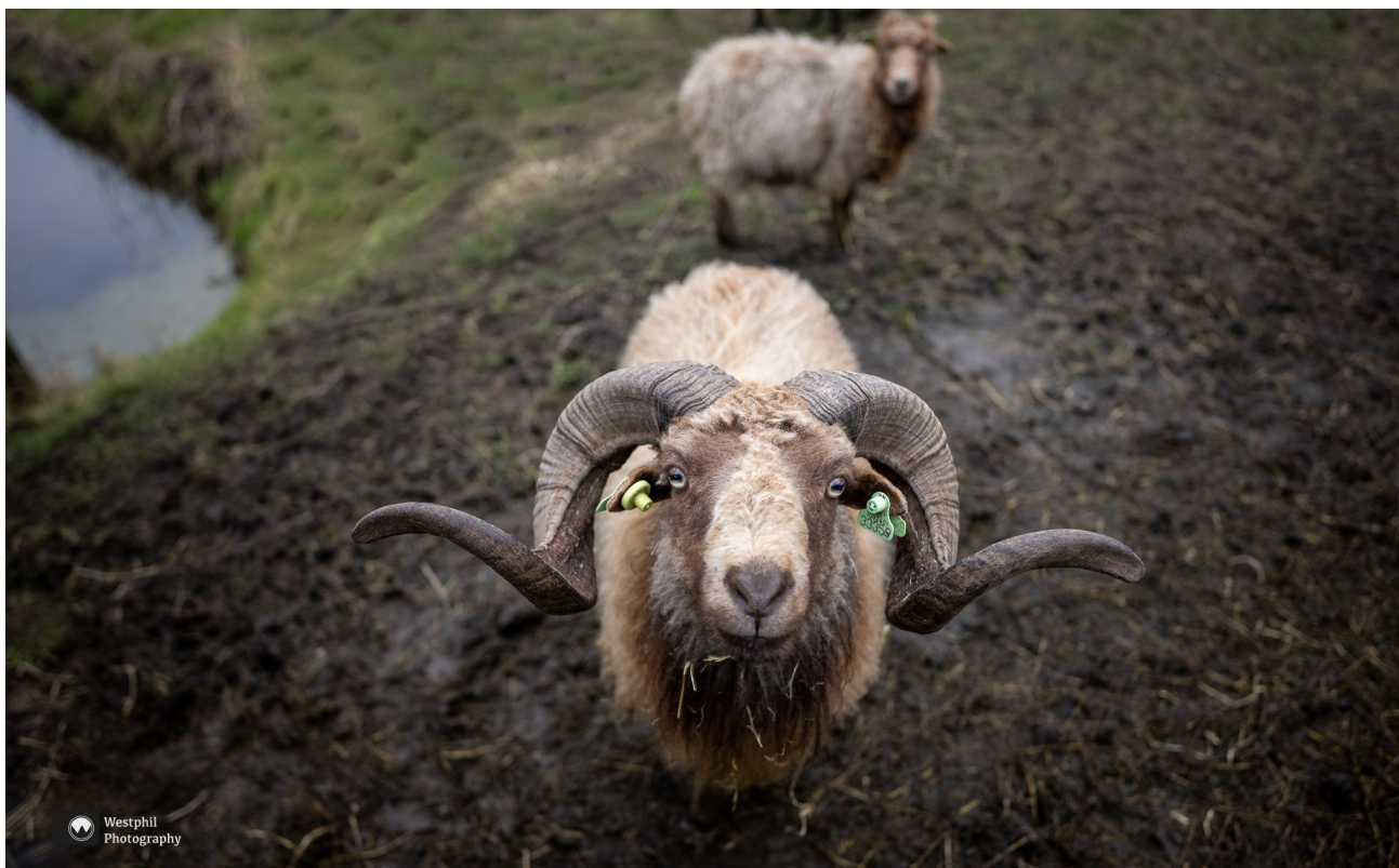
Wat een mooie hoorns.

Aan het einde van de weg slaan we rechtsaf richting Hauwert. We komen niet meteen in het dorp uit en even zijn we bang dat we de laatste kilometers langs een kale weg moeten lopen. Gelukkig wordt de weg verderop veel leuker en kom je door het dorp Hauwert waar van alles te zien is. Ook hier ontdekken we nog iets leuks: Een koolveldje, met een fruitboomgaard en hele leuke schapen.