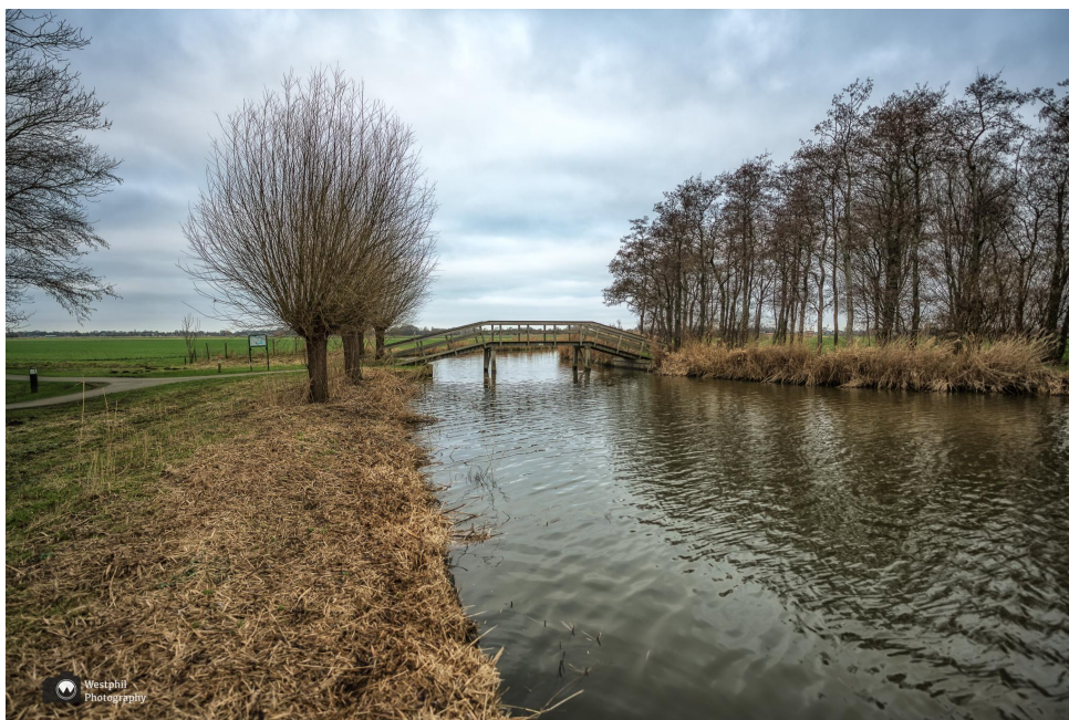
Eén van de vele bruggetjes.