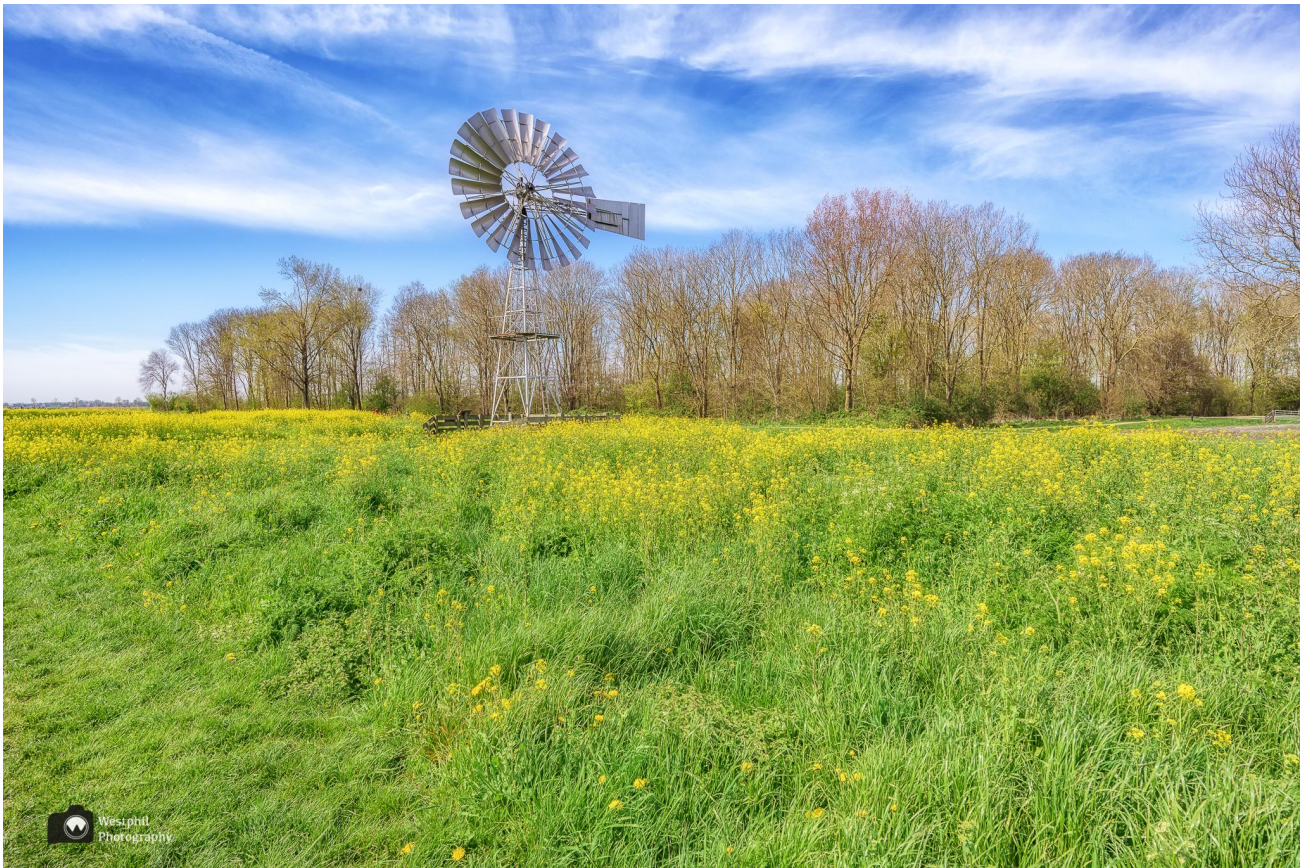
De Amerikaanse windmotor in de lente.

De Amerikaanse windmotor is een windmolen die werd gebruikt bij het beheersen van het waterpeil. Met behulp van de windmotor werd water van een lager niveau naar een hoger niveau gezet, of andersom. Dit type molen is in Nederland in de eerste helft van de 20e eeuw veel gebruikt voor de bemaling van kleinere polders.