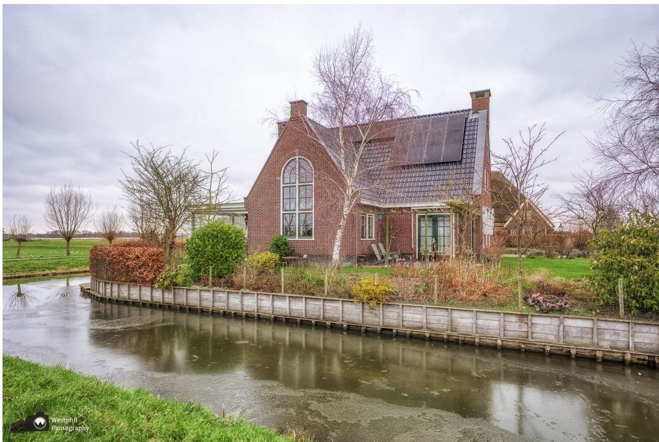
Mooi plekje om te wonen.