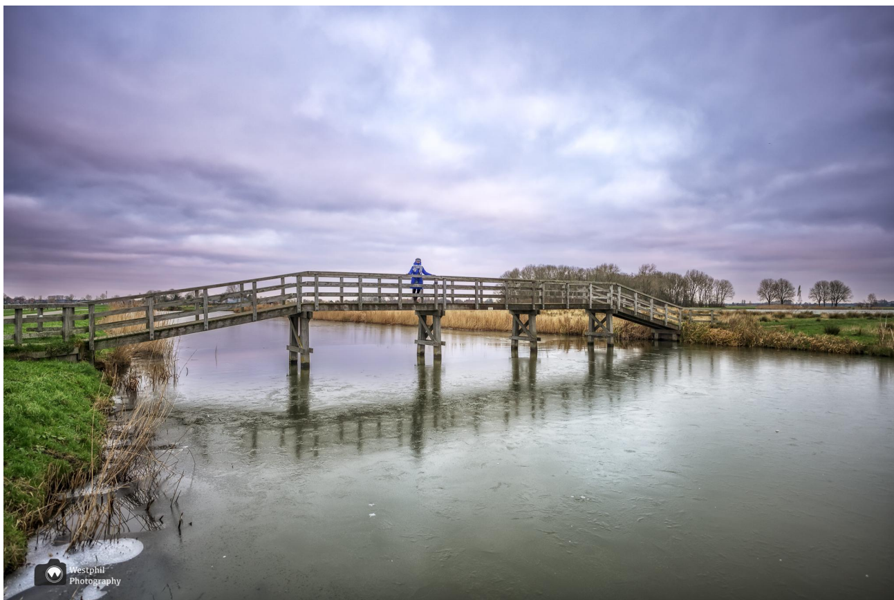
De brug naar het Egboetswater.

Er zijn ook delen met struiken, bomen, vermolmden stammen met paddenstoelen en mos. Er wonen kriebelbeestjes, zangvogels en konijnen, maar ook uilen en andere roofvogels.