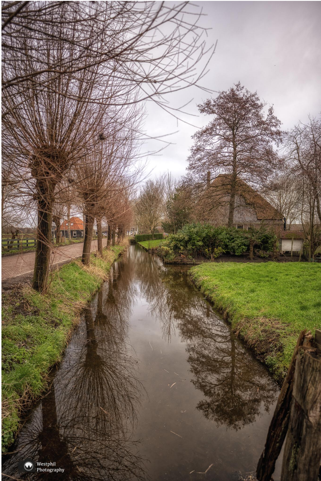
Er is niet veel te zien van het mooie huis.