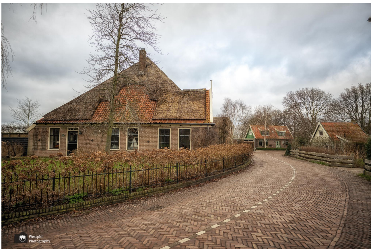
Mooi plekje in Hauwert.

Als we een huis met knotwilgen en een slootje aan het fotograferen zijn fietst er een man langs. Hij vraagt wat we aan het doen zijn. Ik leg uit dat we een foto maken van de sloot met de spiegelende knotwilgen en het huis. De man zegt trots: “Dat is mijn huis!” Ik vergeet helemaal te vertellen dat de foto van zijn huis in het ommetje van de maand komt, maar misschien ontdekt hij het zelf wel.