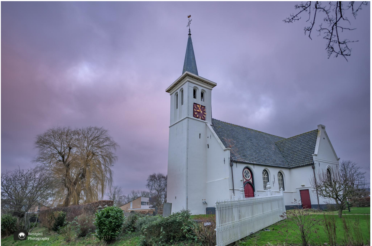
De Nicolaaskerk is een blikvanger

Na lang zoeken hebben we weer een dorpje gevonden waar we nog nooit geweest zijn en je kunt er nog wandelen ook. We vertrekken richting het startpunt in Hauwert . Als we het dorp inrijden valt meteen het witte kerkje op. Het is nog vroeg en de lucht achter de kerk kleurt een beetje roze. We springen snel uit de auto voor een foto.