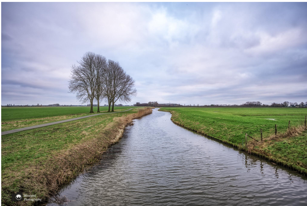
Deze bomen houden niet heel veel wind tegen.

Na een tijdje komen we uit bij een hek met een opstapje dat leidt naar een heel hobbelig paadje. Het paadje is totaal niet geschikt voor nette schoenen of een rollator, maar dat hadden we al in de routebeschrijving gezien. Omdat je over boerenland loopt mag je hier niet met een hond komen. De schapen hebben echter vrij vandaag en wat later blijkt al een paar jaar. Wel zien we een haas wegrennen en dat vinden we eigenlijk nog leuker.