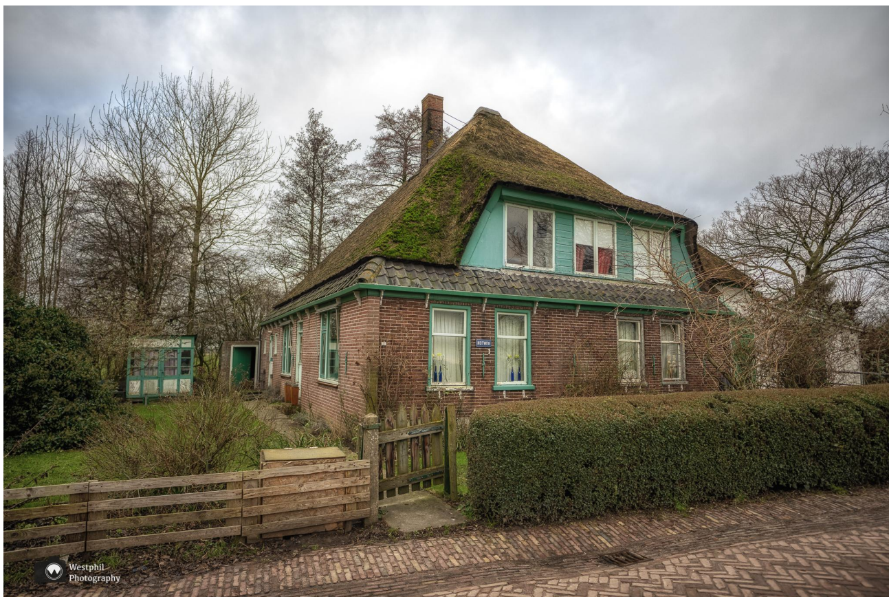
Prachtig hè zo'n oude boerderij

Het is niet helemaal zeker wanneer Hauwert is ontstaan, maar men denkt tussen 950 en 1050. De plaatsnaam komt sinds de 15e eeuw voor als 'Hauwaert'. Van oorsprong heet het eigenlijk 'Bokswoude'. In het dorp zijn boerenbedrijven, bollenbedrijven en fruittelers gevestigd. Wij vinden zo'n dorp met boerderijen en vrijstaande huizen wel leuk en kijken onze ogen uit!