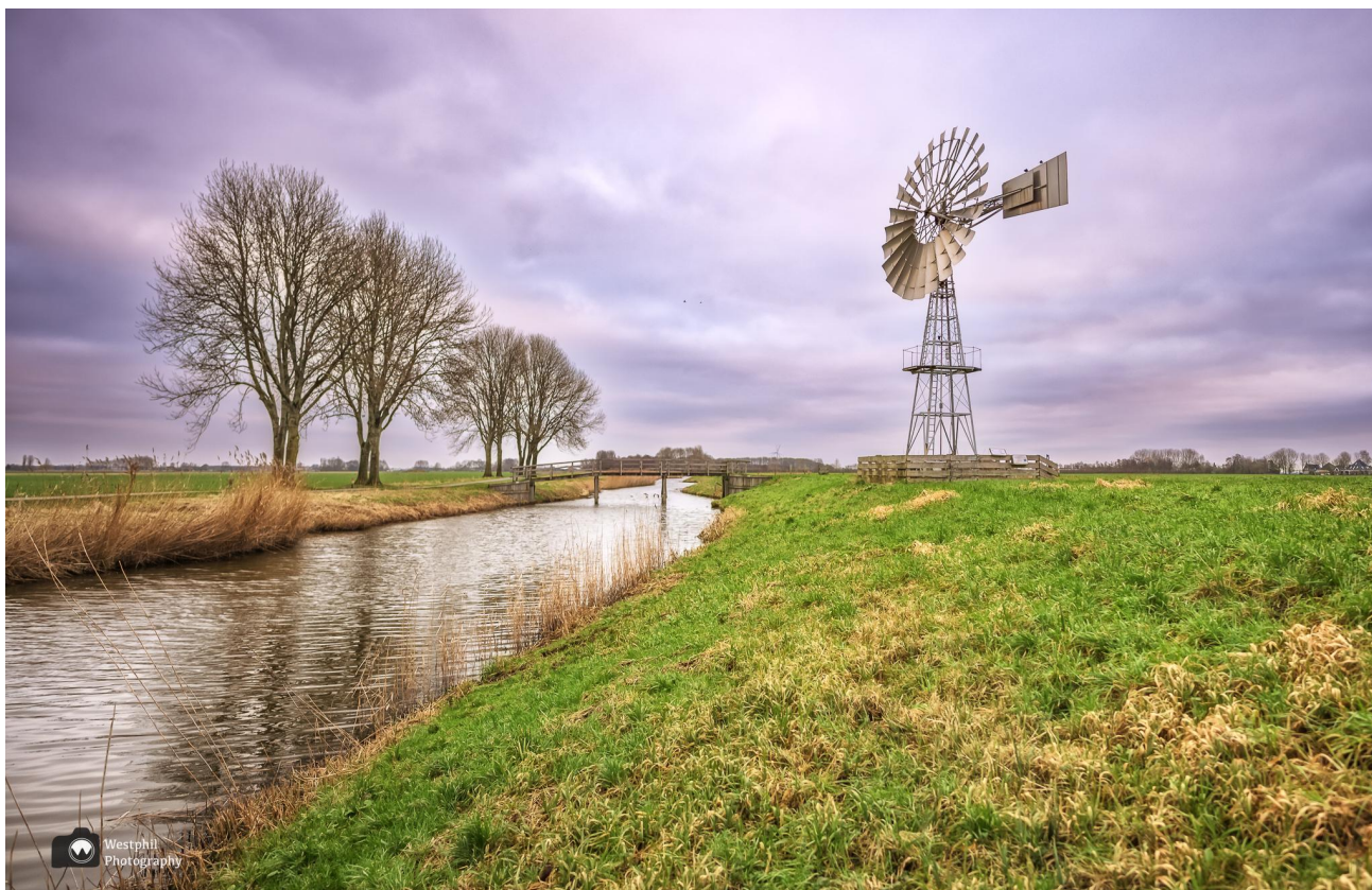
De Amerikaanse windmotor in de winter.

De windmotor is eigendom van de Stichting Molen Sluispolder en is niet meer maalvaardig . De windmotor stond aan de rand van het Egboetswater, maar toen in 2009 dit natuur- en recreatiegebied met ca. 22 ha werd uitgebreid, kwam de motor in het Egboetswater te staan.