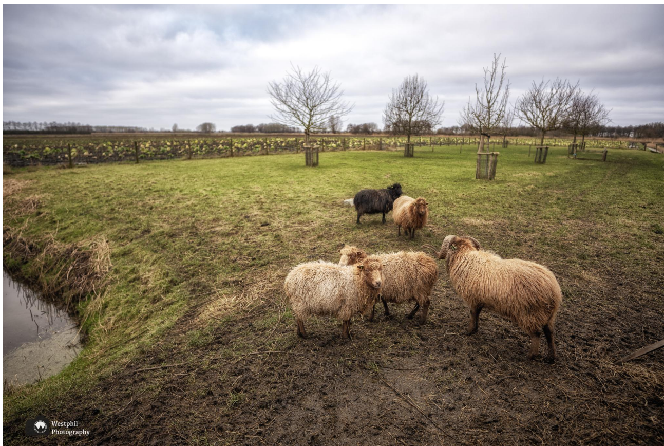
De schapen, boomgaard en het koolveldje.