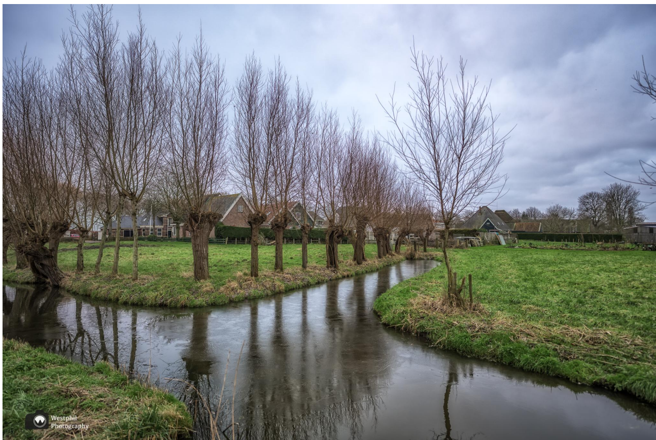
Het rijtje spiegelende knotwilgen.

Voordat we op pad gaan, steken we over voor een foto van een boerderij met een rijtje knotwilgen die we aan de overkant van het startpunt zien staan.