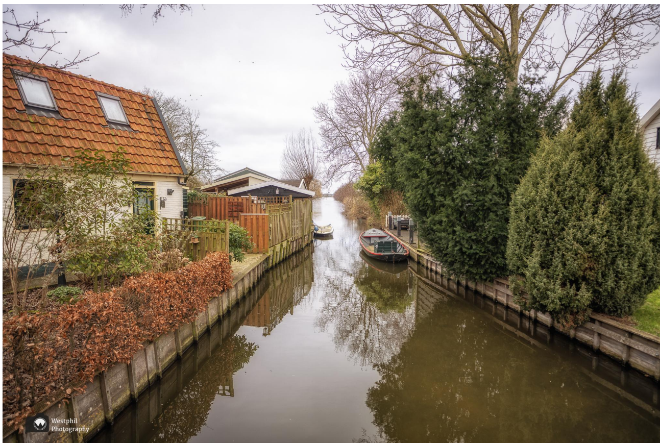
We passeren de Papenveersloot.