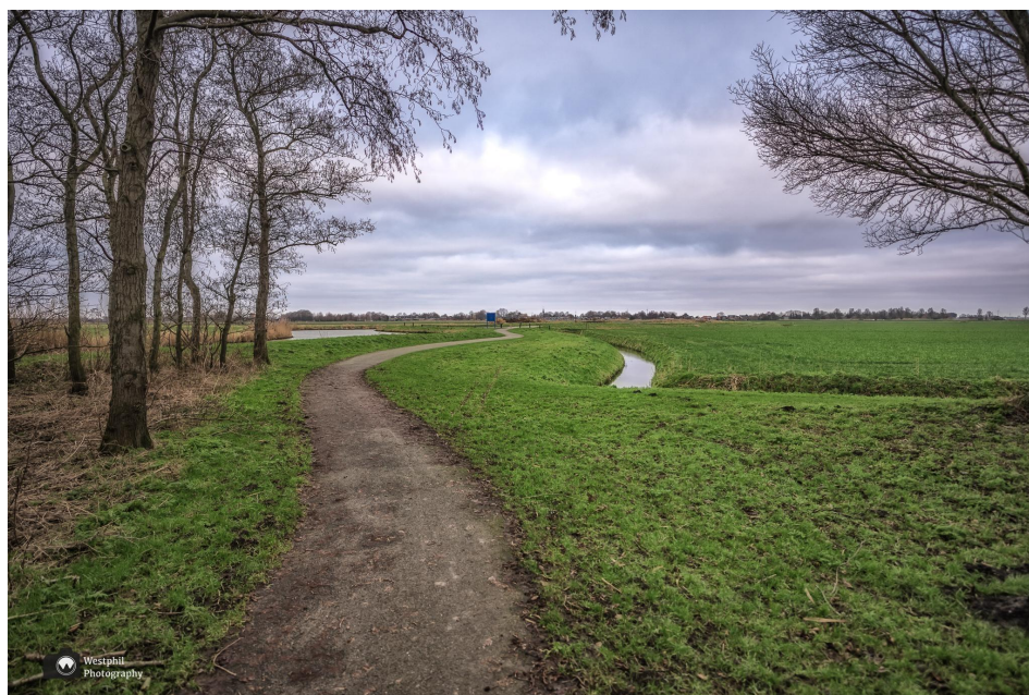
Eén van de vele paadjes door het recreatiegebied Egboetswater.

Na een heel stuk langs het water, de Boxweide, wandelen we een brug over langs een parkeerplaats. Bij dit startpunt Egboetswater kun je ook de auto parkeren voor deze route. Er Starten ook nog andere wandelingen van Wandelnetwerk Noord-Holland.