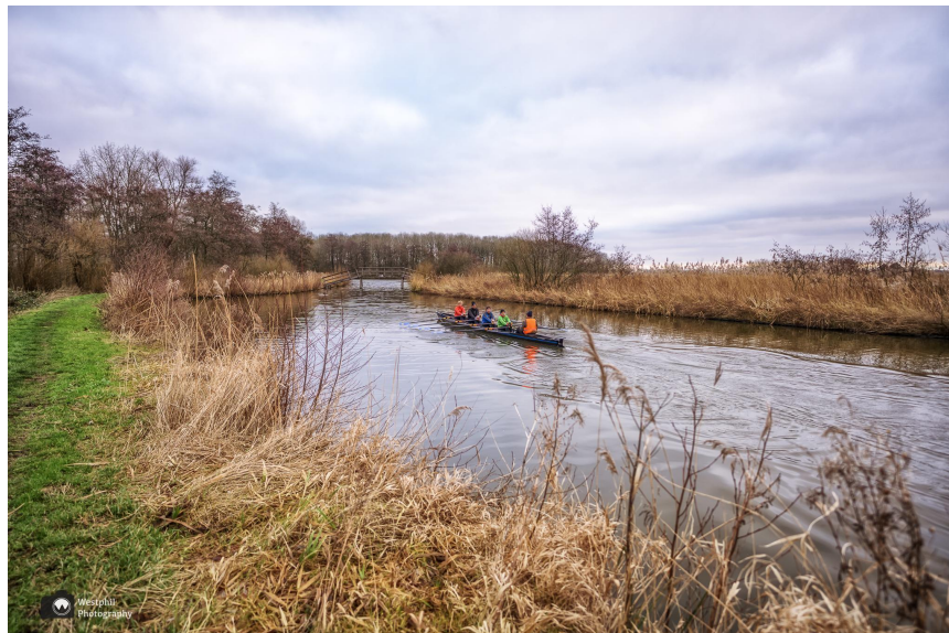
Er kwam een kano langsvaren.

Verderop komen we een man tegen met een hond. Ik vraag aan hem of hij de hond over het opstapje gaat tillen, maar de man doet gewoon een rondje en gaat niet langs het schapenpaadje, waar volgens hem al drie jaar geen schapen staan.