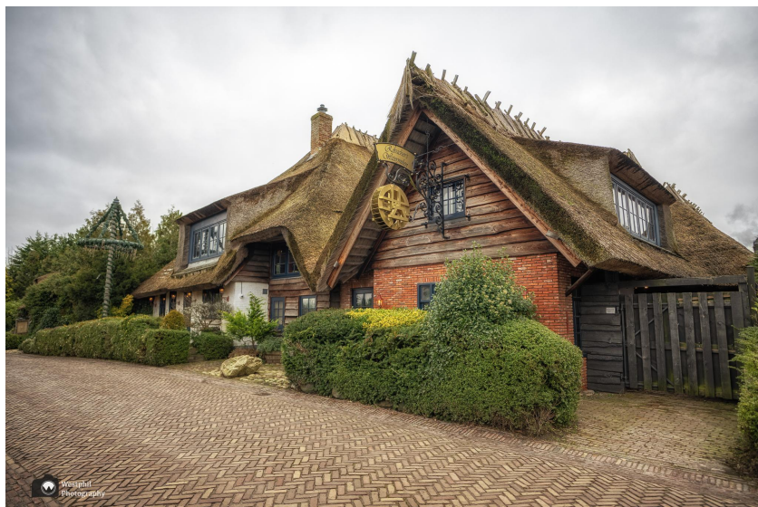
De Robacher Watermolen een trouw- en feestlocatie.

We lopen langs nog veel meer mooie huizen en maken nog een paar foto's. Dan wandelen we langs landgoed de Robacher Watermolen. Het landgoed heeft een lange historie. Van boerderij naar meubelmakerij en tegenwoordig is het een trouw- en feestlocatie. Het ziet er heel gezellig uit. Ik zou er best een feestje willen geven!