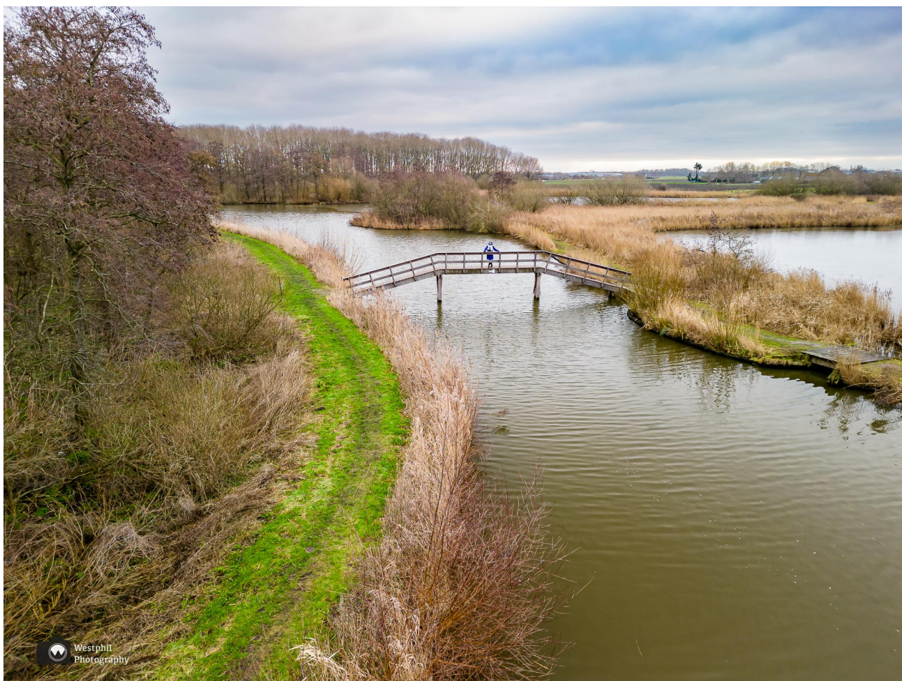
Mooi plekje om te dronen.

We bergen de drone weer op en lopen weer braaf achter de pijlen aan. Je kunt als je haast hebt ook gewoon rechtdoor langs het water blijven lopen, maar wij volgen de route met alle leuke omwegen over verschillende soorten bruggetjes.