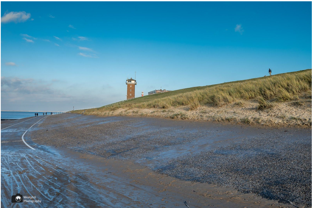
Geen strand maar asfalt.

Het is best een eind rijden helemaal naar de kop van Noord-Holland, maar we hebben er zin in en het zonnetje schijnt. Nadat we de auto op het parkeerterrein hebben gezet is knooppunt 26 snel gevonden. Je kunt hier ook meteen het trappetje naar beneden nemen, maar dan kom je niet langs Fort Kijkduin.