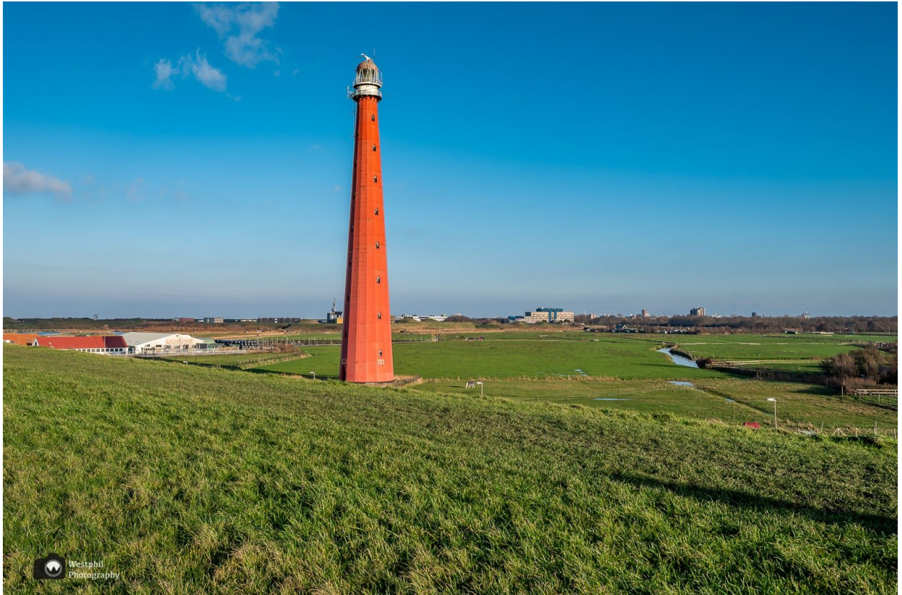
Lange Jaap, de hoogste nog brandende vuurtoren van Nederland.

Als we een stukje gelopen hebben, moeten we naar boven om over de Grasdijk onze weg te vervolgen. We lopen de Grasdijk op en komen langs de vuurtoren de Lange Jaap in Huisduinen. Wat een fantastisch gezicht en wat is hij groot van dichtbij! Bijna 64 meter hoog!