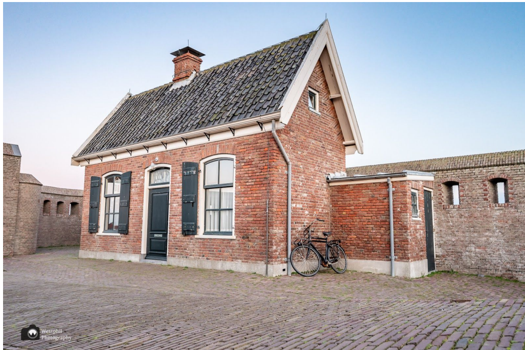
Huisje op het binnenplein van Fort Kijkduin.