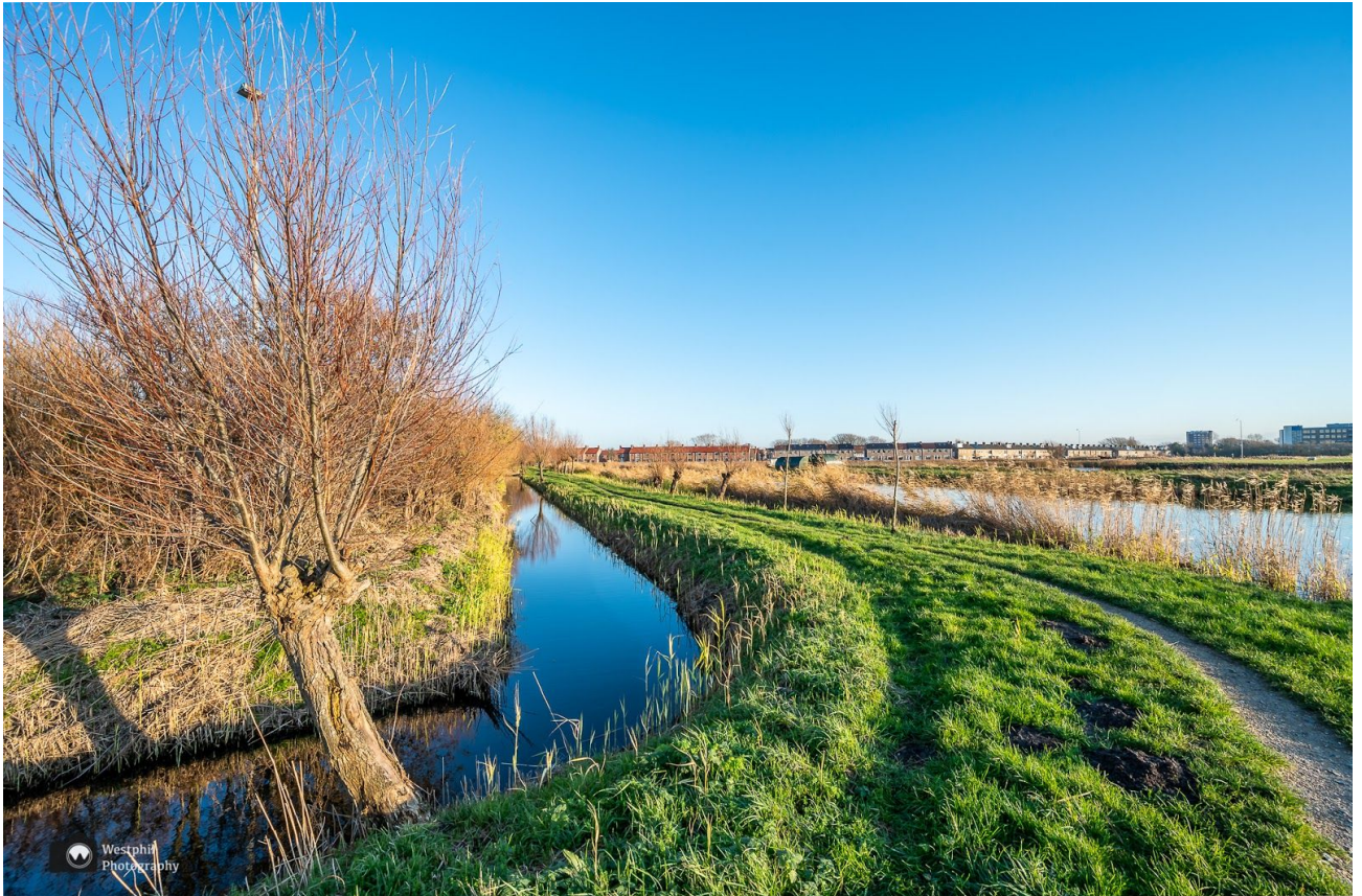
Leuk paadje langs het water

Verder maar weer. We komen uit bij een trappetje en daar verlaten we de dijk. We steken de weg over en vervolgen de route langs een smal grindpaadje. We lopen langs een tennishal met buitenbanen en aan de rechterkant is nog steeds fort Erfprins te bewonderen. We lopen er een rondje omheen. Het is het grootste fort van Nederland, gebouwd in 1807 met een oppervlakte van maar liefst 49 hectare. Napoleon heeft het in 1811 zelf bewonderd!