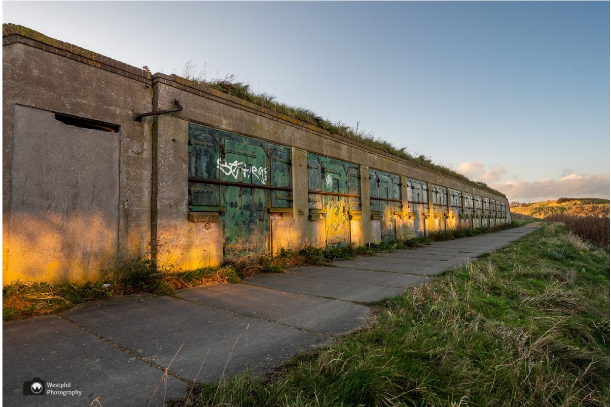
Onderdeel van Fort Erfprins

We wandelen verder langs het water. Links van ons is het Noordwest ziekenhuis en rechts lopen we langs een gedeelte van Fort Erfprins met allemaal deuren, waar vroeger munitie en wapens achter werden bewaard. Daar kunnen wij wel een leuke foto van maken!