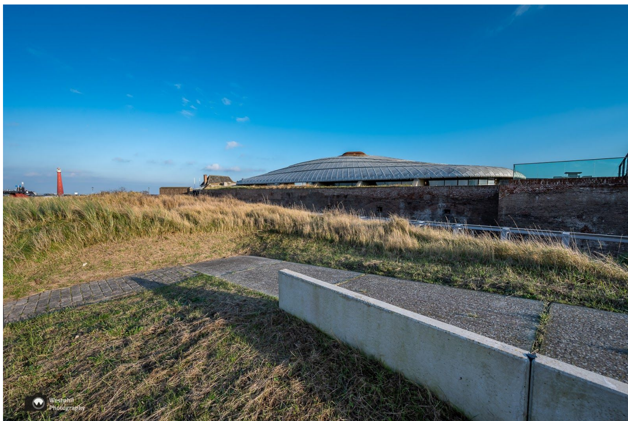
Fort Kijkduin, met op de achtergrond vuurtoren Lange Jaap

Kijk voor meer wandelverhalen op https://www.westphil.nl/wplive/westphil-wandelt/ .