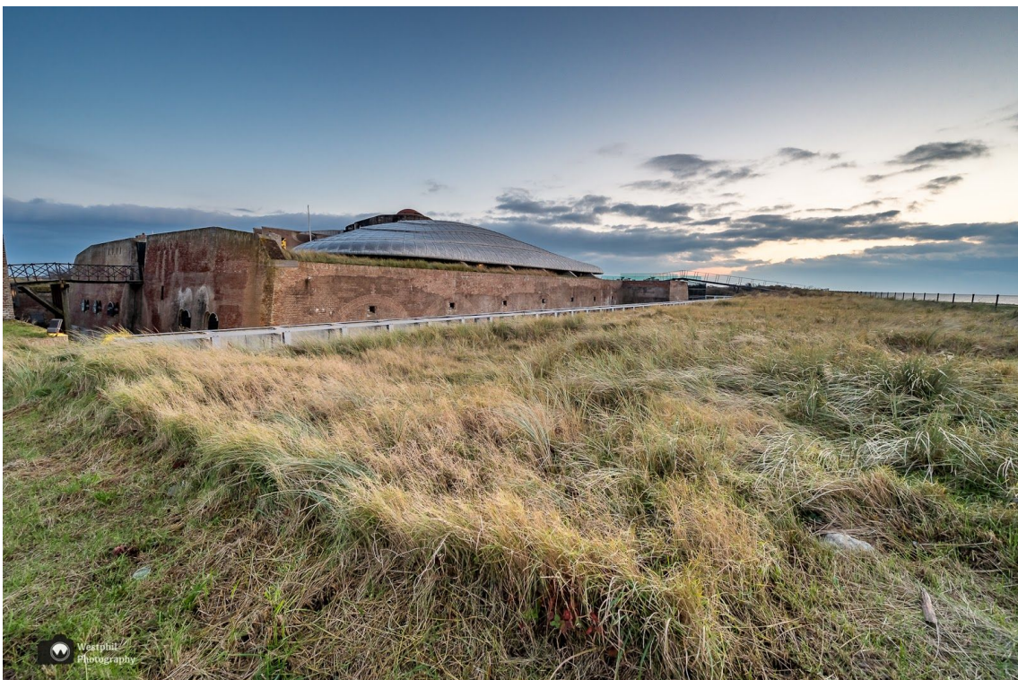
Nog eentje dan, voordat we naar huis rijden.

De route start op de parkeerplaats van Fort Kijkduin, Admiraal Verhuellplein 1, 1789 AX Huisduinen. Afstand: 7,46 km. Je volgt vanaf de parkeerplaats en paarse pijlen en de knooppunten: 26, 25, 29, 16, 17, 23, 22, 24, 27 en 26