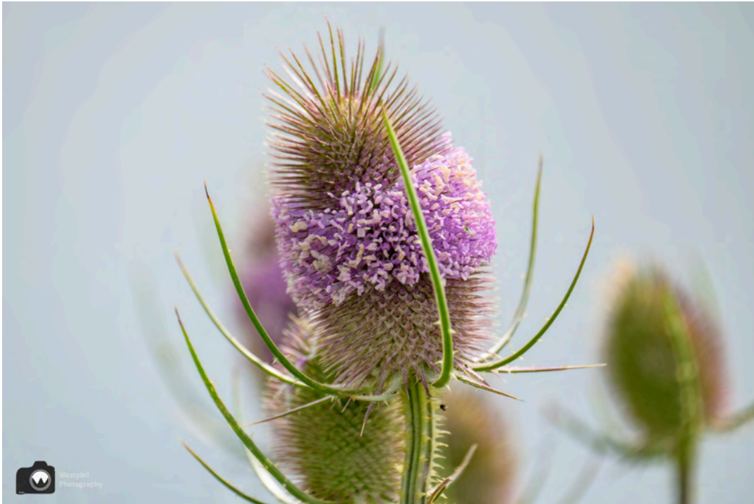
Een grote kaardenbol.

Ondertussen kijken we ook opzij naar de weilanden, want daar rennen drie hazen achter elkaar aan, een prachtig gezicht.