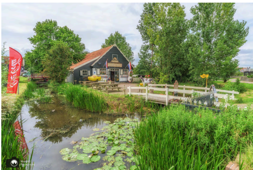
Schoenmakerij De Klomp.

Bij schoenmakerij De Klomp worden de klompen nog net zo gemaakt als vroeger, aangedreven door een authentieke stoommachine. Er worden hier demonstraties gegeven hoe een blok hout omgetoverd wordt tot schoeisel.