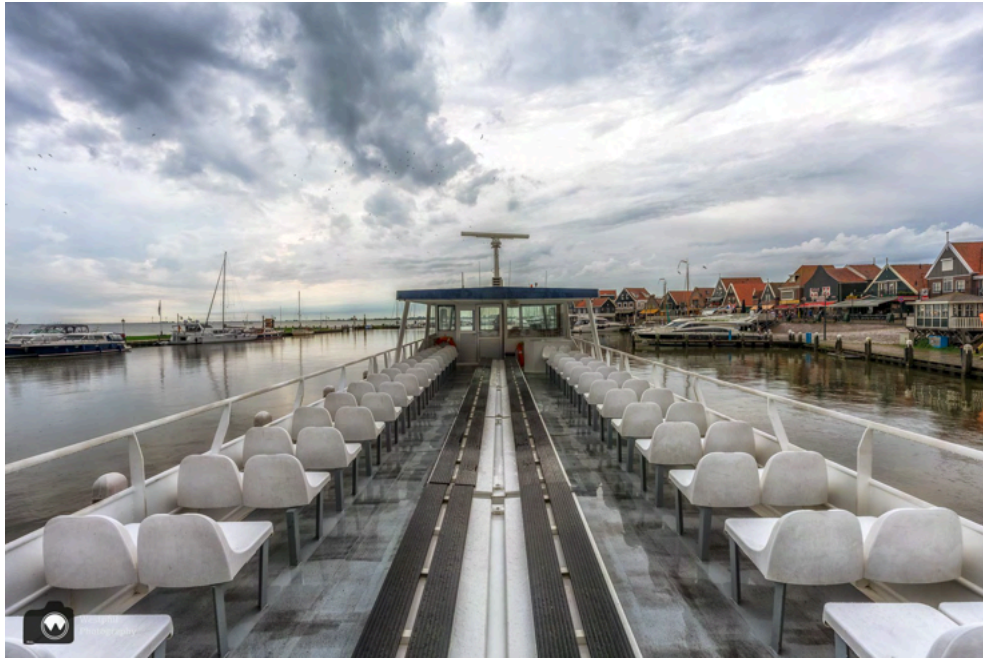
Het bovendeck is kleddernat en daarom nemen we beneden plaats.