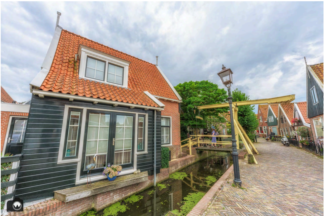
De ophaalbrug in het Doolhof.

Het Doolhof was van grote invloed op de kunstenaars die Volendam vroeger veel bezochten. Mede door de inspiratie die zij hier hebben opgedaan en de kunstwerken die zij destijds maakten, is Volendam wereldwijd bekend geworden.