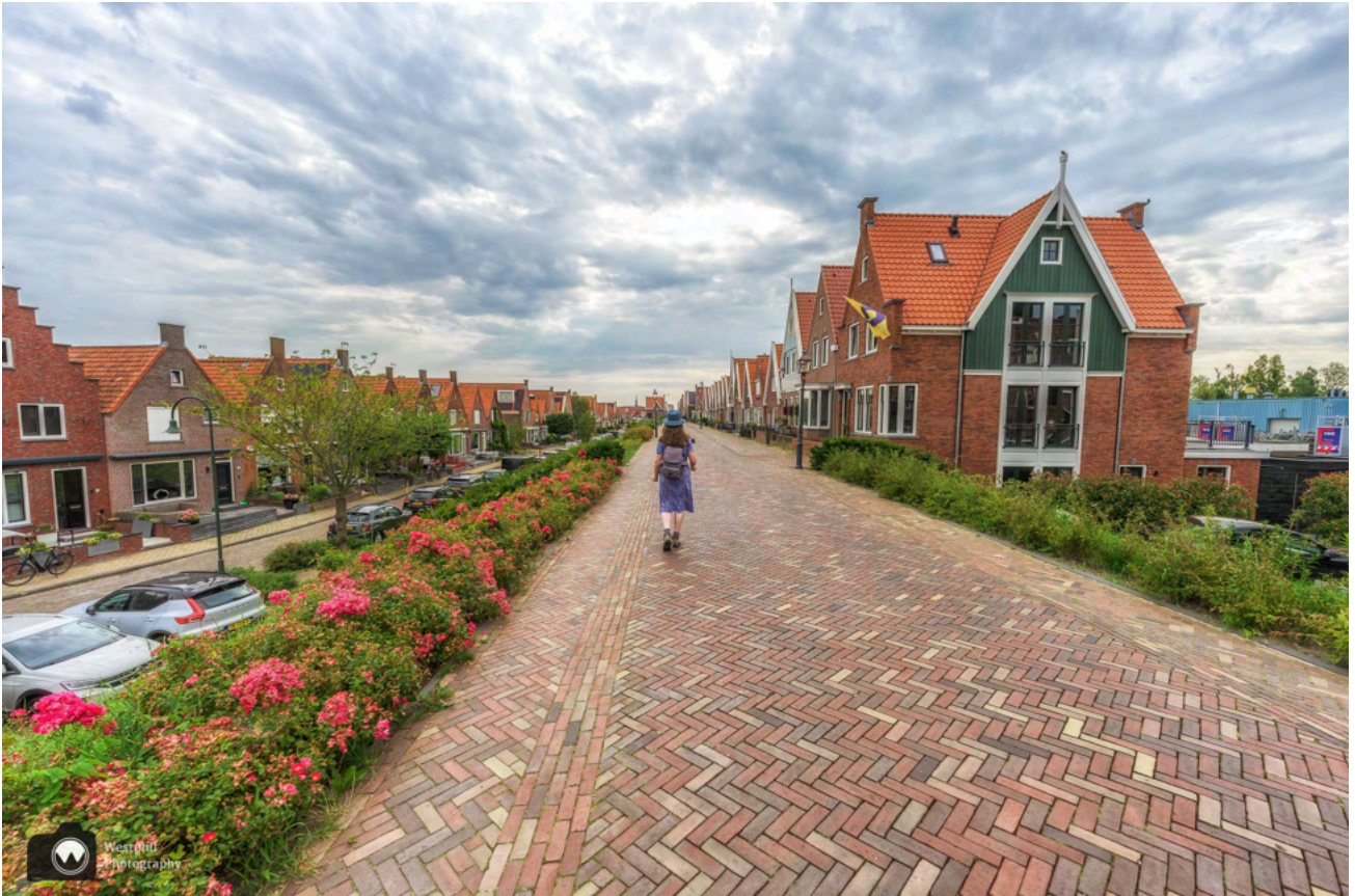
Als je rechtdoor loopt kom je uit in de haven van Volendam, maar wij wandelen eerst door de straten achter de dijk.

Als je in Volendam bent kun je heel makkelijk met de Volendam Marken Express naar Marken varen. De boot vaart iedere dag en vertrekt elke 45 minuten. Het is hartstikke leuk; een stukje wandelen, uitrusten op de boot en daarna verder wandelen op Marken.