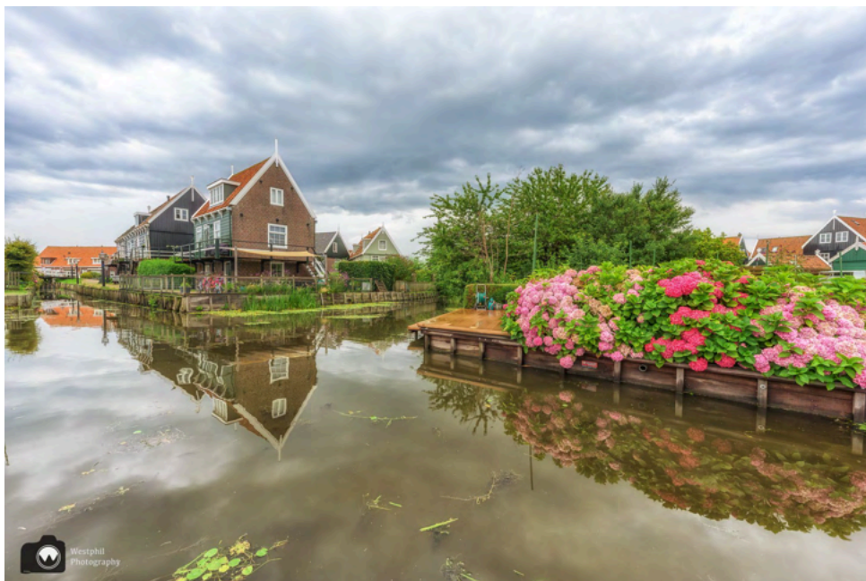
Marken is echt prachtig en heel bloemrijk. Wij waren erg onder de indruk van deze mooie hortensia's.

We hadden beter even kunnen wachten, want als we op de lange rechte weg langs de weilanden richting de vuurtoren wandelen, begint het heel hard te regenen. We trekken onze regenjassen aan en bergen de fotoestellen op. Ik heb vandaag een jurk aan en deze wordt steeds natter, want mijn regenjas is niet lang genoeg. Als we bijna bij de vuurtoren zijn, klaart het ietsje op.