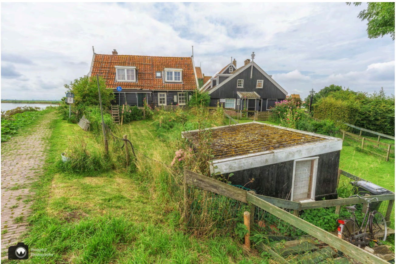
Hier stonden de ijsbrekers.

Als we bijna bij de Rozewerf zijn missen we de markante ijsbrekers in het water. In april 2024 zijn de ijsbrekers door Rijkswaterstaat verwijderd. Om Marken de komende 50 jaar te beschermen tegen hoogwater wordt de dijk om Marken versterkt en verbreed. Bij de Rozewerf staan de ijsbrekers te dicht op de dijk. Daarom moeten ze een eindje opschuiven. Bovendien zit er houtrot in de palen en de liggers waardoor de dijkversterking ook een mooie aanleiding vormt om de ijsbrekers te renoveren.