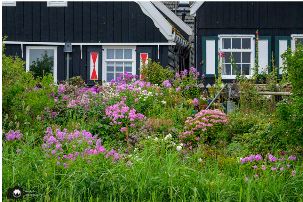
Mooie tuin bij de huizen van de Wittewerf.