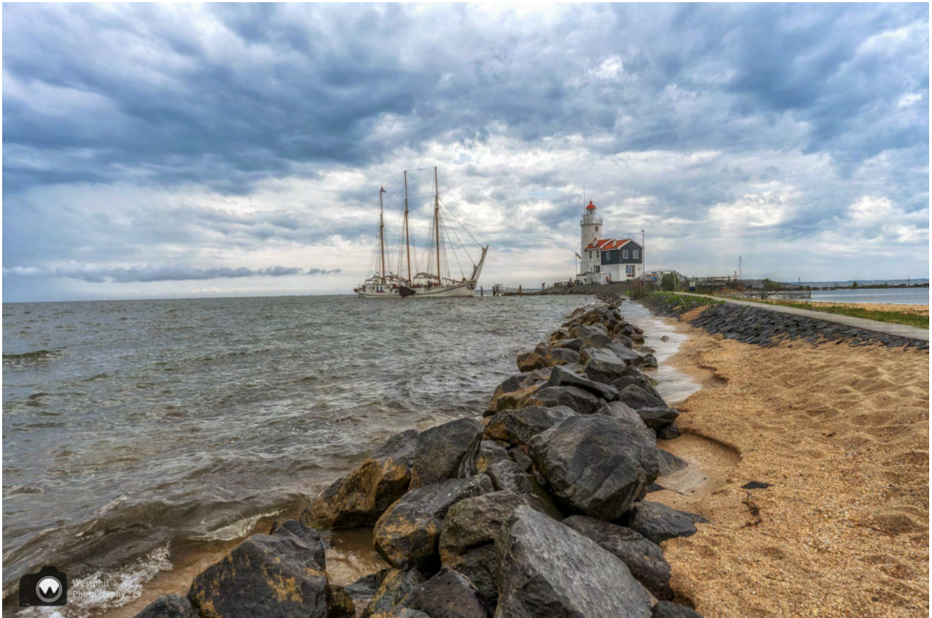
Het paard van Marken met daarnaast Elizabeth een historische klipper.