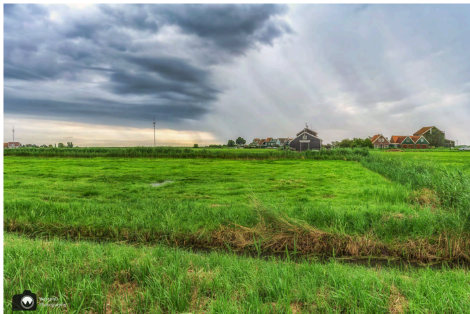
Boven het Markermeer regent het niet.

We hadden beter even kunnen wachten, want als we op de lange rechte weg langs de weilanden richting de vuurtoren wandelen, begint het heel hard te regenen. We trekken onze regenjassen aan en bergen de fotoestellen op. Ik heb vandaag een jurk aan en deze wordt steeds natter, want mijn regenjas is niet lang genoeg. Als we bijna bij de vuurtoren zijn, klaart het ietsje op.