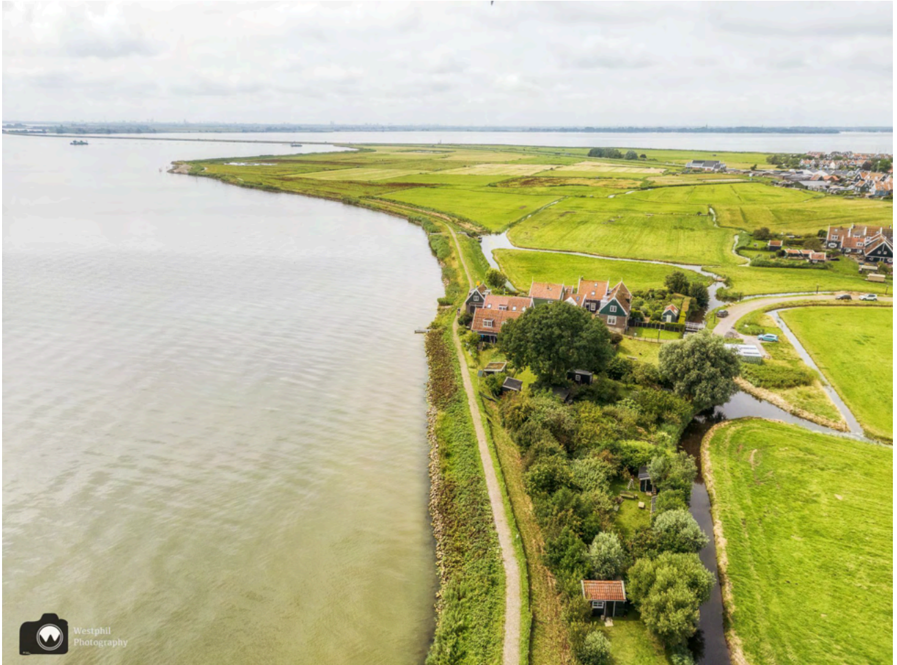
De Rozewerf vanuit de lucht.

Bij wandelkeuzepunt 37 slaan we rechtsaf. Het paaltje staat een beetje verscholen achter een perkje met wilde bloemen en daarom loopt Adriaan er bijna voorbij, maar gelukkig wist ik het nog van de vorige keer.