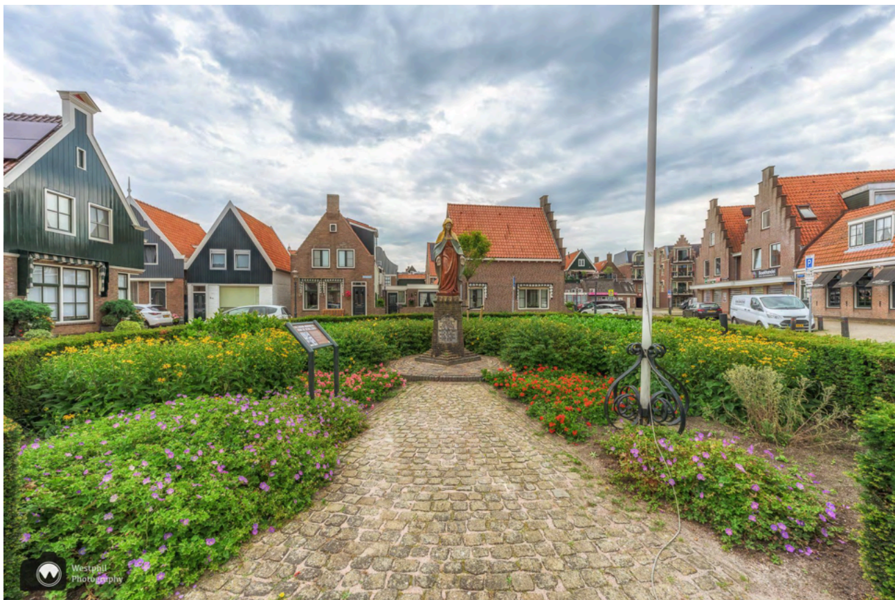
Het monument voor de gevallen.