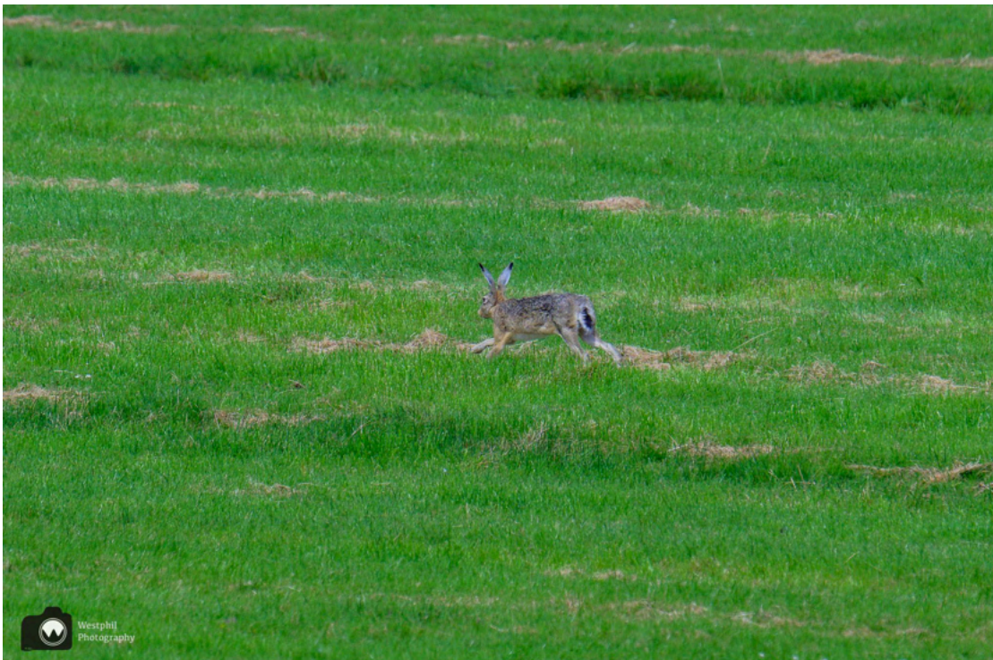
Eén van de hazen.

Ondertussen kijken we ook opzij naar de weilanden, want daar rennen drie hazen achter elkaar aan, een prachtig gezicht.