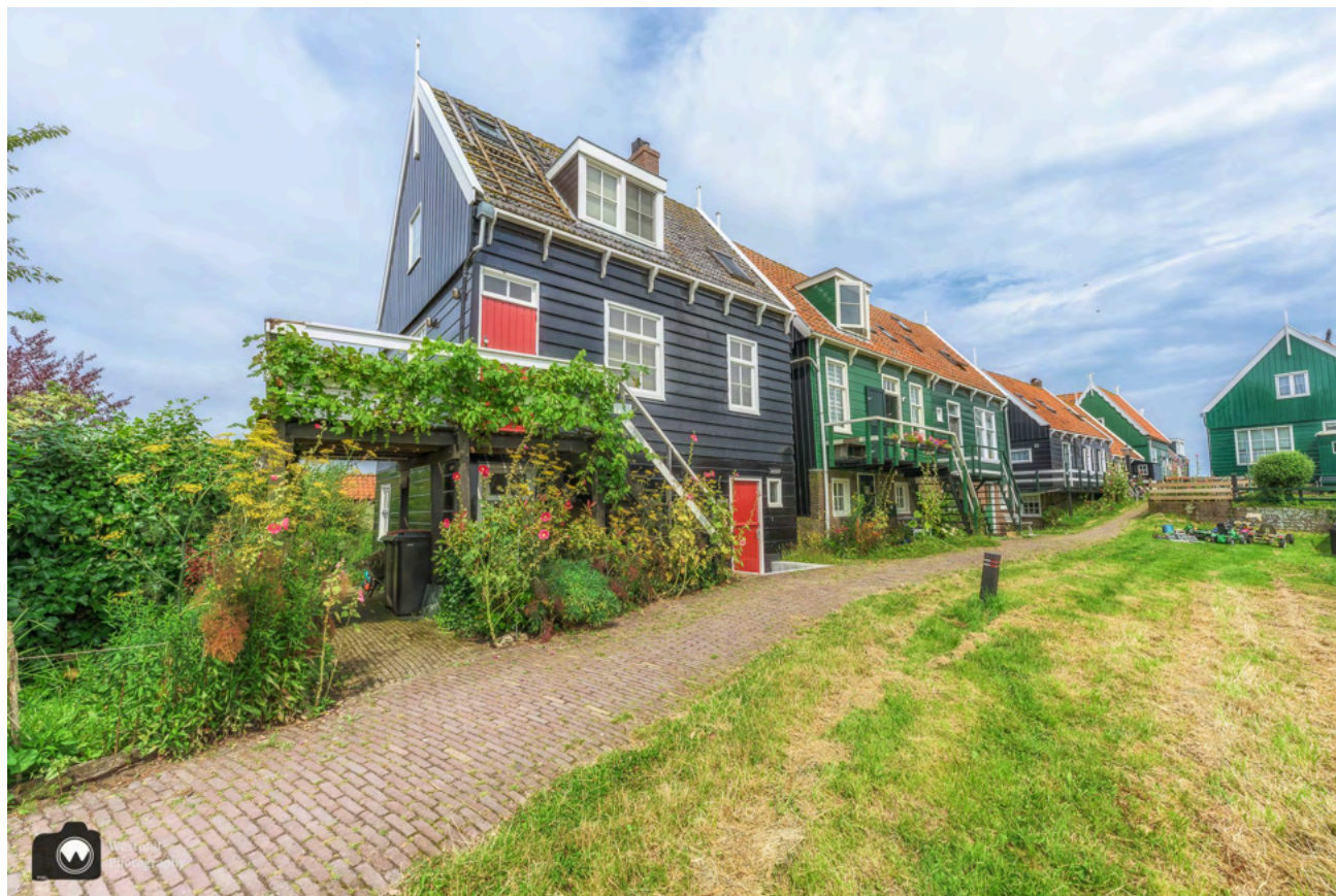
Nog eentje van de Wittewerf.

Daarna wandelen we weer verder door de Wittewerf. Hier staan de huizen iets verder uit elkaar en daarom is het makkelijker om foto's te maken. Overal staan stokrozen in bloei, dit is echt een mooie tijd om een wandeling op Marken te maken.