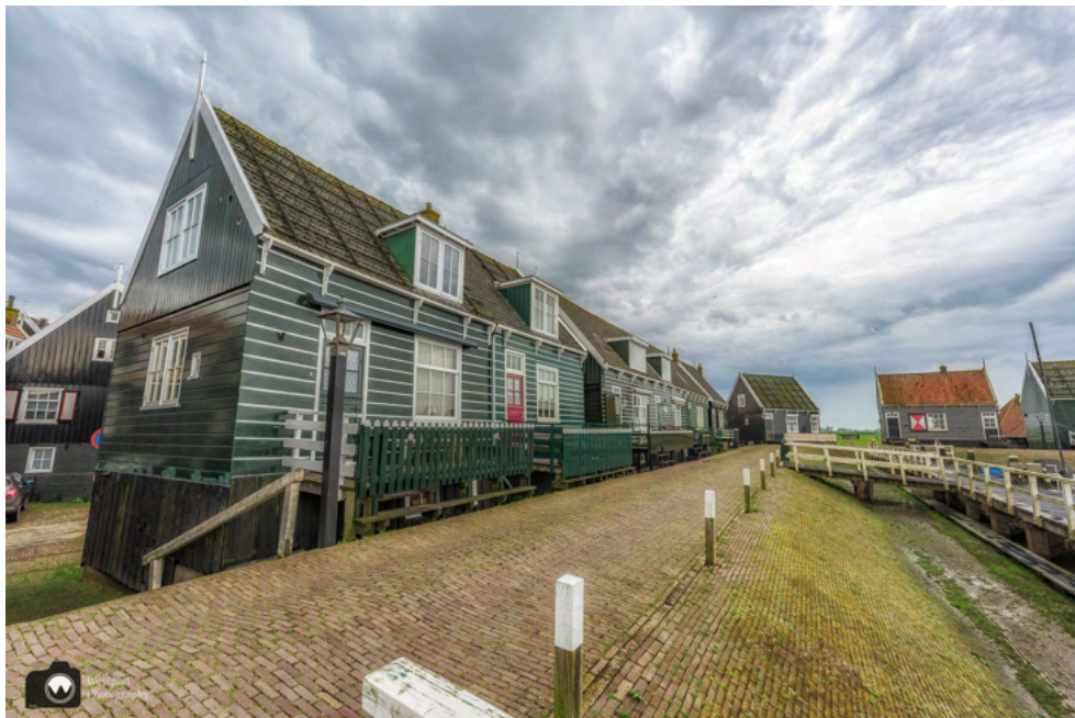
We lopen eerst naar rechts om wat foto's te maken van deze mooie huizen.

Marken is een voormalig eiland in het Markermeer, dat sinds 1957 via een dam met het vasteland verbonden is.