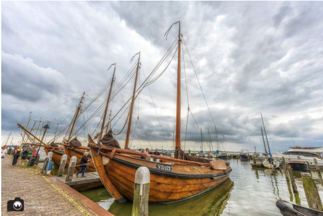
Prachtige boten in de haven van Volendam.