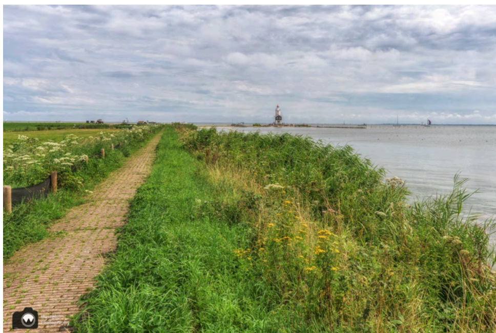
Dit zien we als we achterom kijken.

Na een eeuwigheid gaan we op weg richting de Rozewerf. Het wandelpad van de dijk is er nog slechter aan toe dan de vorige keer dat we er waren. We schieten daarom niet erg op, maar dat komt ook omdat we steeds achterom kijken naar de vuurtoren.