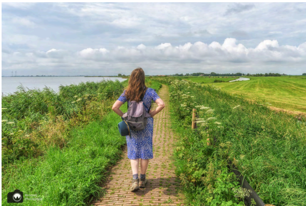
Gelukkig schijnt de zon weer, zodat ik verder kan opdrogen.

Na een eeuwigheid gaan we op weg richting de Rozewerf. Het wandelpad van de dijk is er nog slechter aan toe dan de vorige keer dat we er waren. We schieten daarom niet erg op, maar dat komt ook omdat we steeds achterom kijken naar de vuurtoren.