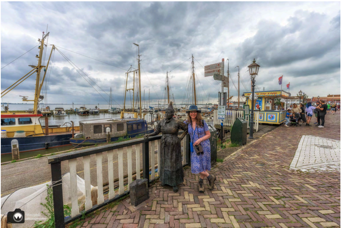
Toerist in eigen land.

Als laatste bekijken we nog even de boten in de haven en lopen dan moe maar voldaan terug naar de auto. Voor wie nog wel zin heeft om verder te wandelen is het een aanrader om door te lopen naar het Marinapark Volendam. De vakantiehuisjes zijn helemaal in Volendamse stijl en je kunt er leuk bootjes kijken en fotograferen.