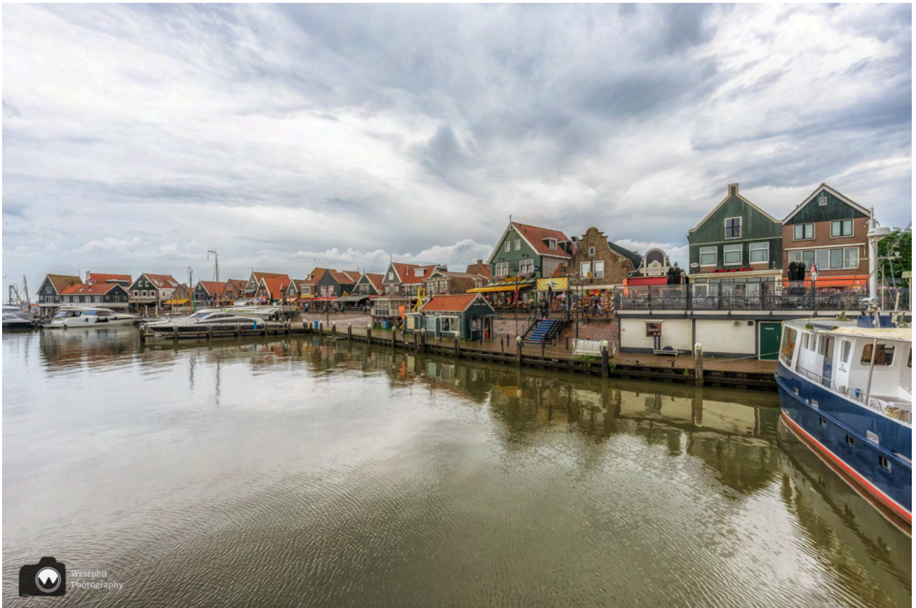
De haven van Volendam.

het Oorgat. Al snel vestigden zich hier boeren en vissers. Het dorp dat ontstond heette eerst Follendam, dat later Volendam werd.