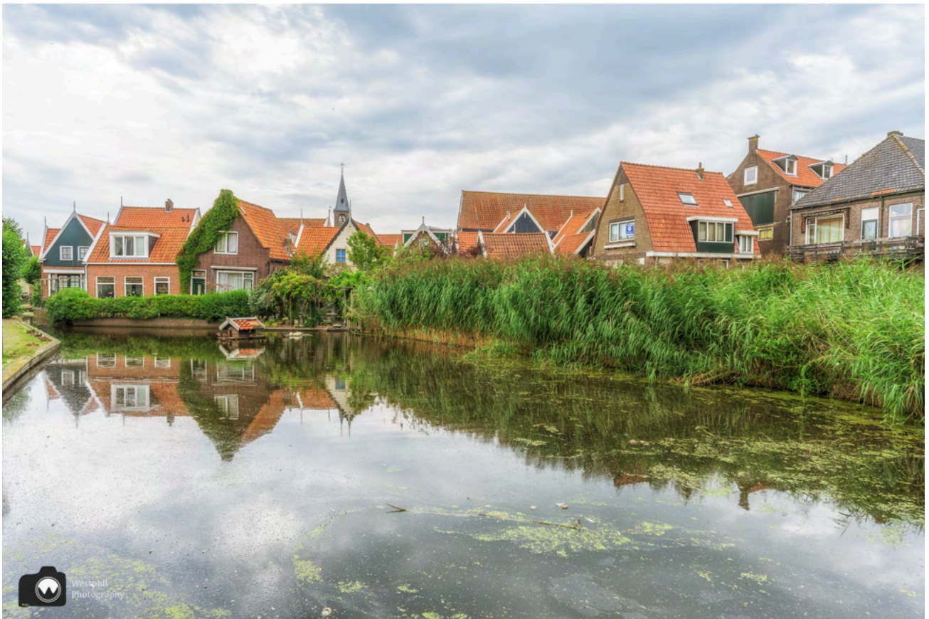
Een plaatje van een eendenvijver.