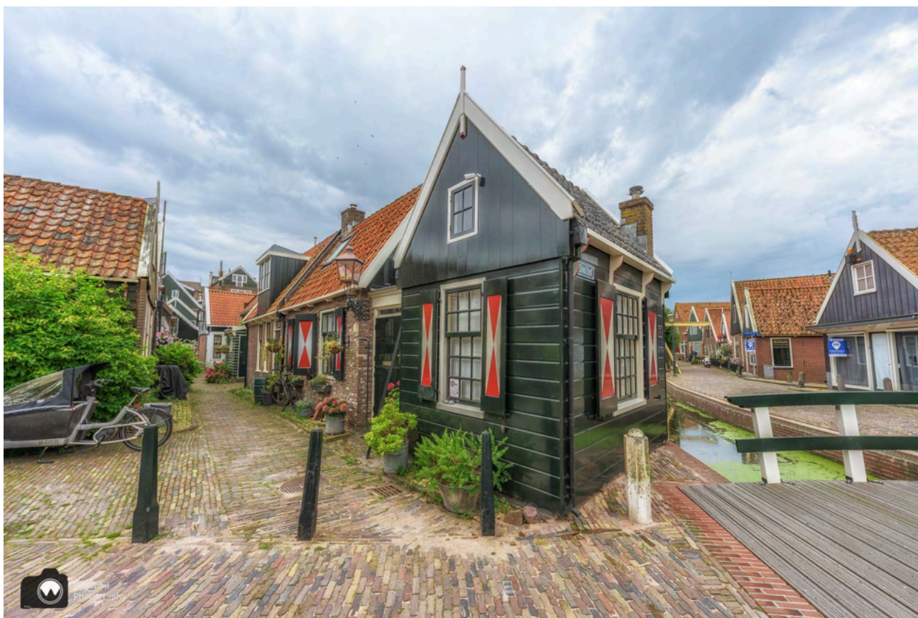
Zo'n leuk hoekhuis.

Daarna wandelen we langs de Sint-Vincentiuskerk. Het is een prachtige kerk, maar momenteel wordt er gewerkt aan de straat bij de kerk. Daarom hebben we er maar geen foto van gemaakt.