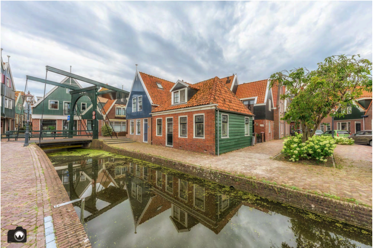
Leuk ophaalbruggetje en spiegelende huizen.

Zo wandelen we langs een gracht waar de huizen in spiegelen en komen we langs een vijver waar heel veel eenden zitten. Het is een prachtig fotogeniek plekje en zoals je kunt zien op de foto spiegelt het eendenhuisje mooi op het water. We hebben niet eens in de gaten dat er langs het pad ook allemaal eenden langs de kant zitten, waardoor we er eigenlijk te dicht langslopen. Verontwaardigd schrikken ze op en glijden het water in. Weg spiegelbeeld, maar gelukkig hadden we al een foto genomen.