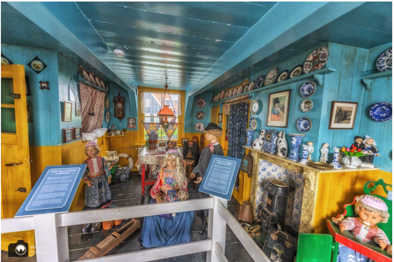
Als je van de boot afstapt kun je een kijkje nemen in dit authentieke huisje.

Al minstens een eeuw is het voormalige vissersdorp een toeristische trekpleister. De opvallende klederdracht van Marken heeft daaraan bijgedragen. Karakteristiek zijn de houten huizen op palen. Nog ouder zijn de zogenaamde "werven", kunstmatige verhogingen waarop werd gewoond.