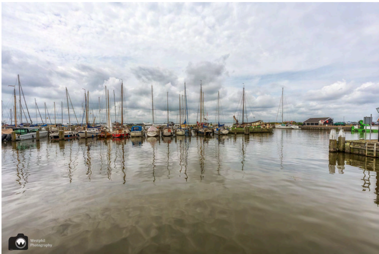
De gezellige haven van Marken.

De boot is heel wat drukker dan op de heenweg, maar nu kunnen we op het bovendek zitten waardoor we veel meer van de boottocht kunnen genieten.