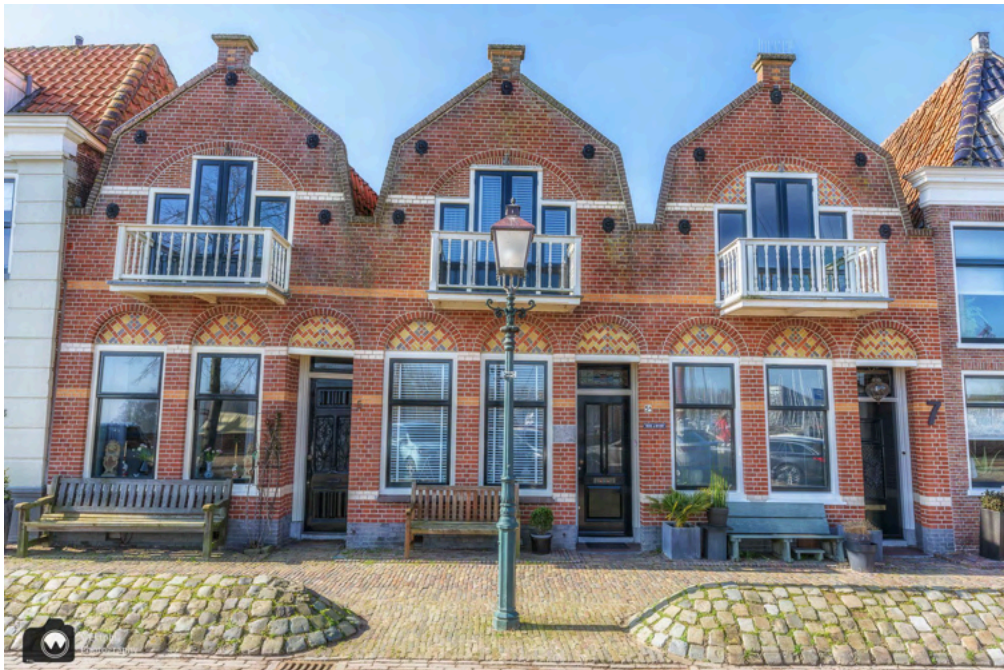
- Hoorn barst van de leuke geveltjes. -