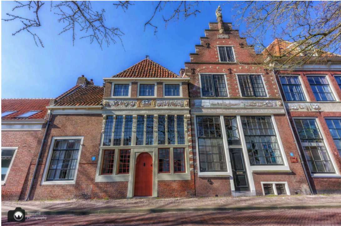
- Huizen met de prachtige gevelstenen met verzen en een voorstelling van de Bossu-zeeslag. -

Als je rechtdoor wandelt kom je uit bij de Roode Steen, maar wij maken eerst nog even een omweg langs de Grote Kerk en de Kerkstraat. We slaan rechtsaf de Schoolsteeg in. Deze steeg is erg smal, maar het lukt om 't Haarhuys te fotograferen.