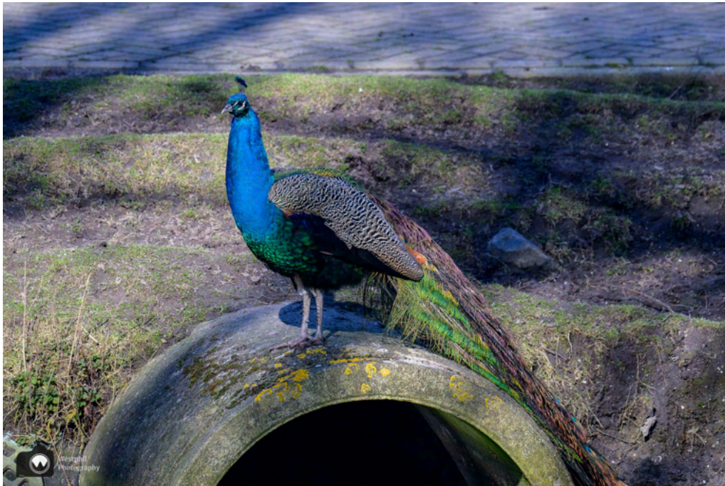
- Een pauw op een rioolbuis. -

We volgen de rode pijlen terug naar de parkeerplaats, bij het hertenkamp zien we een pauw op een rioolbuis zitten. Niet zo'n mooie plek, maar pauwen zijn altijd mooi.