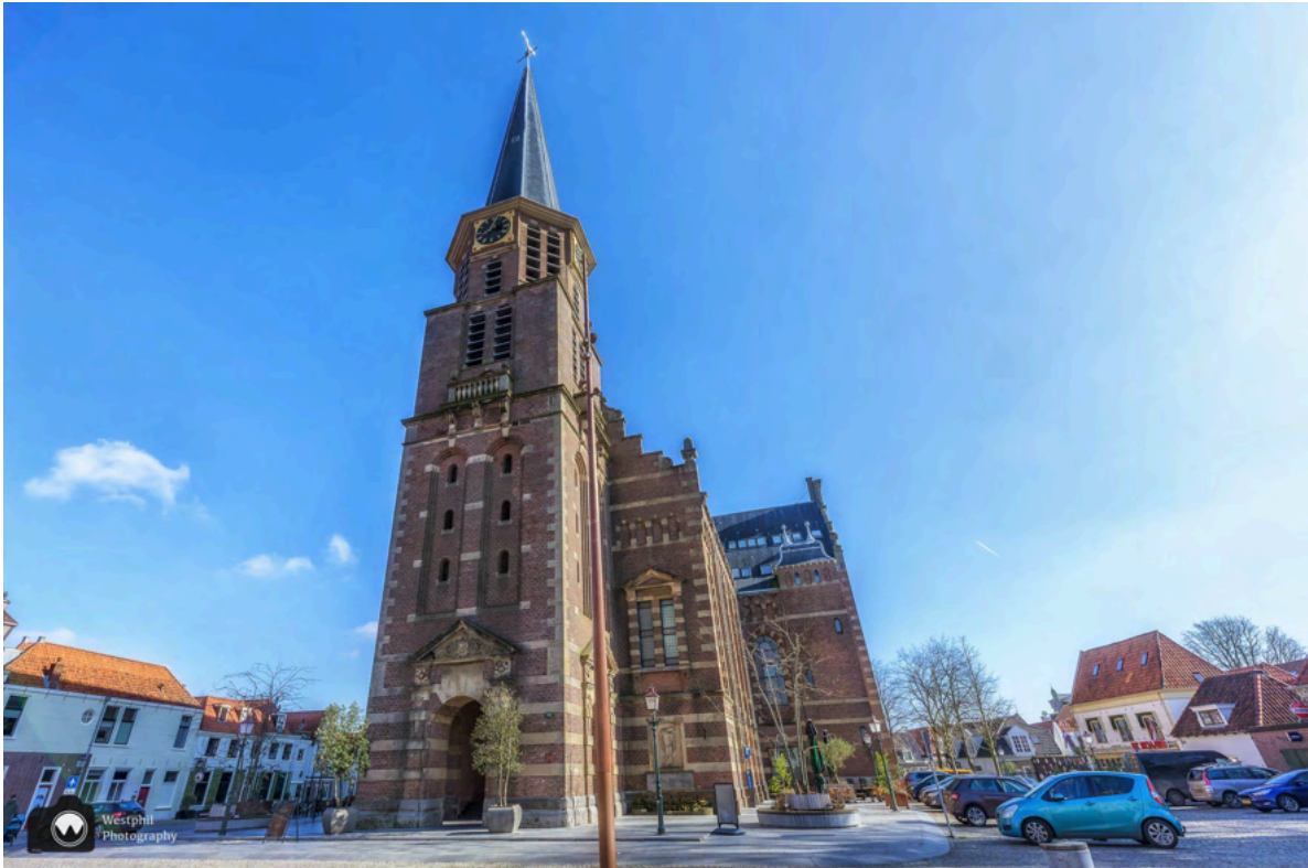
- De Grote Kerk. -

Daarna wandelen we linksaf door de Kerkstraat naar de Rode Steen. Ook hier staan weer prachtige monumentale panden. Kijk vooral ook even omhoog naar de mooie gevels.