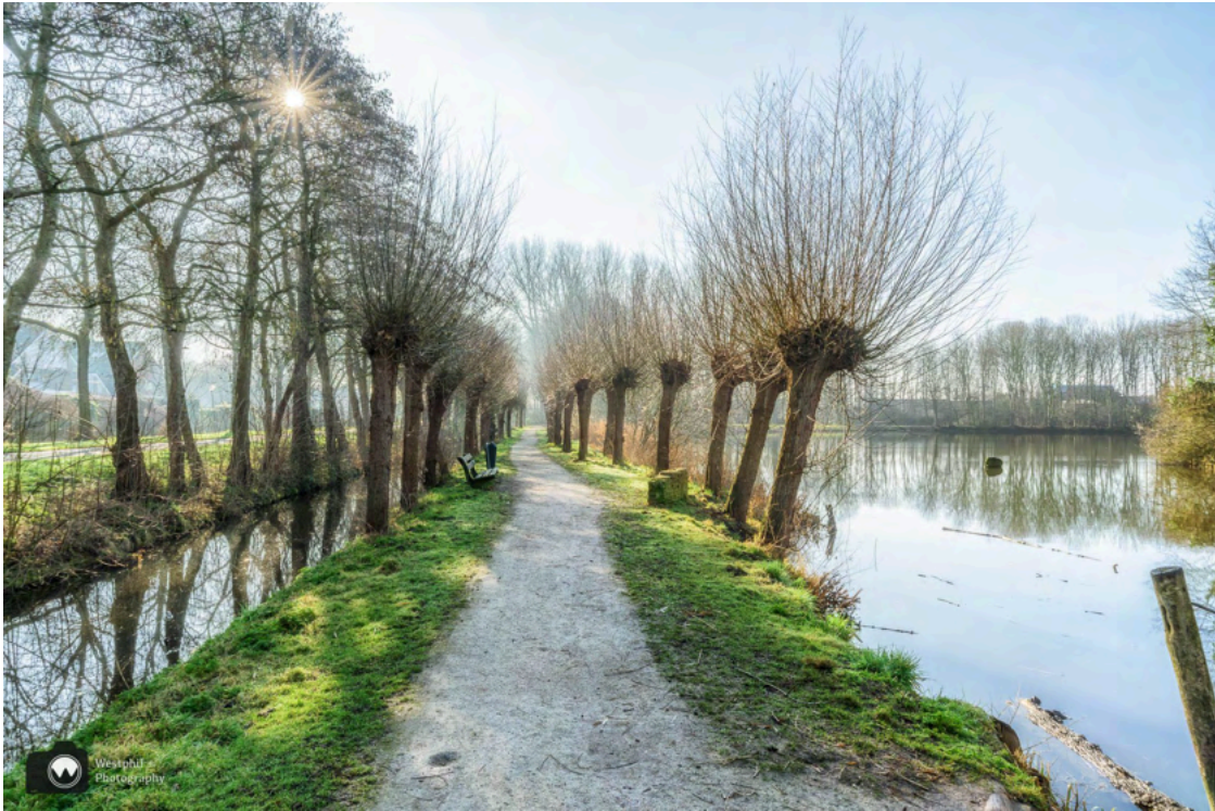
- Een prachtig paadje met knotwilgen. -

Als we verder wandelen, zien we een veldje met sneeuwkllokjes. Adriaan gaat er even bij liggen om er een mooie foto van te maken. Een auto stopt langs de weg en vraagt aan mij of alles oke is. De man dacht dat Adriaan gevallen was en had al bijna 112 gebeld. Gelukkig is er niets aan de hand en kan de man verder rijden.