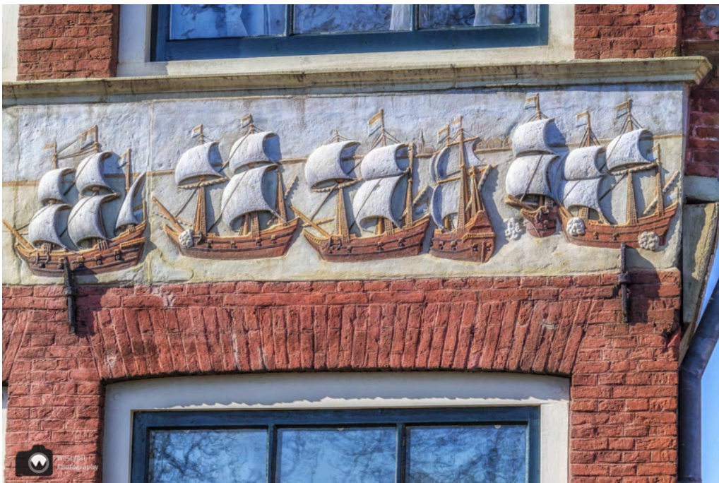
- Zo mooi, die details aan de gevels. -