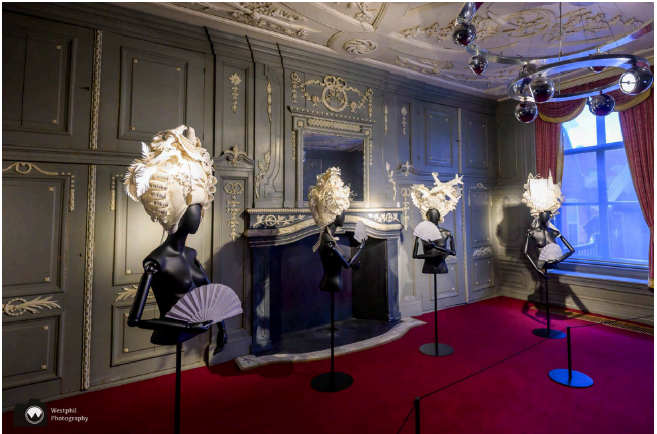
- Nog eentje, omdat we het zo bijzonder vinden. -