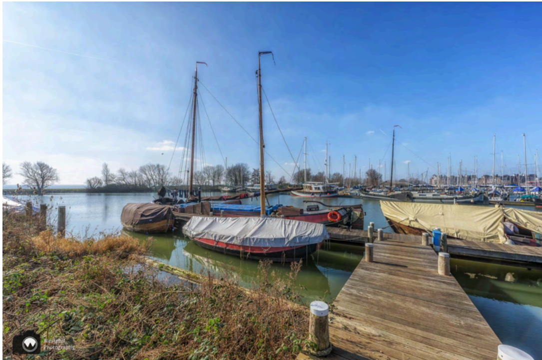
- Bij alle steigers staan borden met informatie over de schepen. -

Vervolgens lopen we langs oude schepen van de stichting Varend Erfgoed Hoorn. Bij elk schip staat een bord waarop informatie te lezen is over de boten.