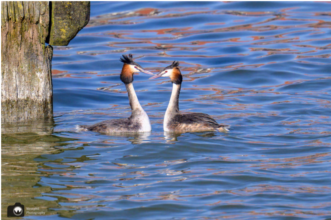
- De futen worden steeds verstoord in hun liefdesspel. -

We wandelen over de Ottobrug en ontdekken een aantal futen. We hopen op uitgebreide baltsrituelen, maar de twee futen, die met hun paringsdans bezig zijn, worden steeds gestoord door andere futen en daarom wandelen we maar door.