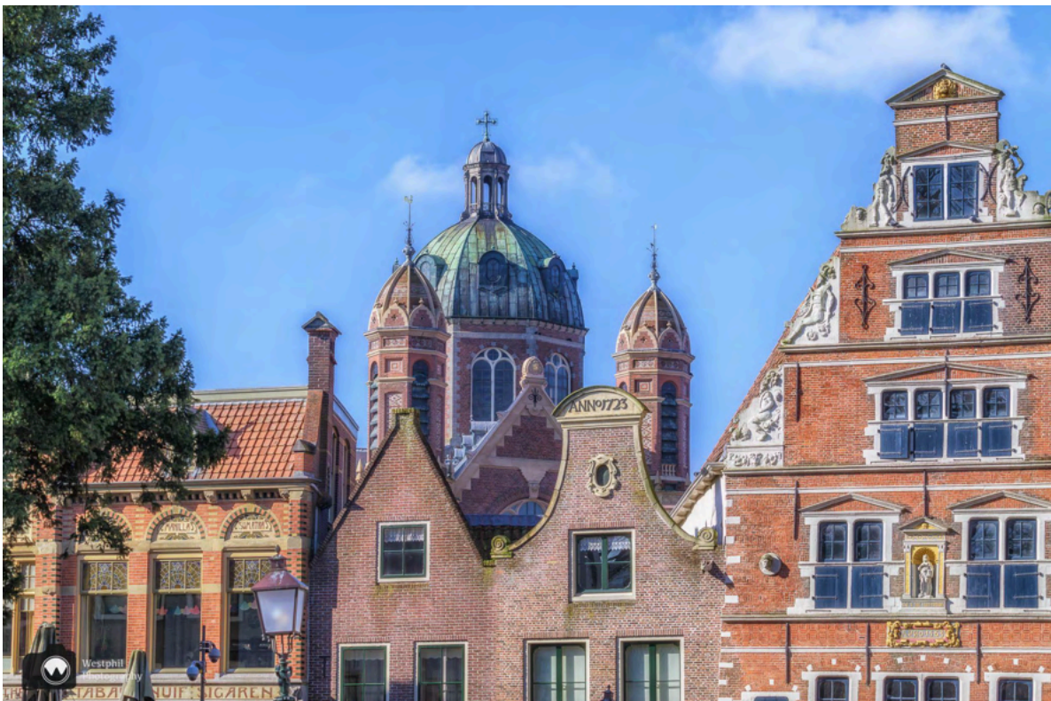
- Gevels van panden aan de Kerkstraat met op de achtergrond de Rooms-Katholieke Kerk H.H. Cyriacus- en Franciscus. -

Daarna wandelen we linksaf door de Kerkstraat naar de Rode Steen. Ook hier staan weer prachtige monumentale panden. Kijk vooral ook even omhoog naar de mooie gevels.