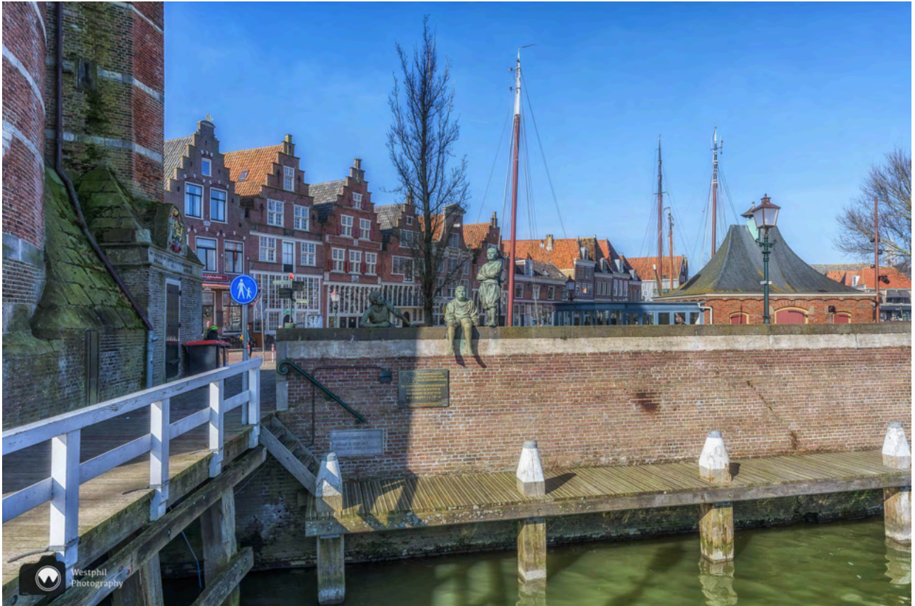
- Vanaf de steiger bij de hoofdtoren heb je zicht op de scheepsjongens van Bontekoe. -

De beeldengroep werd gemaakt door beeldhouwer Jan van Druten, geïnspireerd door het boek De scheepsjongens van Bontekoe van Johan Fabricius uit 1924, en op 14 juni 1968 onthuld.