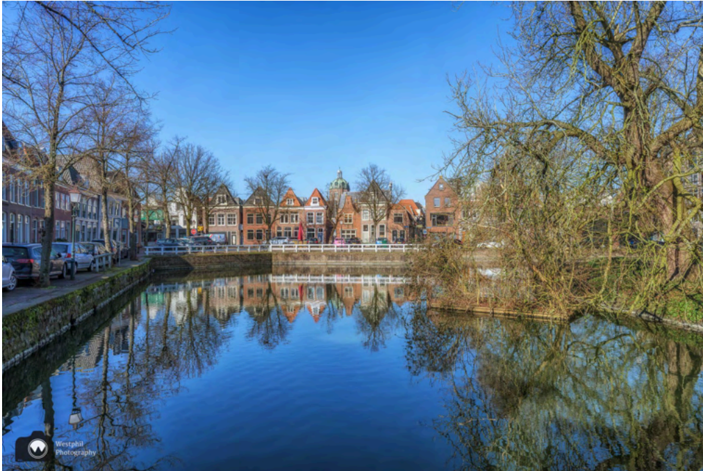
- De Nieuwendam. -

Als we alle kamers van het museum bekeken hebben, vervolgen we onze wandeling. Via de Kleine Havensteeg, komen we uit bij de Nieuwendam waar we door een heel smal steegje de Foreestensteeg op de Italiaanse Zeedijk terecht komen.