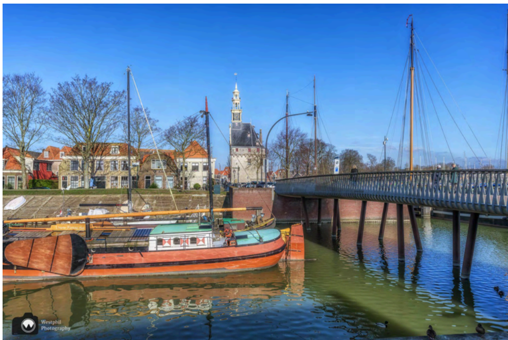
- Ook hier kijken we uit op de Hoofdtoren. -

Waar we zicht hebben op de Hoofdtoren, maar die gaan we later van dichtbij bekijken. We doen eerst een rondje over het Oostereiland.