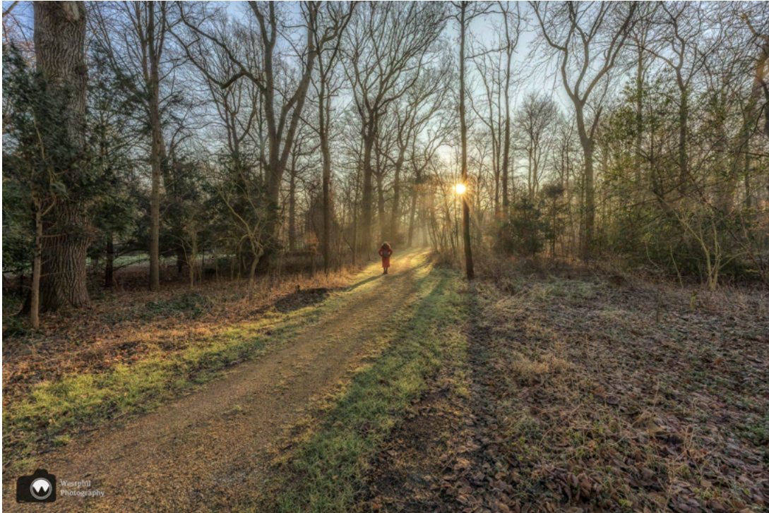
- 'De Bagage voor het Leven' -

We wandelen eerst langs 'de Bagage voor het Leven', een monument voor veteranen van oorlogen waar Nederland aan heeft deelgenomen.