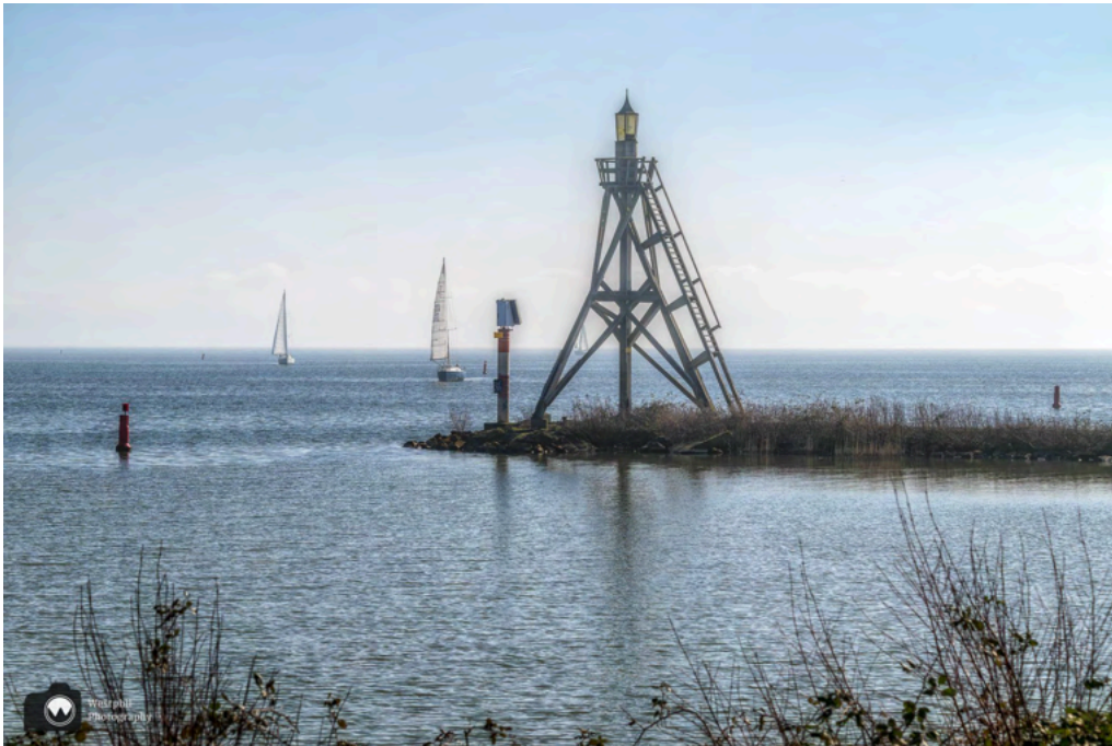
- Havenlicht het Vuurtje. -

Daarna wandelen we verder naar het uiterste puntje van het Oostereiland om een foto te maken van Havenlicht het Vuurtje.