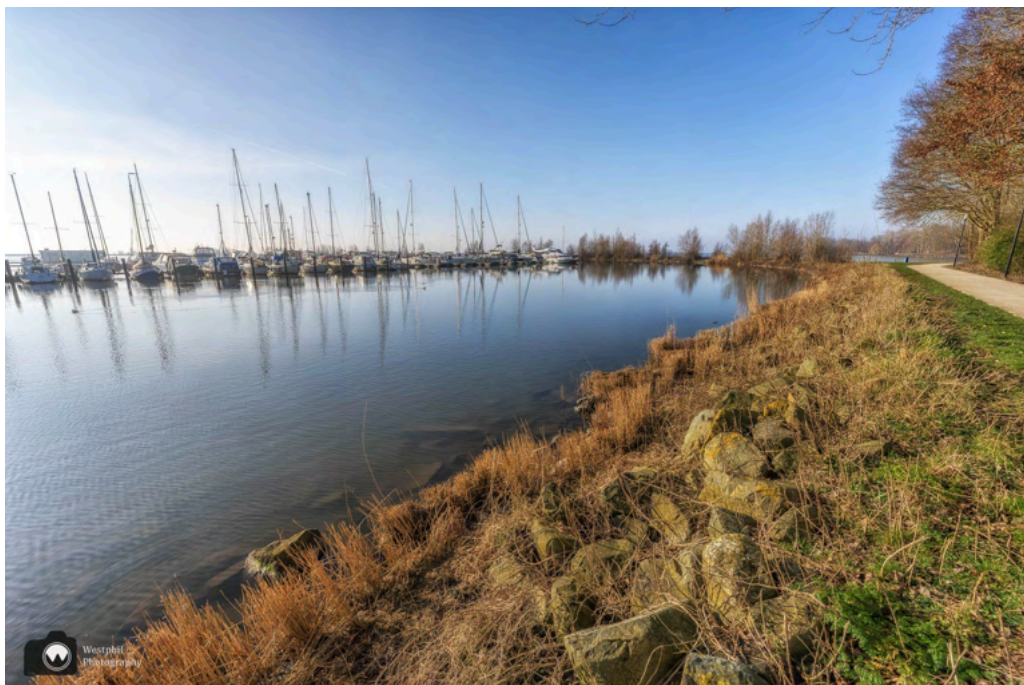
- Jachthaven Marina Kaap Hoorn. -

Als de drone opgeborgen is, wandelen we verder. We komen langs een strandje waar mensen aan het zwemmen zijn. Wij moeten er niet aan denken, want ondanks dat het zonnig is, is het maar 5 graden buiten. Volgens de vrouw, die net uit het water komt, is het heerlijk. Als we verder wandelen komen we langs de jachthaven Marina Kaap Hoorn. Altijd leuk foto's maken van boten.