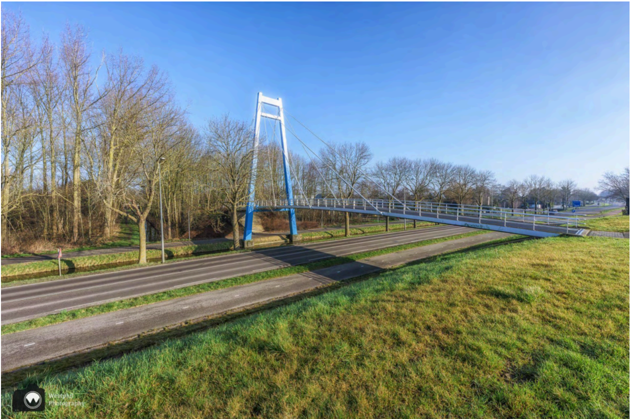
- De Tuibrug. -

We wandelen het park uit en vervolgen onze weg over een fietspad. In de verte zien we de Tuibrug, rechts van ons is het Bedrijventerrein Schelphoek waardoor we niet langer langs het water kunnen wandelen.