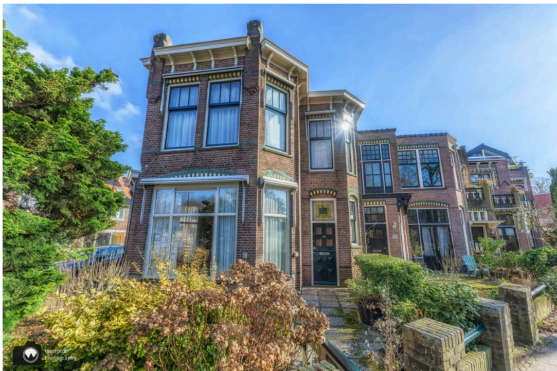
- Nog meer prachtige huizen. -

We komen uit bij de Oosterpoortgracht waar het langs de Draafsingel stikt van de krokussen. Adriaan gaat er weer even bij liggen en ik zorg ervoor dat er geen auto's meer stoppen. Bij het vorige ommetje wandelden we aan de overkant en maakten we foto's van spiegellende huizen in de gracht. Nu kunnen we de mooie huizen van dichtbij bekijken.