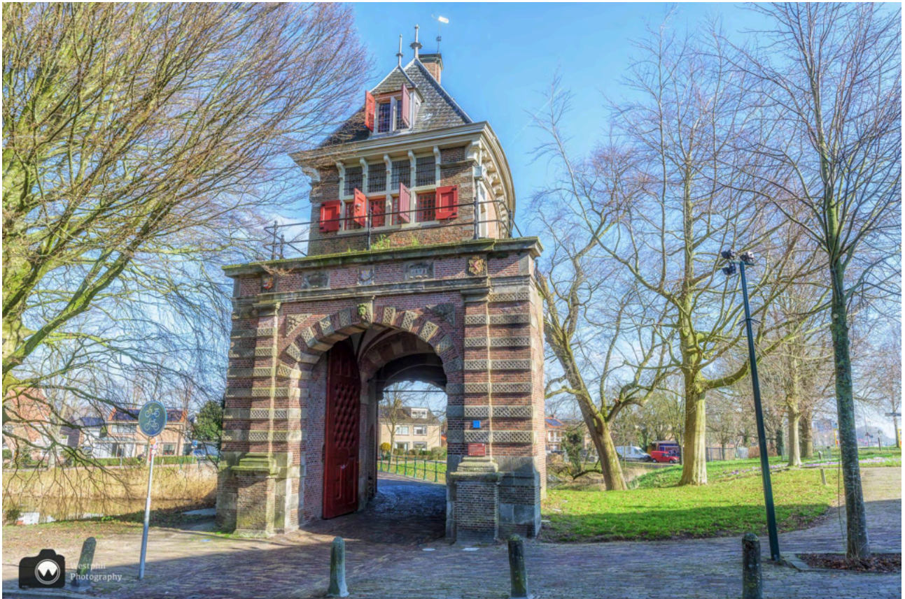
- De Oosterpoort is prachtig. -

We wandelen onder de Oosterpoort door, maar eerst maken we natuurlijk foto van deze fraaie poort. Het is de enige overgebleven stadspoort van Hoorn en is in 1578 gebouwd.