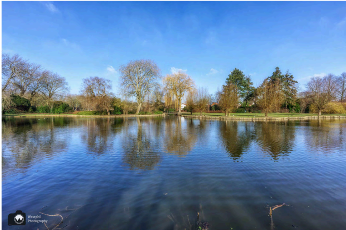
- Vijver in het Wilhelminaplantsoen. -

Aan de andere kant van het pad, ontdekken we een soort uitkijktoren waar wij natuurlijk even heen wandelen. Het is geen uitkijktoren, want er is geen trap naar boven. Wel zijn er bankjes waar wij plaatsnemen om even een tussendoortje te eten. Bij het water is een man aan het werk om alle zwerfafval op te ruimen. Hij vist van alles uit het water en stopt het allemaal in een vuilniszak. Wij gooien onze vuilnis natuurlijk in de vuilnisbak, dat zouden meer mensen moeten doen.