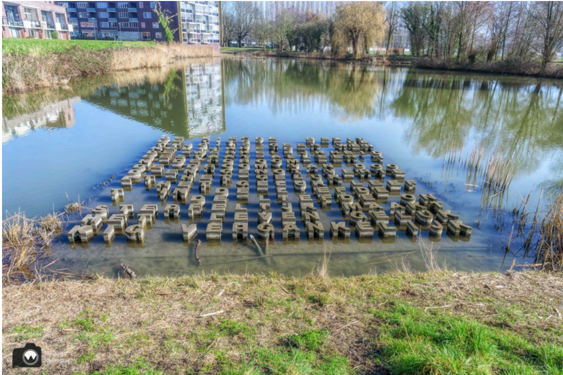
- 'De Hemel' van Jan Merx. -

We wandelen over de Ottobrug en ontdekken een aantal futen. We hopen op uitgebreide baltsrituelen, maar de twee futen, die met hun paringsdans bezig zijn, worden steeds gestoord door andere futen en daarom wandelen we maar door.