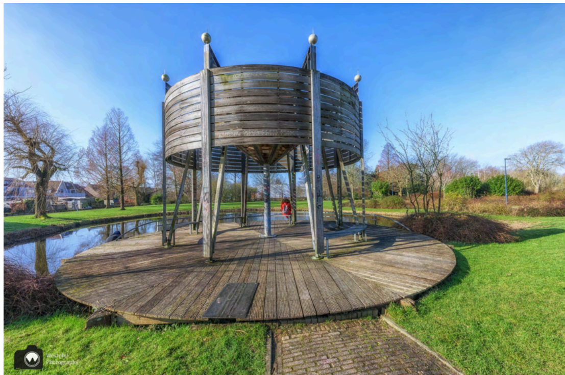
- Het is geen uitkijktoren, maar wel leuk. -

Aan de andere kant van het pad, ontdekken we een soort uitkijktoren waar wij natuurlijk even heen wandelen. Het is geen uitkijktoren, want er is geen trap naar boven. Wel zijn er bankjes waar wij plaatsnemen om even een tussendoortje te eten. Bij het water is een man aan het werk om alle zwerfafval op te ruimen. Hij vist van alles uit het water en stopt het allemaal in een vuilniszak. Wij gooien onze vuilnis natuurlijk in de vuilnisbak, dat zouden meer mensen moeten doen.