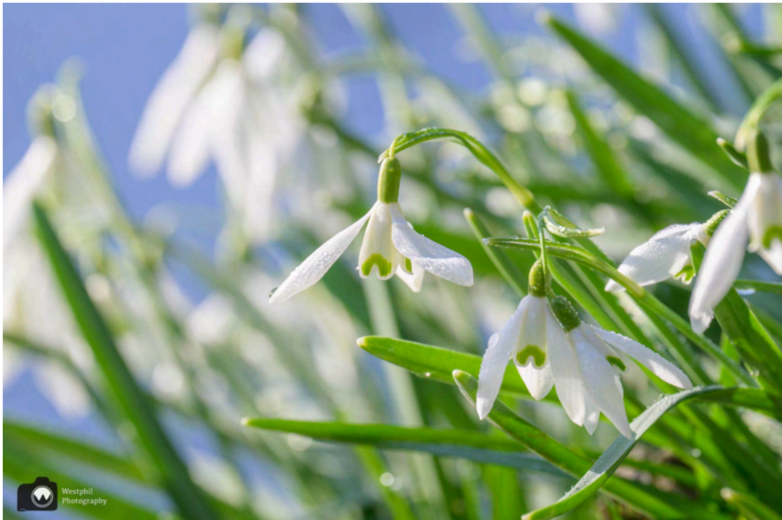
- Altijd leuk sneeuwkllokjes. -

Als we verder wandelen, zien we een veldje met sneeuwkllokjes. Adriaan gaat er even bij liggen om er een mooie foto van te maken. Een auto stopt langs de weg en vraagt aan mij of alles oke is. De man dacht dat Adriaan gevallen was en had al bijna 112 gebeld. Gelukkig is er niets aan de hand en kan de man verder rijden.