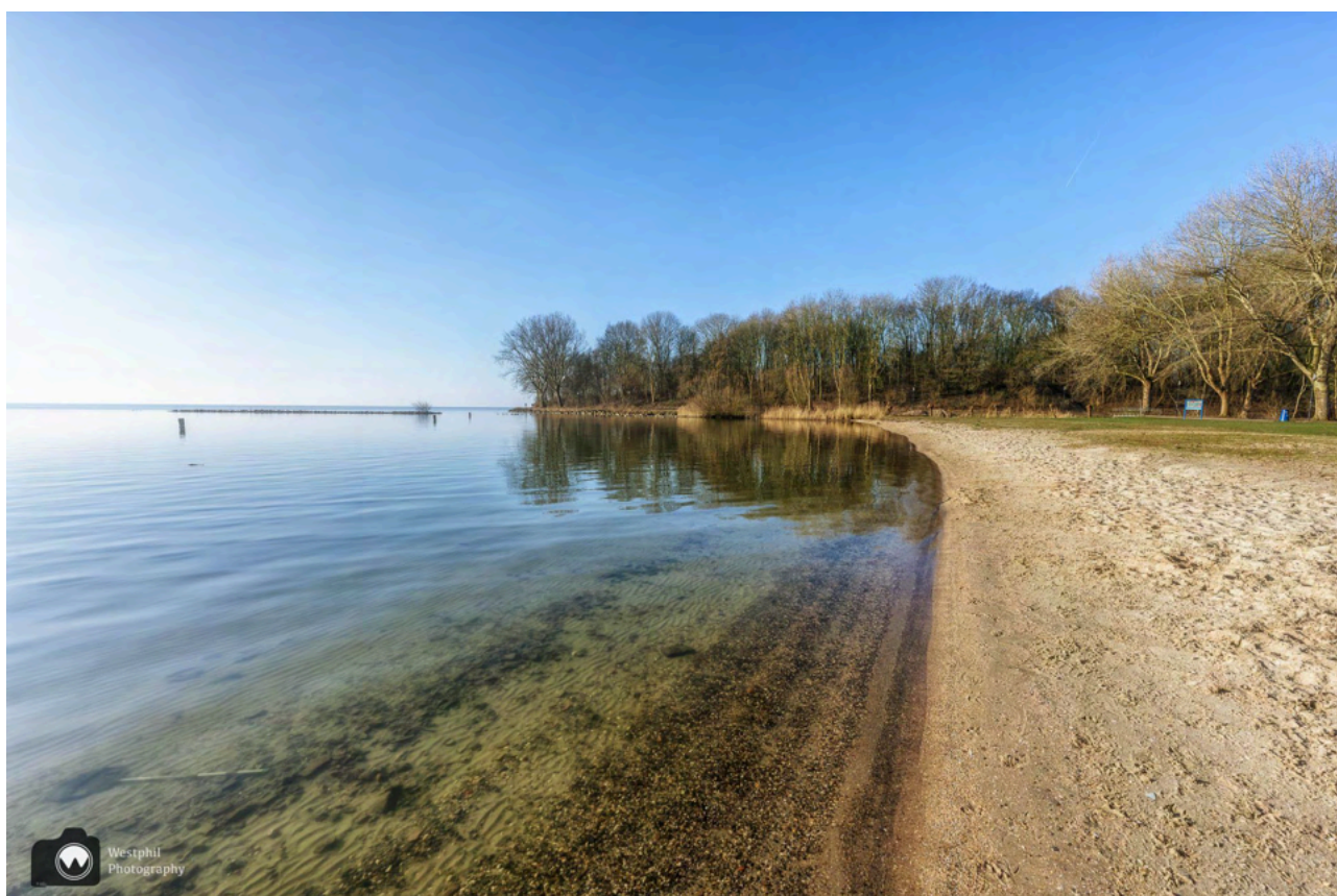
- Het strandje bij het Julianapark. -

We starten de wandeling bij het Julianapark, het is een langgerekt stadspark langs de Hoornse Hop, een deel van het Markermeer. Wij kiezen ervoor om langs het water te wandelen, maar je kunt ook langs een hoger gelegen pad lopen.