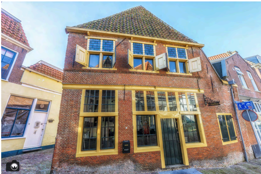
- We komen langs 't Haarhuys in de Schoolsteeg. -

Als je rechtdoor wandelt kom je uit bij de Roode Steen, maar wij maken eerst nog even een omweg langs de Grote Kerk en de Kerkstraat. We slaan rechtsaf de Schoolsteeg in. Deze steeg is erg smal, maar het lukt om 't Haarhuys te fotograferen.