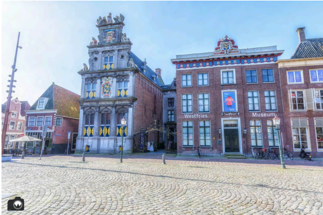
- Het Westfries Museum. -