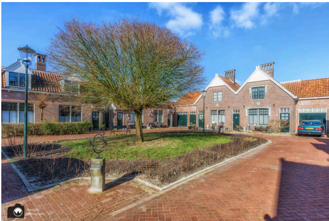
- Wat een leuk hofje bij de Vennenlaan. -

In 1907 werd midden in het landelijk buitengebied van Hoorn een stuk grond aangekocht voor de bouw van 32 arbeiderswoningen door de woningbouwvereniging Arbeidersbelang. Eén van de eerste 30 woningbouwverenigingen van Nederland.