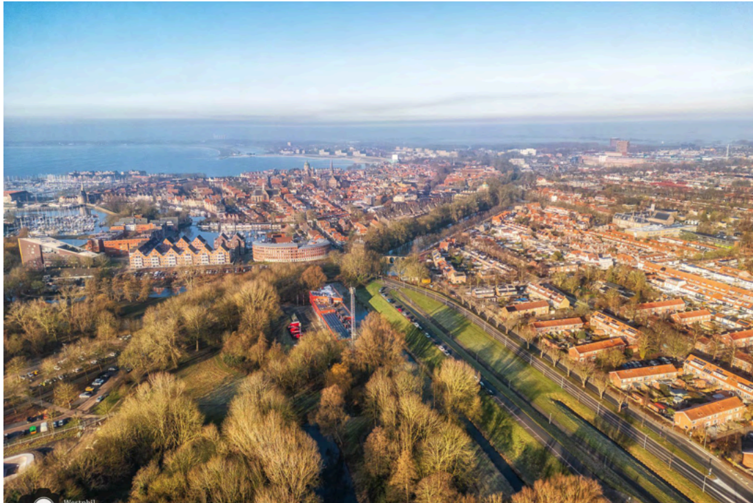
- Hoorn van bovenaf. -

Als de drone opgeborgen is, wandelen we verder. We komen langs een strandje waar mensen aan het zwemmen zijn. Wij moeten er niet aan denken, want ondanks dat het zonnig is, is het maar 5 graden buiten. Volgens de vrouw, die net uit het water komt, is het heerlijk. Als we verder wandelen komen we langs de jachthaven Marina Kaap Hoorn. Altijd leuk foto's maken van boten.