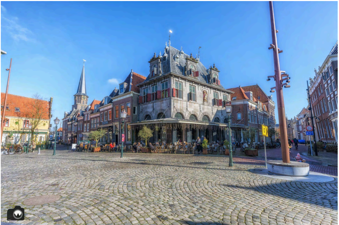
- De Waag. -

De Roode Steen is het centrale plein van Hoorn. Vroeger werd hier een kaasmarkt gehouden. In 2007 werd de kaasmarkt in ere hersteld ter gelegenheid van "650 jaar stadsrechten van Hoorn". Sinds de corona crisis wordt de kaasmarkt echter niet meer gehouden.