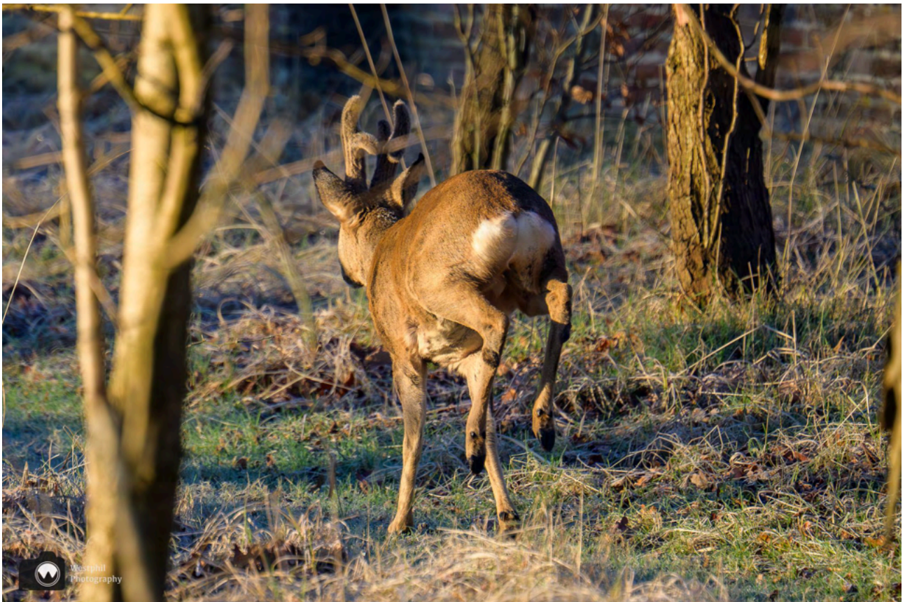
- Hij rent er snel vandoor. -

De restauratie en verduurzaming van de buitenplaats duurt nog tot na de bouwvak van 2025. Elke zaterdag, van 1 februari t/m 15 oktober, is er vanaf 10 uur een gratis excursie door het park bij Huis te Manpad. Ook op dinsdag, van 1 februari t/m 31 mei vanaf 14.00 uur. Meer informatie vind je op de website van het landgoed.