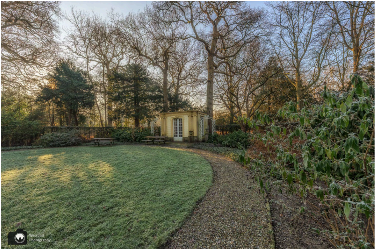
- Het leuke tuinhuisje. -

Vorbij het landhuis is een paadje naar links, natuurlijk lopen we daar even in. Er staat een mooi tuinhuisje en wat picknicktafels.