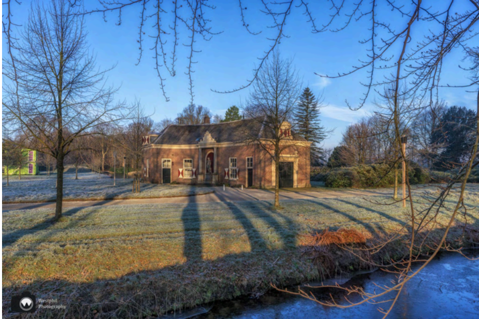
- Gelukkig staan de bijgebouwen niet in de steigers. -

De restauratie en verduurzaming van de buitenplaats duurt nog tot na de bouwvak van 2025. Elke zaterdag, van 1 februari t/m 15 oktober, is er vanaf 10 uur een gratis excursie door het park bij Huis te Manpad. Ook op dinsdag, van 1 februari t/m 31 mei vanaf 14.00 uur. Meer informatie vind je op de website van het landgoed.