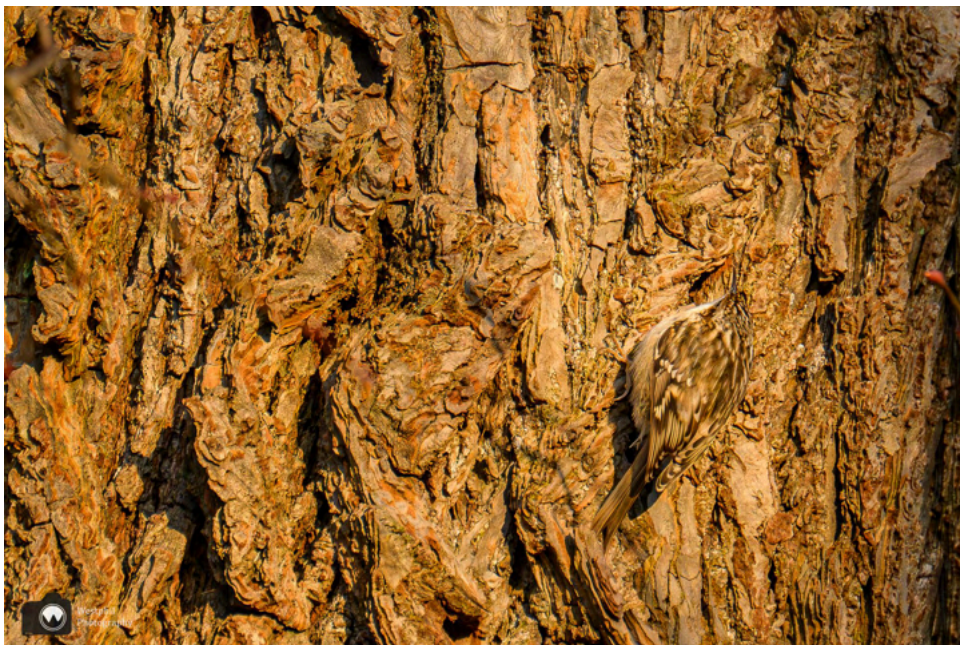
- De boomkruiper heeft een goede schutkleur. -

Boomkruipers zijn bruin gevlekt van boven en wittig van onderen. Met hun spitse, omlaag gebogen snavel worden insecten uit spleten in boombast gepeuterd. Boomkruipers klimmen spiraalsgewijs langs een boomstam omhoog, terwijl ze de bast afzoeken naar insecten. Bij koude nachten kruipen boomkruipers bij elkaar; uit een bal van veren kunnen dan soms tien of meer staartjes steken.