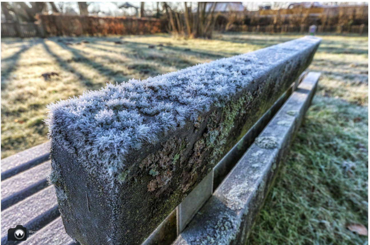
- Bevroren mos op een bankje. -