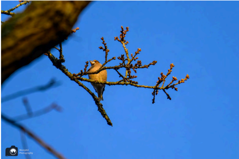
- Een appelvink zien we niet zo vaak. -