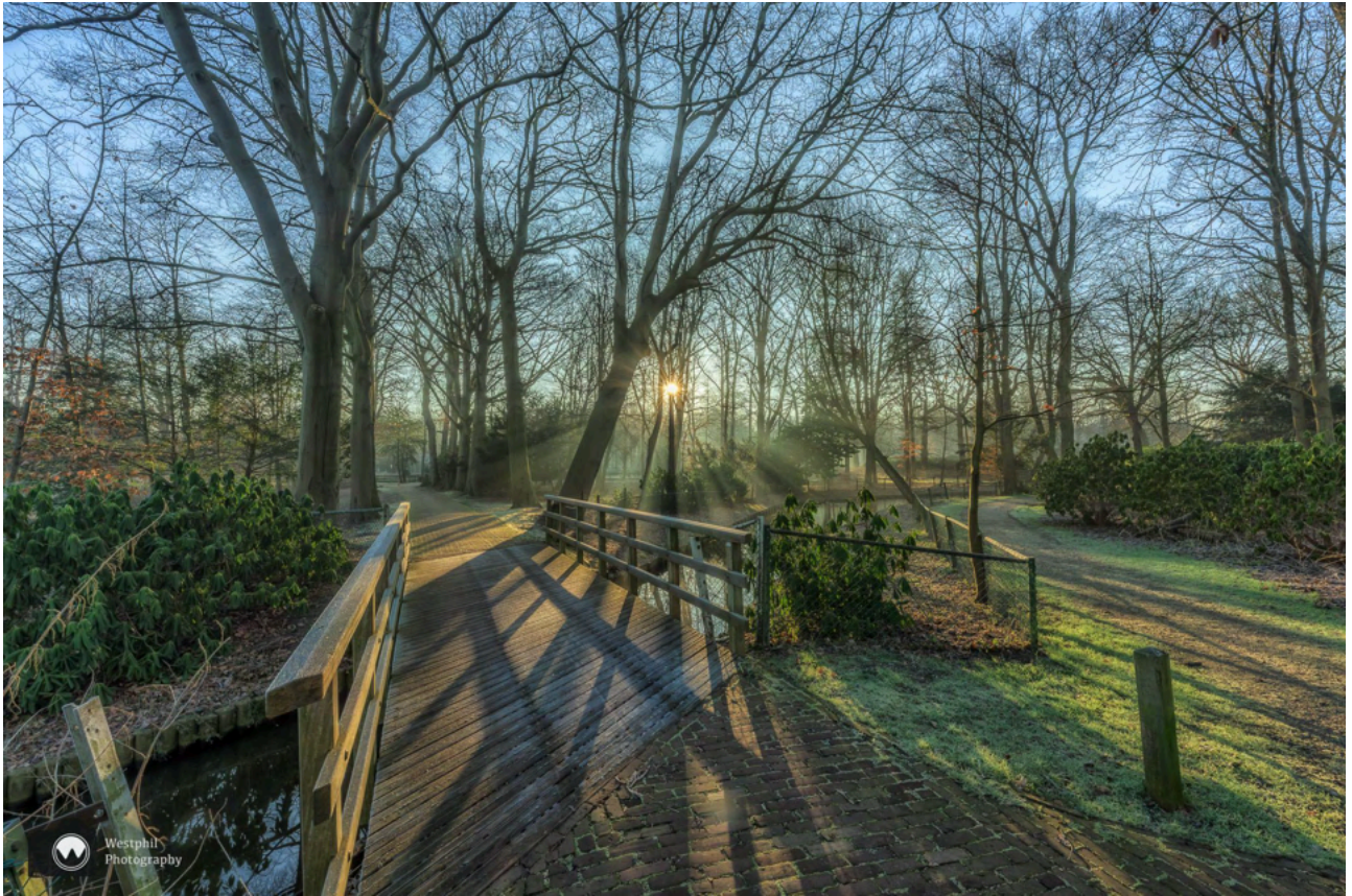
- Mooie zonneharpen. -

Er zwemmen vandaag weinig eenden in de vijver, maar we zien wel bevroren uitgebloeide hortensia's en de eerste sneeuwkllokjes.