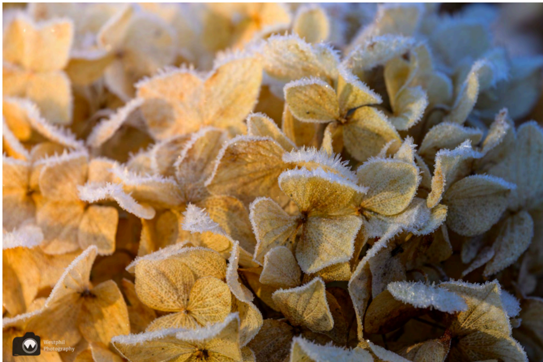
- Bevroren hortensia's. -

Er zwemmen vandaag weinig eenden in de vijver, maar we zien wel bevroren uitgebloeide hortensia's en de eerste sneeuwkllokjes.