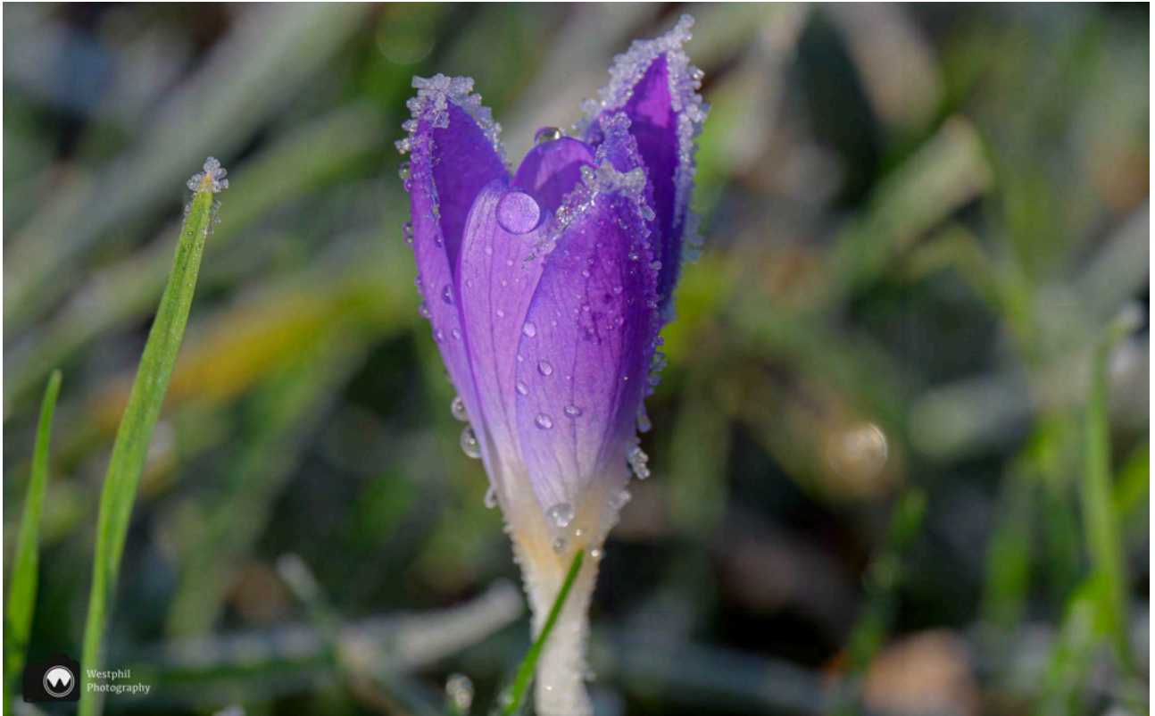
- Een bevroren krokus. -