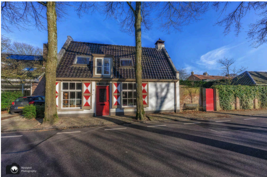
- Leuk huis met mooie luiken lang de Prinsenlaan. -

Na al dat natuurschoon en mooie buitenplaatsen valt het even tegen om langs de weg te wandelen en door een gewone woonwijk.