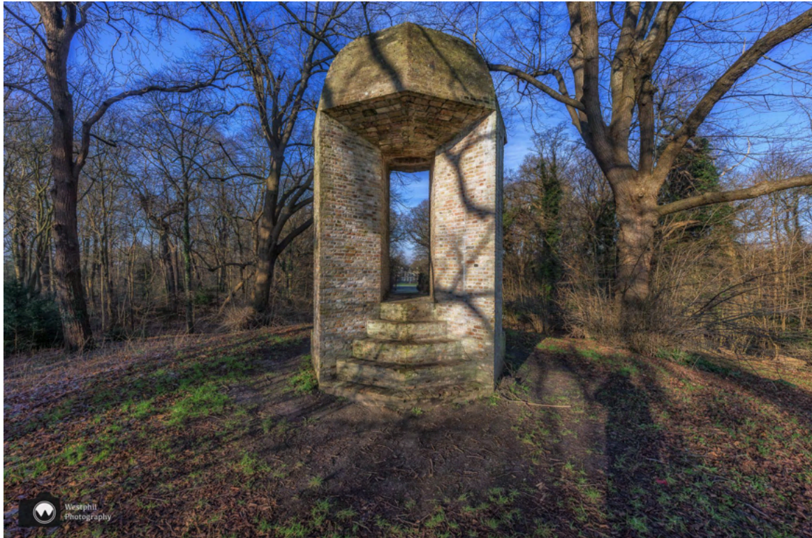
- De koepel, door de opening zie je het mooie landhuis Hartekamp liggen. -

We wandelen de heuvel af en maken een rondje om de vijver om vervolgens uit te komen bij de Prinsenlaan.