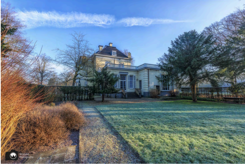
- We blijven foto's maken van het mooie landhuis. -

Vorbij het landhuis is een paadje naar links, natuurlijk lopen we daar even in. Er staat een mooi tuinhuisje en wat picknicktafels.