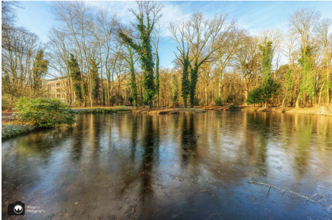
- De vijver vanaf de andere kant. -