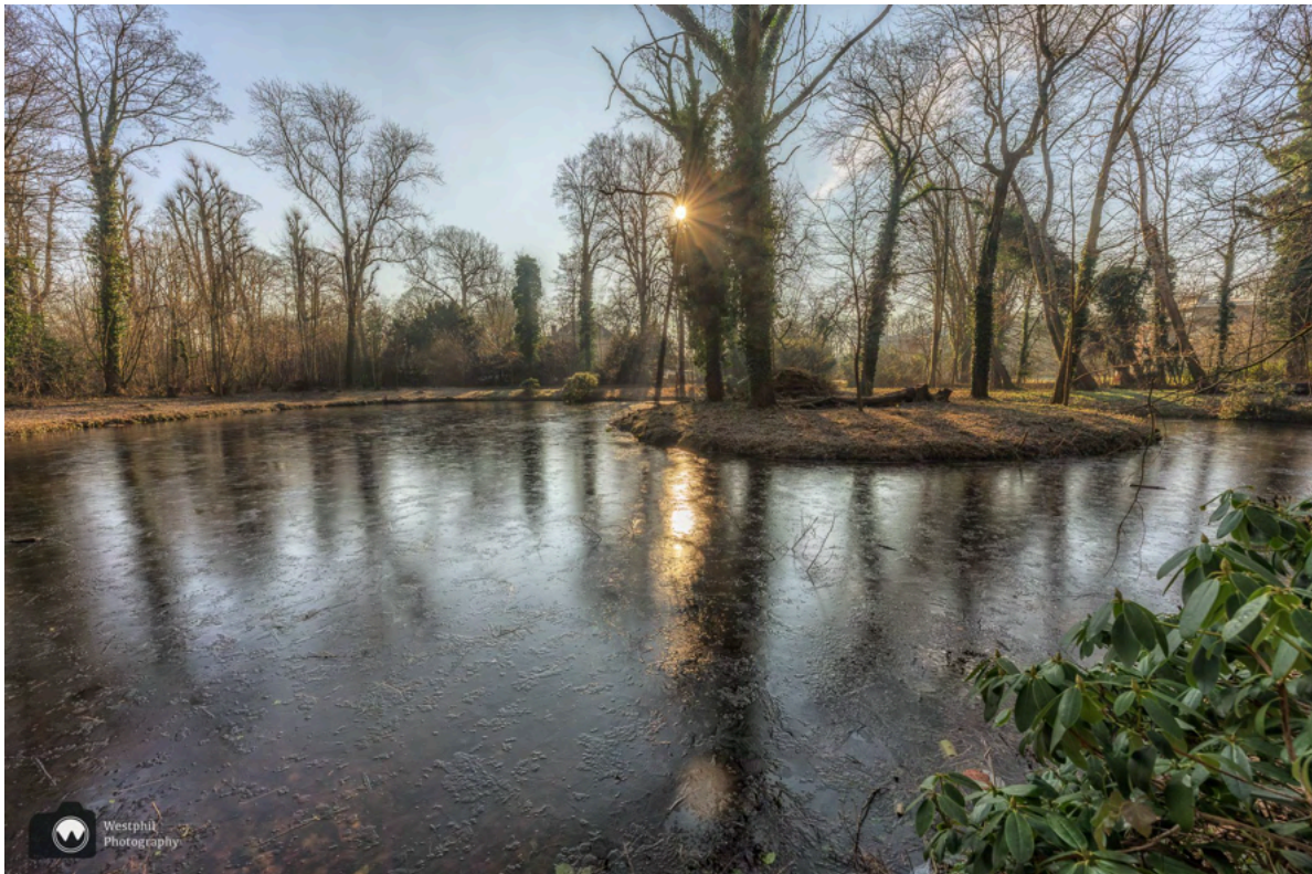
- Een rondje om de vijver. -

We wandelen de heuvel af en maken een rondje om de vijver om vervolgens uit te komen bij de Prinsenlaan.