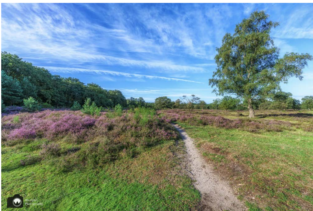
Het paars knalt je tegemoet.

De heide bloeit vroeg en uitbundig dit jaar! We schrijven een vervroegd ommetje van de maand september zodat iedereen nog van de mooie heide kan genieten. In Noord-Holland zijn er meerdere plekken waar heide bloeit, zoals in Bergen of in Schoorl. Die routes bewaren we voor een ander jaar. Vandaag is de Wester- en Bussummerheide aan de beurt.