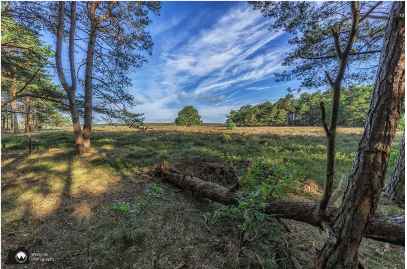
Overal van dit soort doorkijkjes.

We wandelen door, maar schieten niet erg op. Om de haverklap zien we een mooie plek die op de foto moet. Wij hebben hier ook weleens in andere jaargetijden gelopen en dan is het er ook mooi, maar als de heide en de lijsterbes bloeien, dan knallen de kleuren je tegemoet. Het is wel jammer dat de krentenbomen met hun witte fragiele bloemetjes in april bloeien, want anders was het helemaal een spektakel geweest.