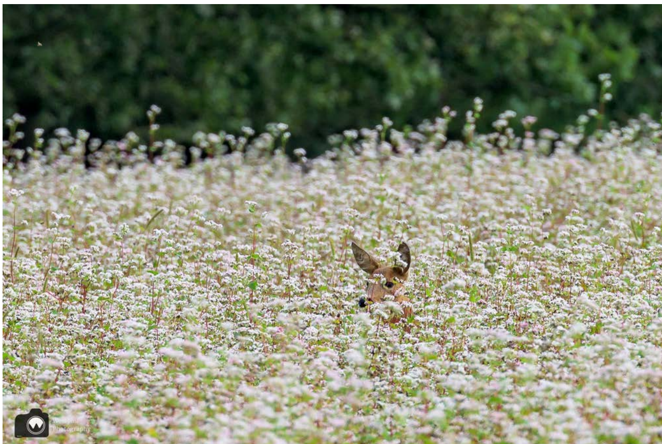
Kijk daar staat ze hoor tussen het boekweit.