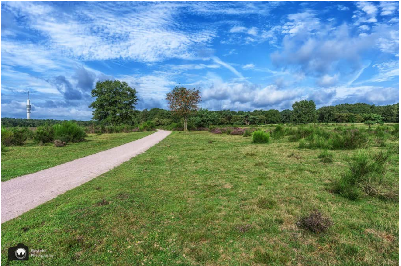
In de verte zien we de omroeptoren van Hilversum en een lijsterbes.

Wij verbazen ons erover dat op veel plekken de omroeptoren van Hilversum te zien is, maar dat is ook geen wonder want de toren is inmiddels 196 meter hoog.