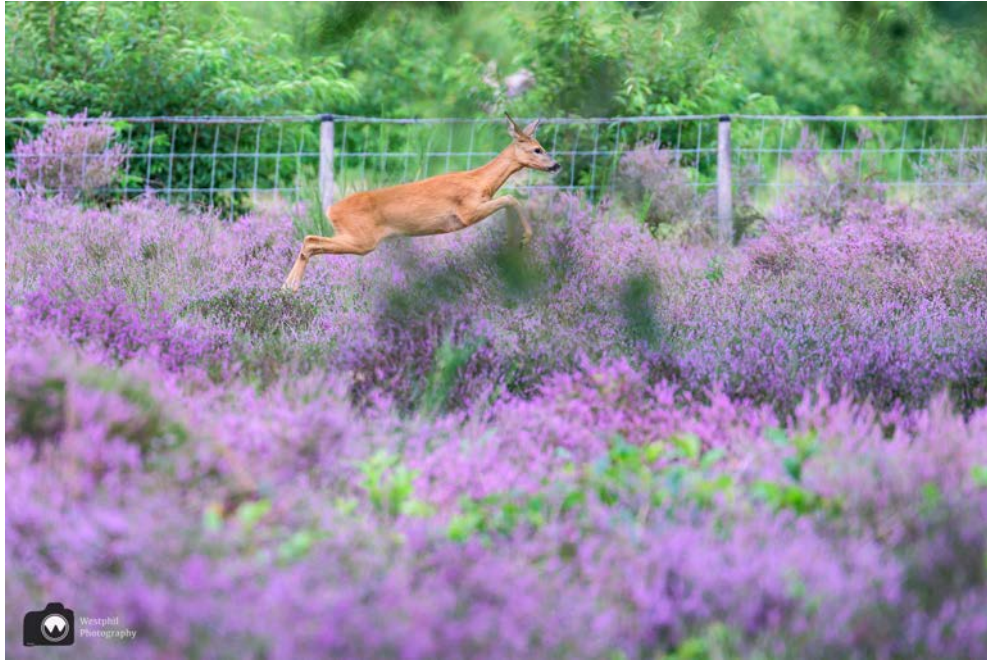
Moeder ree slaat op de vlucht.