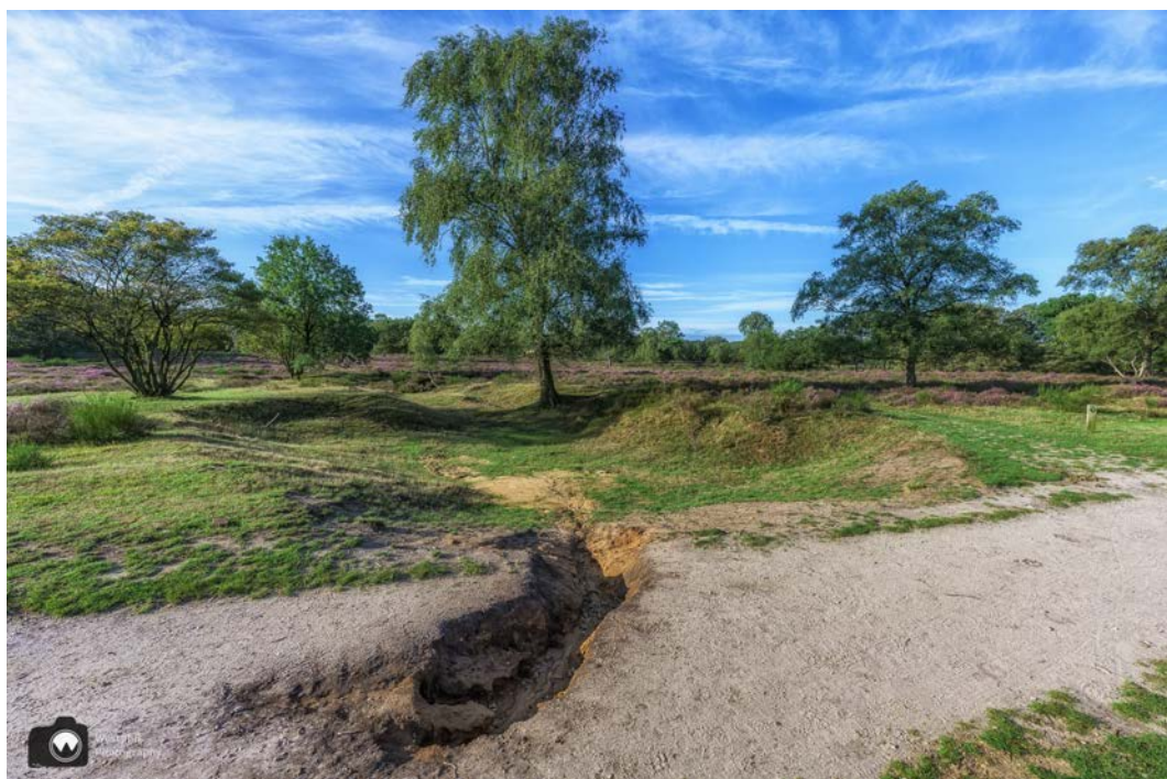
Zomaar een stuk van het pad af.

We komen langs een plek waar een deel van het pad is weggeslagen. Komt zeker door al de regen van de afgelopen tijd, of door storm Poly. Gelukkig is het pad breed genoeg.