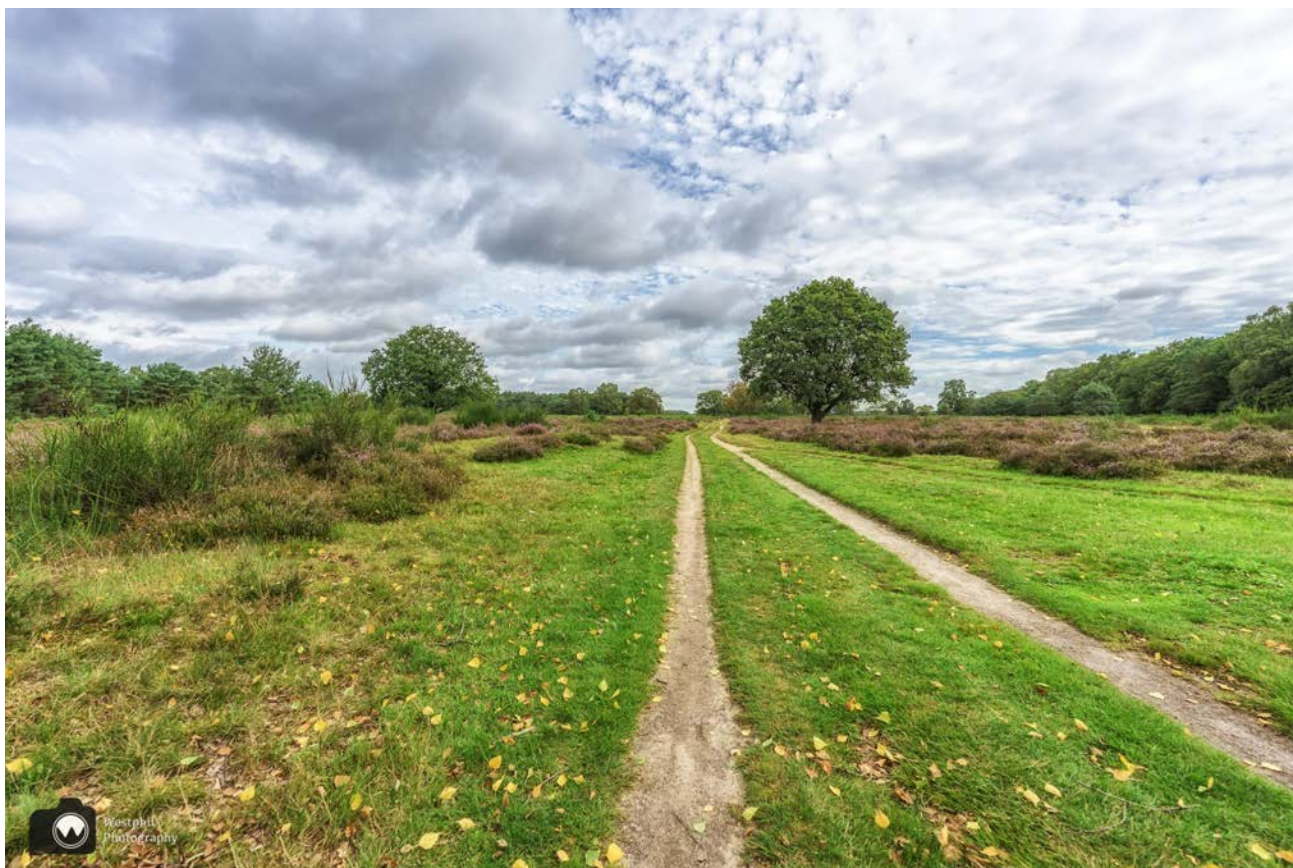
Op sommige plekken bloeit wat minder heide, maar het is overal mooi.

Er staat ook al iemand anders te fotograferen, die ons vertelt dat er twee reeën het boekweit veldje in zijn gegaan. Er vliegt een hele familie lijsters rond. Daar zijn we eerst druk mee, totdat we twee oren boven het veldje uit zien komen.