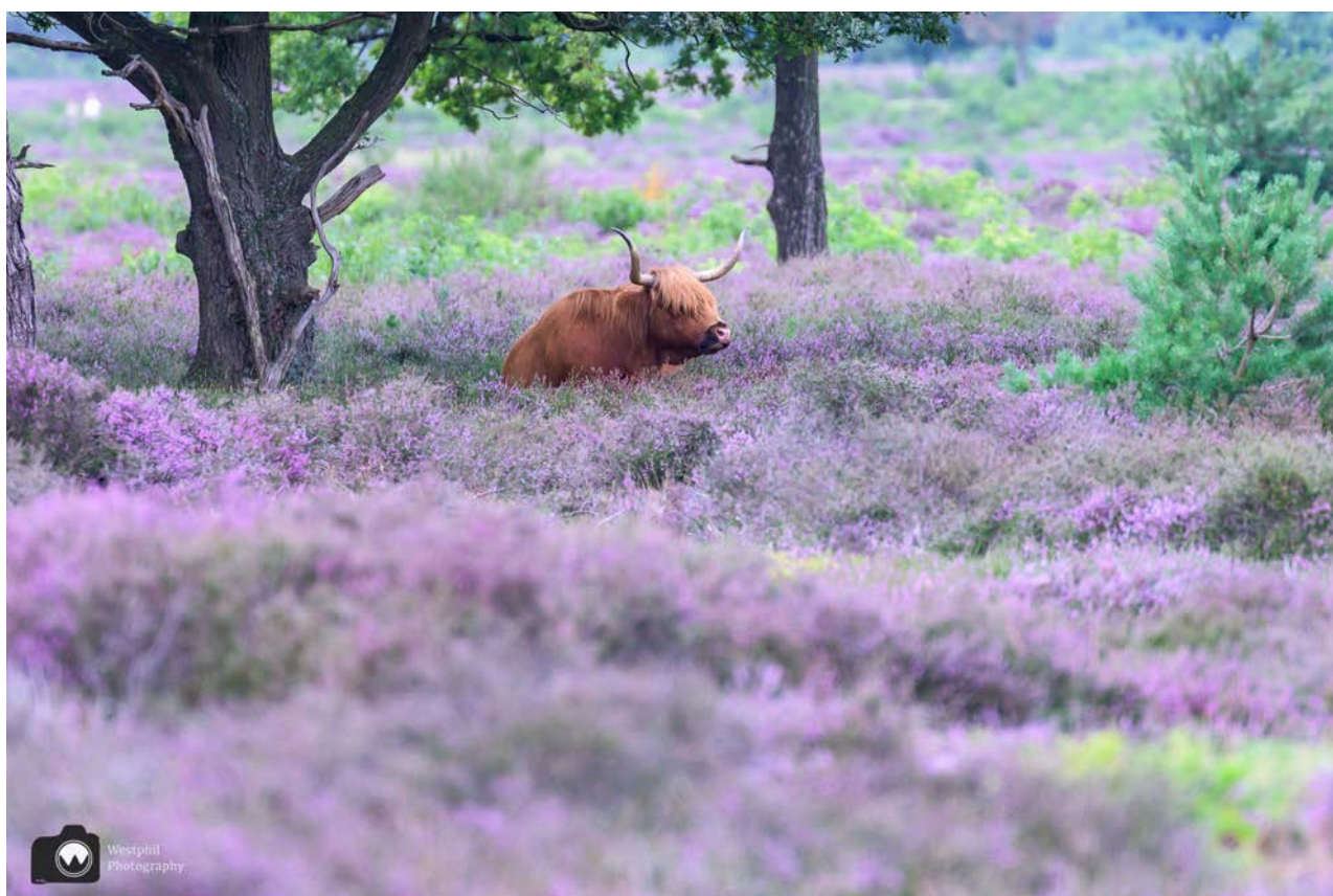
Deze Schotse Hooglander lag vlak langs het pad.

In het begin zagen we al een aantal Schotse Hooglanders onder de beschutting van de bomen liggen. Op de terugweg zien we weer een stel naast het pad liggen. Adriaan lukt het om een foto te maken, waarop het net lijkt alsof de Hooglander tussen de heide ligt. Wij hebben erg genoten van deze wandeling. Nu jullie nog.