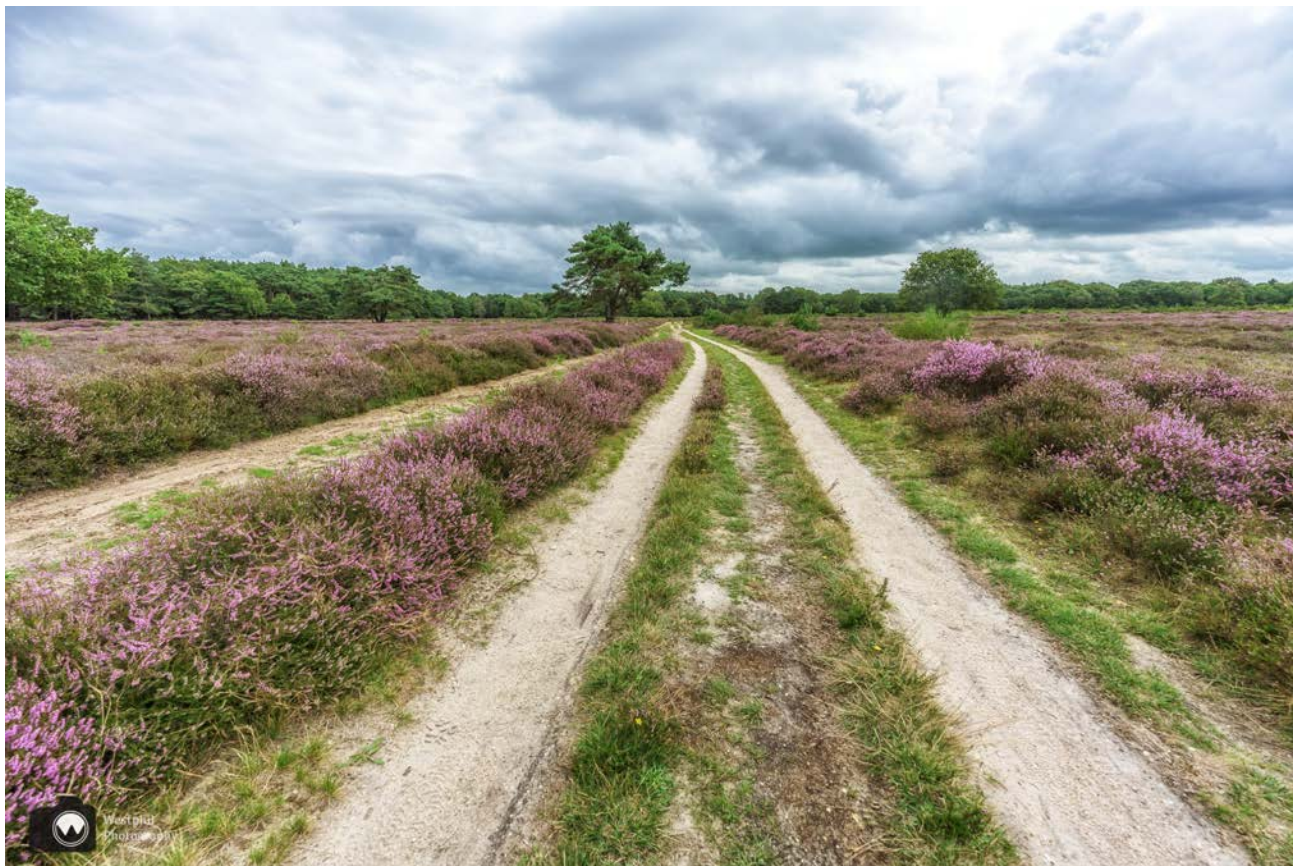
Paadjes en een prachtig uitzicht op de krentenboompjes.

heuvel is ontstaan in de laatste ijstijd, en bestaat uit fijn zand dat door de wind is afgezet. Er zijn tekenen van verdwenen grafheuvels uit de bronstijd.