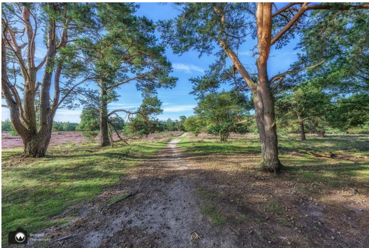
Er zijn ook delen waar wat meer bomen staan en iets minder heide.