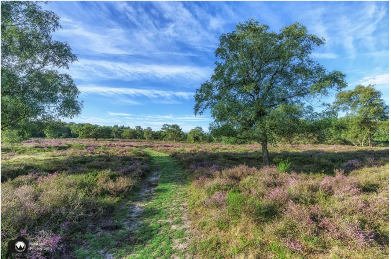
Mooie paadjes, paarse heide en prachtige bomen.

groene pijlen zijn al snel gevonden en voordat we het weten staan we foto's te nemen van de heide.