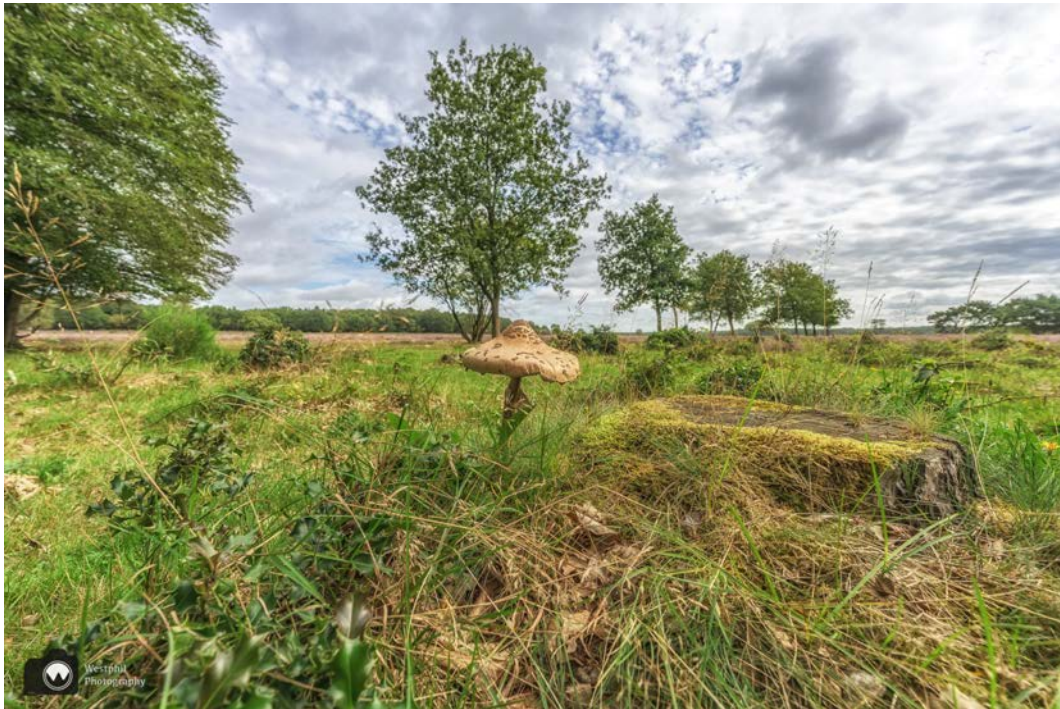
Een parasol paddestoel.