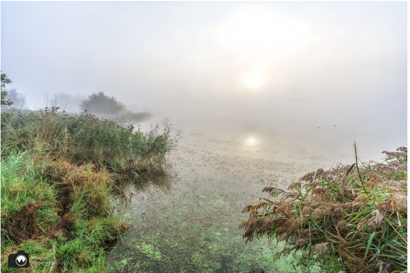
Een waterig zonnetje.

In het midden is een eiland, waar we in het water twee zwarte zwanen zien. We horen de snelweg en de vogels. Verder zijn we helemaal alleen in een mistige wereld. Pas als we verderop over de bruggen en paden langs de plas lopen piept er een waterig zonnetje door de mist heen. Ergens in het riet horen we een cetti's zanger, maar we zien hem niet.