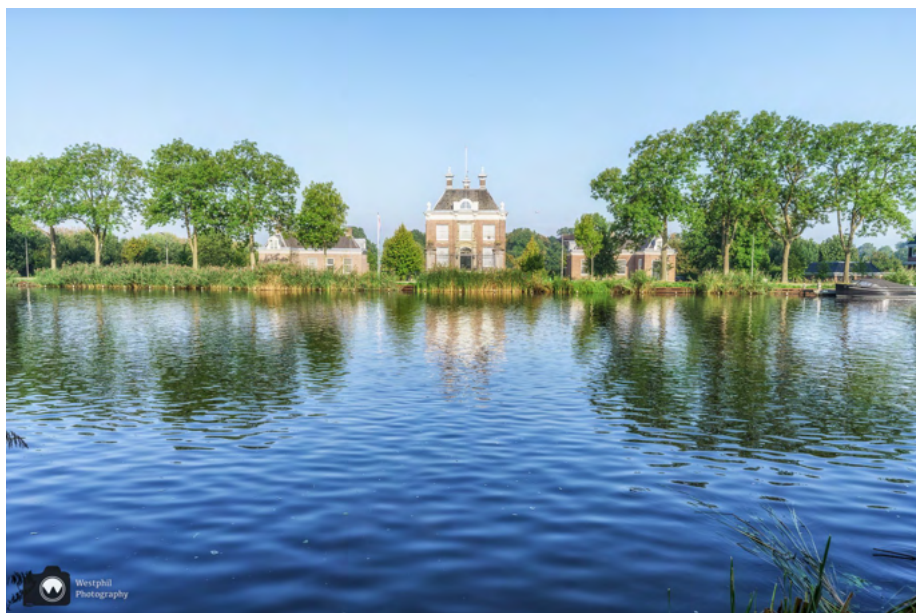
Wat een mooi huis!

Aan de overkant is Amstelveen. Het ziet er veel landelijke uit dan we hadden verwacht. Wat een mooie plek! We passeren de begraafplaats Karssenhof en aan de overkant zien we een prachtig huis die mooi spiegelt in het water.