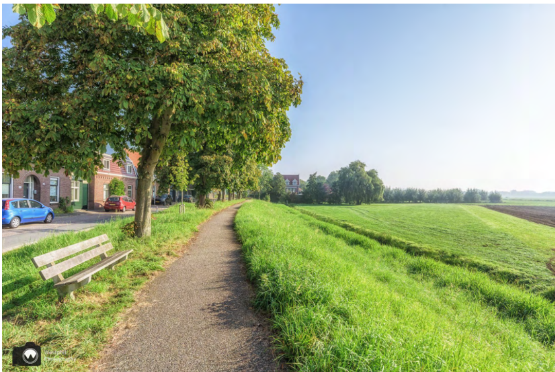
Langs het Hoger Einde-Noord.

Aan de overkant is Amstelveen. Het ziet er veel landelijke uit dan we hadden verwacht. Wat een mooie plek! We passeren de begraafplaats Karssenhof en aan de overkant zien we een prachtig huis die mooi spiegelt in het water.