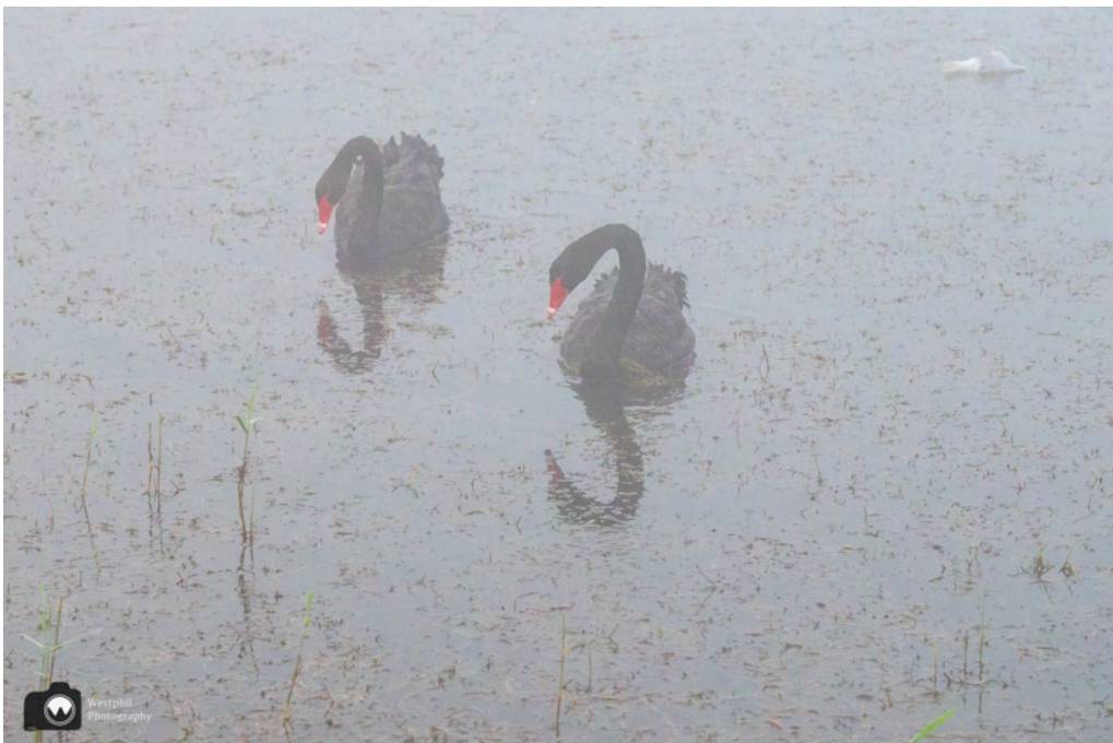
Zwarte zwanen in de mist.

We lopen richting de kleine rotonde en zijn even in de war door de pijlen. Je kunt kiezen om langs de plas te lopen of over het vlonderpad. Natuurlijk gaan wij over het vlonderpad. We genieten van de kleine wereld om ons heen en zien veel watervogels zoals meerkoeten, zwanen en futen. Net als ik even niet oplet, ziet Adriaan een ijsvogel vliegen.