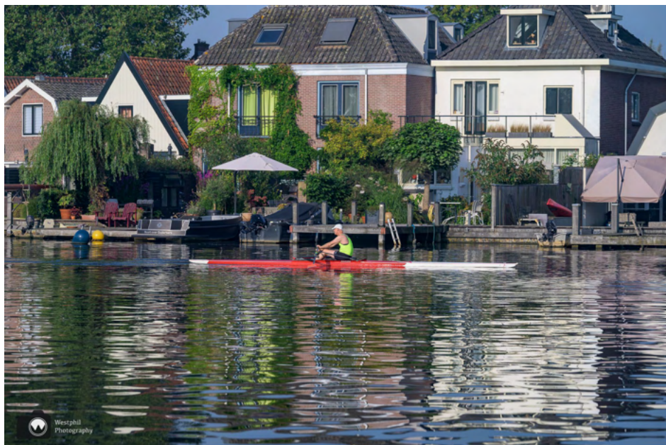
Deze roeier is hard aan het trainen op de Amstel.

Wij lopen het oude dorp uit over een fietspad en onder een viaduct door. Er bloeien nog korenbloemen, klaprozen en wilde bloemen in de berm bij het viaduct.