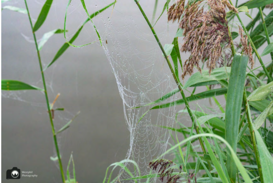
De spinnenwebben zijn extra mooi door de mist.