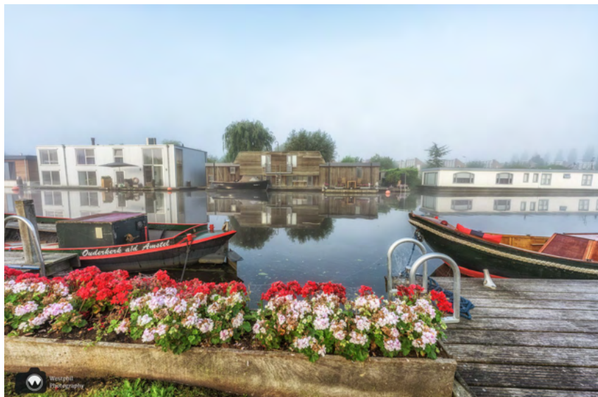
Als het windstil is, spiegelen de woonboten in het water.

Wij wandelen maar een klein stukje langs de Ouderkerkerplas, want we gaan richting Ouderkerk aan de Amstel. Na wandelkeuzepunt 45 slaan we rechtsaf om langs de Bullewijk te lopen. Dit riviertje is een oostelijke zijtak van de Amstel .