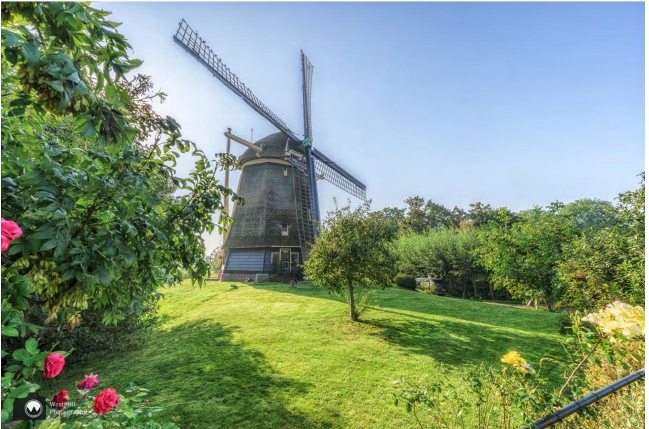
Molen de Zwaan is een plaatje.

Molen de Zwaan is een met riet gedekte poldermolen. De molen bemaalde de Klein-Duivendrechtse- en Binnenbullewijkerpolder tot 1909. Daarna nam een stoomgemaal die taak over.