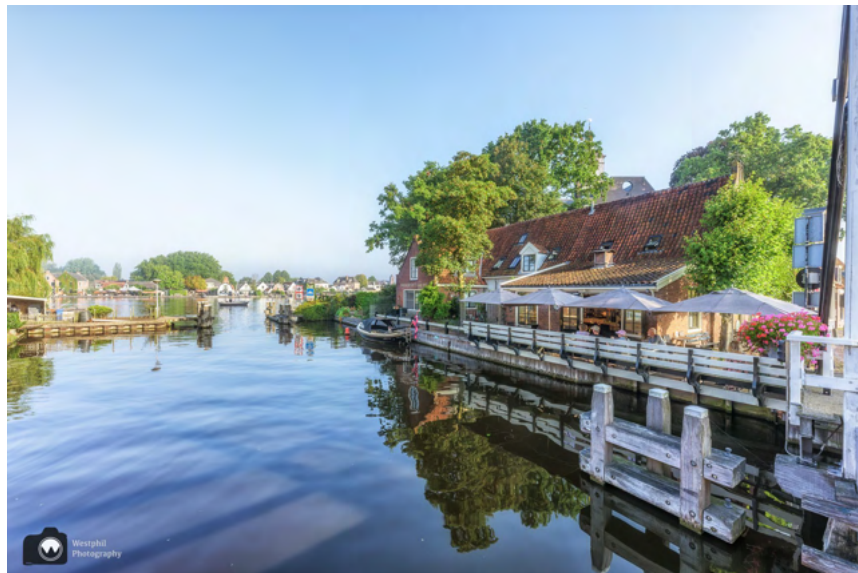
Uitzicht vanaf de Kerkbrug.

Het dorp dat ouder is dan Amsterdam heeft een oude dorpskern met een rijk cultureel erfgoed. Een deel is een beschermd dorpsgezicht. Er zijn verschillende rijksmonumenten, waaronder de Amstelkerk, de Urbanuskerk, de molen De Zwaan, de Joodse begraafplaats en de Kerkbrug.