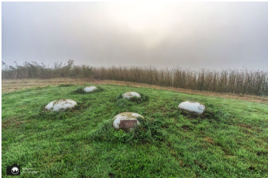
Kunstwerk geplaatst als dankbetuiging voor Burgermeester Mieke Blankers-Kasbergen.

De Ouderkerkerplas is een recreatie- en natuurgebied ten zuidoosten van Ouderkerk aan de Amstel. De plas is ontstaan omdat er zand nodig was voor de aanleg van de Rijksweg A9. Het diepste stuk is 43 meter. Naast de diepe zandwinput is er een ondiep gedeelte met een recreatiestrand. De plas is een belangrijke overwinteringsplaats voor zeer veel vogels.