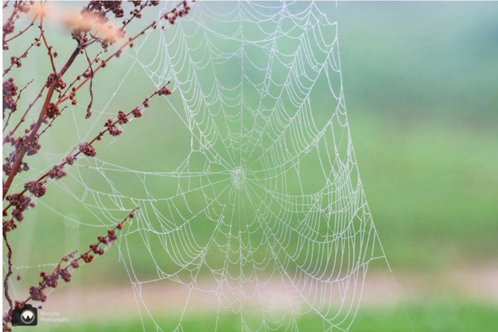
Nog eentje dan van een mooi spinnenweb.

april het pad aan de zuid- en deels oostkant van het water afgesloten voor alle bezoekers en daarom gaan we daar vandaag niet langs.