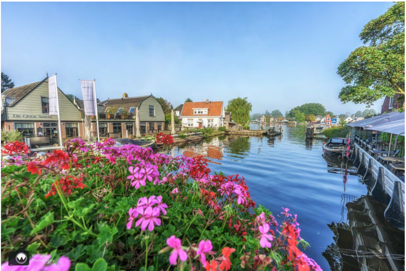
Fijne plekjes om even plaats te nemen aan het water.

Restaurant De Oude Smidse is de hele week open vanaf 12 uur, behalve op maandag. Je kunt ook terecht bij de tearoom van bakker Out , die alleen op zondag gesloten is. Verderop in het dorp zijn nog veel meer restaurants met gezellige terrassen.