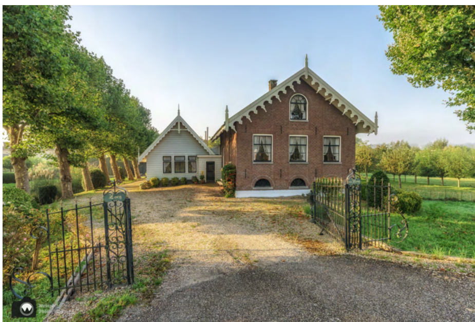
Zorg en Hoop staat er op het hek.

Ook hier liggen weer leuke boten en zien we mooie huizen. Op het hek van een prachtige boerderij staat: "Zorg en Hoop". Sinds de komst van rijksweg A9 is dit geen boerenbedrijf meer. De snelweg deelde het land van de boer in tweeën.