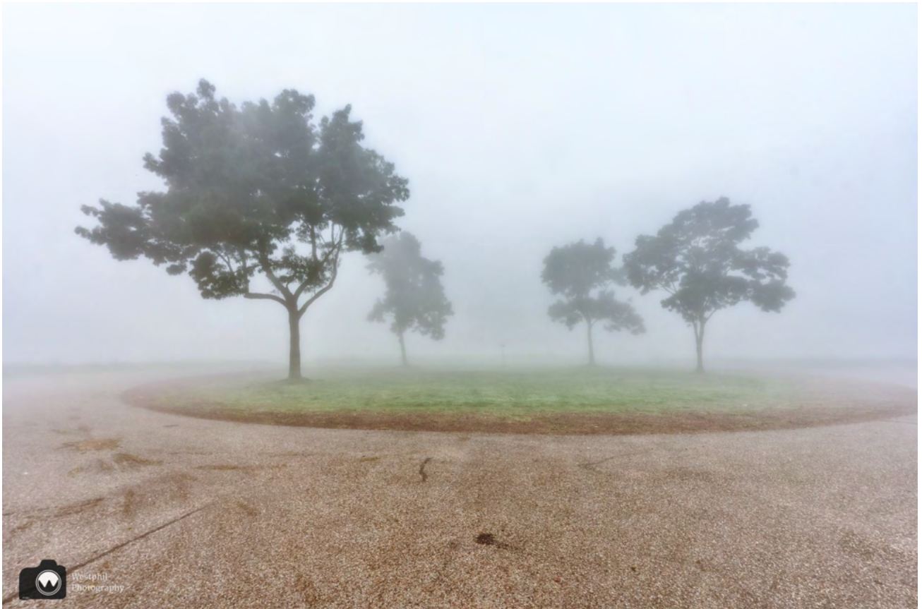
Ergens achter deze rotonde is de Ouderkerkerplas.

We zijn vroeg opgestaan om de zonsopkomst mee te maken aan de Ouderkerkerplas, maar hoe dichterbij onze bestemming hoe mistiger het wordt. Gelukkig zien we wel waar we lopen en ontdekken we al snel de pijlen richting de plas.