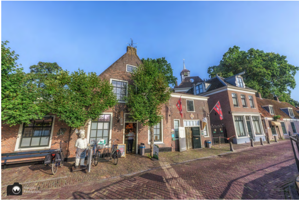
Het mooie pand van bakker Out.