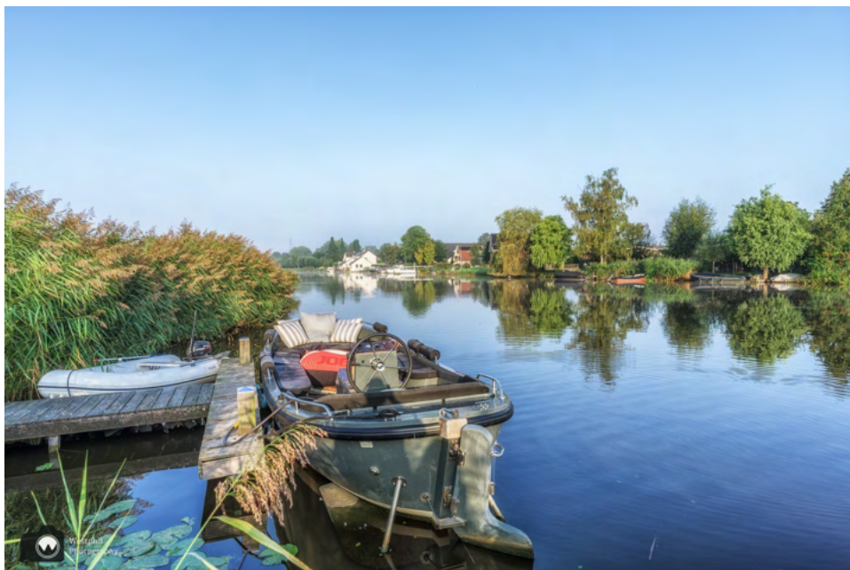
Hier liggen ook mooie boten en zien we spiegelende huizen.

Ook hier liggen weer leuke boten en zien we mooie huizen. Op het hek van een prachtige boerderij staat: "Zorg en Hoop". Sinds de komst van rijksweg A9 is dit geen boerenbedrijf meer. De snelweg deelde het land van de boer in tweeën.