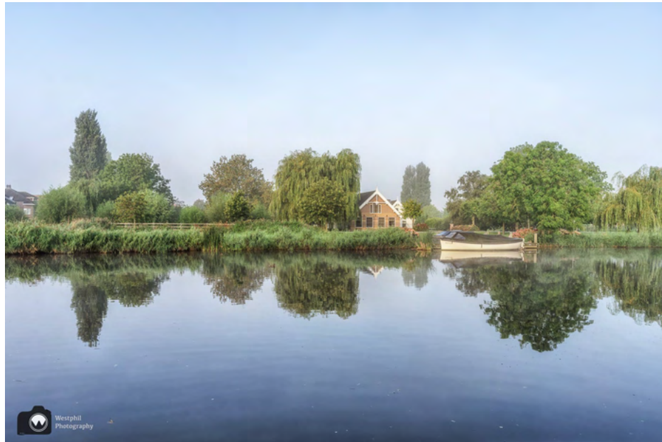
Prachtig huis aan de overkant van de rivier.

Er staat nagenoeg geen wind dus bij elke steiger staan we stil om foto's te maken van de woonboten en huizen die spiegelen in het water. Het is jammer dat er aan de kant van het water geen stoep is. Bij elk doorkijkje lopen we over de weg naar het water. Gelukkig rijden er zo vroeg nog niet veel auto's over de Holendrechteweg.