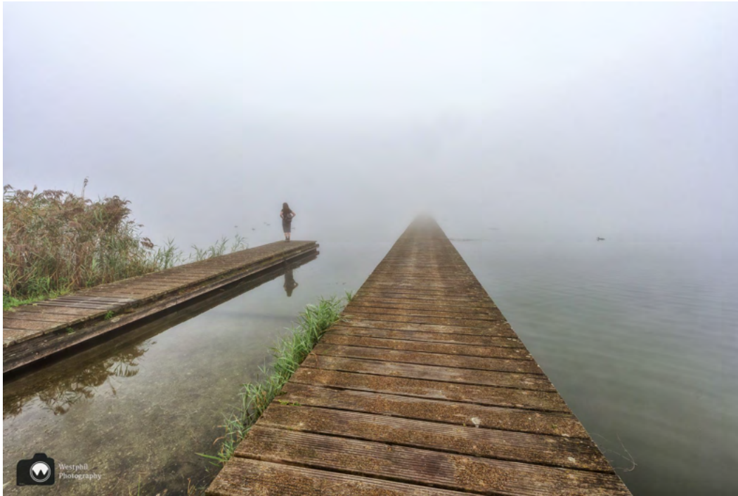
Het vlonderpad verdwijnt in de mist.

We lopen richting de kleine rotonde en zijn even in de war door de pijlen. Je kunt kiezen om langs de plas te lopen of over het vlonderpad. Natuurlijk gaan wij over het vlonderpad. We genieten van de kleine wereld om ons heen en zien veel watervogels zoals meerkoeten, zwanen en futen. Net als ik even niet oplet, ziet Adriaan een ijsvogel vliegen.