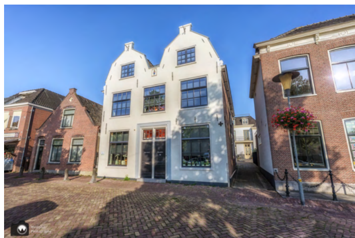
Oorspronkelijk maakte dit witte huis deel uit van het complex van diaconiehuysjes, net als het museum Amstelland ernaast.

We lopen langs de Amstelkerk, een hervormde kerk uit 1775. De kerk heeft de vorm van een Grieks kruis en is ontworpen door Jacob Eduard de Witte. De kerkheuvel is één van de oudste plekken van Amstelland, dit is de vierde kerk op deze plek. We zien niet veel van de kerk, omdat er hele grote bomen voor staan. Toch in de winter maar een keer terugkomen als de bladeren van de bomen zijn.