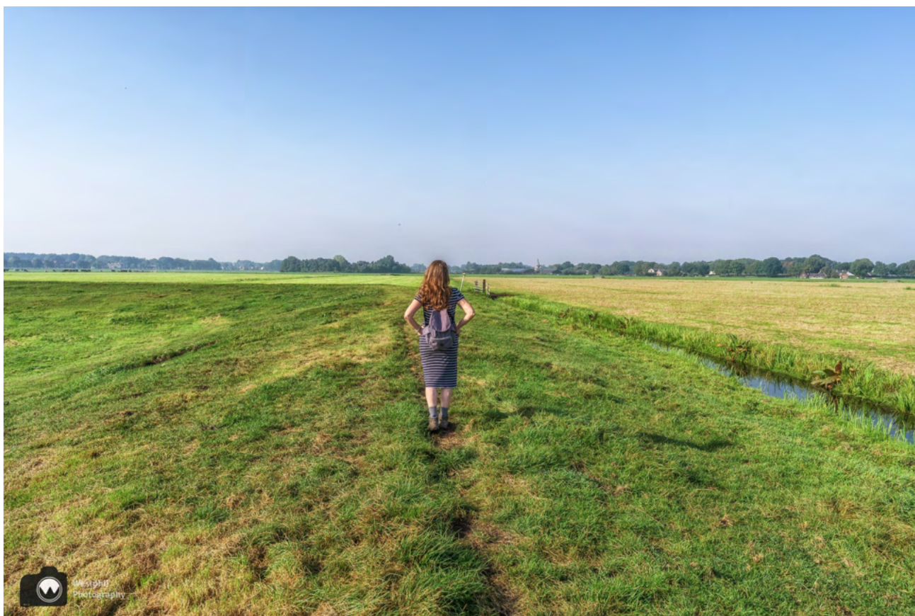
Niet alleen verharde paden.

Verderop zien we de snelweg en de skyline van Amsterdam. We herkennen de Johan Cruijff Arena en nog een paar andere gebouwen. We vervolgen onze weg achter de gele pijlen aan en wandelen door het weiland. We zien heel veel buizerds vliegen en dat is altijd een mooi gezicht.