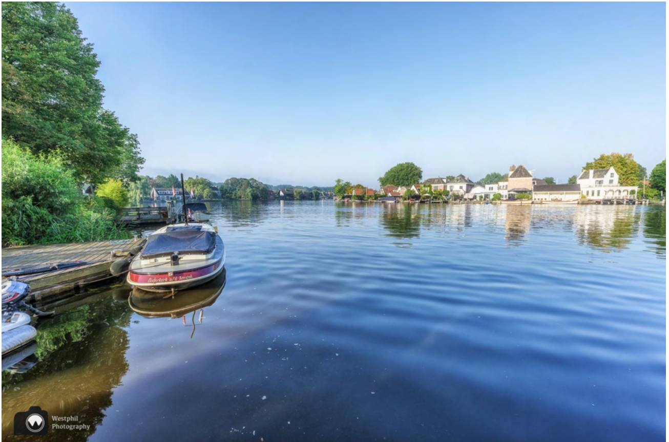
Even een omweggetje naar het water.

Het water blijft ons trekken. Als we in de Dorpsstaat links van ons een vlonderpad zien, naast het parkeerterrein van de Plus, lopen we even naar het water om naar de roeiers op de Amstel te kijken.