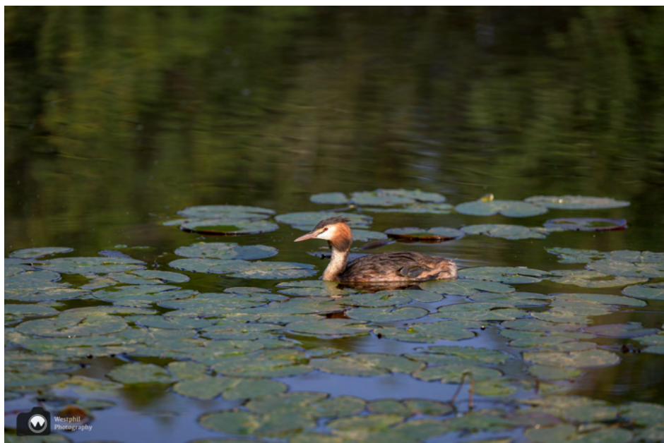
Geen foto van de wilde bloemen, maar wel een fuut op het water.

Wij lopen het oude dorp uit over een fietspad en onder een viaduct door. Er bloeien nog korenbloemen, klaprozen en wilde bloemen in de berm bij het viaduct.