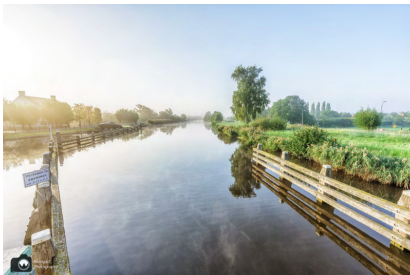
Uitzicht vanaf de brug.

We steken de Bullewijk over via de Jan Benningbrug. Er hangt nog steeds een beetje mist op het water. Op het midden van de brug staan we even stil om van het uitzicht te genieten.