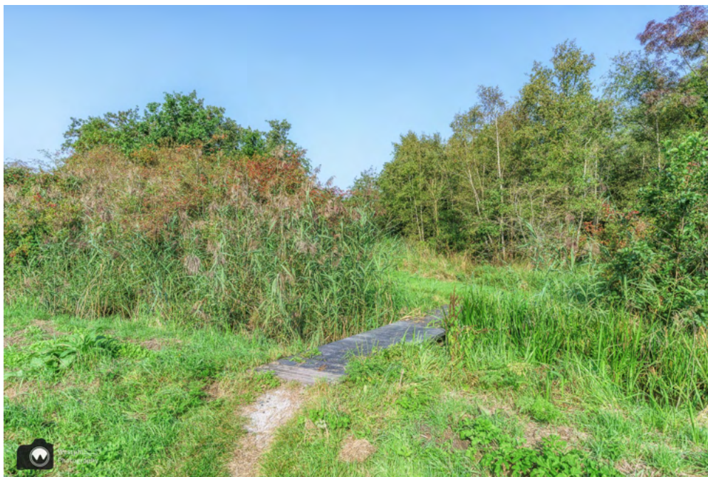
Fijn het groen weer in.

We wandelen langs smalle paadjes over vlonderbruggen, over en langs het water. Door stukken bos, langs het riet en grasland. Voordat we het weten zijn we weer terug bij de Ouderkerkerplas, die er heel anders uitziet dan vanochtend.