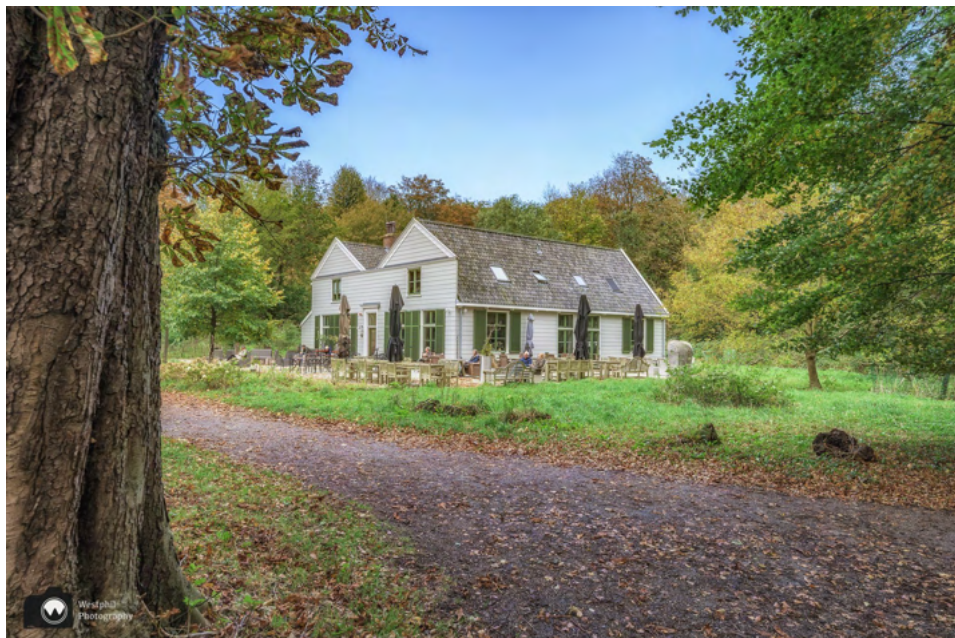
Gasterij Leyduin is gevestigd in het Juffershuis of Tweelinghuis.

Vlakbij de moestuin bevindt zich Gasterij Leyduin in het Juffershuis of Tweelinghuis. Dit zomerhuis uit 1796 is het oudste gebouw van Buitenplaats Leyduin. Hier kun je wat eten of drinken, maar je kunt er ook overnachten. Het restaurant is elke dag geopend van 9.00 tot 17.00 uur.