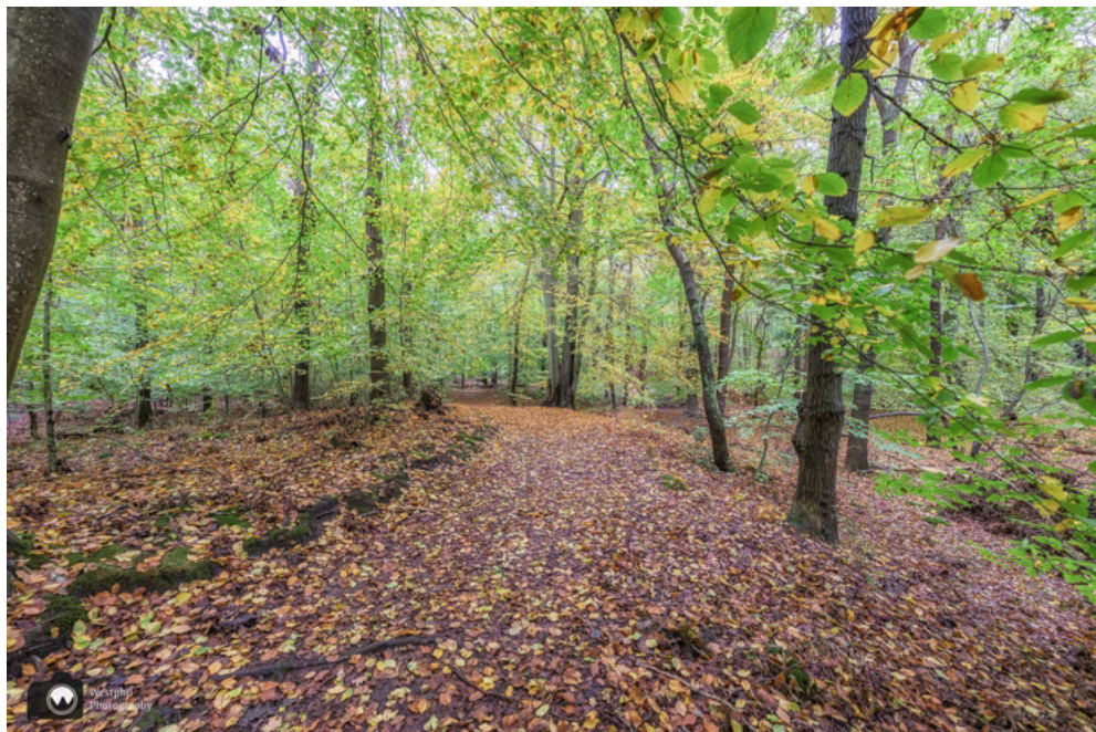
Verderop in het bos.

We wijken even af van de route en volgen een pad met een houten balustrade. Eigenlijk moeten we gewoon de weg vervolgen, maar wij zijn nieuwsgierig waar het pad naartoe gaat. We komen uit bij een uitkijkpunt met een bankje.