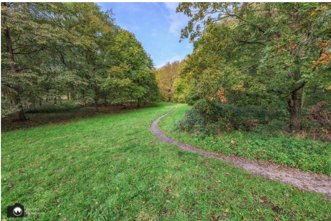
Je wandelt door prachtige statige lanen, maar ook over kronkelpadjes.

Buitenplaatsen Leyduin, Vinkenduin en Woestduin bij Vogelenzang zijn samen bekend onder de verzamelnaam Buitenplaats Leyduin. Hier vind je de meest imposante binnenduinbossen van de hele omgeving, met lanen als kathedralen en spannende kronkelpaden. Landschap Noord-Holland is sinds 1997 eigenaar van deze prachtige buitenplaats.