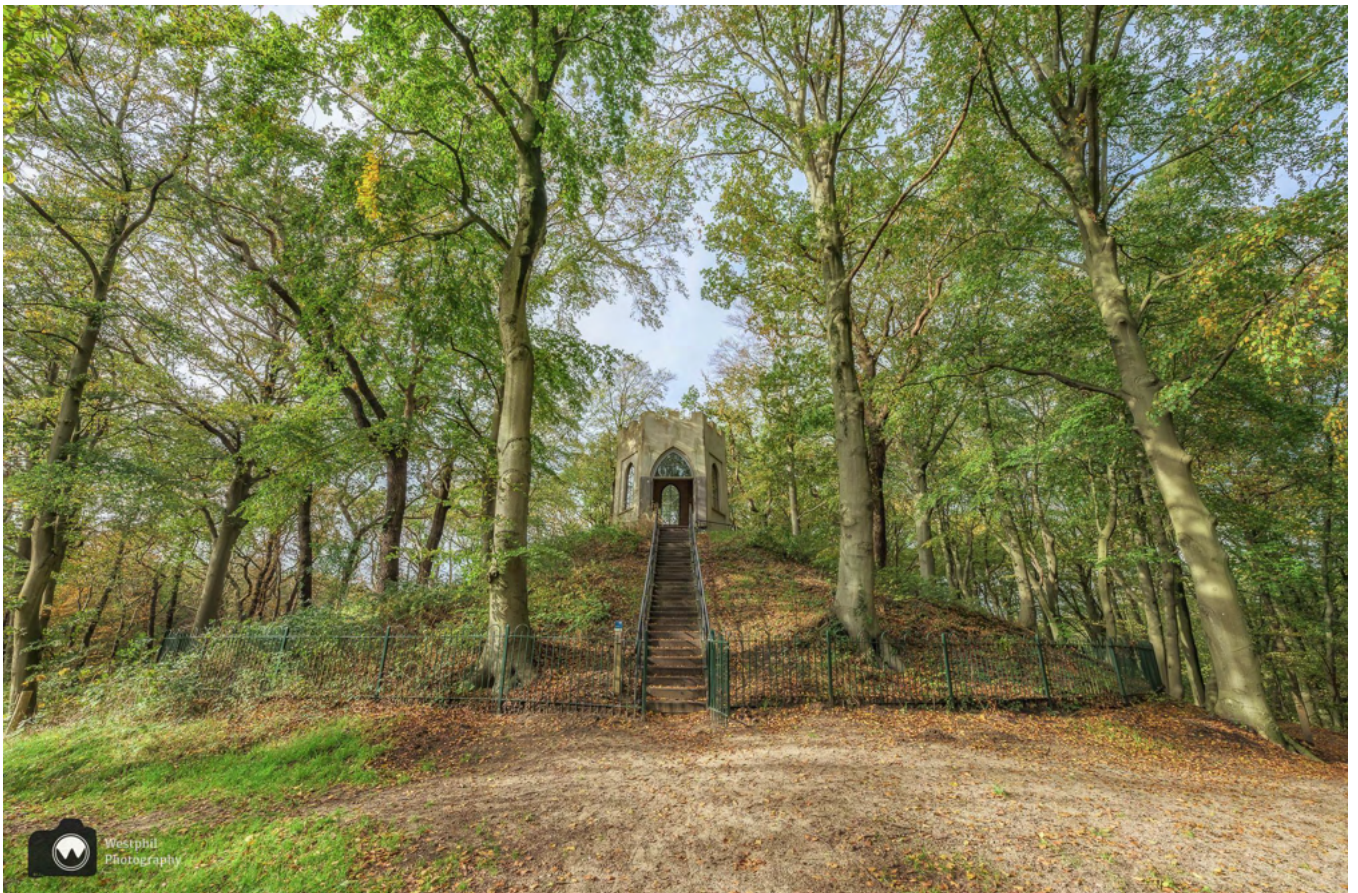
Wij vinden de voorkant van Belvédère het mooist.

De route voert je langs de Belvédère en vervolgens weer naar beneden richting de Leybeek, maar wij gaan ook even binnenkijken bij het mooie torentje. Daarna lopen we de trap af en wandelen we nog een stukje de laan aan de voorkant van het Belvédère in, want vanaf daar kun je de mooiste foto maken.