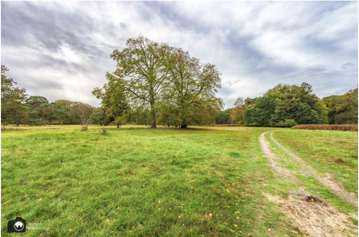
Je kunt je niet voorstellen dat hier vroeger een paardenrenbaan was.

Hier kom je langs aan het begin van de wandeling. Landschap Noord-Holland zorgt ervoor dat de contouren van de renbaan in hoofdlijnen zichtbaar blijven.