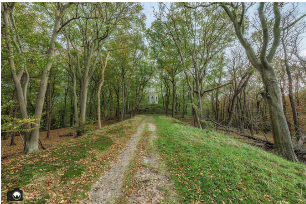
Het is nu al zo mooi. Moet je voorstellen hoe het eruit ziet als de bomen hun herfststooi tonen.

Uiteindelijk komen wij daar ook uit. Het is een schitterende laan geflankeerd met loofbomen en in de verte het prachtige torentje.