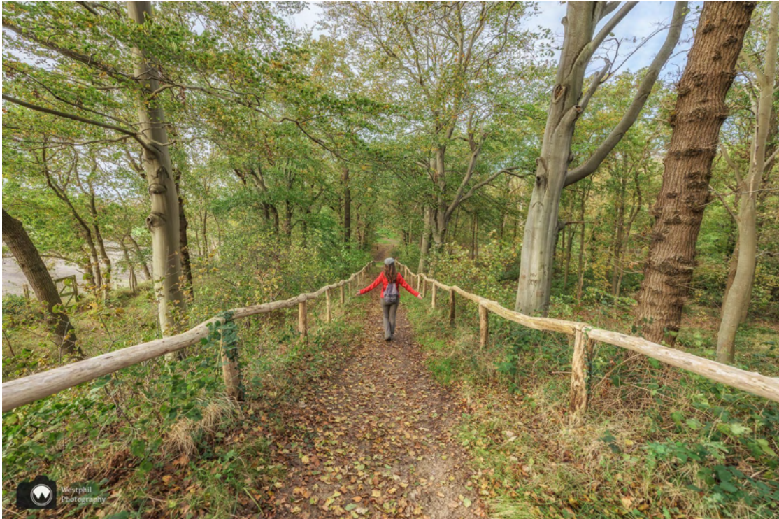
Dit weggetje leidt naar een uitkijkplek op de bollenvelden met een bankje.

We wijken even af van de route en volgen een pad met een houten balustrade. Eigenlijk moeten we gewoon de weg vervolgen, maar wij zijn nieuwsgierig waar het pad naartoe gaat. We komen uit bij een uitkijkpunt met een bankje.