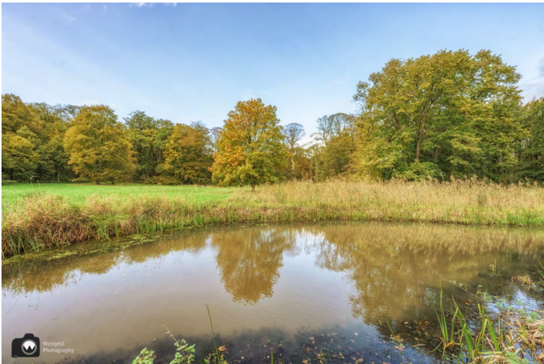
Een prachtige vijver.