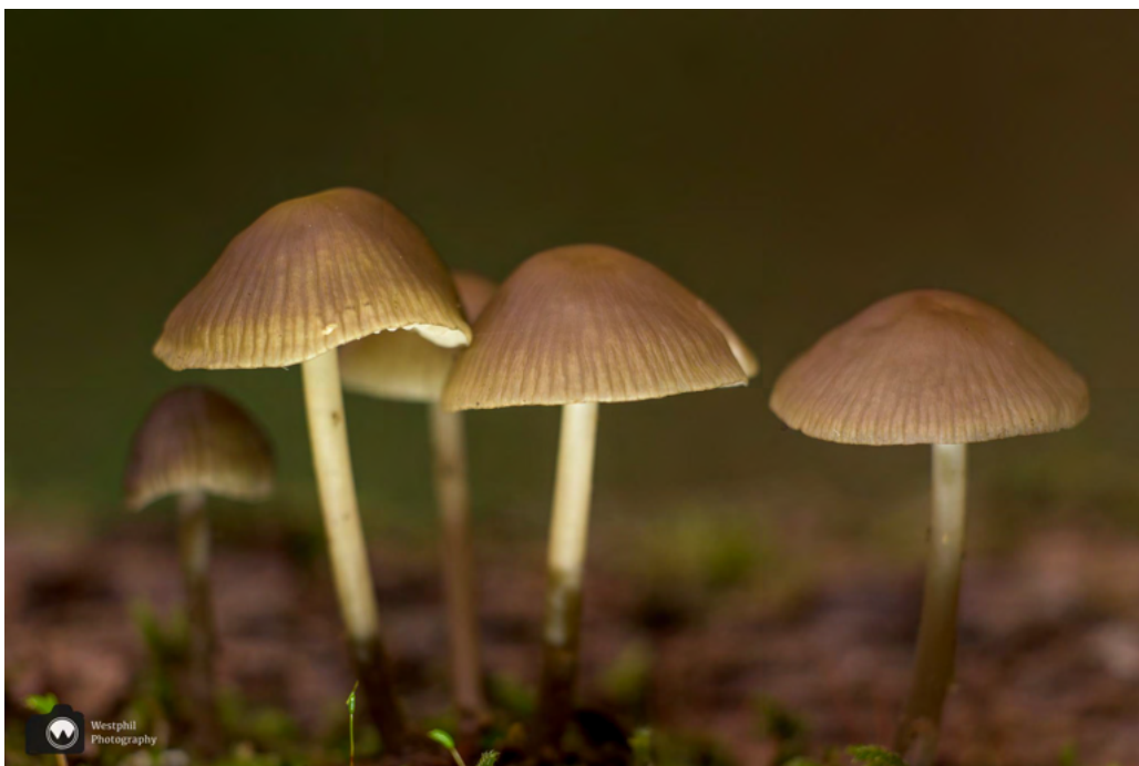
Vlabbij het Koetshuis kwamen we deze paddenstoelen tegen.