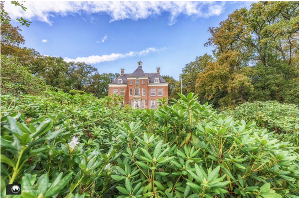
Het prachtige Huis Leyduin.

stijlkamers. Ze zijn te huur voor speciale gelegenheden zoals een familiebijeenkomst, vergadering of receptie. De bovenverdiepingen worden verhuurd aan diverse bedrijven. Nadat we de foto's hebben geschoten, wandelen we het laatste stuk van de route terug naar het parkeerterrein.