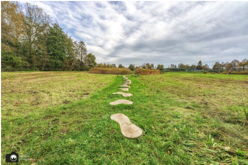
De stapstenen beginnen op het gras, maar je gaat ook door het water.

We wandelen weer verder en komen langs het Struinbos en de stapstenen. Het is dat we weten dat de stapstenen er zijn. Het riet staat zo hoog dat ze bijna niet opvallen.