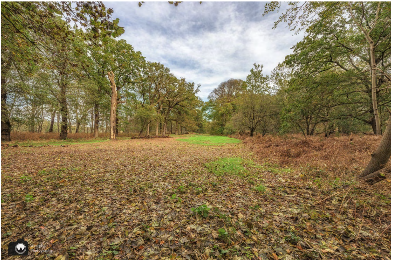
De bomen zijn nog steeds groen.

We wandelen al snel in het bos. Het valt ons op dat er nog maar weinig bomen verkleurd zijn. Is de herfst laat dit jaar, of hebben we gewoon geen geduld?