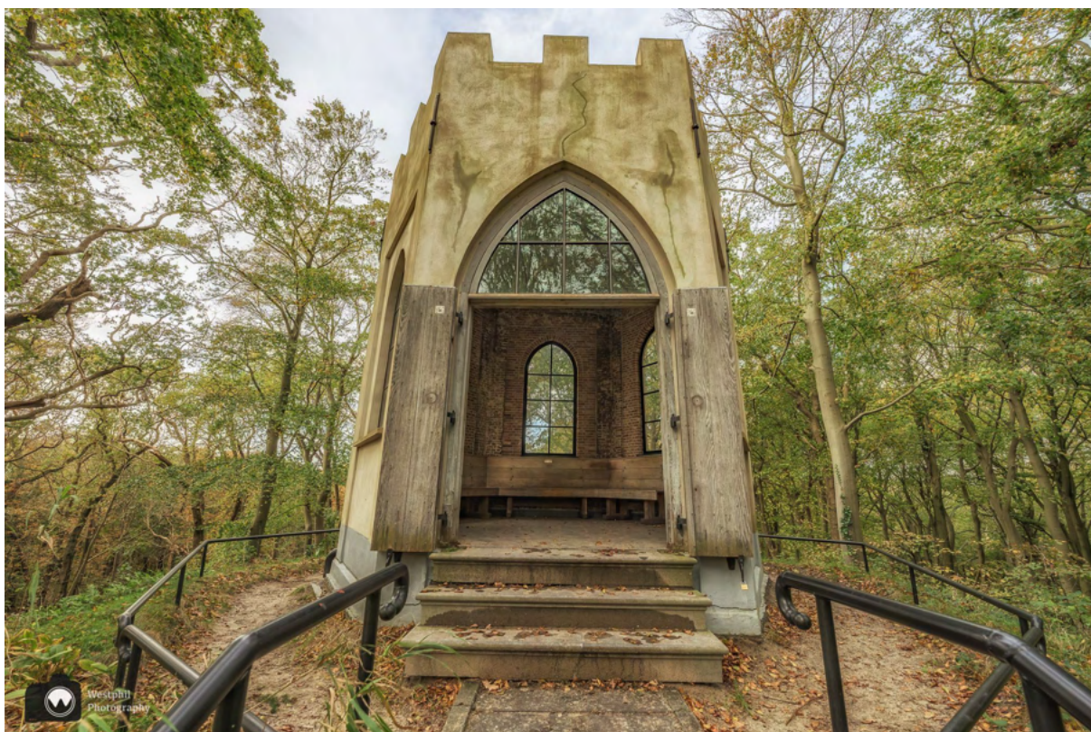
Het Belvédère van dichtbij.

Na ons omweggetje volgen we weer braaf de route. We komen langs een dam met een cascade. Door de 3 schuiven in te stellen, kon men zorgen voor een hoog peil aan de westkant, zodat er een klaterende waterval te zien was aan de oostkant van de dam. Dit was een feestelijk gebeuren en leuk om de gasten op het landgoed te vermaken.