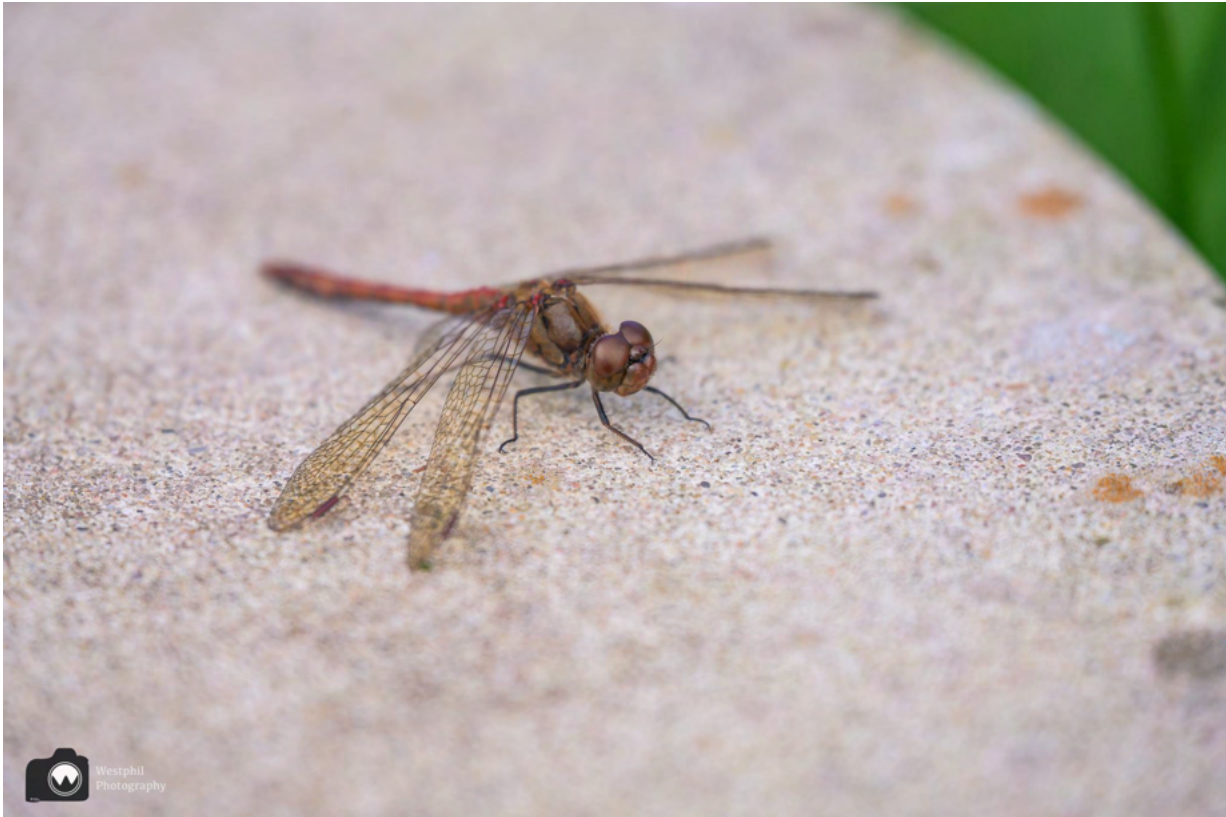
De libelle blijft goed zitten voor de foto.

Natuurlijk wijken we af van de route om over de stapstenen te wandelen. We moeten voorzichtig doen, want er zitten libellen uit te rusten op de stapstenen.