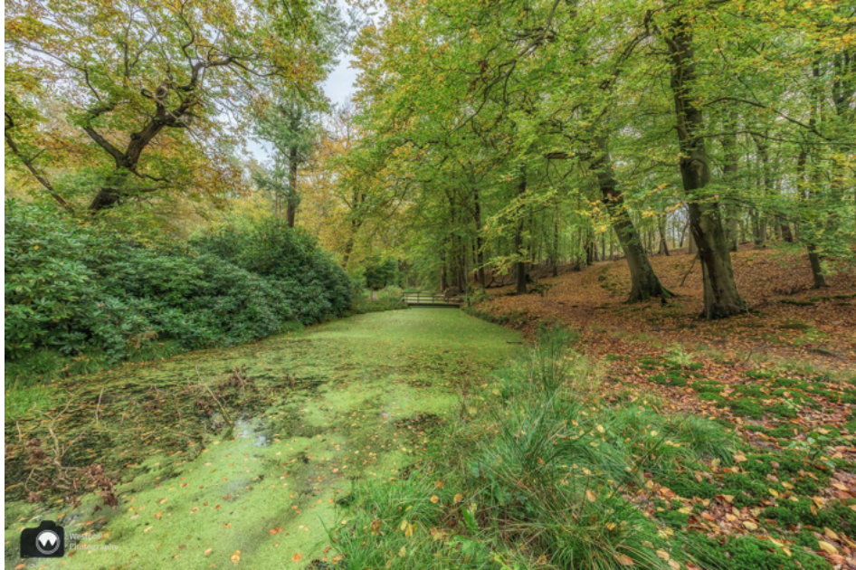
Dit stukje langs de beek wil je ook eigenlijk niet missen.

De beek is prachtig en je kunt een heel stuk langs de beek blijven wandelen. Dat doen we ook, omdat we een schuine rode pijl bij een driesprong verkeerd interpreteren. Het is de bedoeling dat je niet langs de beek blijft lopen, maar kiest voor de lange, statige laan naar het Belvédère.