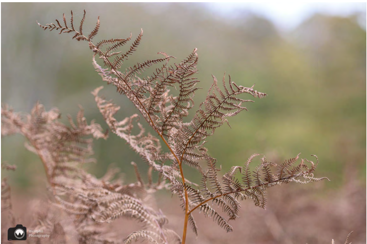
De varens zijn wel verkleurd.

De adelaarsvarens kleuren mooi oranjebruin en zorgen daarmee toch een beetje voor een herfst sfeertje. Ze zijn zo hoog, dat een ree zich er makkelijk in kan verstoppen.