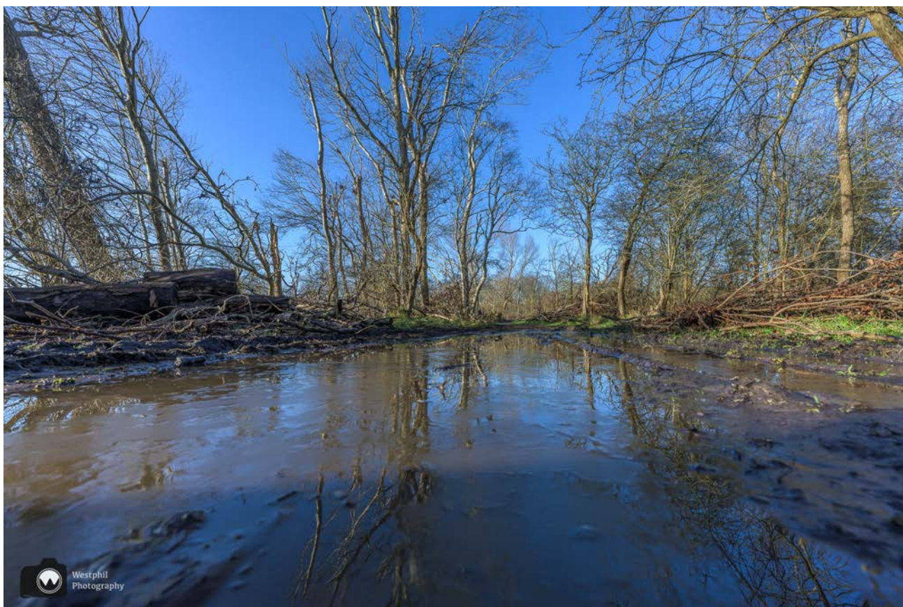
Een modderig paadje.