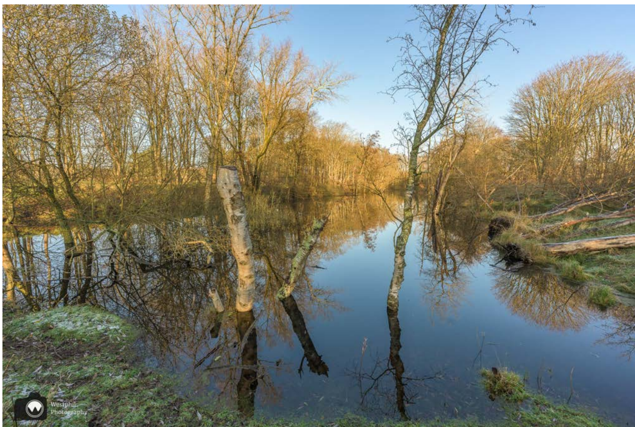
Geen watervogels, maar wel een mooie spiegelende sloot.

De Atlantikwall was een door de Duitsers aangelegde verdedigingslinie. Deze was wel 2500 km lang en liep van de kust van Noorwegen tot aan de Frans-Spaanse grens. Er liggen nog heel wat bunkers onder het zand verborgen. Deels zijn ze nu winterslaapplaats voor vleermuizen en het oude beton is groeiplaats van bijzondere mossen.