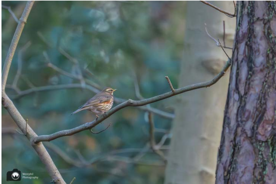
We zagen heel veel vogels, waaronder deze koperwiek.

We genieten heel erg van het mooie bos, de opkomende zon en de fluitende vogels. Hele zwermen kleine vogels vliegen voor ons uit. Het zijn vinken, koolmeesjes en pimpelmeesjes. Ook zien en horen we veel boomkruipers en een specht.