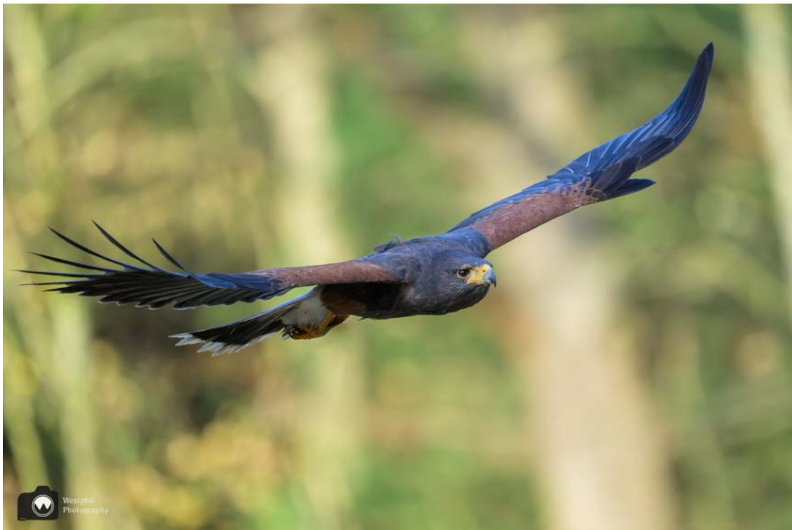
Een woestijnbuizerd van de roofvogelshow.