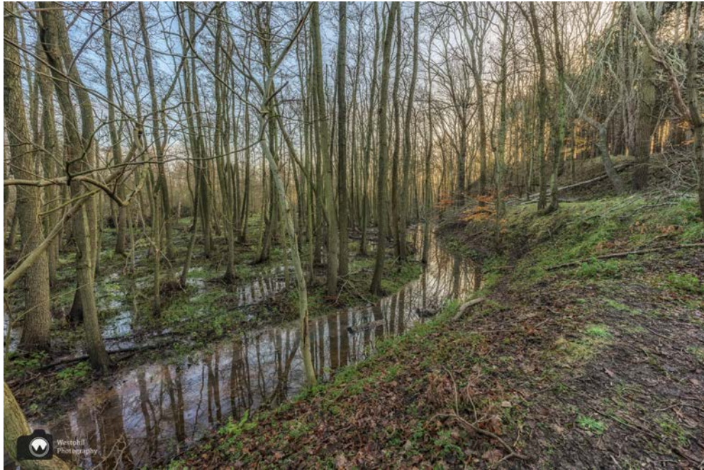
Gelukkig lopen wij over een hoger gelegen wandelpad.

We vervolgen onze weg over een smal wandelpad waar we natuurlijk tegenliggers tegenkomen. De hele weg nog geen wandelaars gezien en op een plek waar we elkaar nauwelijks kunnen passeren, komen we mensen tegen.