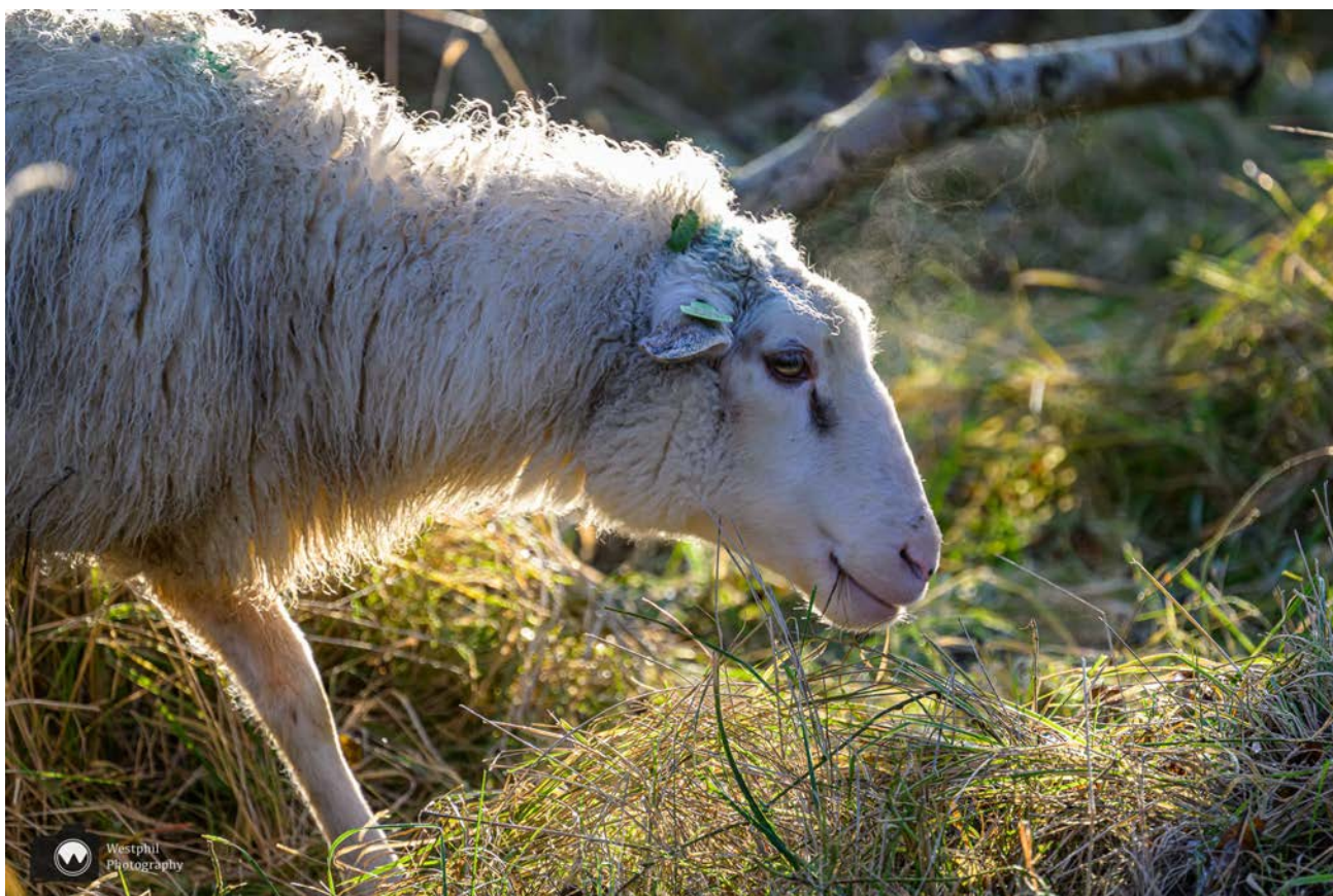
Het wolkje dat het schaap uitademt, moest op de foto.

Inmiddels heeft het bos plaatsgemaakt voor het open duingebied. Als we naar rechts kijken zien we prachtige duinen, maar ook een lelijk flatgebouw. De mensen die in die flat in IJmuiden wonen hebben vast een prachtig uitzicht. Jammer voor ons dat de flat boven de duinen uitkomt.