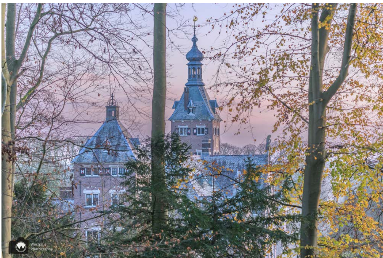
We stijgen boven het landhuis uit.

We lopen hoger en hoger. Af en toe bewonderen we nog een paddenstoel, maar de meeste zijn verregend en zien er niet meer zo mooi uit. De bomen zijn ook al een stuk kaler, je kunt aan alles zien dat het winter wordt. We voelen het ook, want het is -2. Als we bijna boven zijn hebben we een prachtig uitzicht op het mooie landhuis. Verderop lopen we door een hekje waarop staat dat we in het gebied van de grote grazers komen en dat het verboden is voor honden.