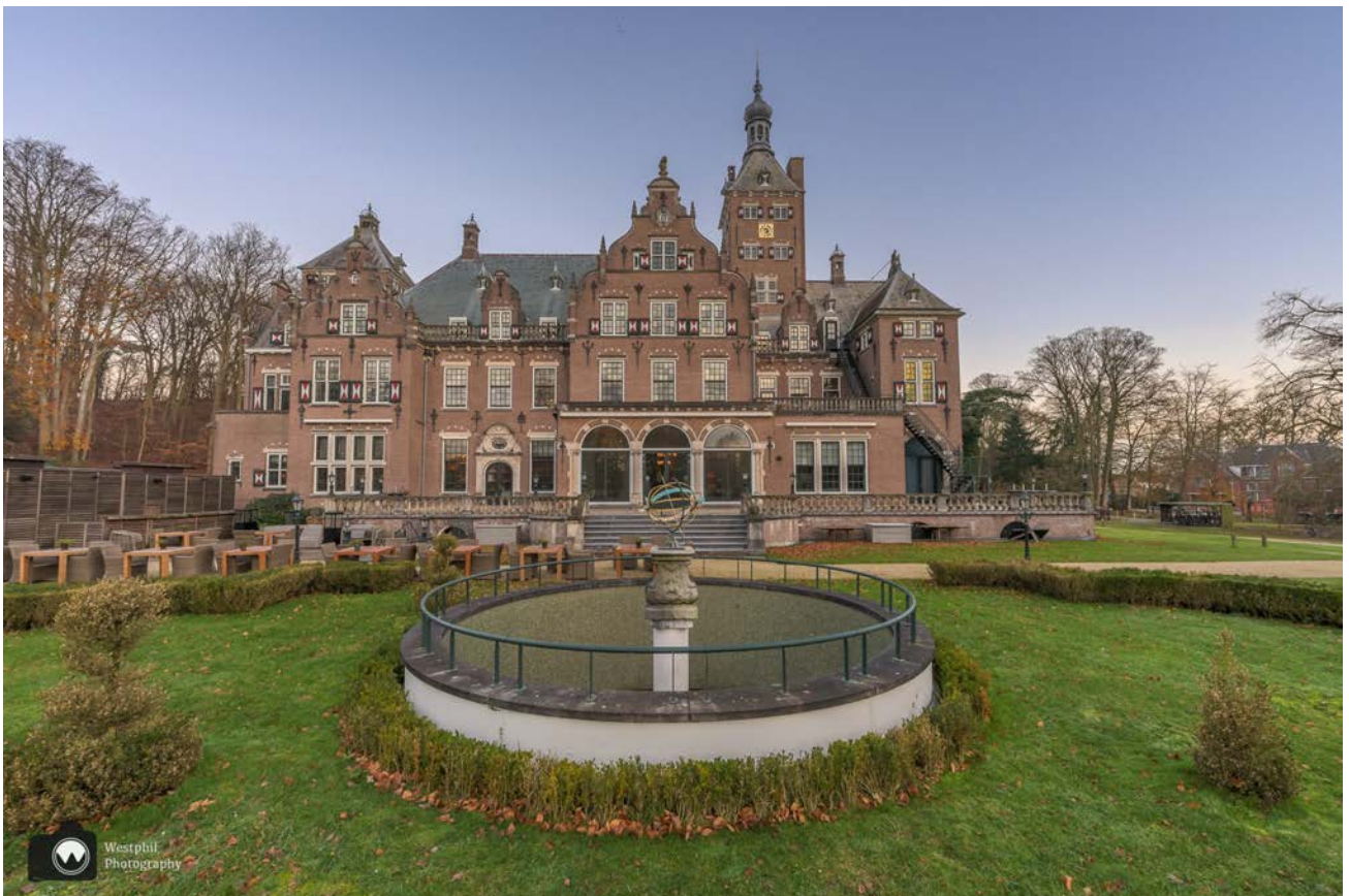
Ooit was dit het grootste woonhuis van Nederland, nu kun je er overnachten, ontbijten, lunchen of dineren.

Vorig jaar wandelden we ook vanaf dit startpunt, maar toen gingen we de andere kant op om de omgeving van Santpoort-Noord te verkennen. Vandaag lopen we in de duinen van Midden-Kennemerland, door Nationaal Park Zuid-Kennemerland en weer terug. Wij parkeren onze auto dichtbij hotel Duin- en Kruidberg. We zijn hier al meerdere keren geweest en deze plek blijft mooi. Natuurlijk maken we foto's van het hotel, want het licht is iedere keer weer anders.