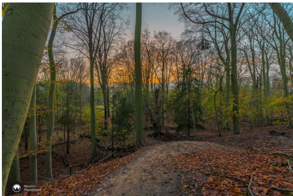
De zon komt prachtig op, maar er staan een paar bomen voor.

We genieten heel erg van het mooie bos, de opkomende zon en de fluitende vogels. Hele zwermen kleine vogels vliegen voor ons uit. Het zijn vinken, koolmeesjes en pimpelmeesjes. Ook zien en horen we veel boomkruipers en een specht.