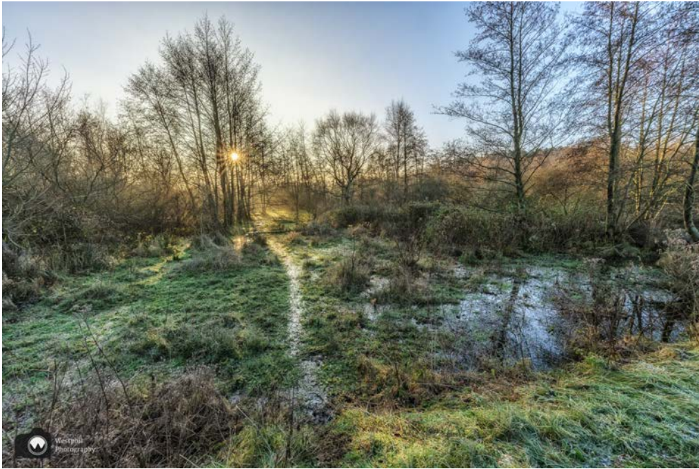
Een mystiek sfeertje

We komen langs wandelkeuzepunt 87 Startpunt midden-herenduin driehuis / Santpoort-Noord. Je kunt hier ook de wandeling starten.