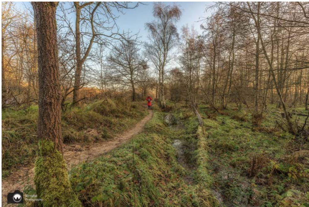
Een heel smal paadje.

We vervolgen onze weg over een smal wandelpad waar we natuurlijk tegenliggers tegenkomen. De hele weg nog geen wandelaars gezien en op een plek waar we elkaar nauwelijks kunnen passeren, komen we mensen tegen.