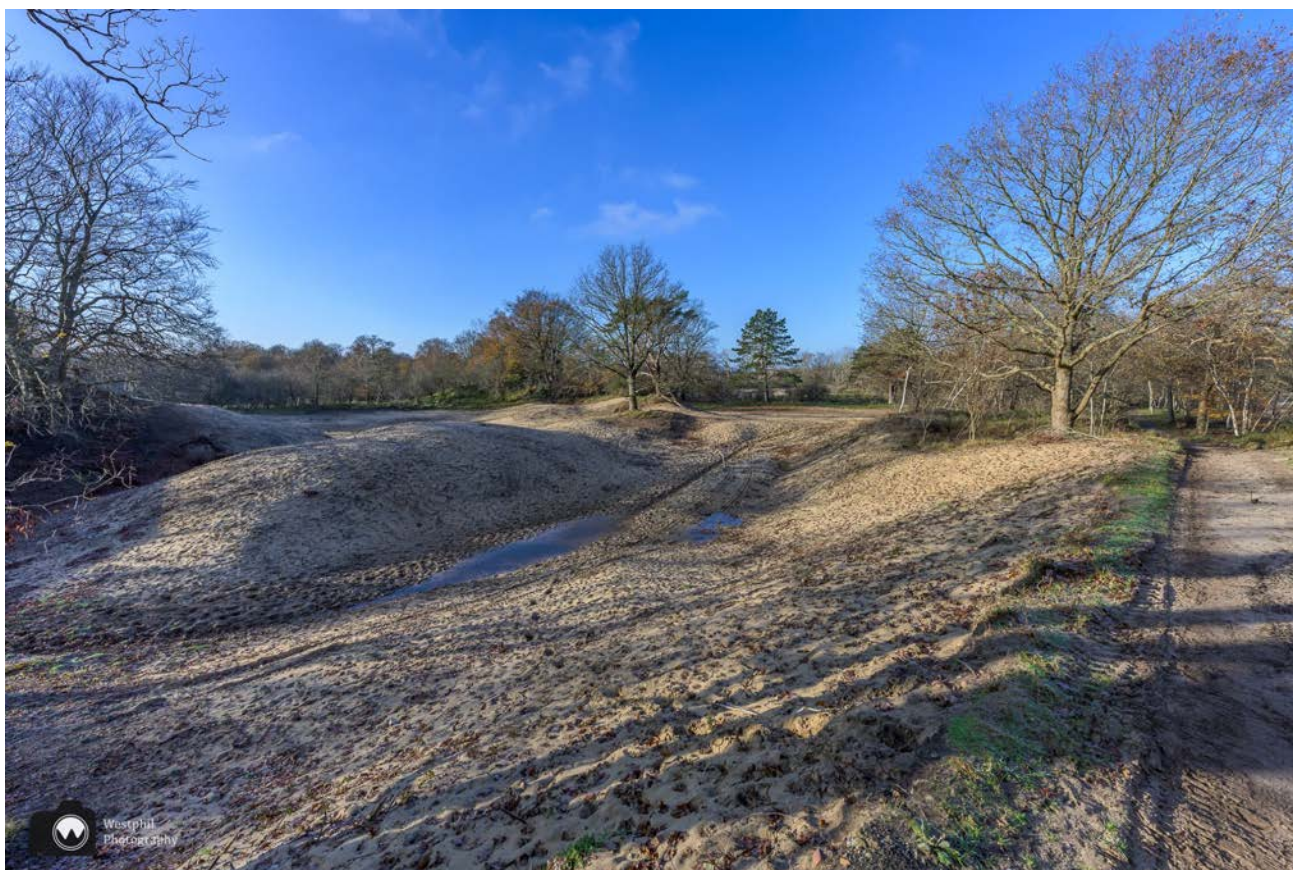
Het is hier wel erg kaal.