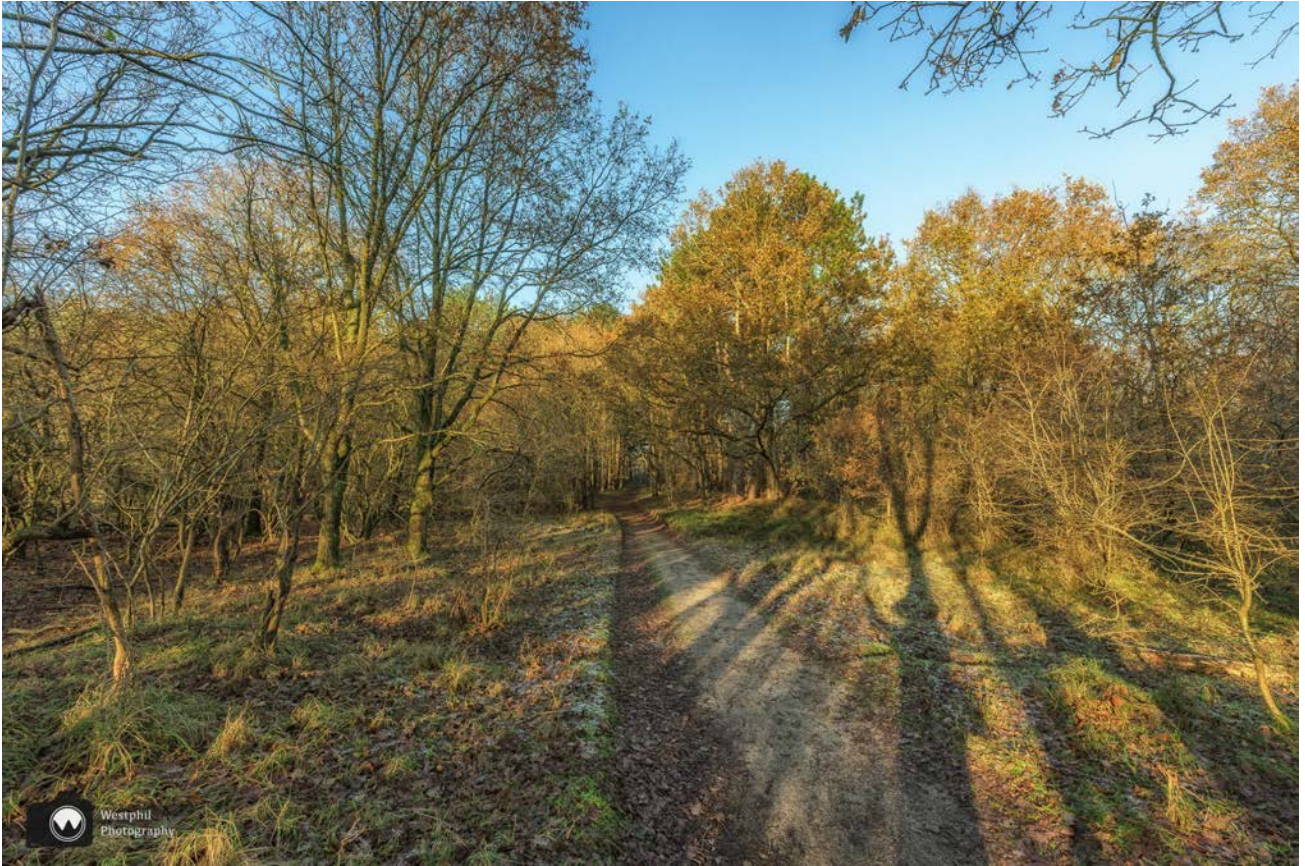
Een beetje herfst en een beetje winter.

wel iets dat lijkt op de afdruk van een ree. Dat zou ook fantastisch zijn als we een ree tegenkomen.