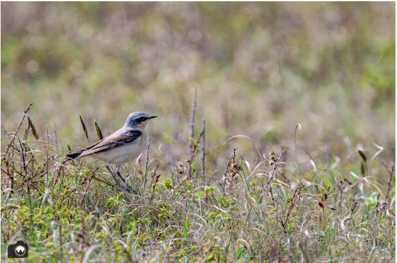
Een tapuit in de duinen.

We wandelen verder, af en toe zijn er doorkijkjes naar de overkant van de weg. We kijken we of we nog een haas kunnen vinden.