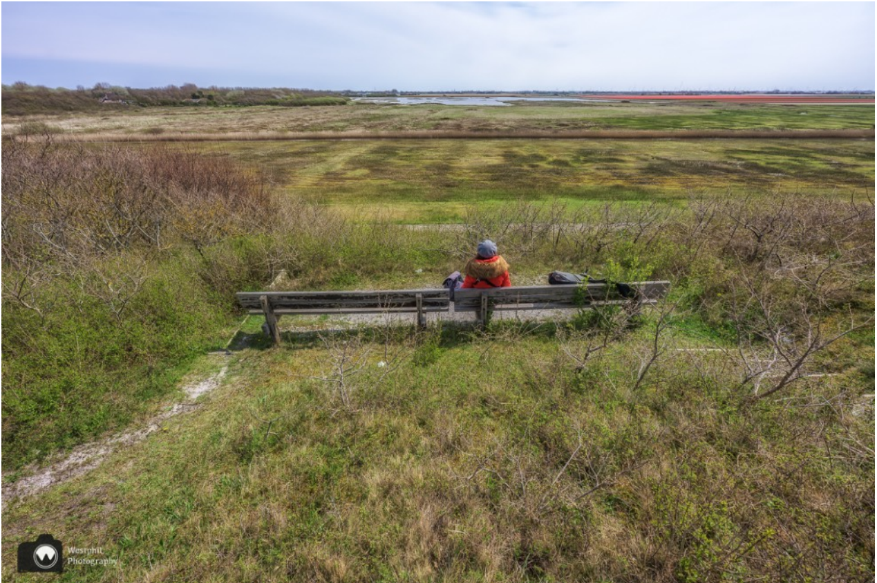
Wat een uitzicht!

Inmiddels is het tijd om te lunchen, we hadden natuurlijk kunnen lunchen bij steakhouse Duinoord, maar wij kiezen ervoor om in de buitenlucht te blijven en plaats te nemen op één van de banken met prachtig uitzicht. We zien ook nog een haas door de weilanden rennen. Wat een heerlijke plek is dit!