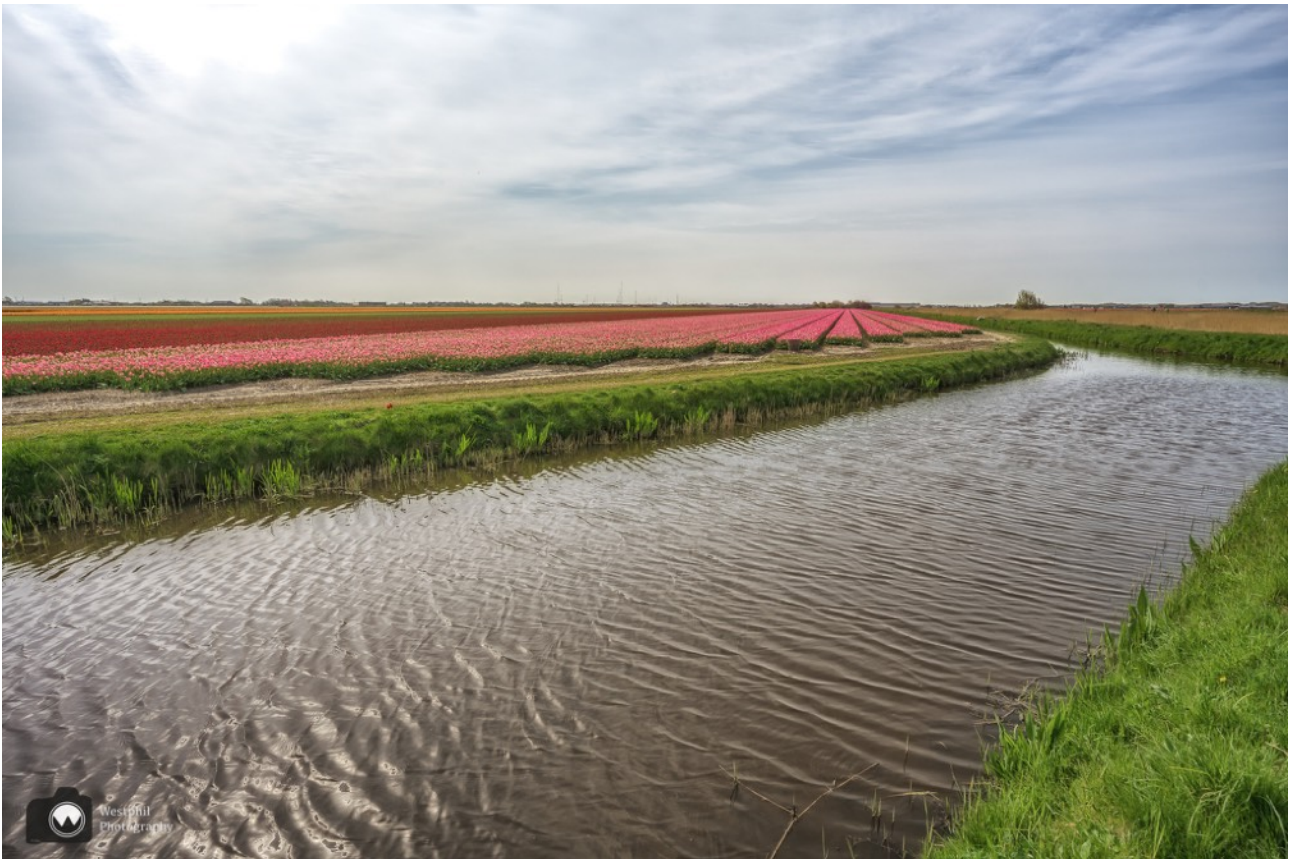
Nog eentje van de bollenvelden.

Eind 2005 is de Helderse natuur uitgebreid met ruim 50 hectare struinnatuur. Bollengrond is hier omgezet in lage duintjes, duingraslanden en waterpartijen. Door de afmetingen van het gebied was het één van de grootste natuurontwikkelingsprojecten in Nederland. We zien er Schotse Hooglanders staan, maar ze zijn te ver weg en keren de rug naar ons toe. Dan maar geen foto van de hooglanders.