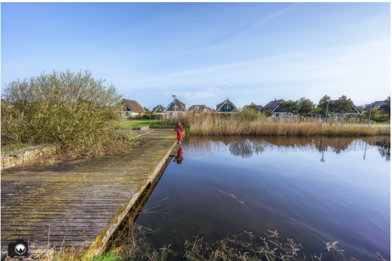
Het water is zo mooi als het niet waait

Vanaf de grote parkeerplaats wandelen we langs de vakantiebungalows richting de velden. Nadat we een paar stappen gelopen hebben komen we al langs spiegeland water, en dat is voor ons altijd een reden voor een fotomoment.