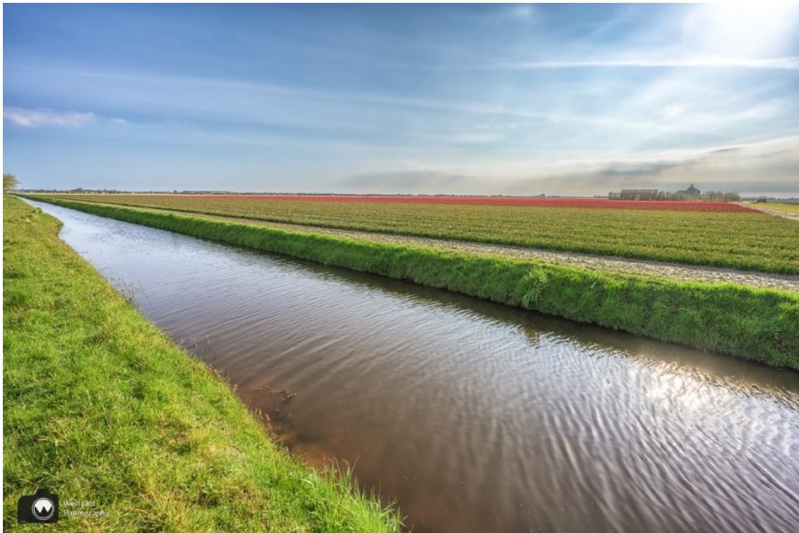
Het eerste veld is een hyacintenveld, deze waren toen al uitgebloeid.

We zien in het veld vogels scharrelen. Het blijken patrijzen te zijn, een vogelsoort die we niet vaak zien.