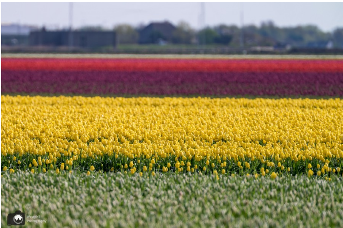
Echt genieten, al die velden.

Verderop passeren we het Raadhuis van Zaandijk. Wij zijn er getrouwd. Het raadhuis is prachtig van binnen en buiten. Het is jammer dat je niet zomaar naar binnen kunt lopen, maar zoek je een exclusieve locatie voor kleinschalige festiviteiten dan is dit het adres.