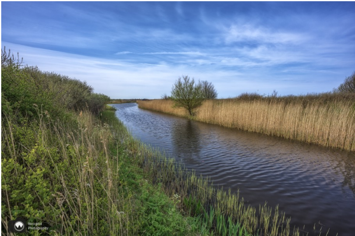
Een vogelrijk stukje riet.

Erg bontgekleurd is de braamsluiper niet, maar slechts weinig vogelsoorten hebben zo'n witte keel. Dat maakt dat, samen met zijn uitbundige zang, de braamsluiper niet zo moeilijk te herkennen is.