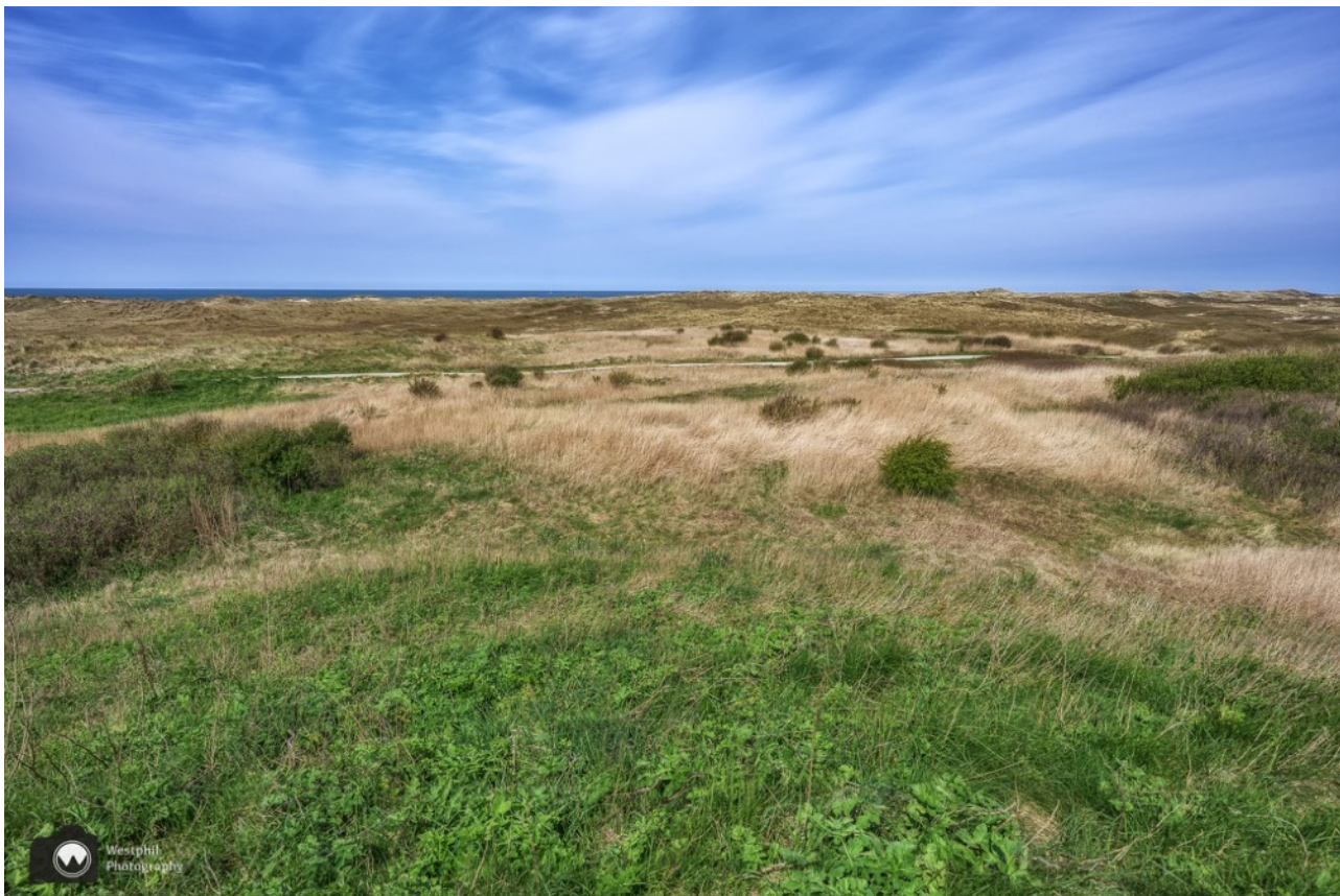
Geen haas, maar wel weer een tulpenveld in de verte.

Het is voor een ommetje best een lange route, maar echt de moeite waard. Als we langs een uitkijktorentje wandelen willen we deze eerst overslaan want we hebben al zoveel gezien en zijn een beetje moe. Toch beklimmen we ook deze toren en genieten van het uitzicht op de polder met alweer tulpenvelden en aan de andere kant ontdekken we de zee.