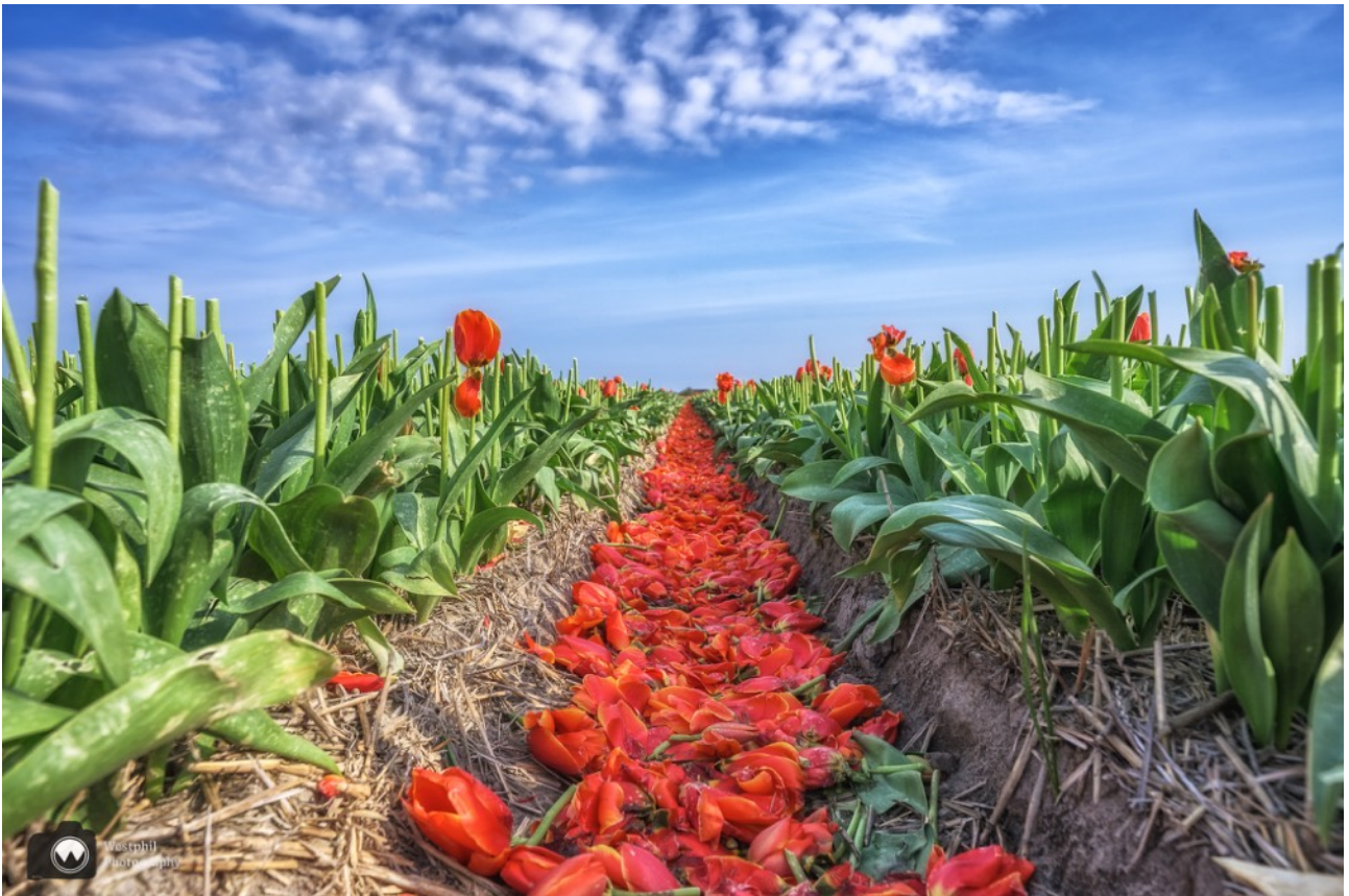
Deze waren al gekopt op 27 april 2023.

We gaan zo op in het fotograferen van de bloemen, dat we pas op het laatste moment door hebben dat er een auto aan komt rijden. Een mevrouw stopt en vertelt ons dat het belangrijk is om op afstand te blijven om vernieling tegen te gaan. Ik heb haar uitgelegd dat wij respectvol met haar bollen omgaan. Na wat foto's te hebben geschoten vervolgen wij onze wandeling.