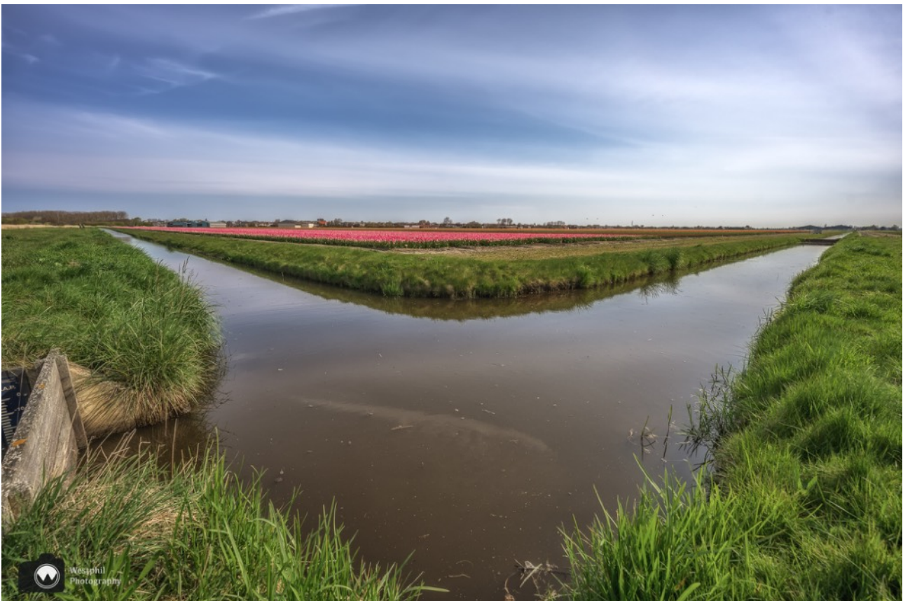
Zo mooi deze bocht in de sloot met op de achtergrond de tulpen.