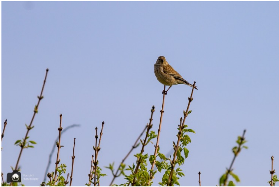
Een kneu (vrouwje), of terwijl een common linnet.

Kneuen zijn vaak te zien in groepjes, waarbij de vogels erop los kwetteren. Een mannetjes kneu heeft een fraaie karmijnrode borst en 'baret'. Vrouwjes en jonge kneuen hebben een zwak gestreepte borst en kruin en hebben geen rood in het verenkleed. De kneu broedt in lage struiken nabij kruidenrijke vegetaties.