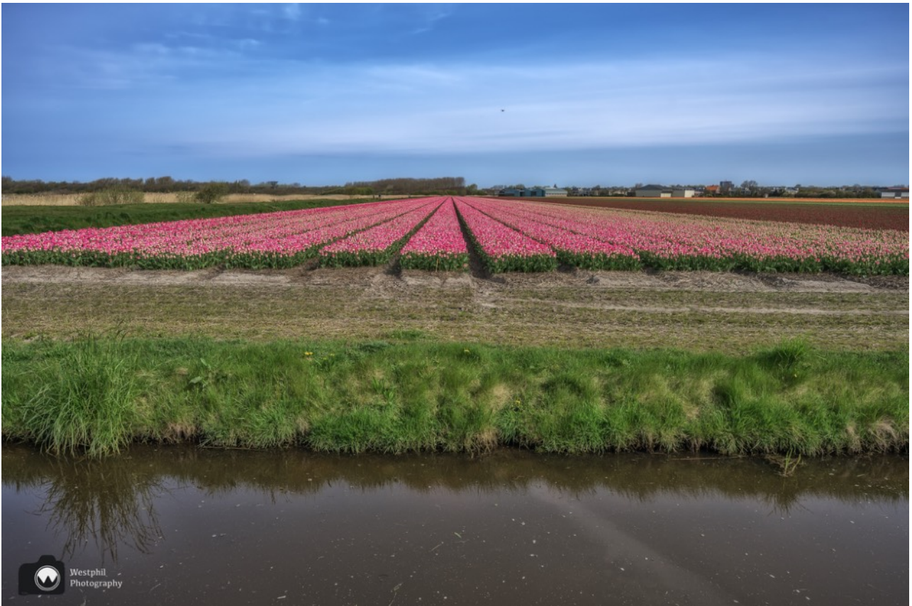
Eindelijk roze tulpen.