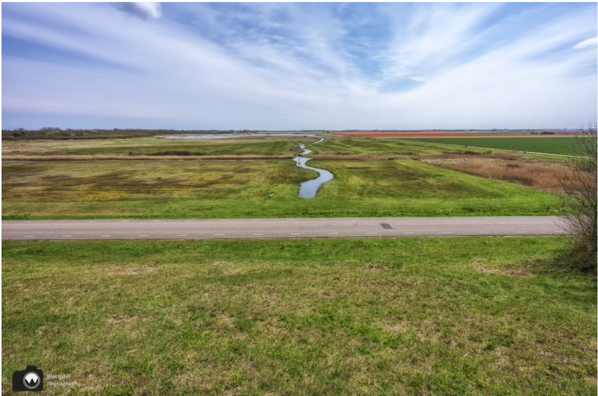
Geen haas, maar wel weer een tulpenveld in de verte.

We wandelen verder, af en toe zijn er doorkijkjes naar de overkant van de weg. We kijken we of we nog een haas kunnen vinden.