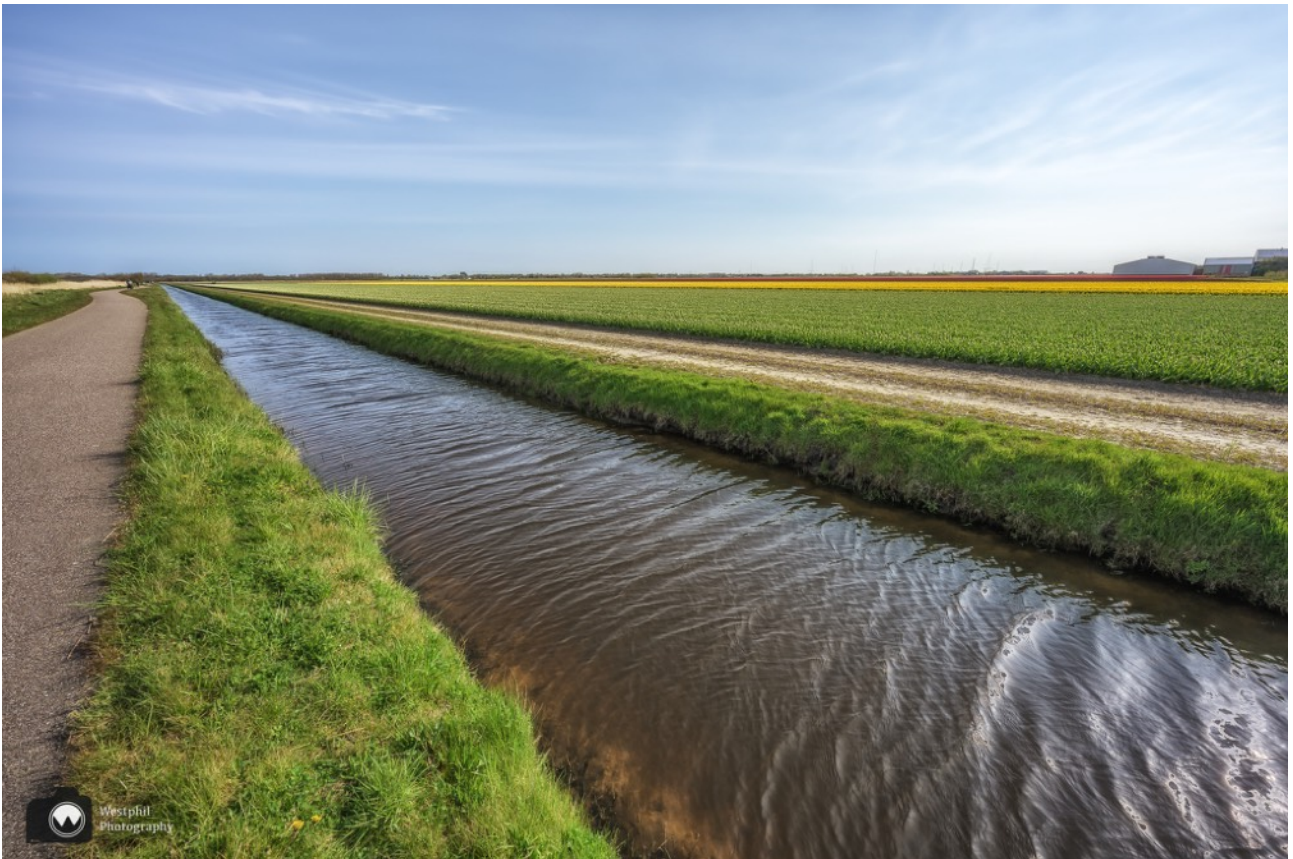
Het is lekker rustig op het fietspad.

Verderop passeren we het Raadhuis van Zaandijk. Wij zijn er getrouwd. Het raadhuis is prachtig van binnen en buiten. Het is jammer dat je niet zomaar naar binnen kunt lopen, maar zoek je een exclusieve locatie voor kleinschalige festiviteiten dan is dit het adres.