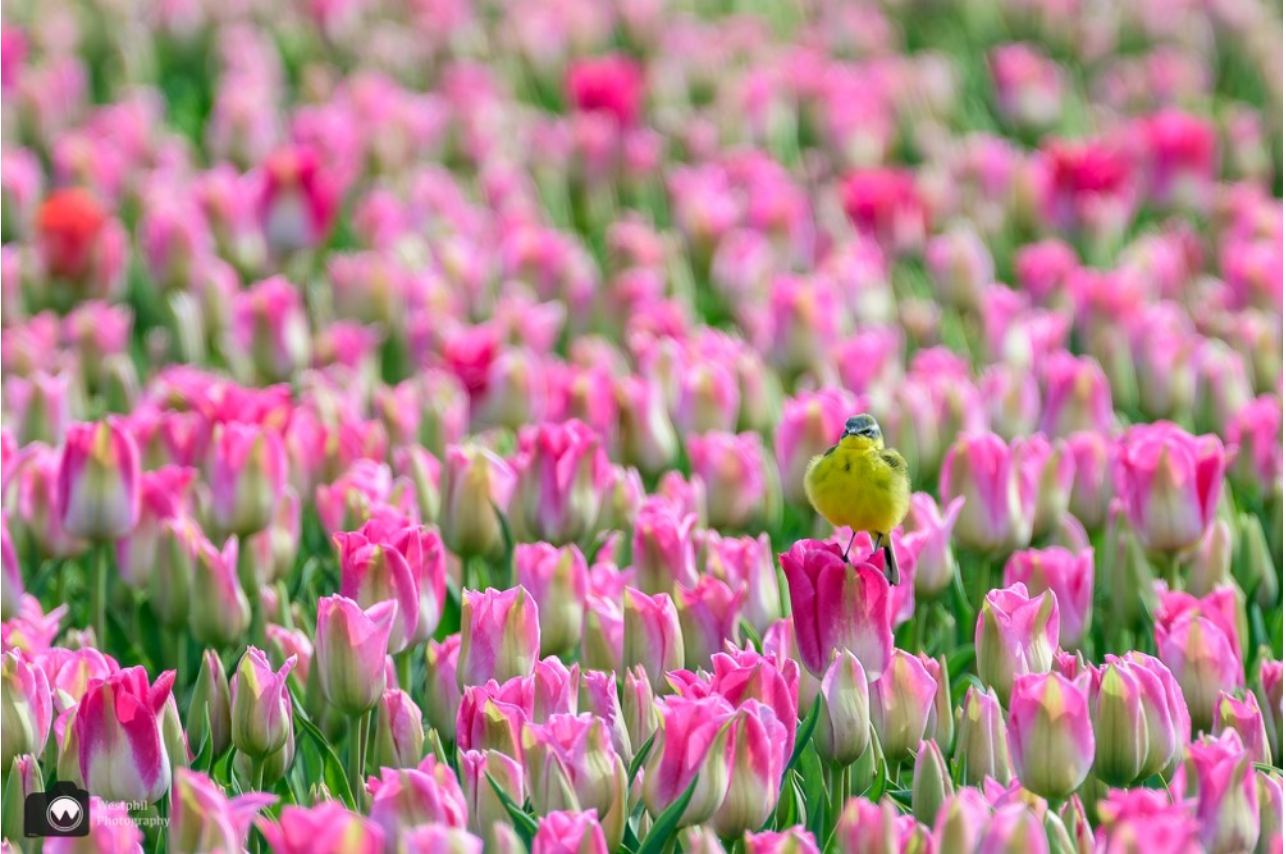
Een gele kwikstaart op een tulp, daar worden wij gelukkig van.

We blijven we even staan, want we zien kleine vogels heen en weer vliegen tussen de bloemen. We kunnen ons geluk niet op, want het zijn gele kwikstaarten. Een mannetje en een vrouwtje, die van bloem naar bloem vliegen en geen moment stil zitten. Dankzij het engelengeduld van Adriaan lukt het toch om een foto te maken.